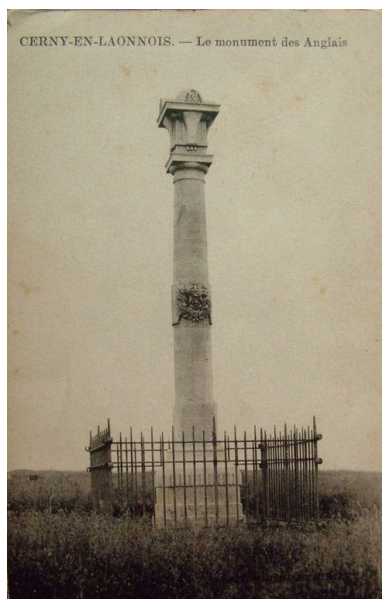
Vue de l'édifice au moment de son érection (coll. part). IVR22_20050200429NUCAB