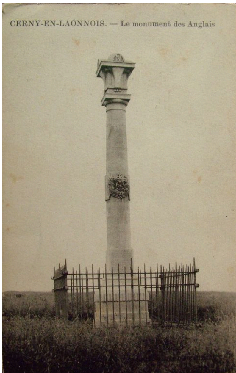
Vue de l'édifice au moment de son érection (coll. part).