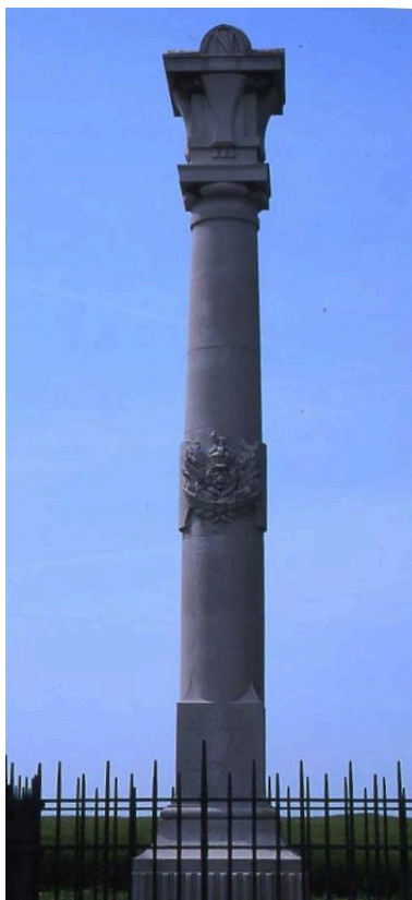
Vue générale. IVR22_20030203207NUCA