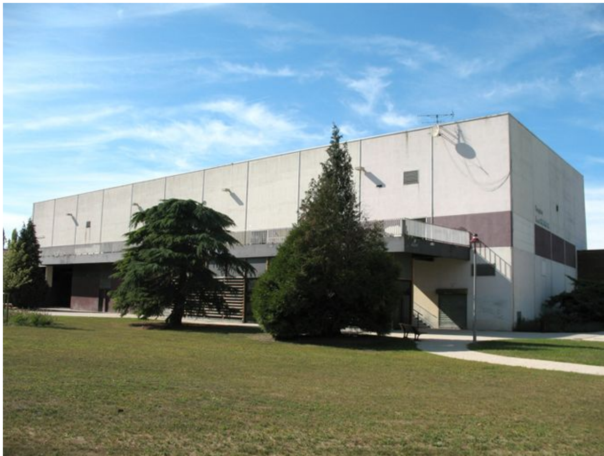
Façade ouest du gymnase.