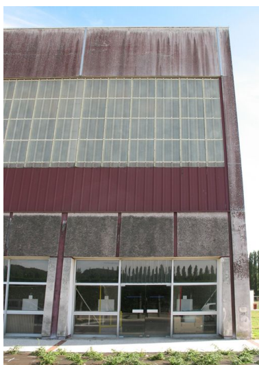
Détail d'une travée de la façade nord.

Phot. Thierry Lefébure IVR22_20106000426VA