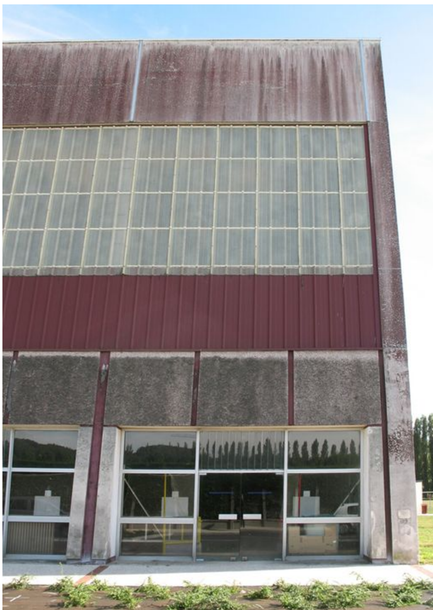
Détail d'une travée de la façade nord.