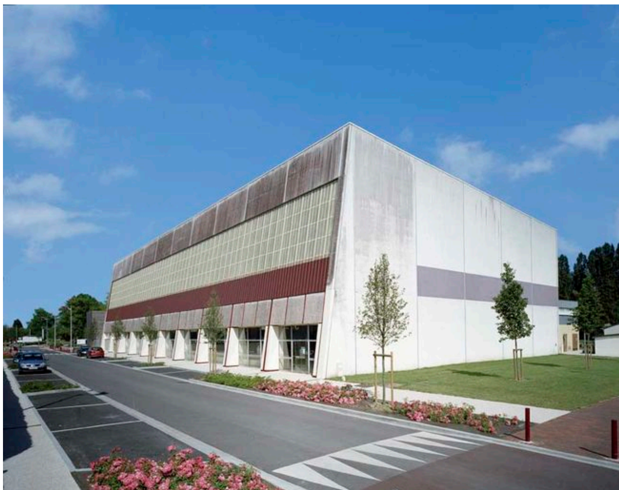
Façade nord du complexe sportif.