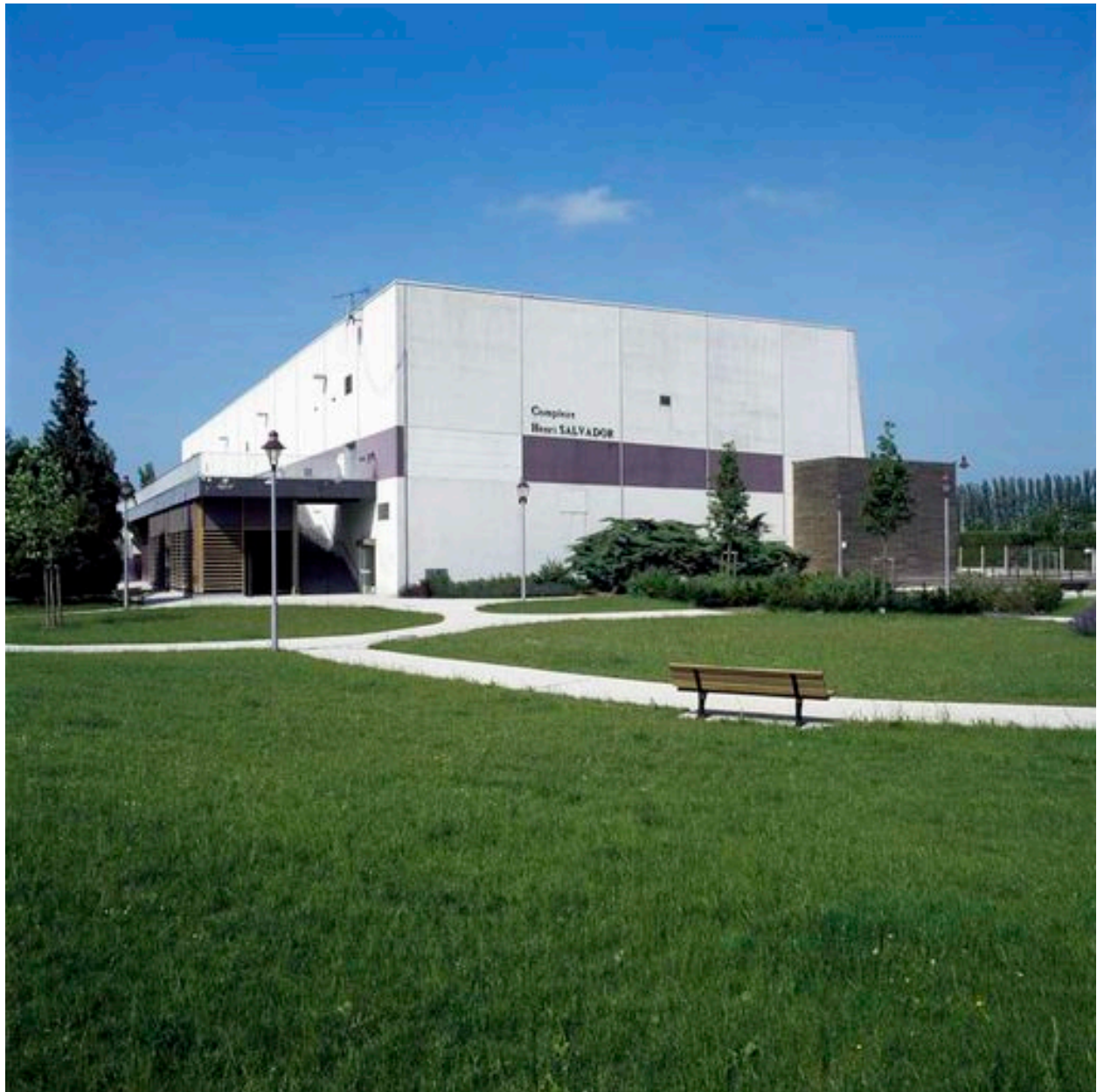
Façades sud-est du complexe sportif.