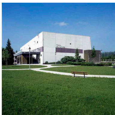
Façades sud-est du complexe sportif.

IVR22_20106000426VA