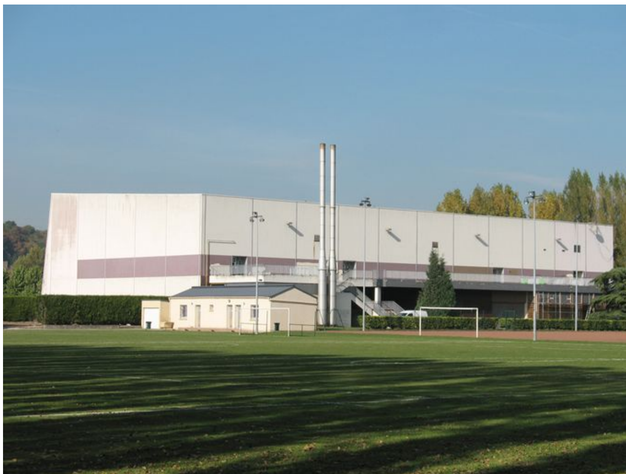
Volumes du complexe sportif.