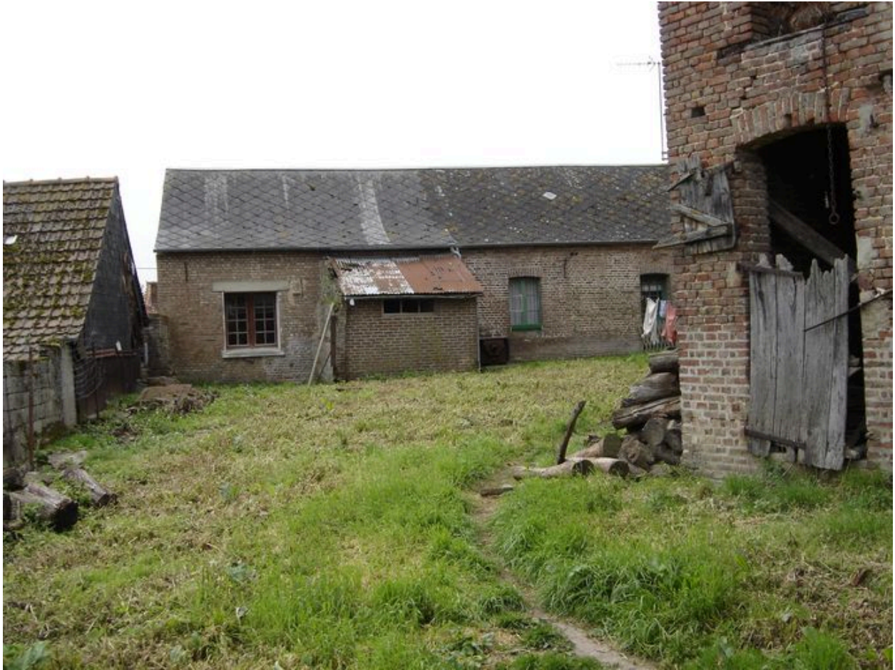
Vue postérieure du logis.