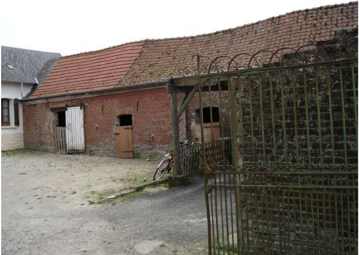
Vue des étables à cochons situées à l'ouest.