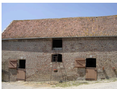
Vue de face des étables depuis la cour.