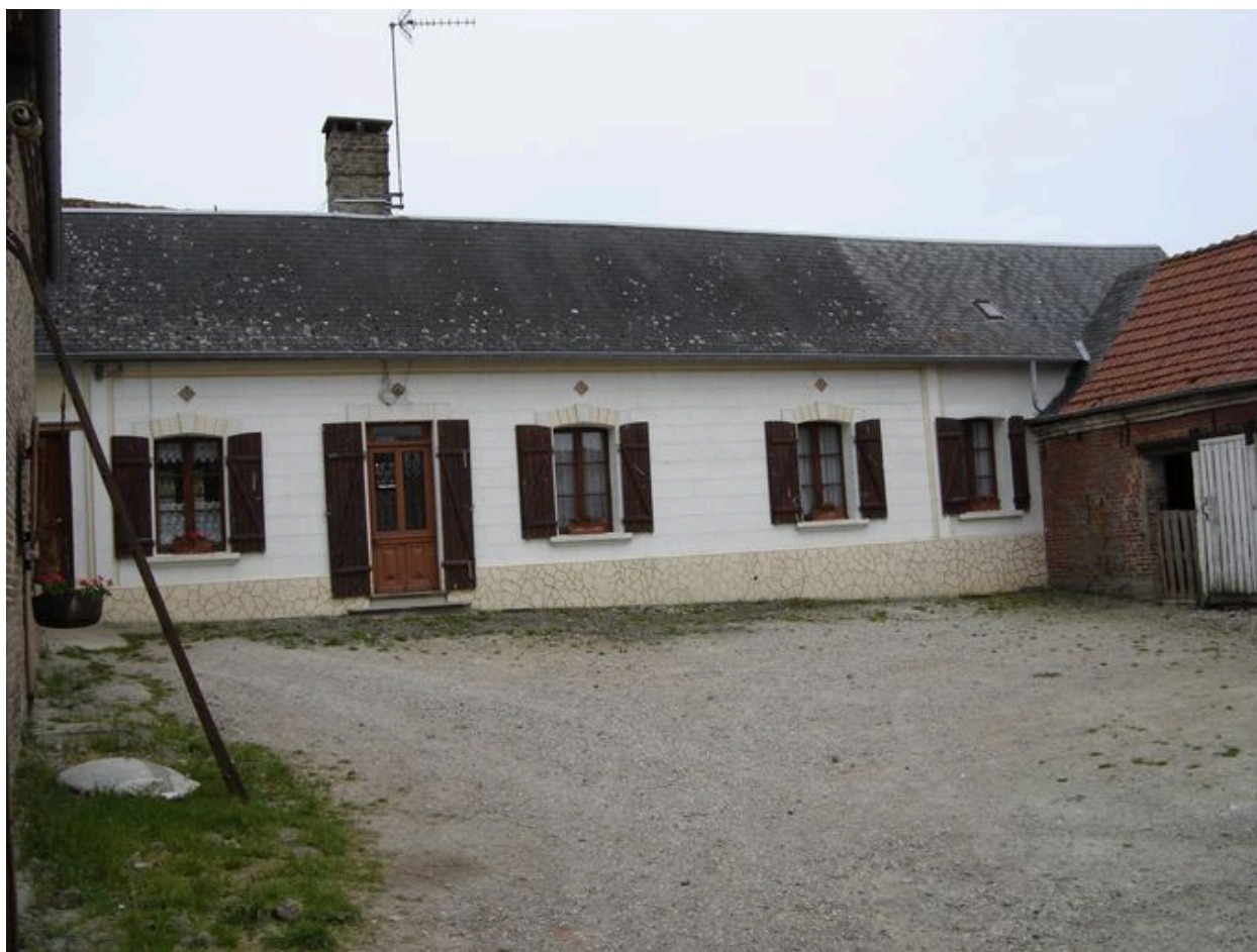
Vue du logis depuis la cour.