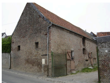
Vue des étables situées à l'est depuis la rue. IVR22_20058005832NUCA