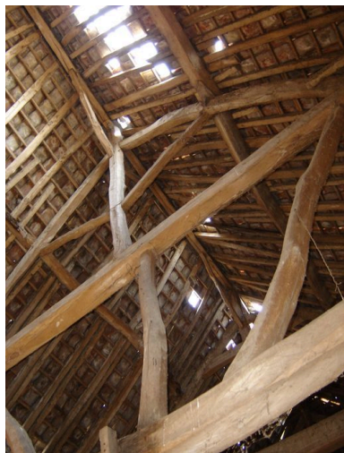
Vue détaillée d'une ferme de charpente d'une des deux granges. IVR22_20058005840NUCA