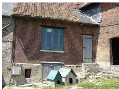
Vue extérieure de la cave située sous le second logement.