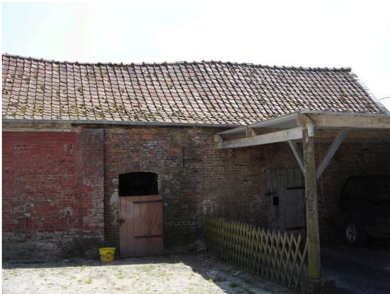
Vue de l'extrémité nord des étables à cochons.