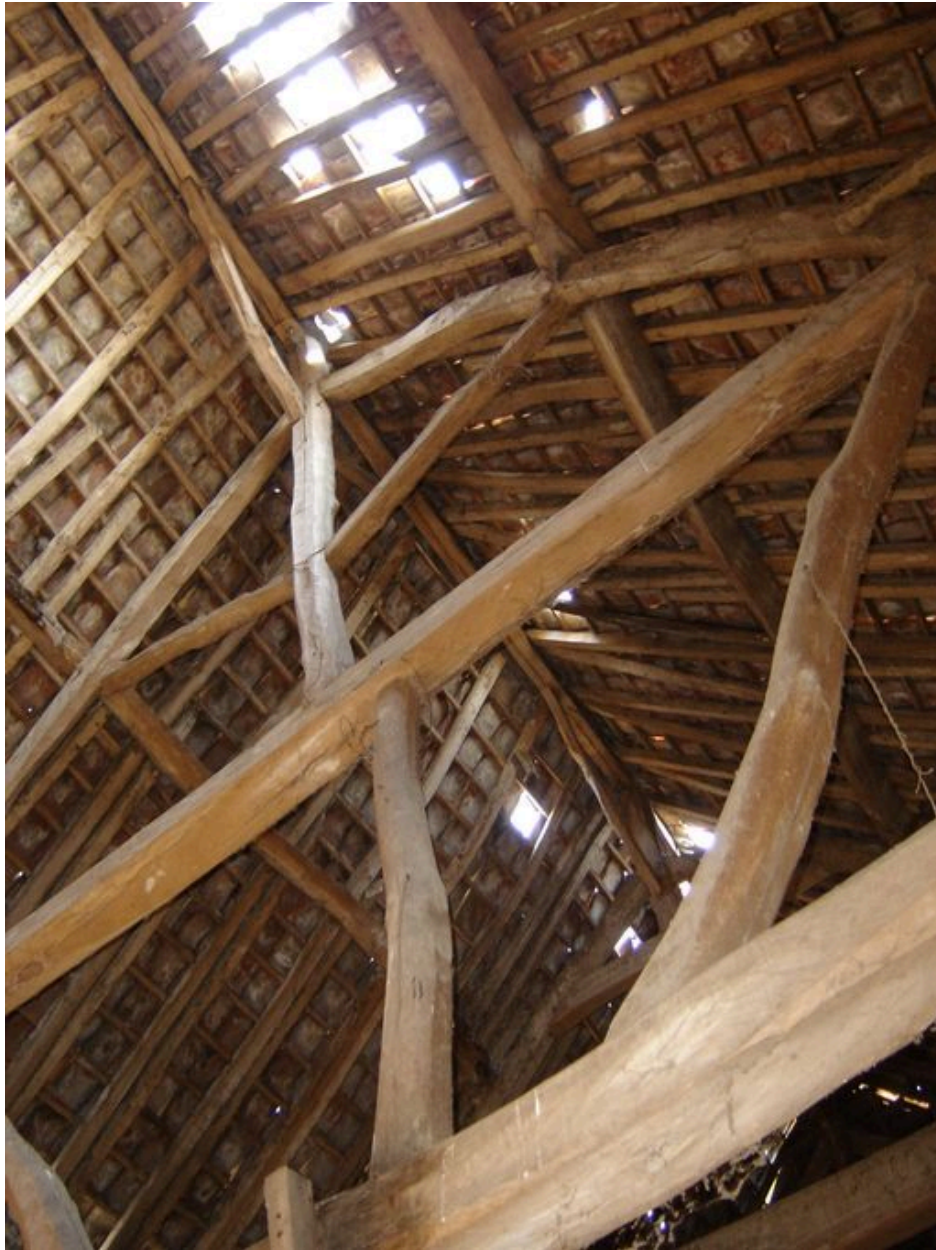
Vue détaillée d'une ferme de charpente d'une des deux granges.