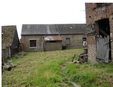
Vue postérieure du logis.