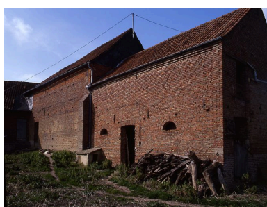
Vue des granges situées au sud de la propriété depuis la cour. IVR22_20078000030XA