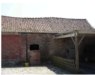
Vue de l'extrémité nord des étables à cochons. IVR22_20058005835NUCA