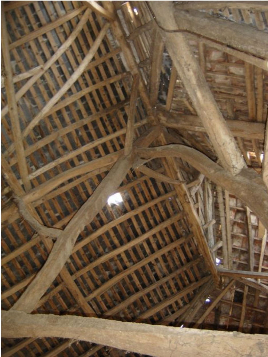
Autre vue détaillée de ferme.