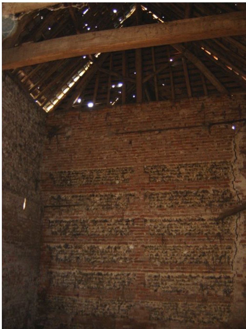
Mur pignon intérieur d'une des deux granges.