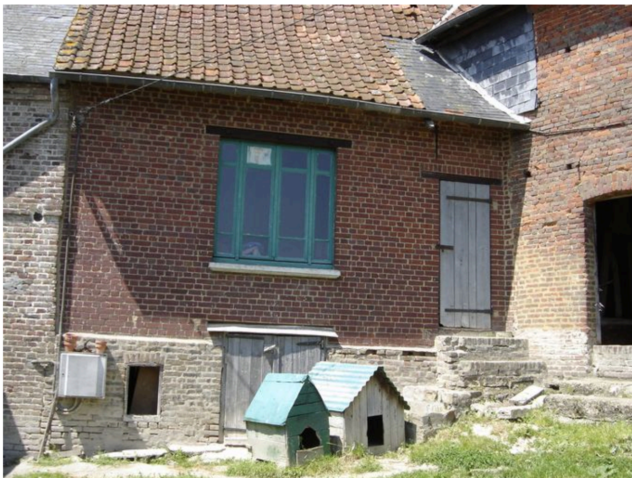
Vue extérieure de la cave située sous le second logement.