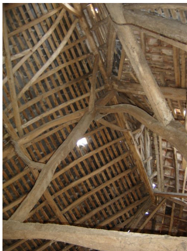
Autre vue détaillée de ferme.