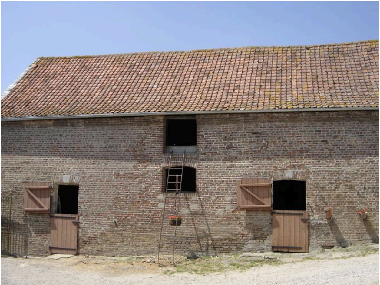
Vue de face des étables depuis la cour.