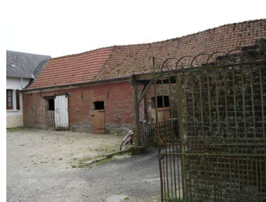
Vue des étables à cochons situées à l'ouest. IVR22_20058005834NUCA