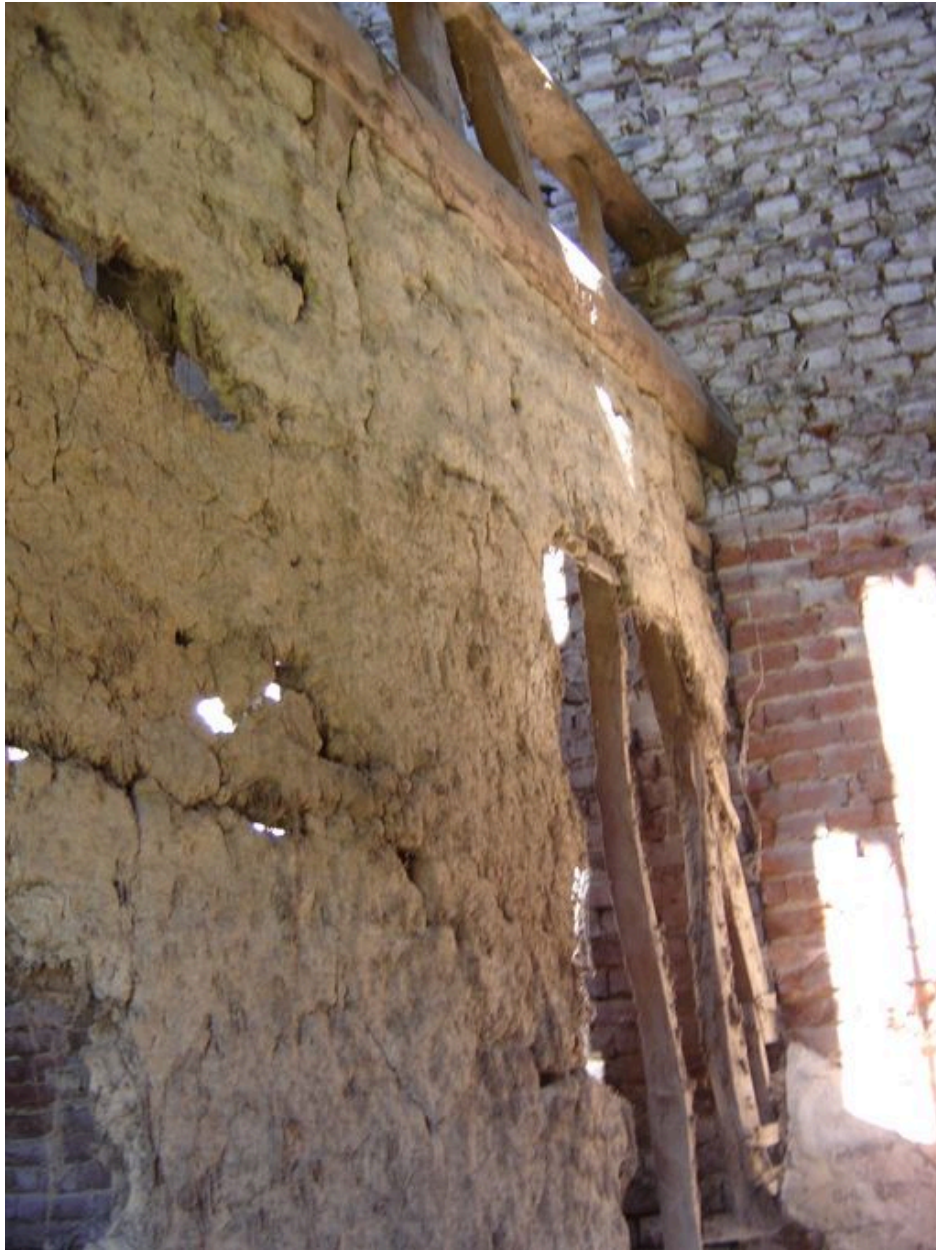
Vue de la cloison en torchis et pans de bois séparant les deux granges.