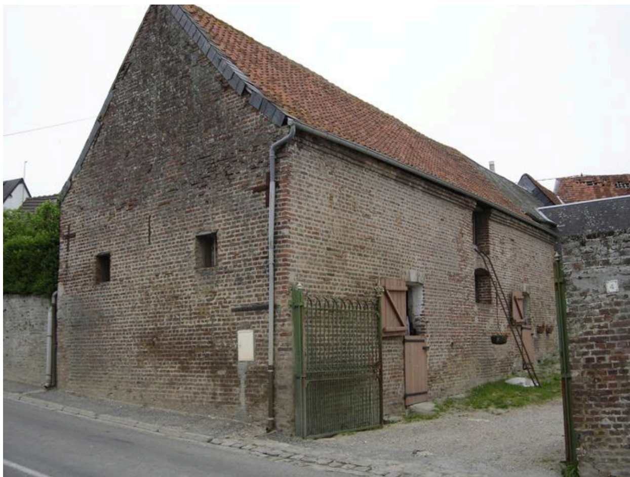
Vue des étables situées à l'est depuis la rue.