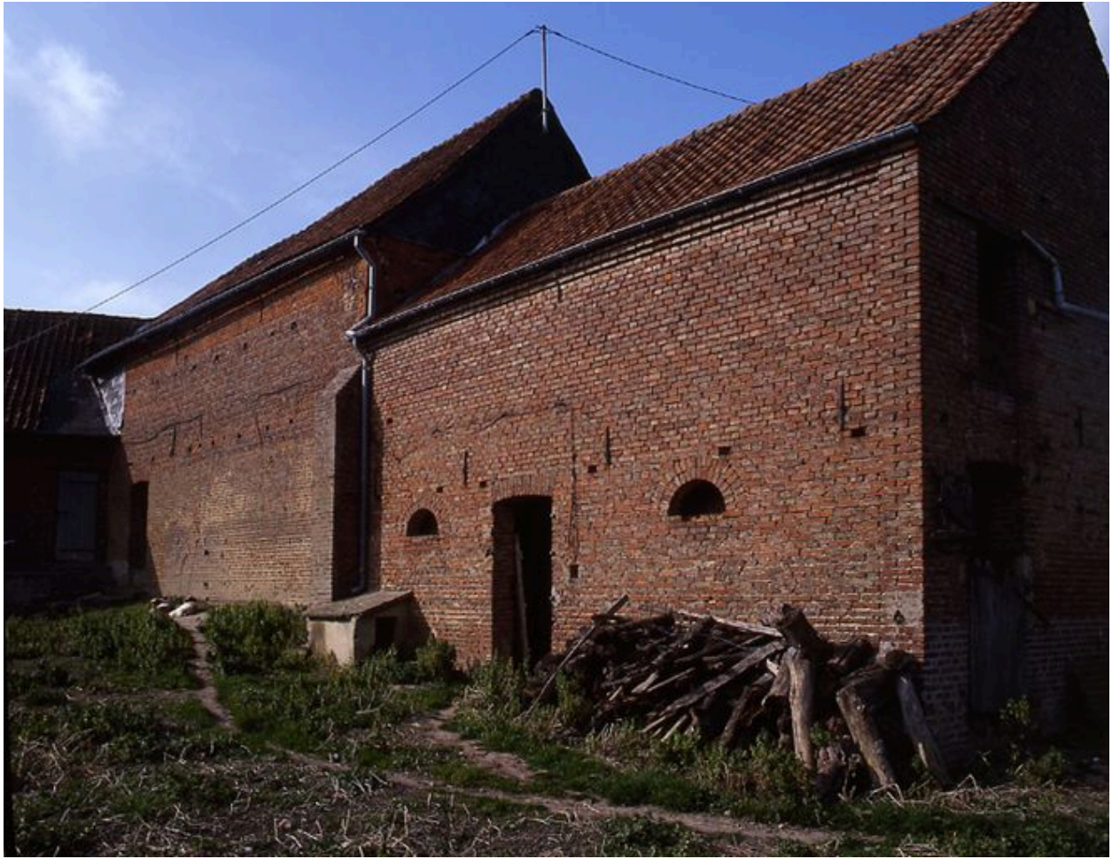
Vue des granges situées au sud de la propriété depuis la cour.