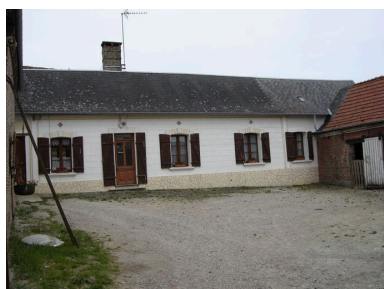
Vue du logis depuis la cour.