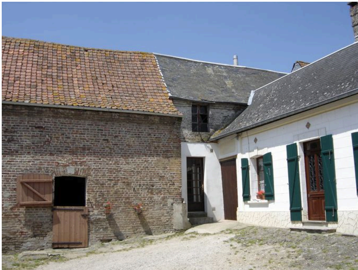
Vue de l'ancien emplacement de l'écurie.