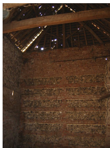
Mur pignon intérieur d'une des deux granges.