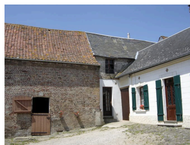
Vue de l'ancien emplacement de l'écurie. IVR22_20058005831NUCA