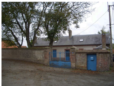
Vue générale. IVR22_20068005546NUCA