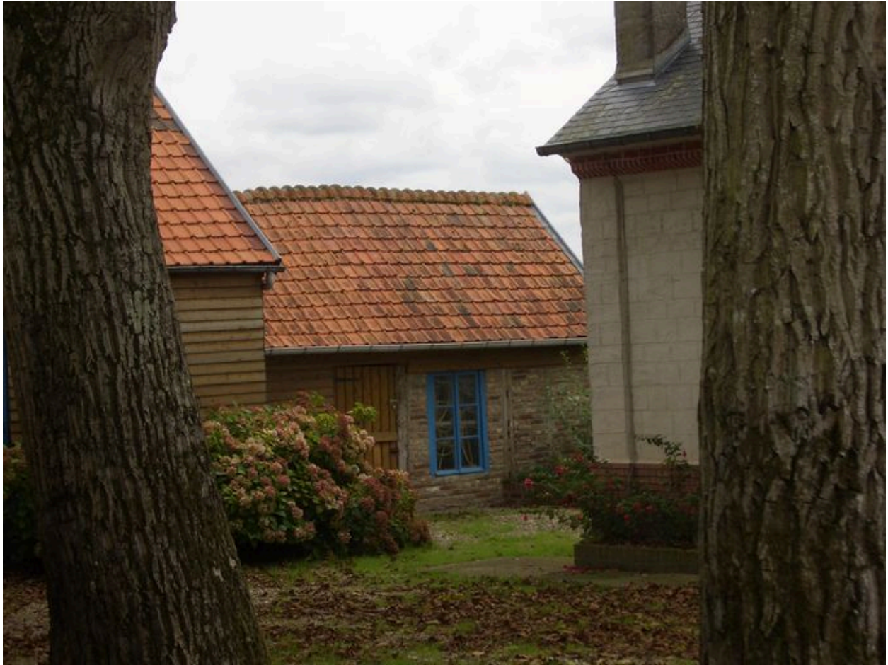
Vue d'une des dépendances à l'est du jardin.