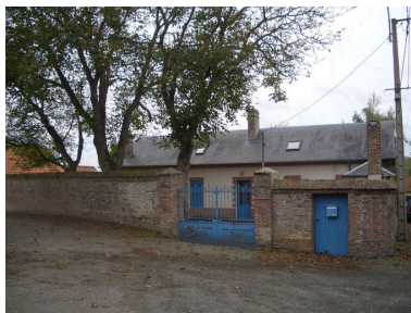
Vue générale. IVR22_20068005546NUCA