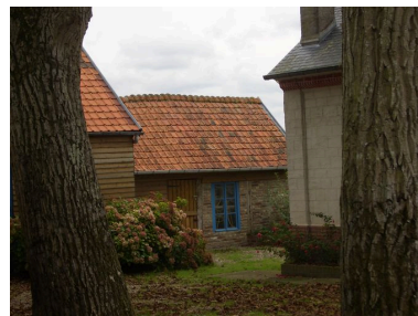
Vue d'une des dépendances à l'est du jardin.