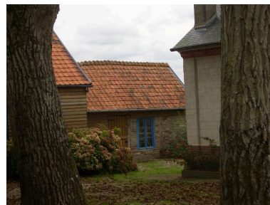
Vue d'une des dépendances à l'est du jardin.