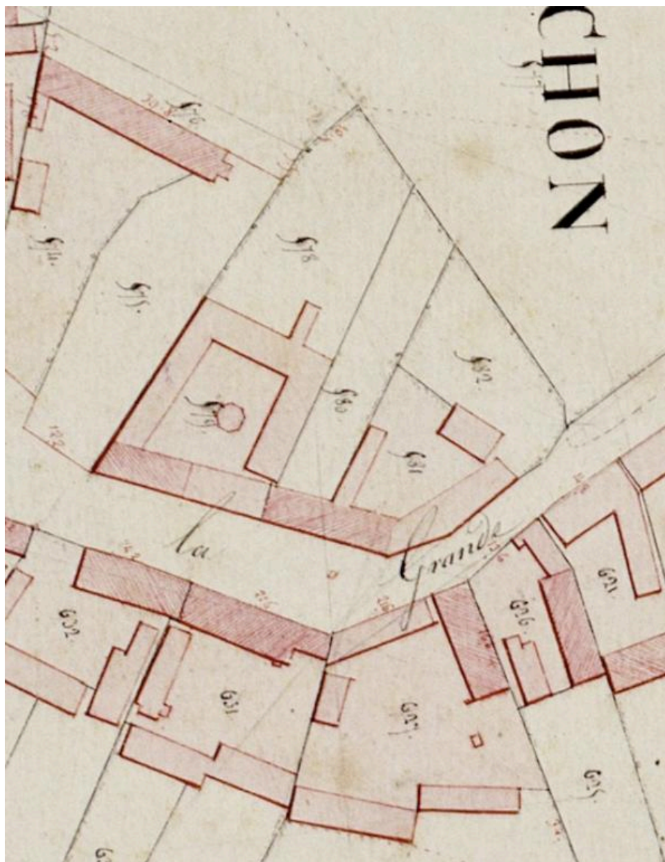
Détail du plan cadastral, section B2 développement, par Sannier Jeune et Honoré géomètres, 1834 (AD Somme ; 3P 1564/4).