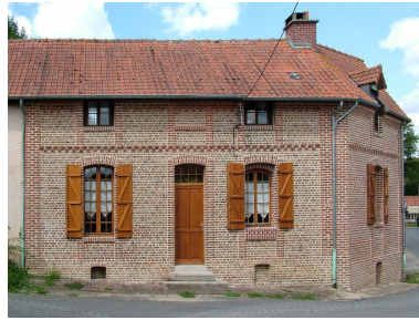
Ancien cabaret ou débit de boissons, 1 Grande-rue. IVR22_20098005251NUCA