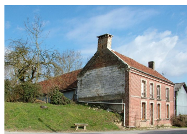
Vue générale depuis la rue. IVR22_20108001085NUCA