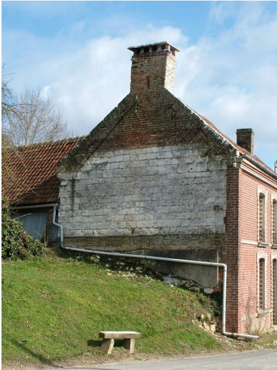
Vue du pignon extérieur du logis.