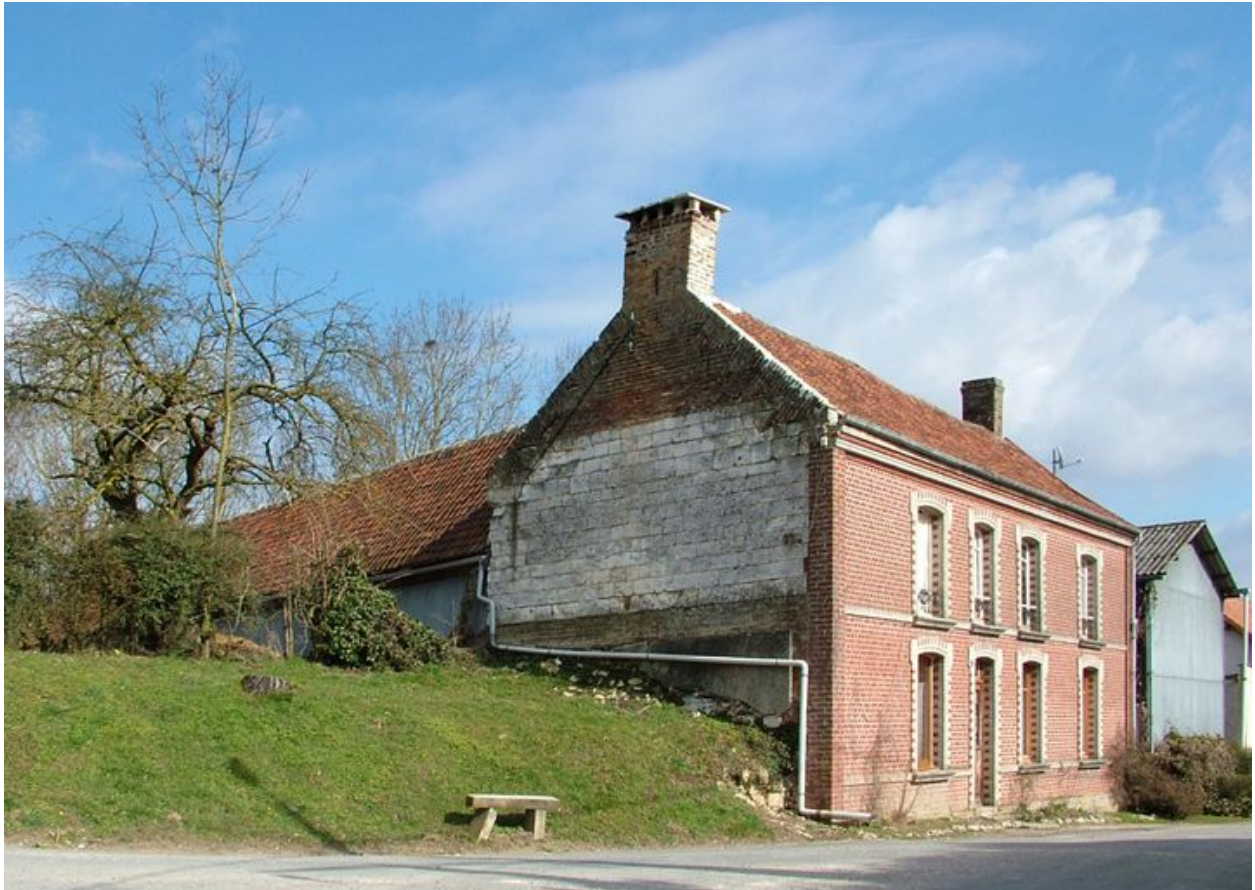
Vue générale depuis la rue.