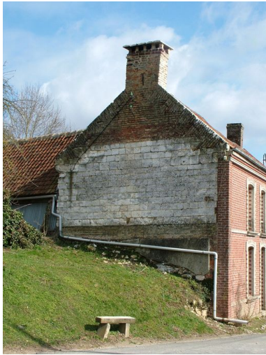
Vue du pignon extérieur du logis.