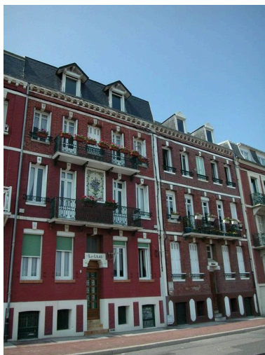
Les Lilas et Tatiana, vue d'ensemble.