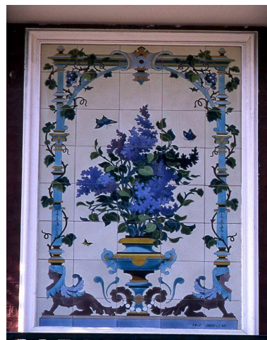
Détail du panneau de céramique de la maison Les Lilas. IVR22_20058001766XA