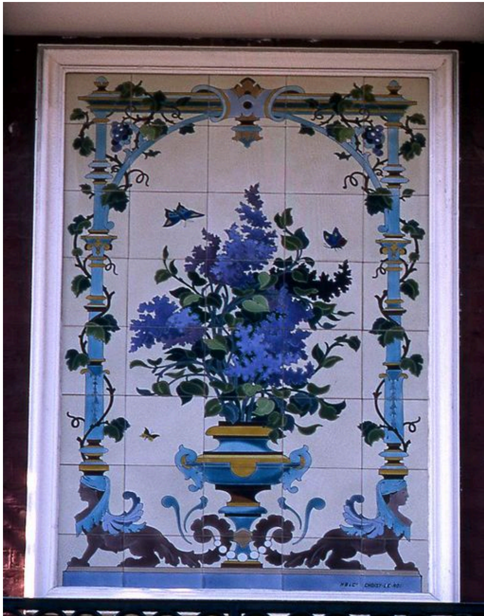
Détail du panneau de céramique de la maison Les Lilas.