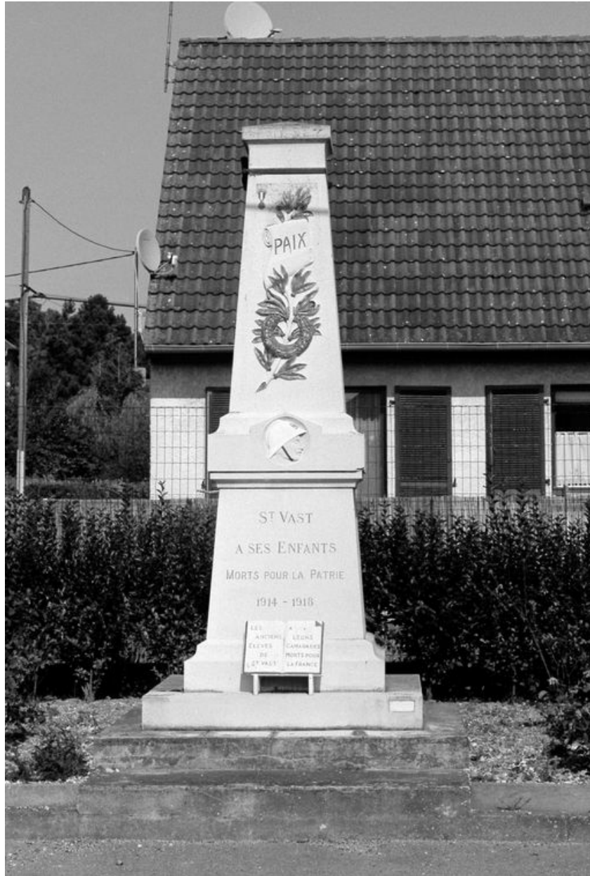
Monument aux morts de Saint-Vaast-en-Chaussée.