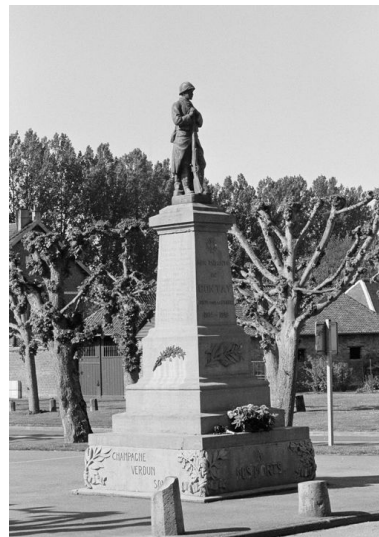
Monument aux morts de Contay.