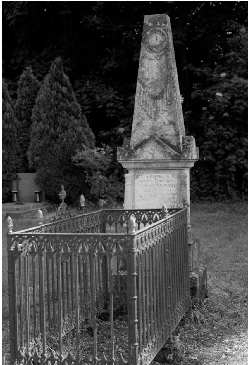
Monument aux morts de la guerre de 1870 (à la mémoire des combattants de la Bataille de l'Hallue) et de la guerre de 1914-1918, à Montigny-sur-l'Hallue.