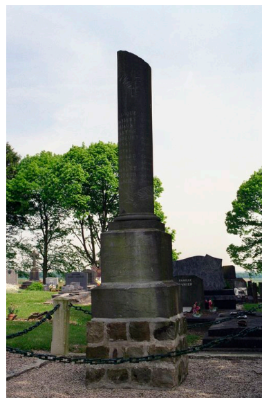
Monument aux morts de Pierregot. IVR22_20018000120ZE