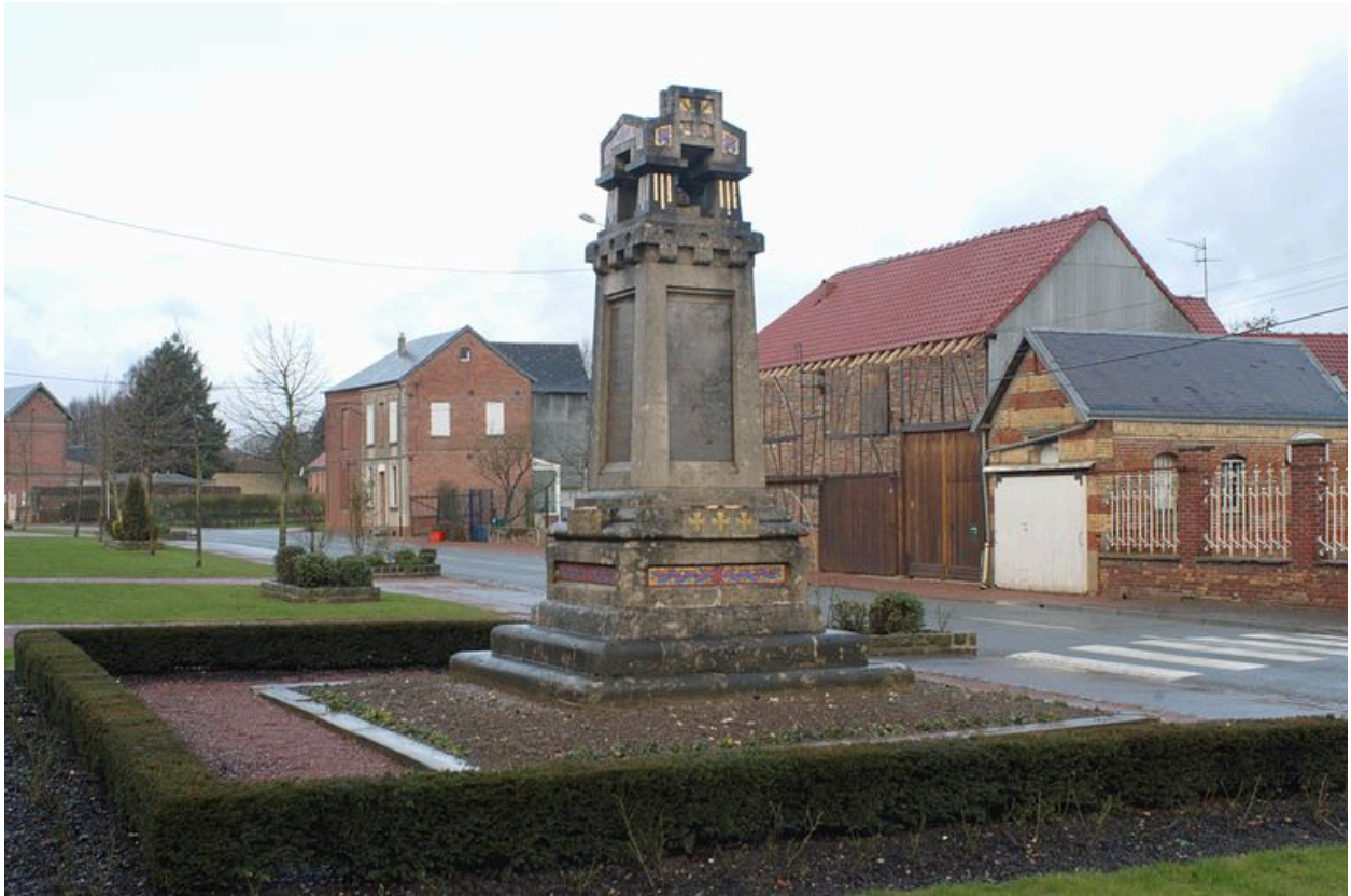
Monument aux morts de Rubempré.