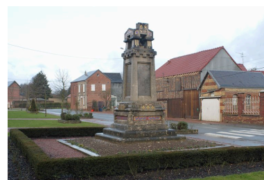
Monument aux morts de Rubempré.