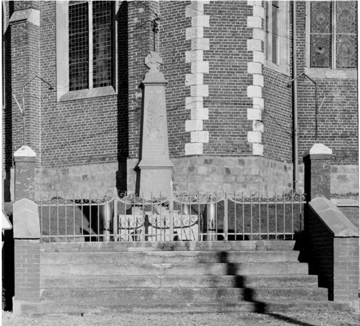
Monument aux morts de Coisy.