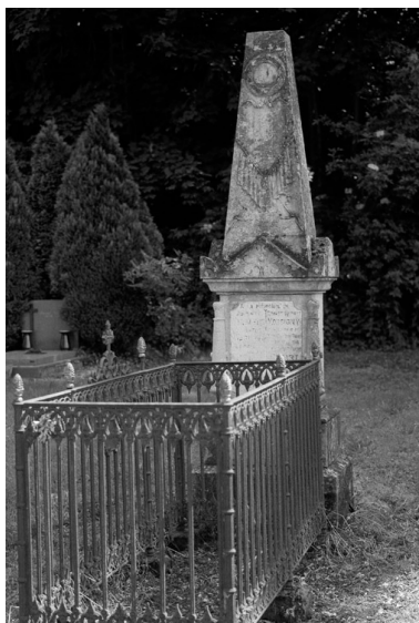
Monument aux morts de la guerre de 1870 (à la mémoire des combattants de la Bataille de l'Hallue) et de la guerre de 1914-1918, à Montigny-sur-l'Hallue. IVR22_19998001702Z