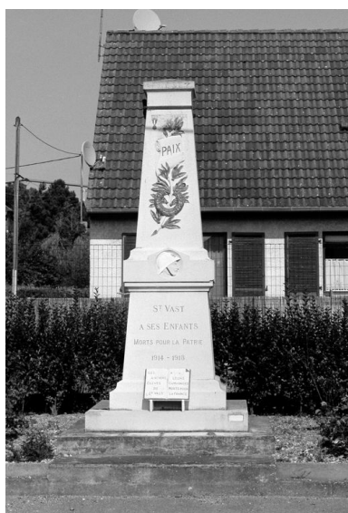
Monument aux morts de Saint-Vaast-en-Chaussée. IVR22_19988000937Z