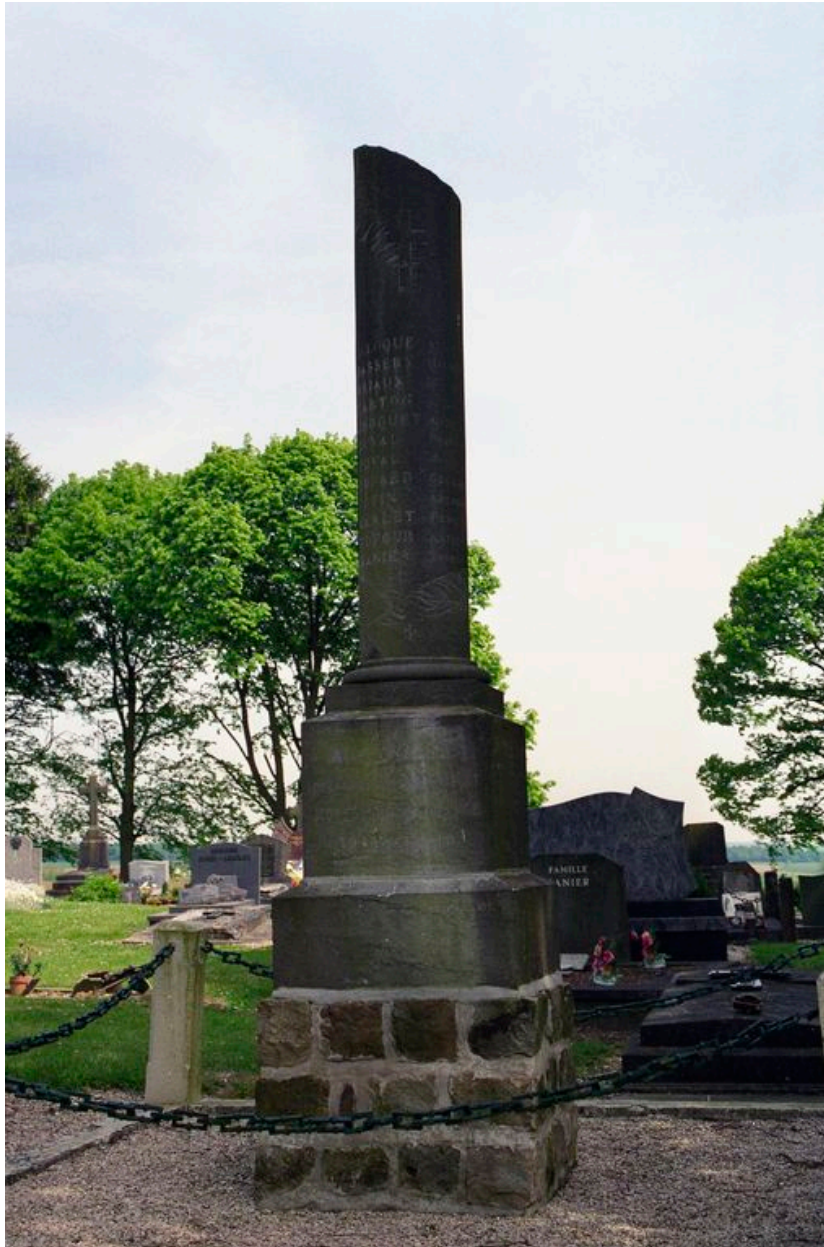
Monument aux morts de Pierregot.