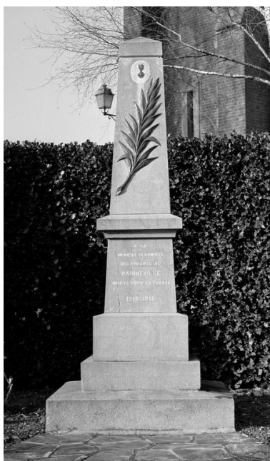
Monument aux morts de Rainneville. IVR22_19998000222Z