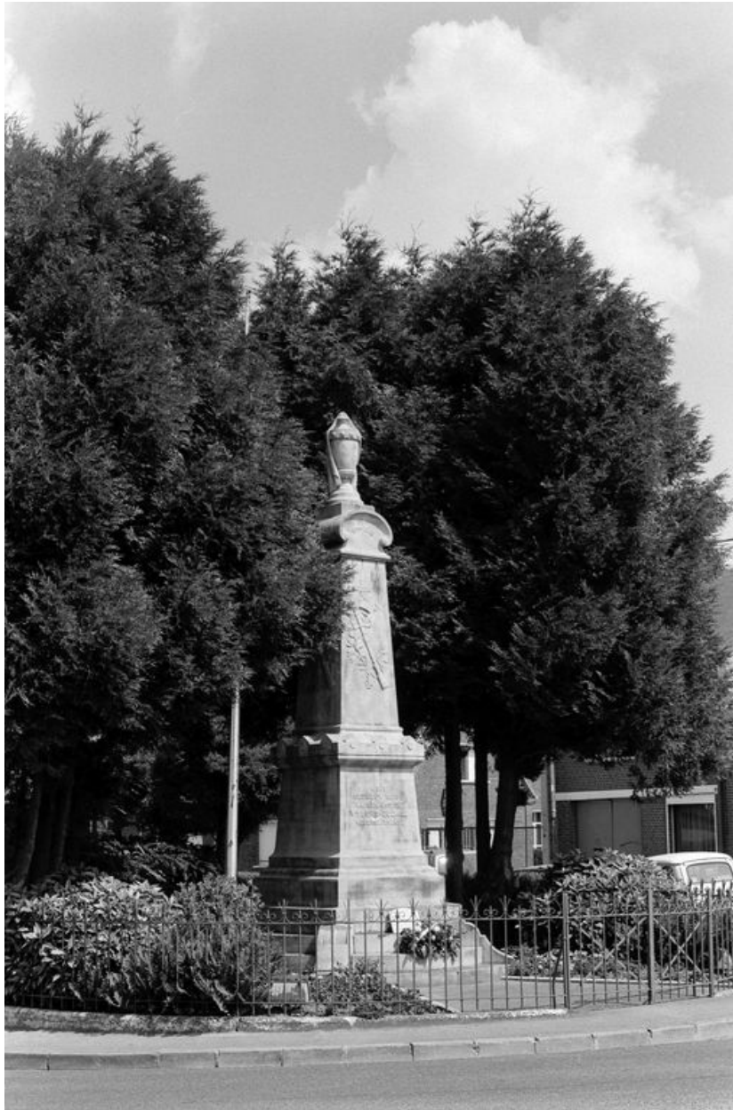
Monument aux morts de Villers-Bocage.