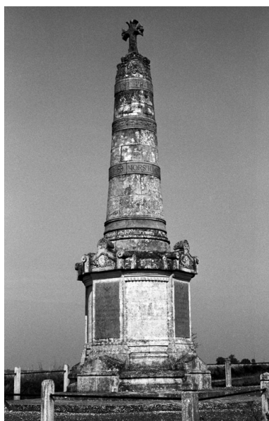
Monument aux morts de la guerre de 1870-1871 dit Colonne Faidherbe, à Pont-Noyelles.