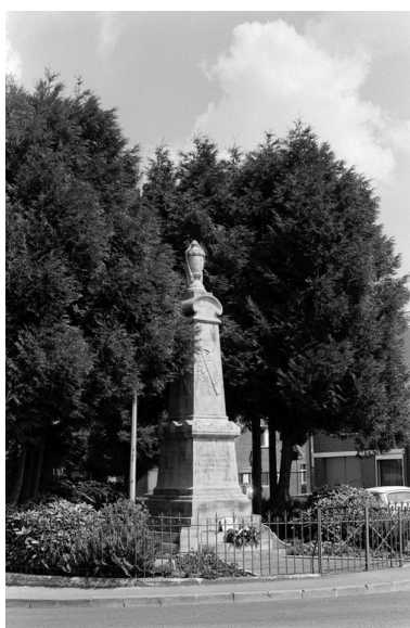
Monument aux morts de Villers-Bocage.