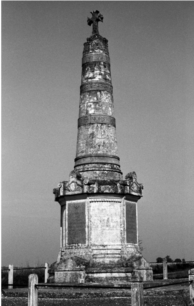
Monument aux morts de la guerre de 1870-1871 dit Colonne Faidherbe, à Pont-Noyelles.