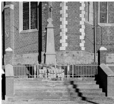
Monument aux morts de Coisy. IVR22_19978000910Z