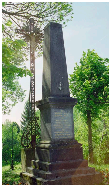
Monument aux morts de Moliens-au-Bois.