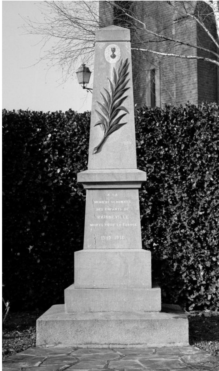
Monument aux morts de Rainneville.