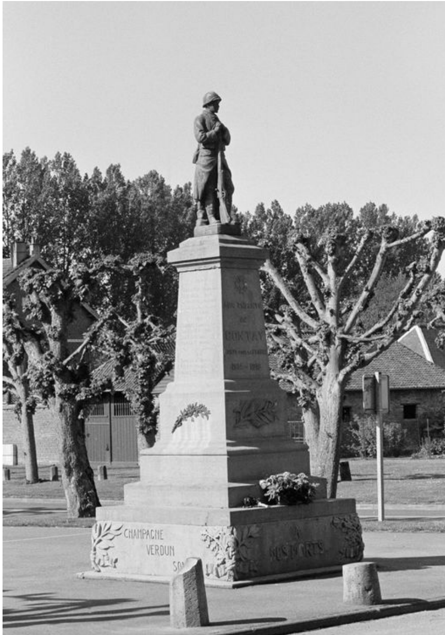
Monument aux morts de Contay.