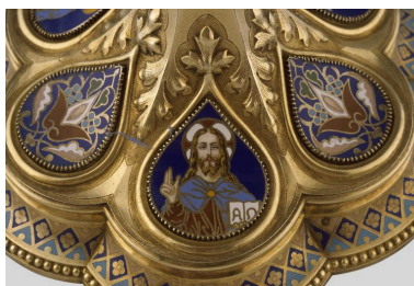
Détail du pied : médaillon émaillé orné d'une représentation du Christ.

IVR22_20010202258ZA