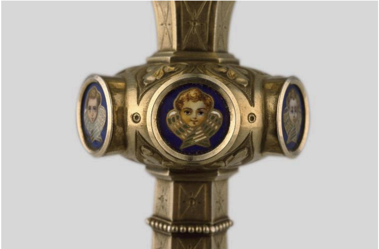
Vue du nœud, orné de chérubins en émail.