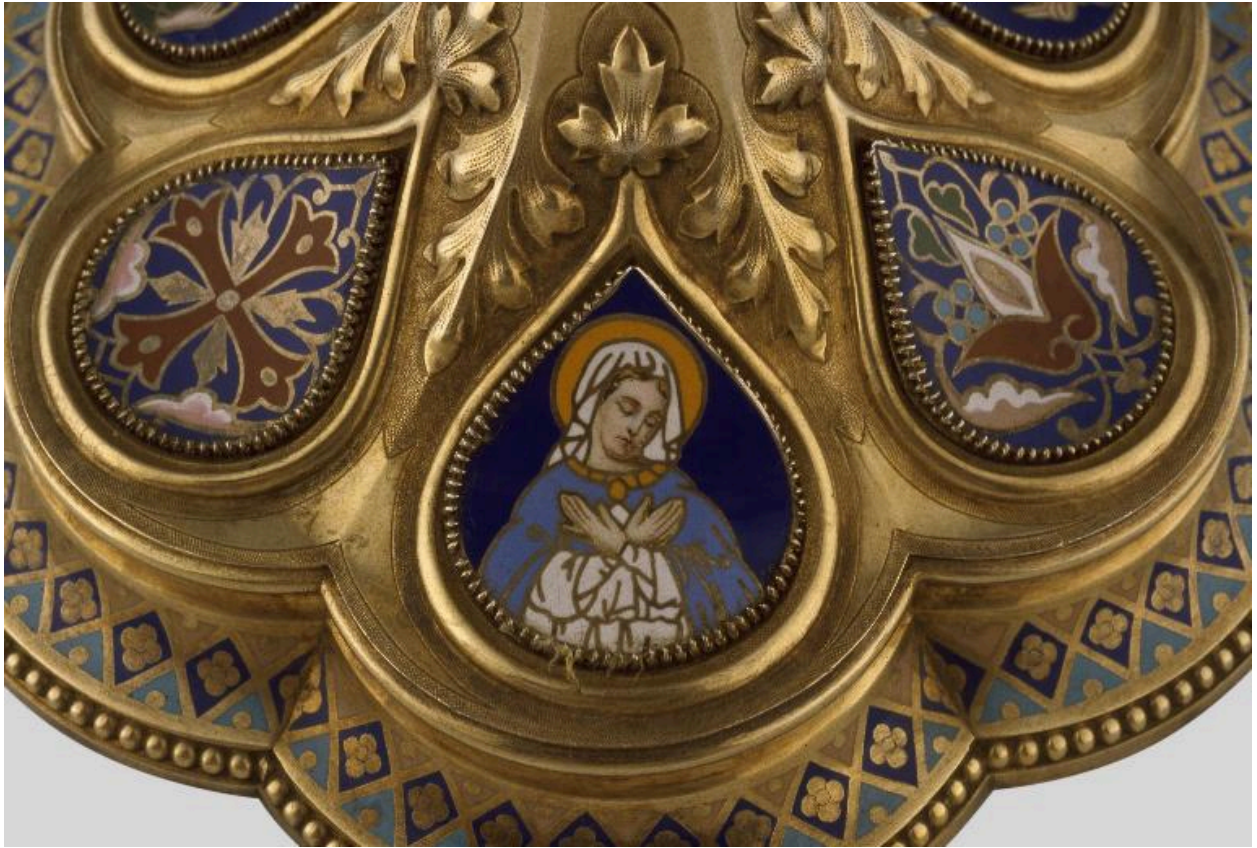
Détail du pied : médaillon émaillé orné d'une représentation de la Vierge.