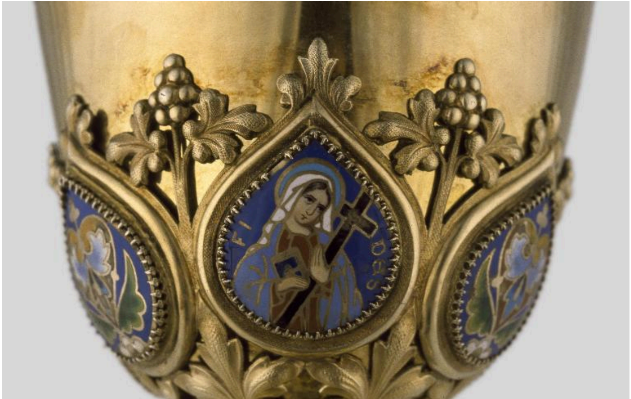
Détail de la fausse-coupe : médaillon émaillé orné de l'allégorie de la Foi.