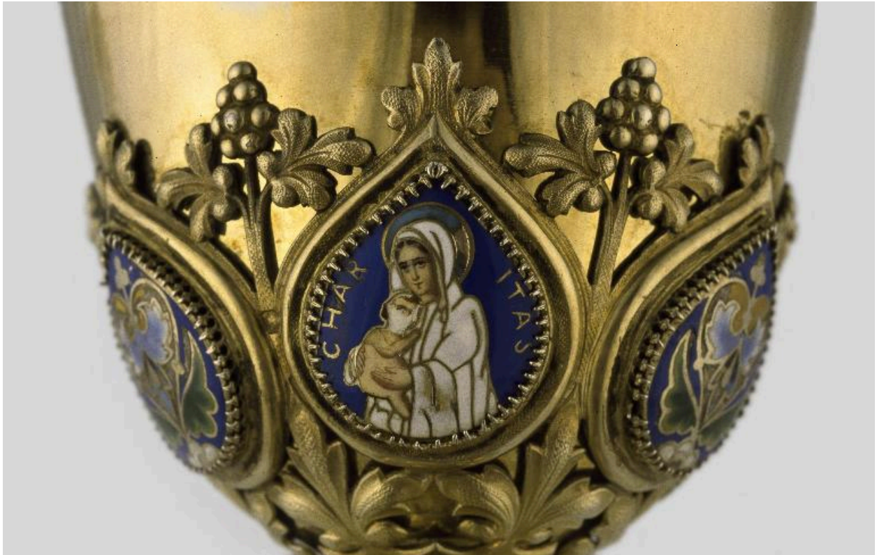
Détail de la fausse-coupe : médaillon émaillé orné de l'allégorie de la Charité.