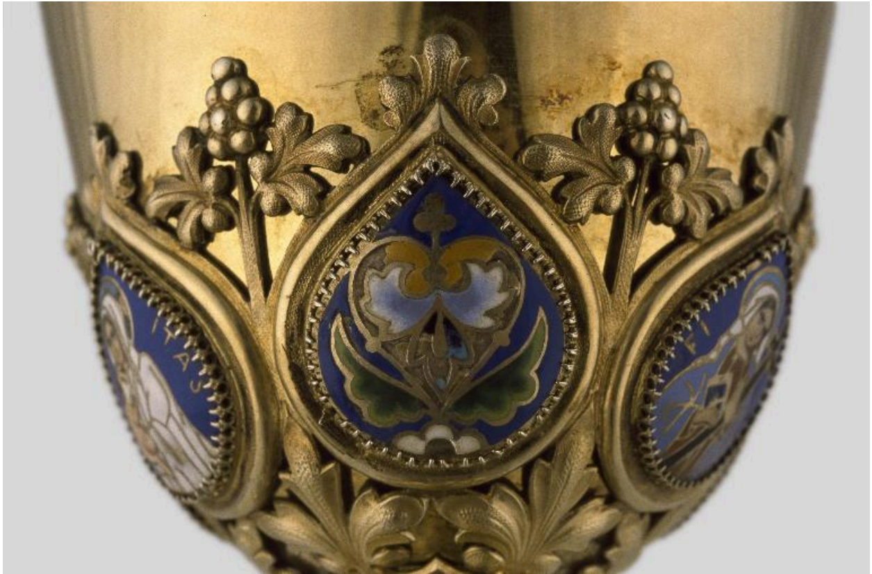
Détail de la fausse-coupe : médaillon émaillé orné d'un décor végétal.