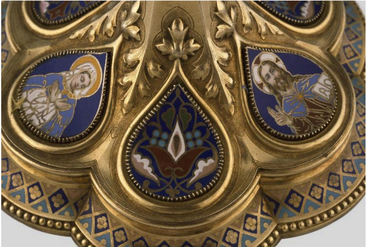
Détail du pied : médaillon émaillé orné d'un décor végétal.