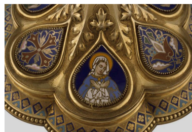
Détail du pied : médaillon émaillé orné d'une représentation de la Vierge.

IVR22_20010202258ZA