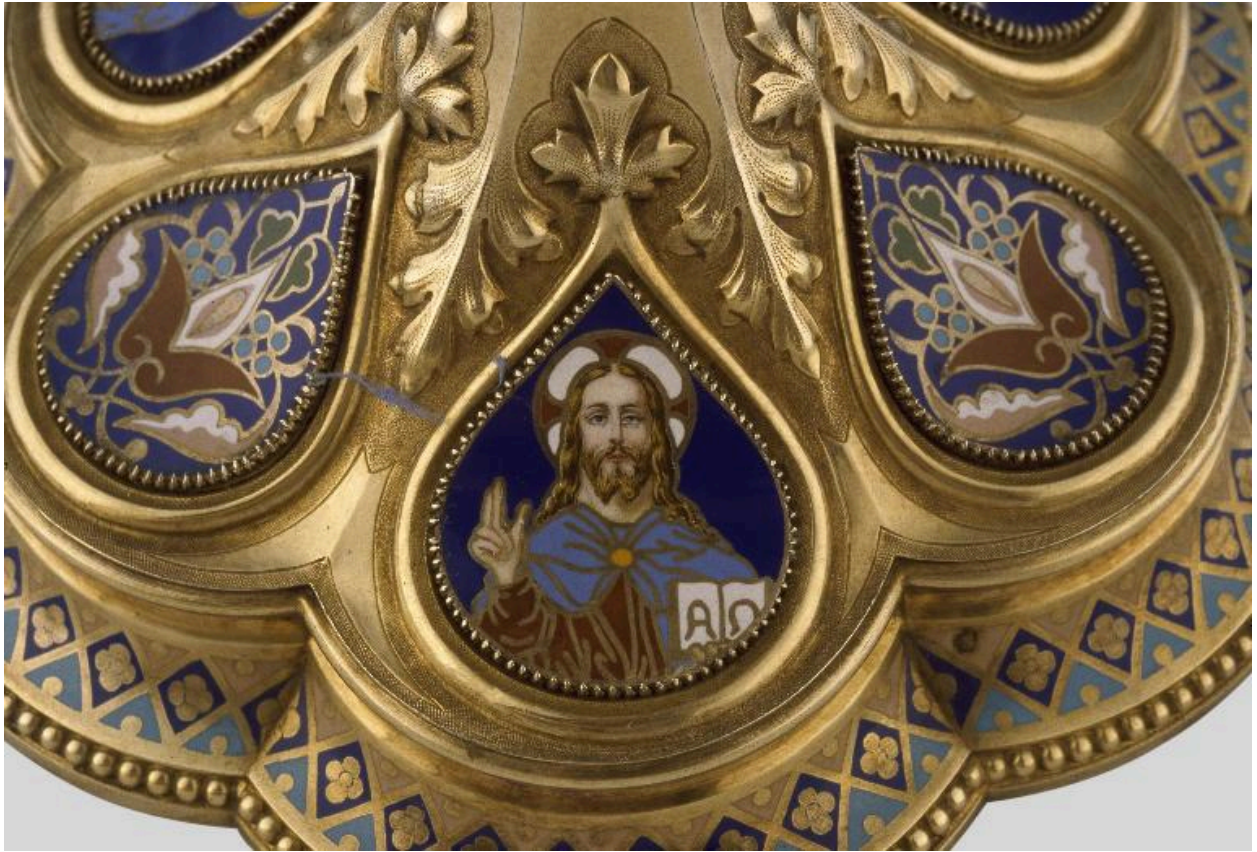
Détail du pied : médaillon émaillé orné d'une représentation du Christ.