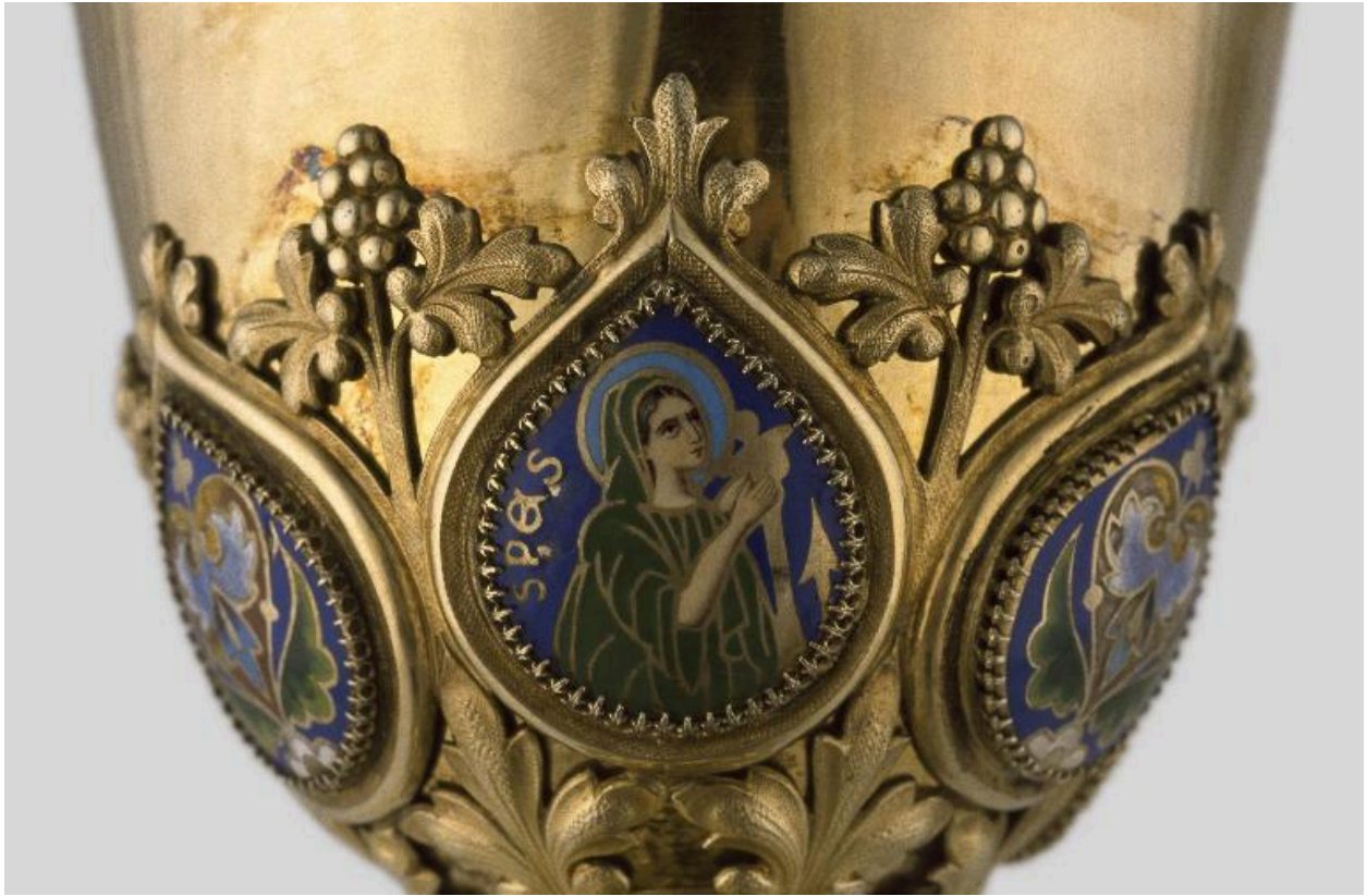
Détail de la fausse-coupe : médaillon émaillé orné de l'allégorie de l'Espérance.