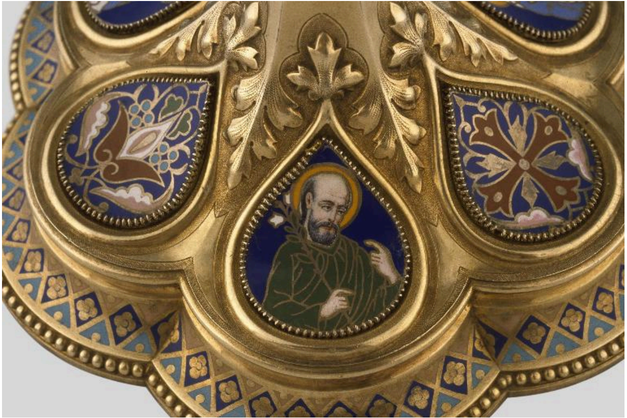
Détail du pied : médaillon émaillé orné d'une représentation de saint Joseph.