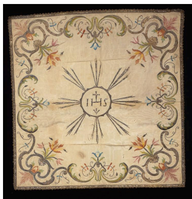
Vue d'ensemble. IVR22_19966000445XA