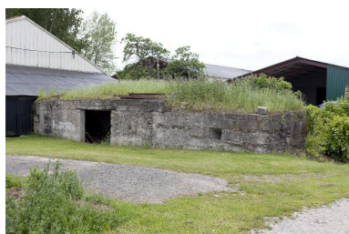
vue de trois-quarts vers le sud-ouest