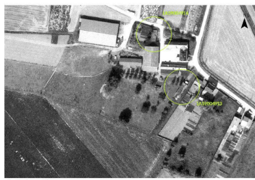
Plan de situation de l'édifice (cercle du haut) sur une photographie aérienne de 1981 (IGN, Geoportail). IVR32_20175900742NUCA