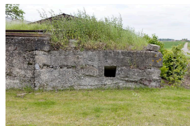
Soute à munitions IVR31_20145905235NUCA