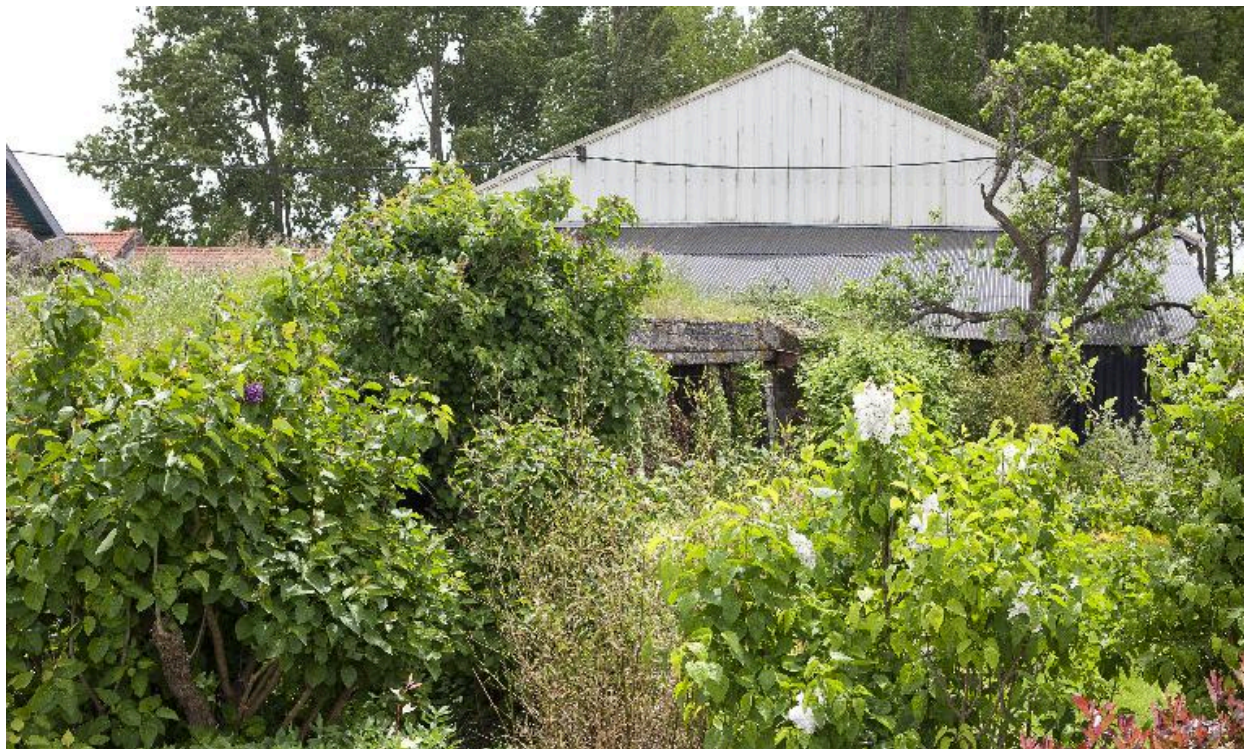
Vue de trois-quarts, vers le sud