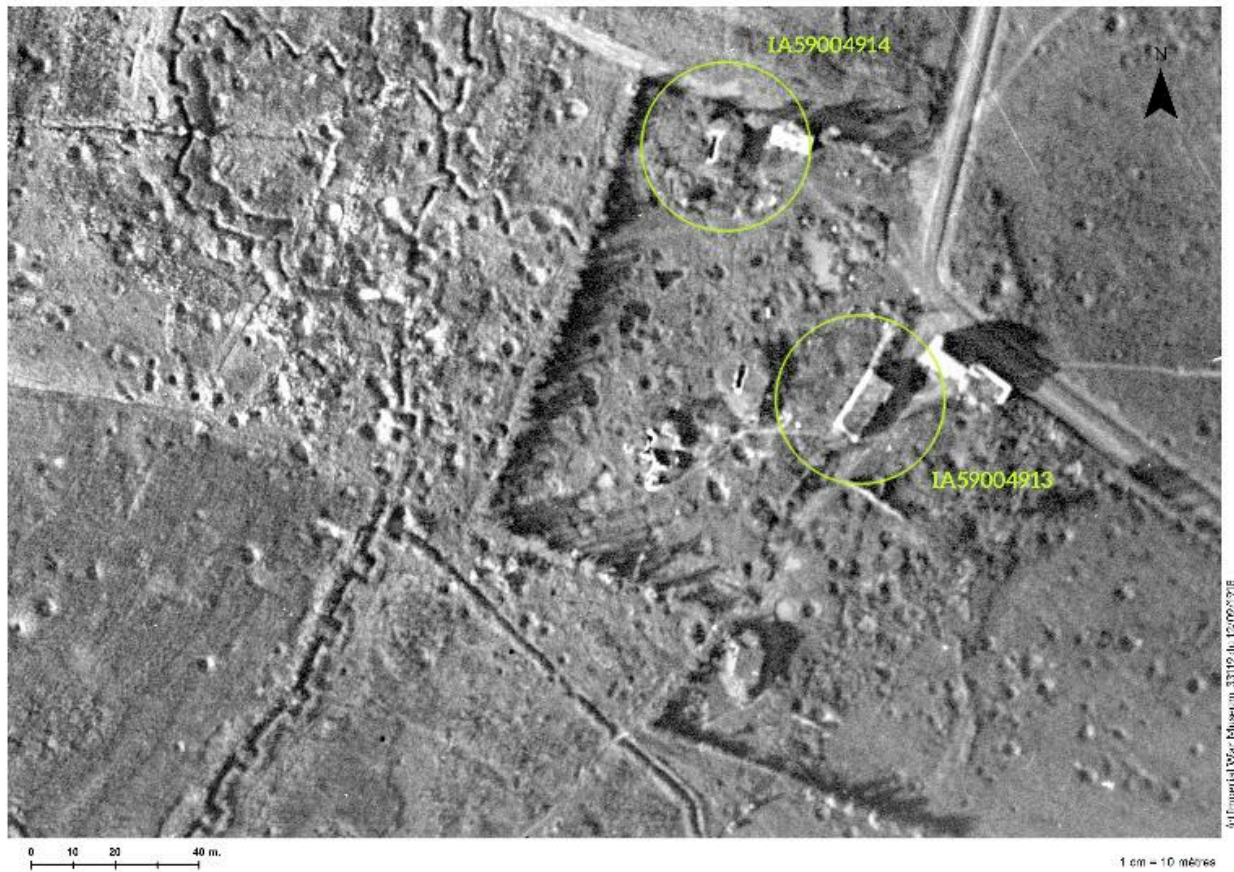
Plan de situation de l'édifice (cercle du haut) sur une photographie aérienne britannique du 12/09/1918