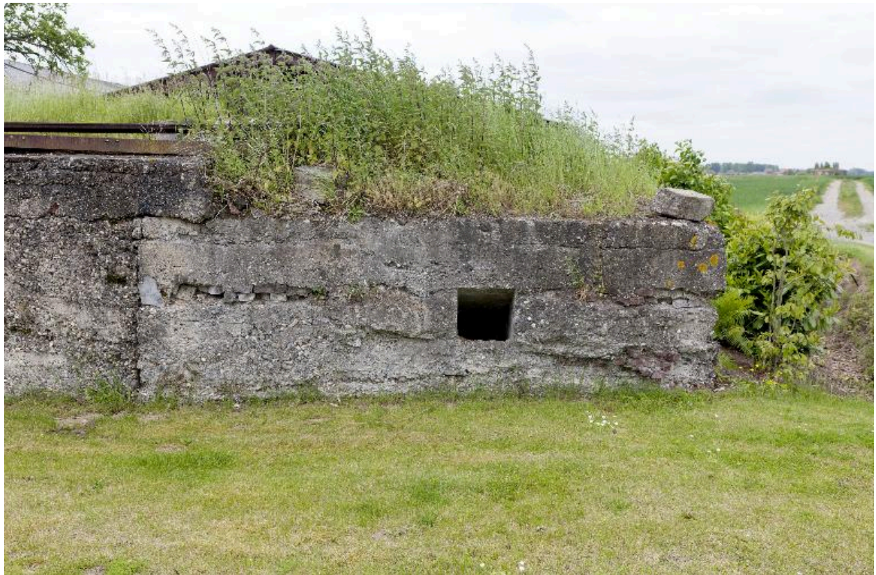
Soute à munitions