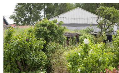
Vue de trois-quarts, vers le sud IVR31_20145905236NUCA