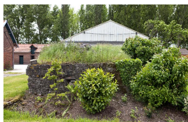
Vue latérale IVR31_20145905237NUCA