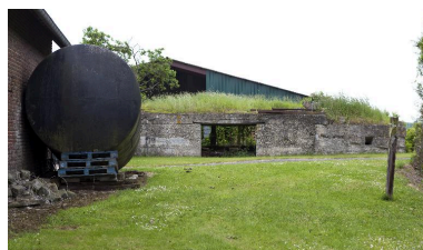
Vue de l'édifice vers le nord-est. Au centre l'accès à la chambre de tir, à droite la soute à munitions IVR31_20145905233NUCA