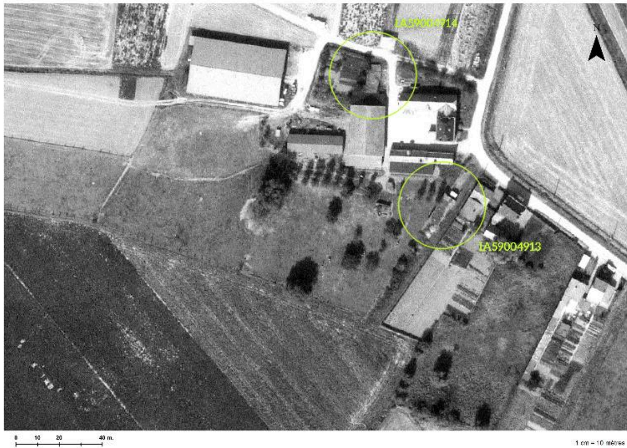
Plan de situation de l'édifice (cercle du haut) sur une photographie aérienne de 1981.