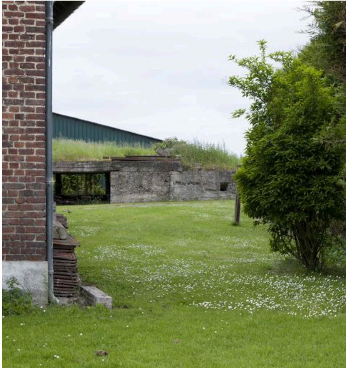
Vue de l'édifice depuis la rue