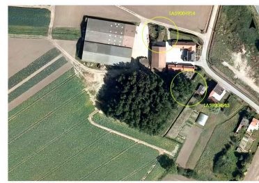
Plan de situation de l'édifice (cercle du haut) sur une photographie aérienne de 2009 IVR32_20175900743NUCA