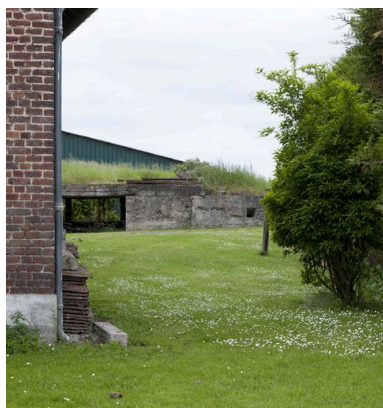
Vue de l'édifice depuis la rue IVR31_20145905232NUCA