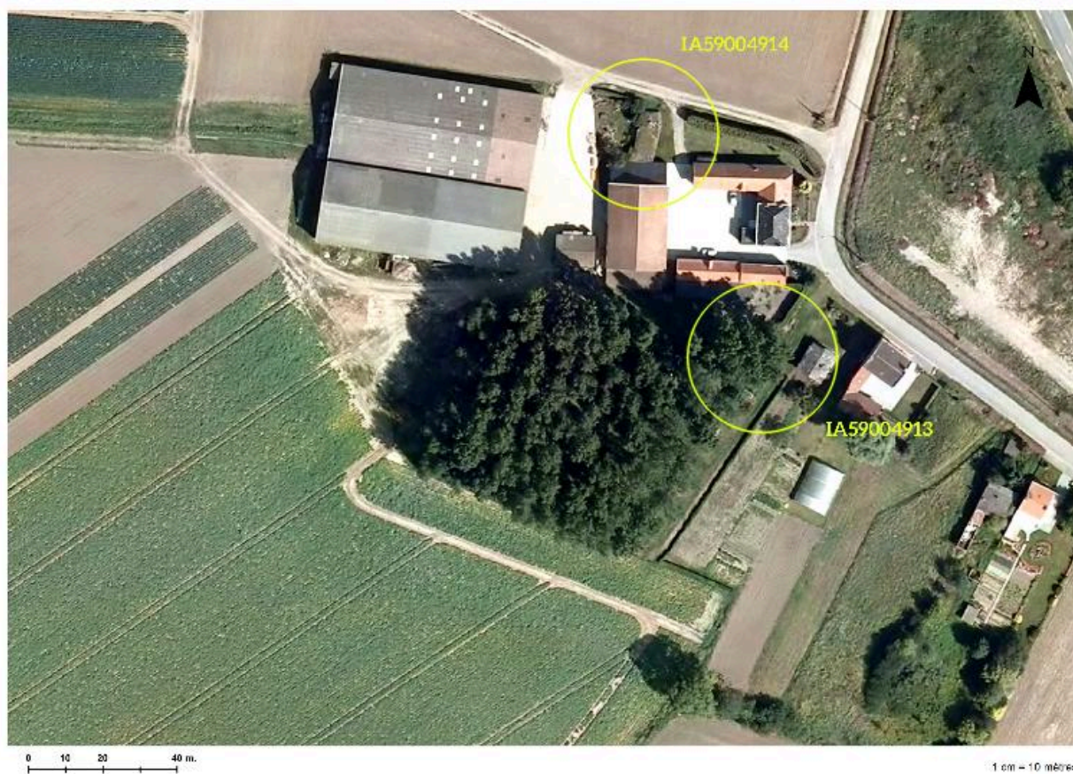
Plan de situation de l'édifice (cercle du haut) sur une photographie aérienne de 2009