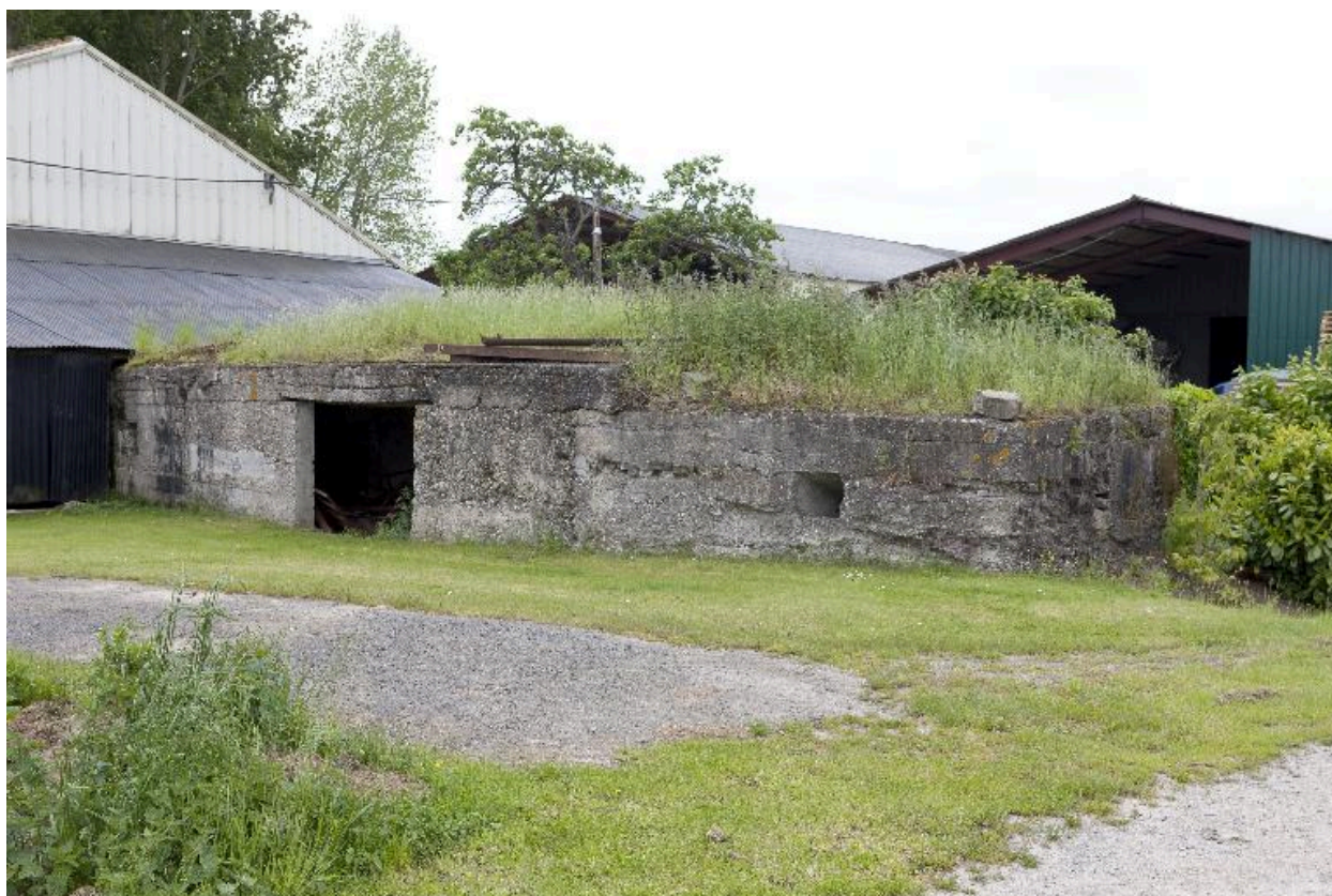
vue de trois-quarts vers le sud-ouest