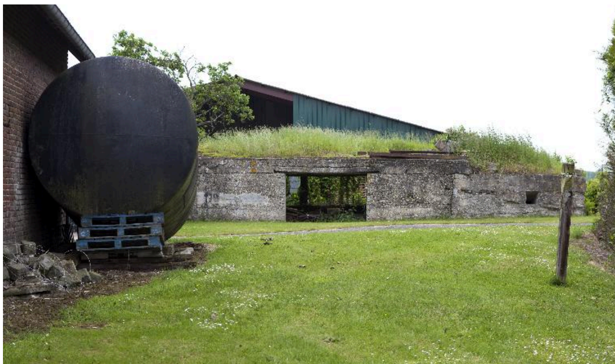
Vue de l'édifice vers le nord-est. Au centre l'accès à la chambre de tir, à droite la soute à munitions