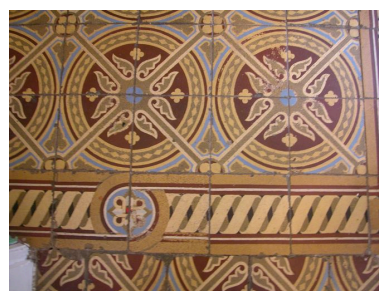
Détail des carreaux de sol du vestibule.