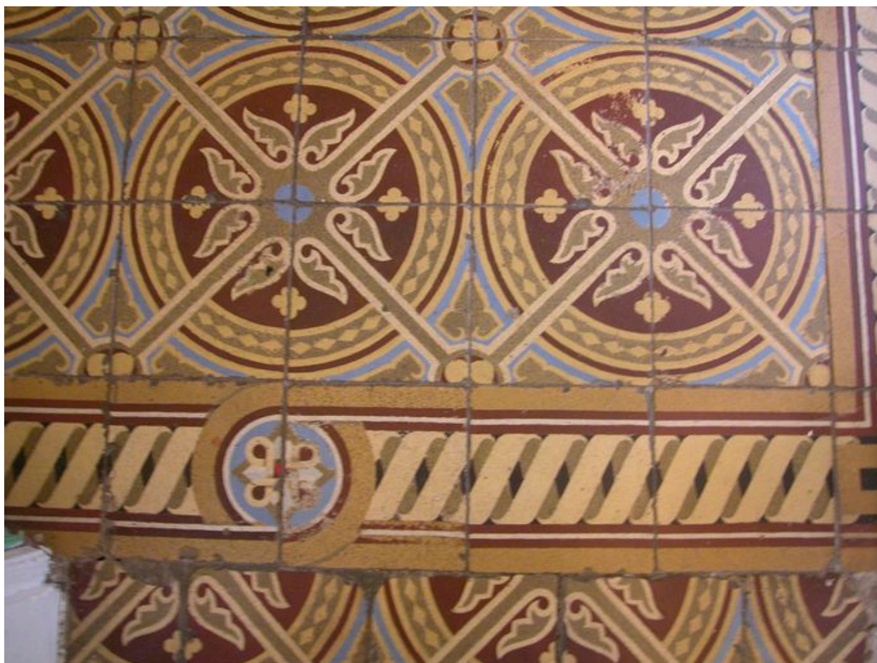
Détail des carreaux de sol du vestibule.