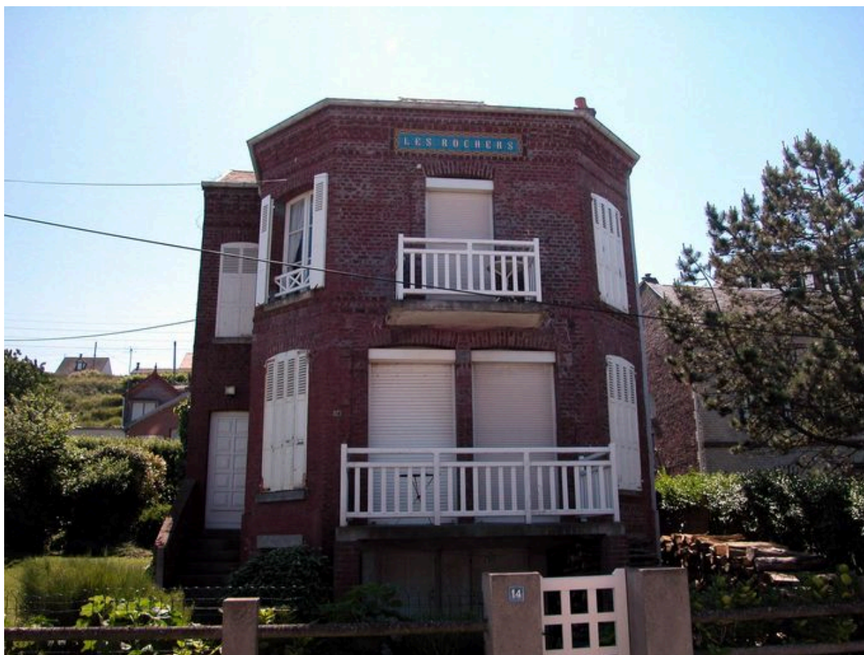
Vue d'ensemble, élévation sur mer.