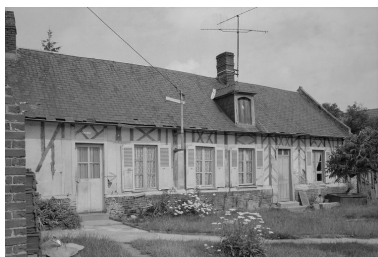
Logis. Élévation antérieure. IVR22_19846000960X

Plan de situation. Extrait du plan cadastral de 1982, section A5 611. IVR22_20096000012NUCA