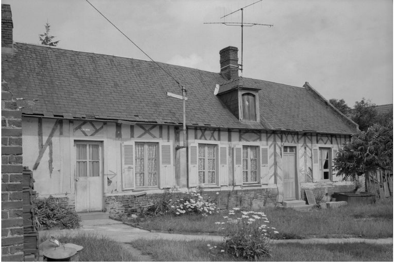
Logis. Elévation antérieure.