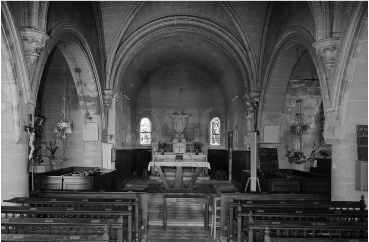
Vue intérieure vers le chœur.