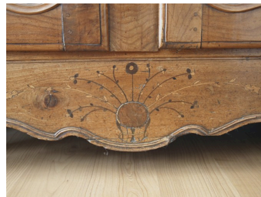
Vue générale : décor IVR31_20106204112NUCA