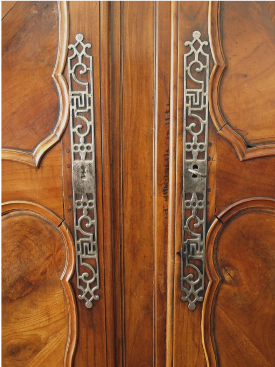
Vue de détail : ferrures et serrure