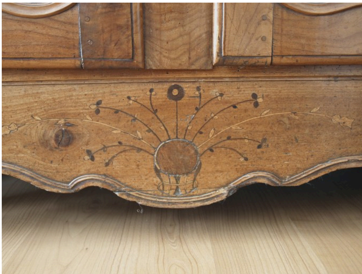
Vue générale : décor