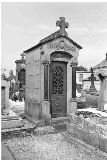
Vue d'ensemble. IVR22_20010202124X