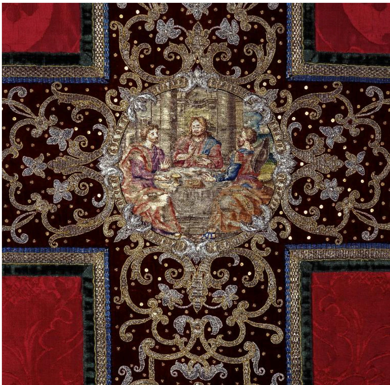
Détail du médaillon au dos de la chasuble : le Souper à Emmaüs.