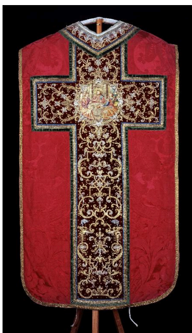
Vue du dos.