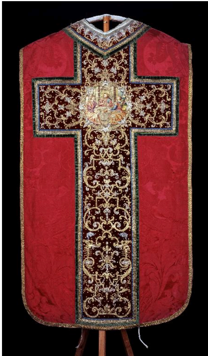
Vue du dos.