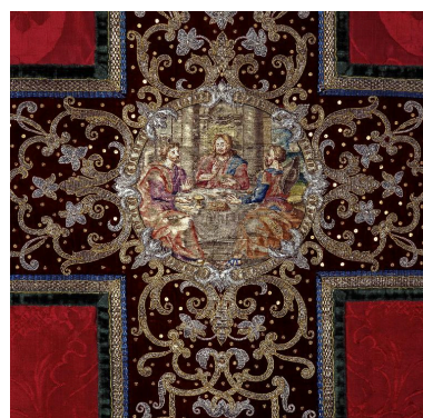
Détail du médaillon au dos de la chasuble : le Souper à Emmaüs. IVR22_19956001019XA