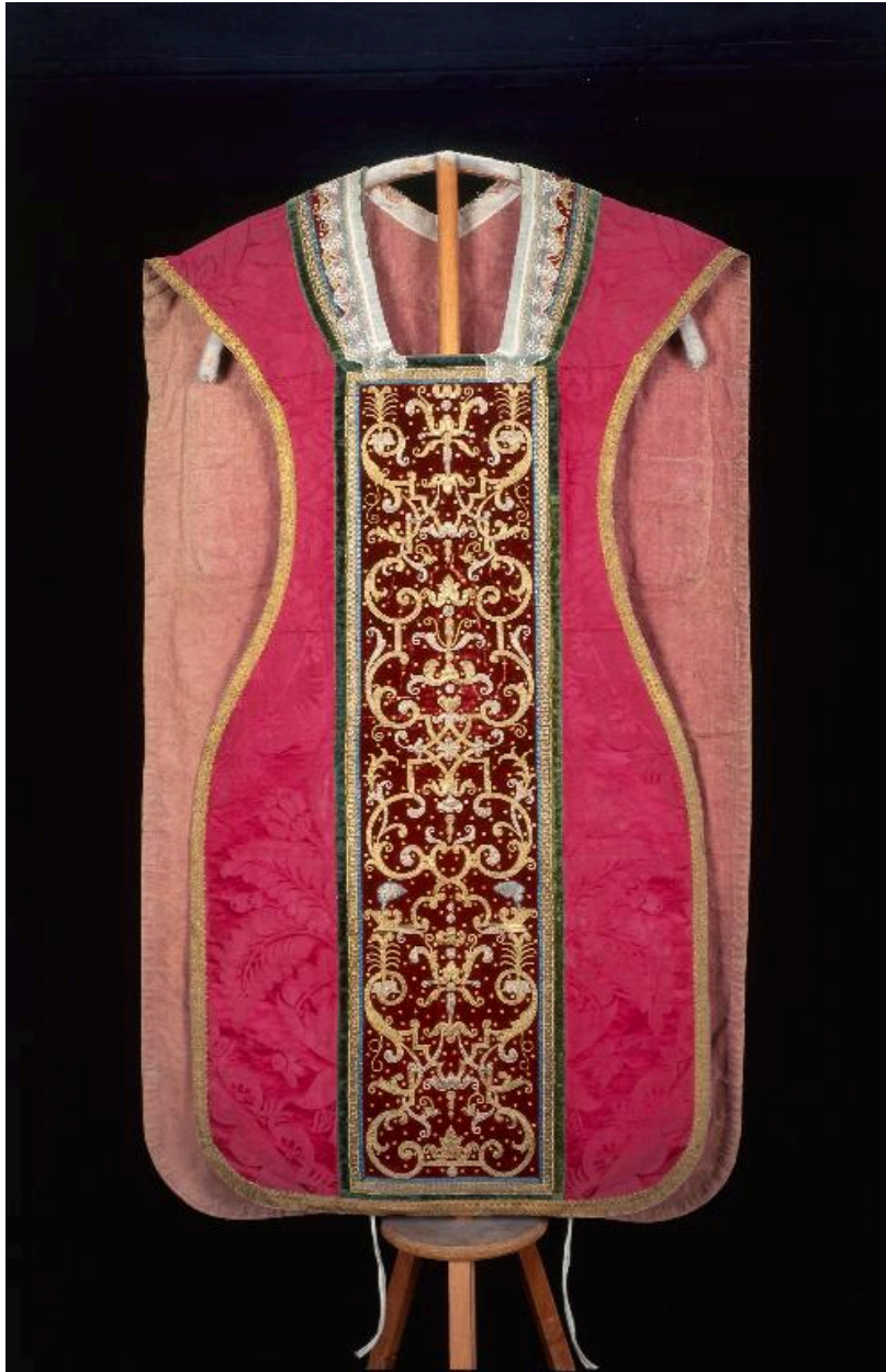
Vue du devant.