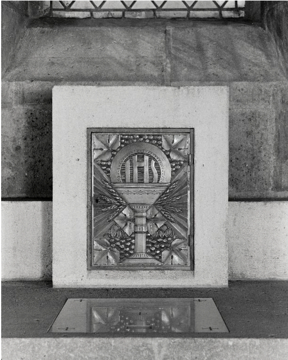
Vue du tabernacle.