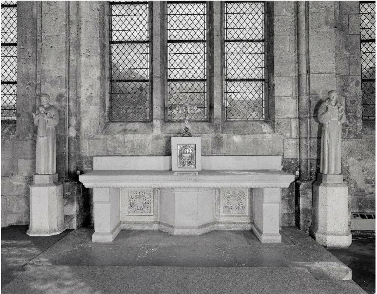
Vue générale de l'autel.