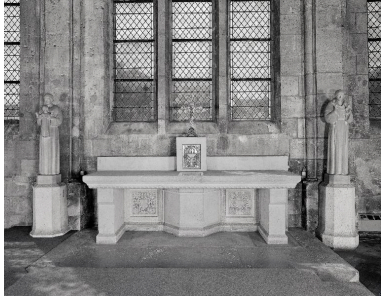
Vue générale de l'autel.