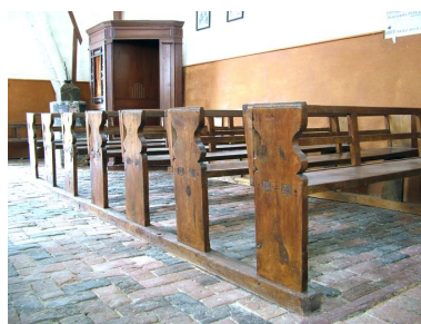
Vue des bancs de la partie nord de la nef, chêne, 19e siècle.