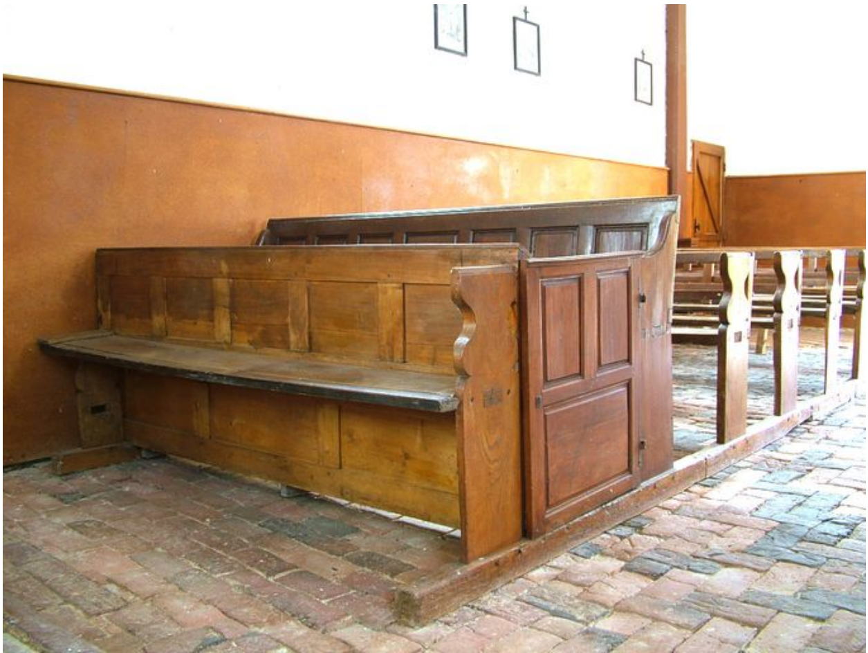
Vue des bancs de la partie sud de la nef, chêne, 19e siècle.