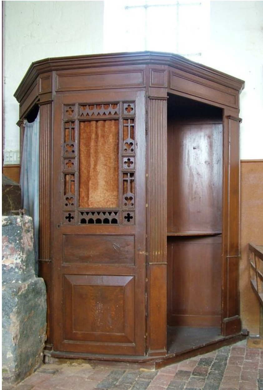
Confessionnal, chêne, milieu du 19e siècle.