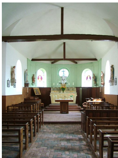
Vue intérieure de la nef et du chœur.