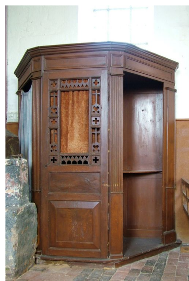
Confessionnal, chêne, milieu du 19e siècle.