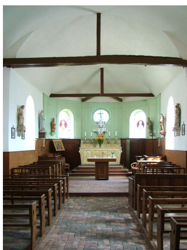
Vue intérieure de la nef et du chœur.