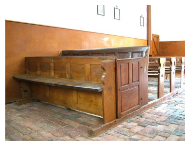
Vue des bancs de la partie sud de la nef, chêne, 19e siècle. IVR22_20108001303NUCA