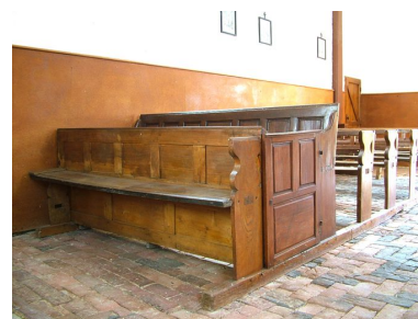
Vue des bancs de la partie sud de la nef, chêne, 19e siècle. IVR22_20108001303NUCA