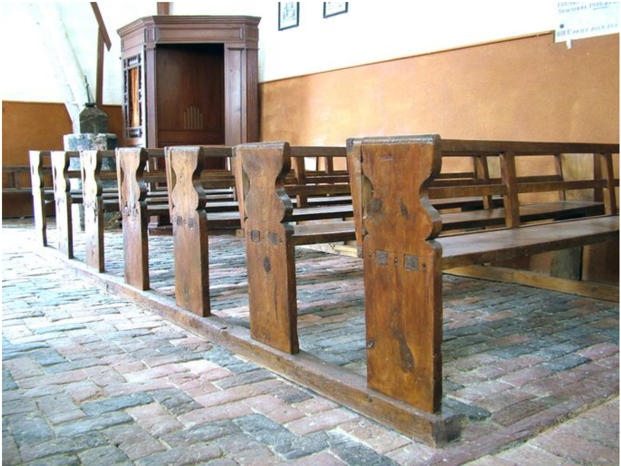
Vue des bancs de la partie nord de la nef, chêne, 19e siècle.