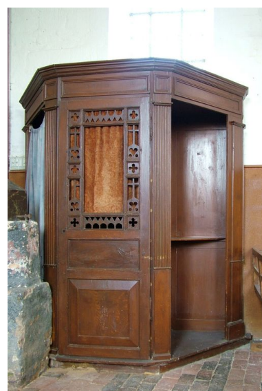
Confessionnal, chêne, milieu du 19e siècle. IVR22_20108001306NUCA