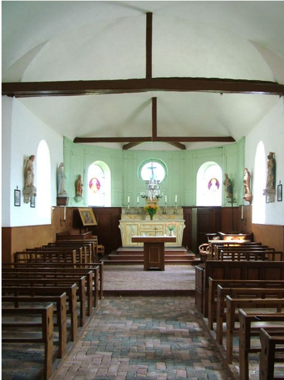
Vue intérieure de la nef et du chœur.