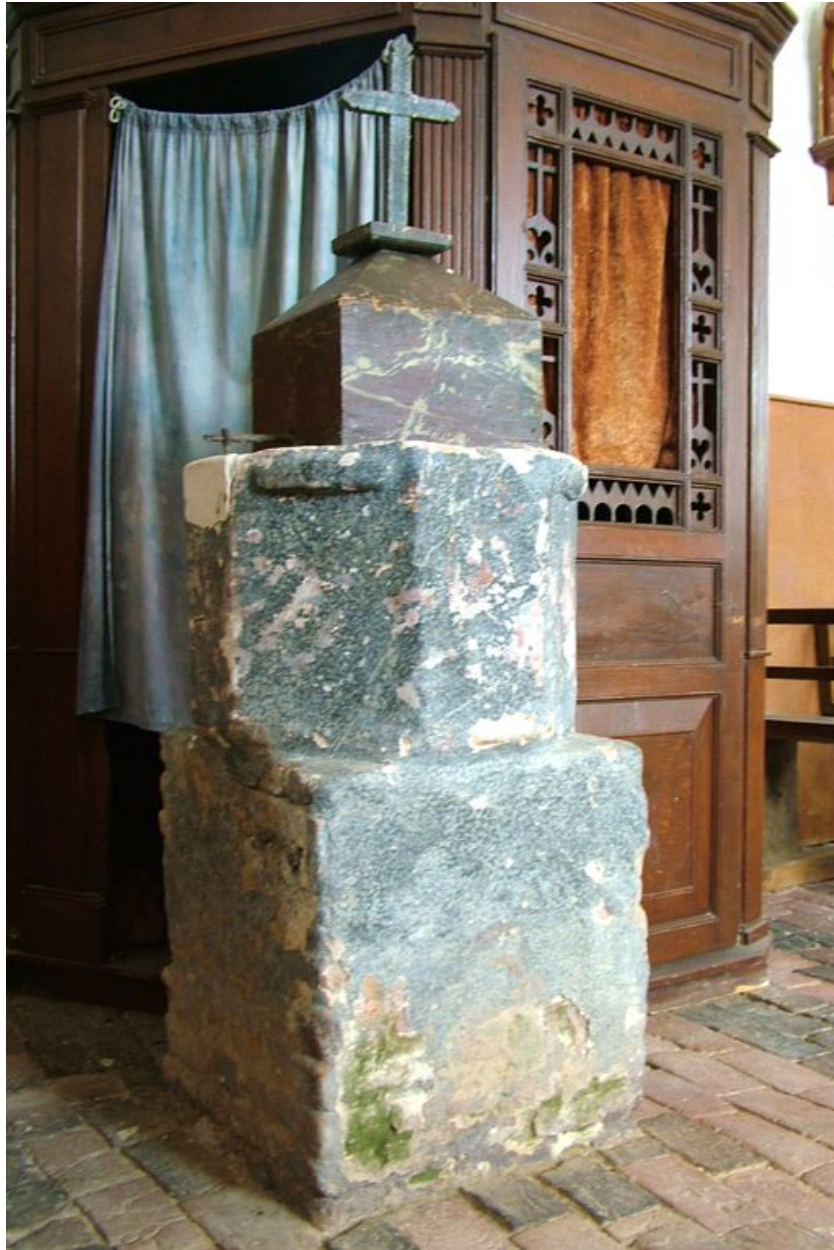
Fonts baptismaux, calcaire et brique, 17e (?) et 20e siècle.