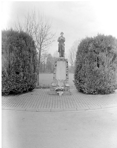
Vue générale. IVR22_19970202212X