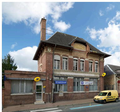
Flixecourt, poste, 1913. IVR22_20128000608NUC2A