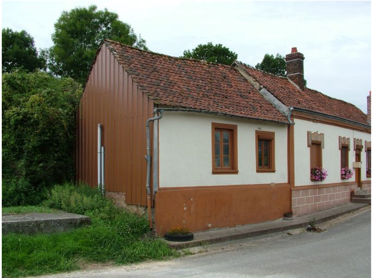
Bouchon, ancienne salle communale, 4e quart du 18e siècle.