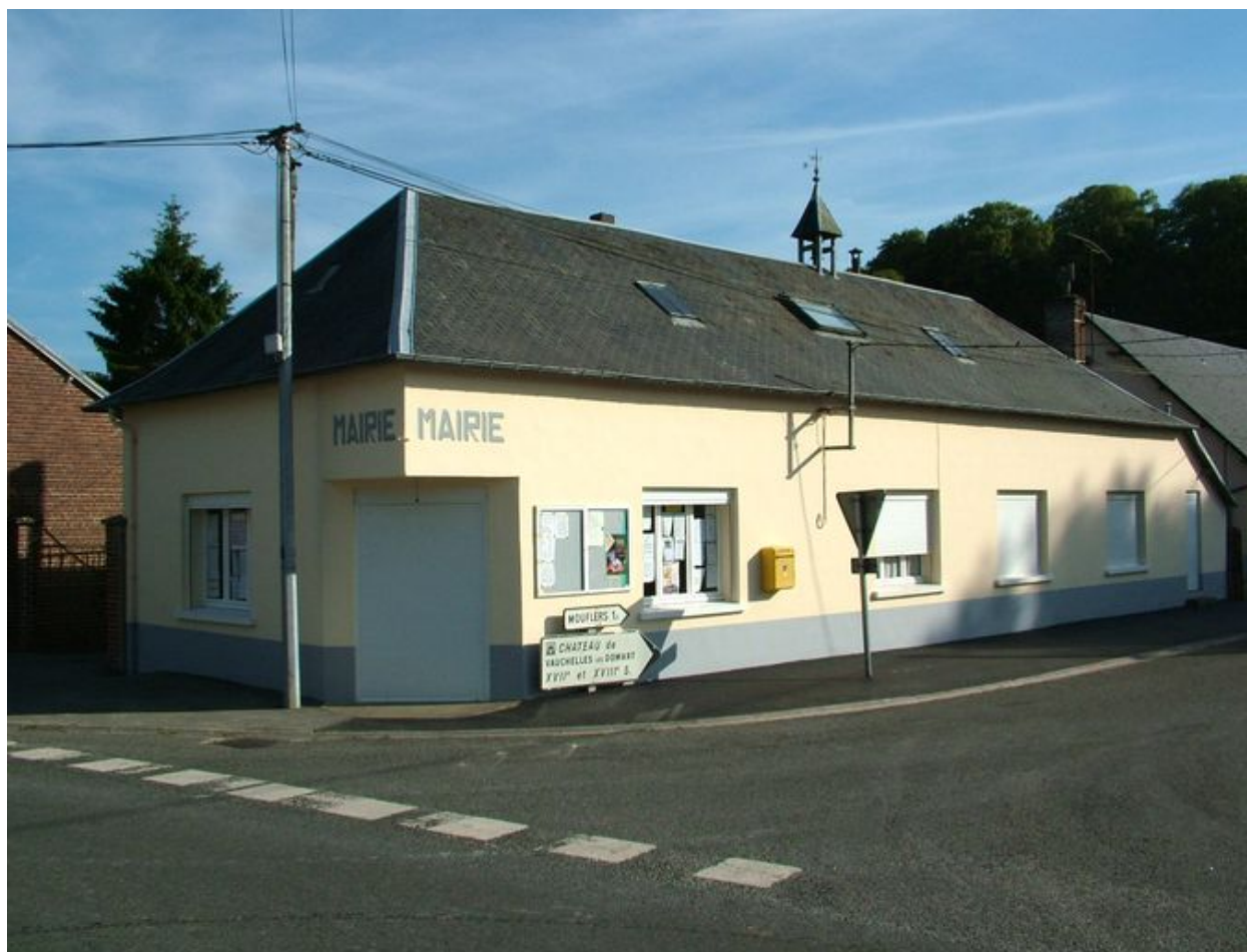
Vauchelles-lès-Domart, mairie, 1874 et 1976.