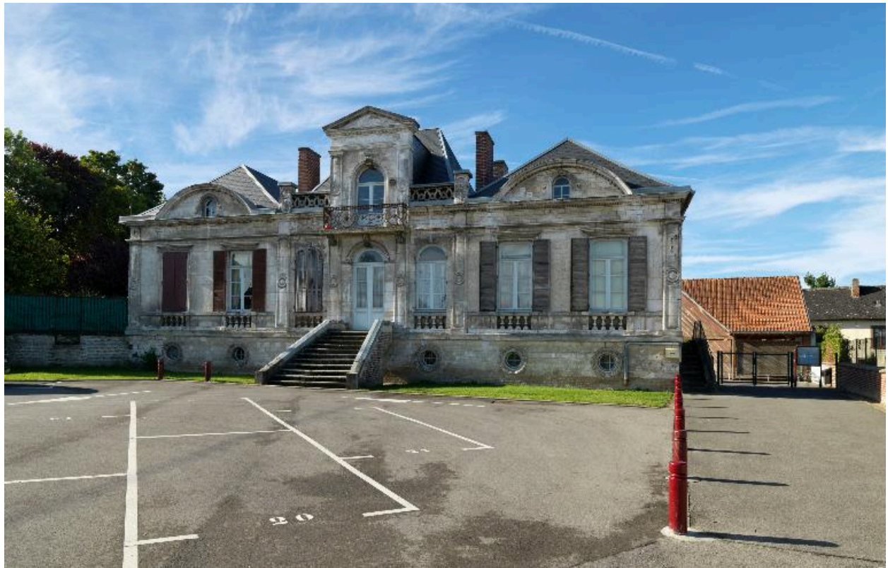
Flixecourt, ancienne maison, puis école primaire de garçons, 1895.