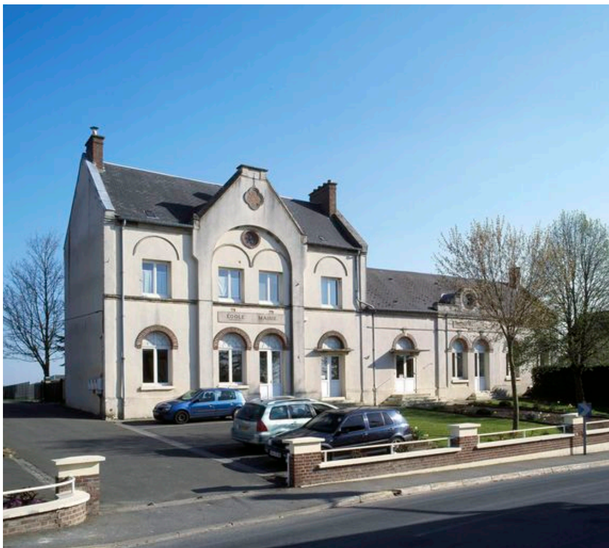
Bettencourt-Saint-Ouen, mairie et école primaire, C. Masse architecte, 1860, et Caron architecte, 1896.