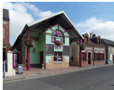
Saint-Ouen, ancienne salle paroissiale, vers 1930.