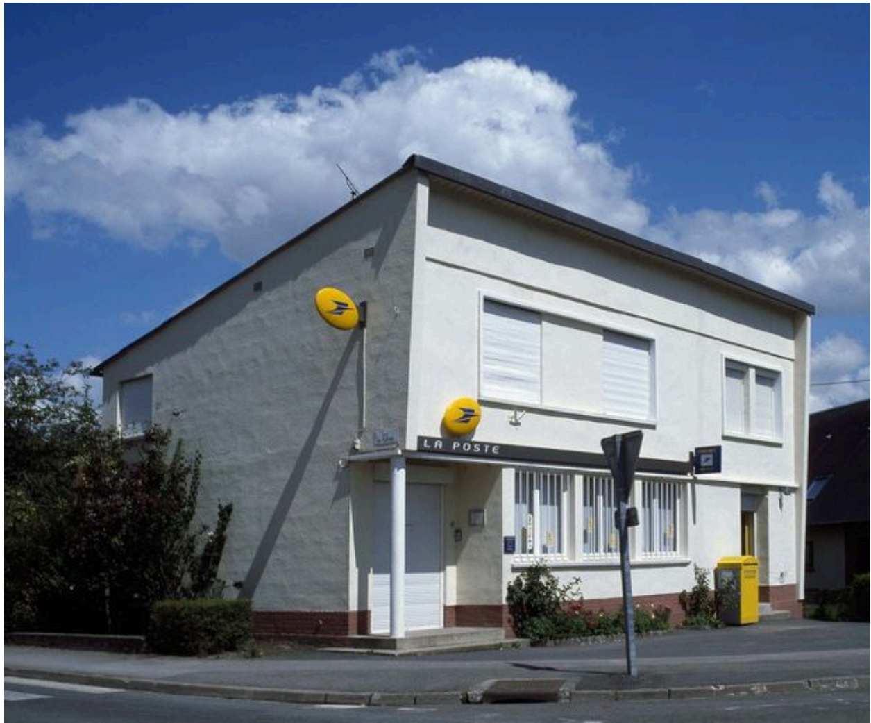
Canaples, poste, 1955 et vers 1970.