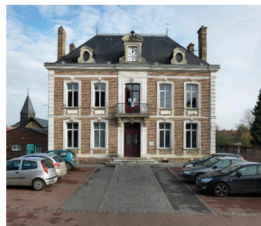
Flixecourt, ancienne maison de directeur, 1880, devenue mairie en 1947.