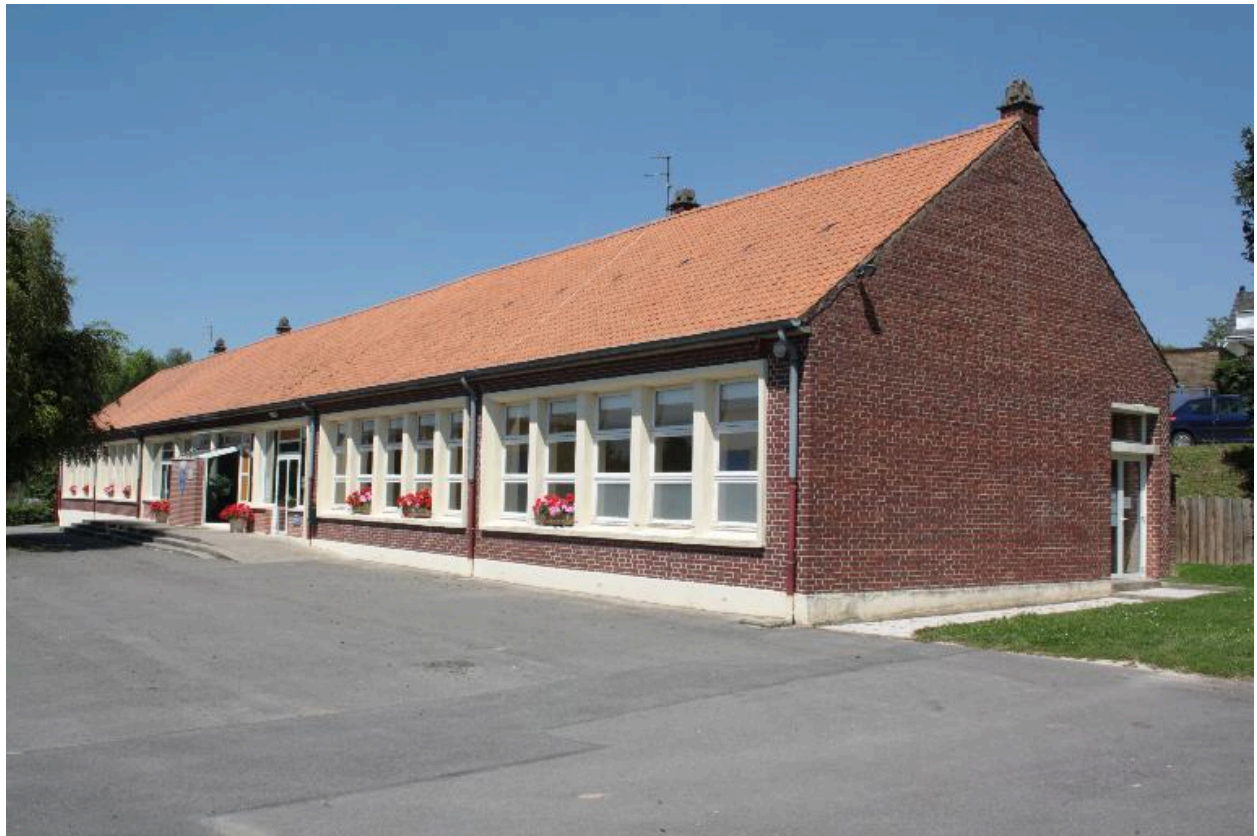
L'Étoile, ancien groupe scolaire des Moulins-Bleus, Maurice Laya architecte, 1962.