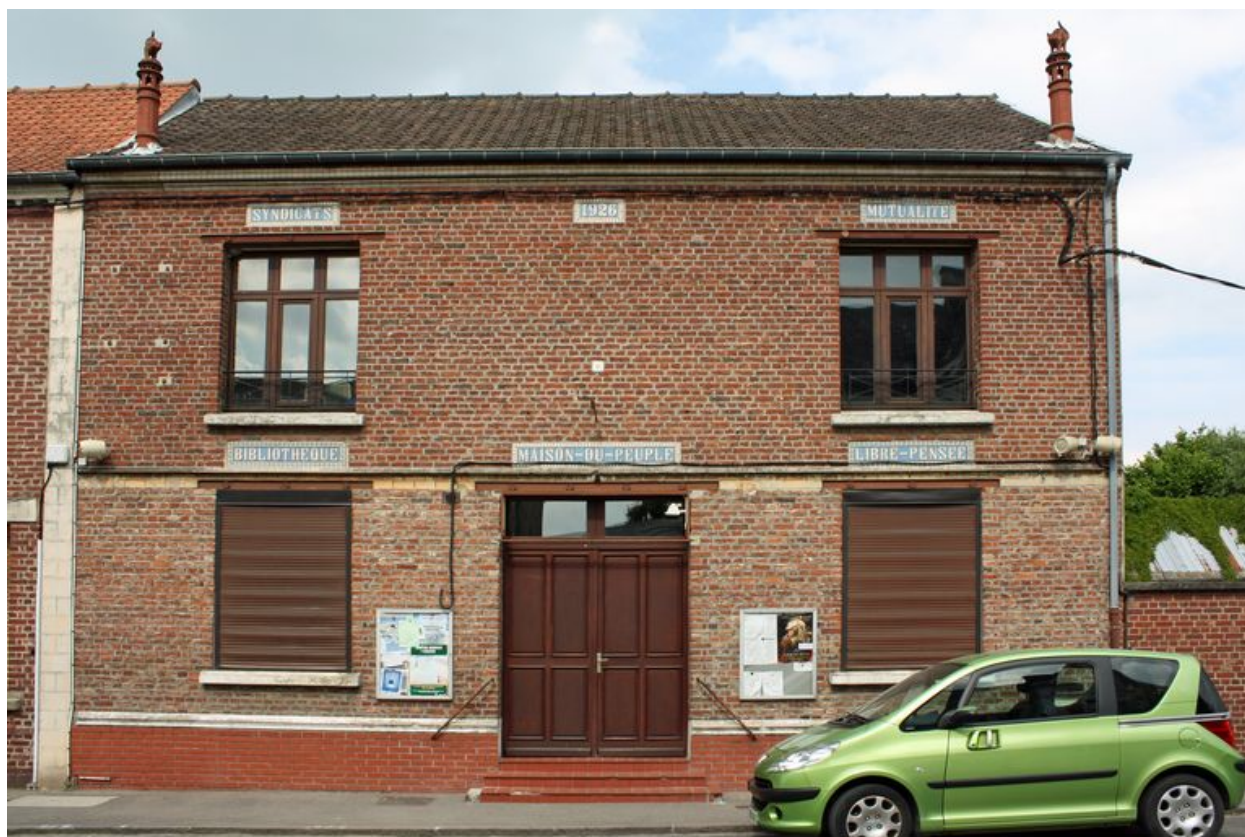
Saint-Ouen, ancienne maison du peuple, 1926.