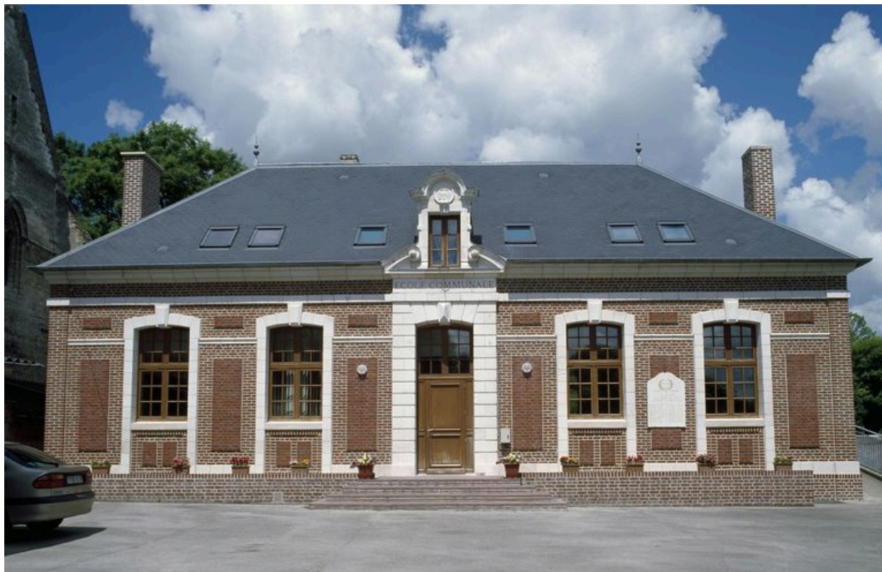
Bouchon, mairie, Emile Ricquier architecte, 1875.