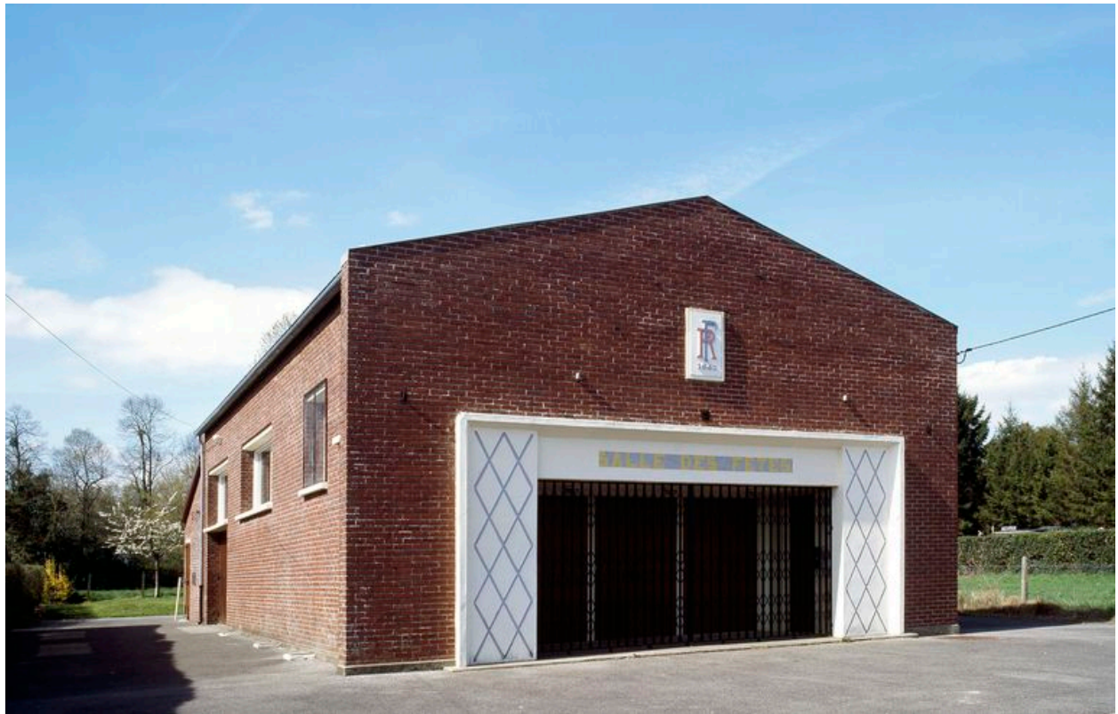
Ribeaucourt, salle des fêtes, Louis Douillet architecte, 1963.