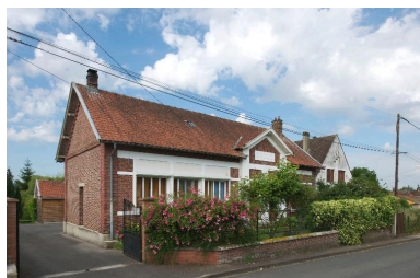
L'Étoile, ancienne école maternelle des Moulins-Bleus, 1934.