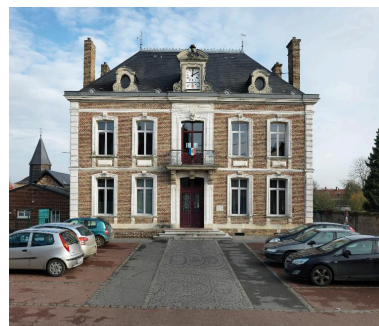
Flixecourt, ancienne maison de directeur, 1880, devenue mairie en 1947. IVR22_20138000517NUC2AQ