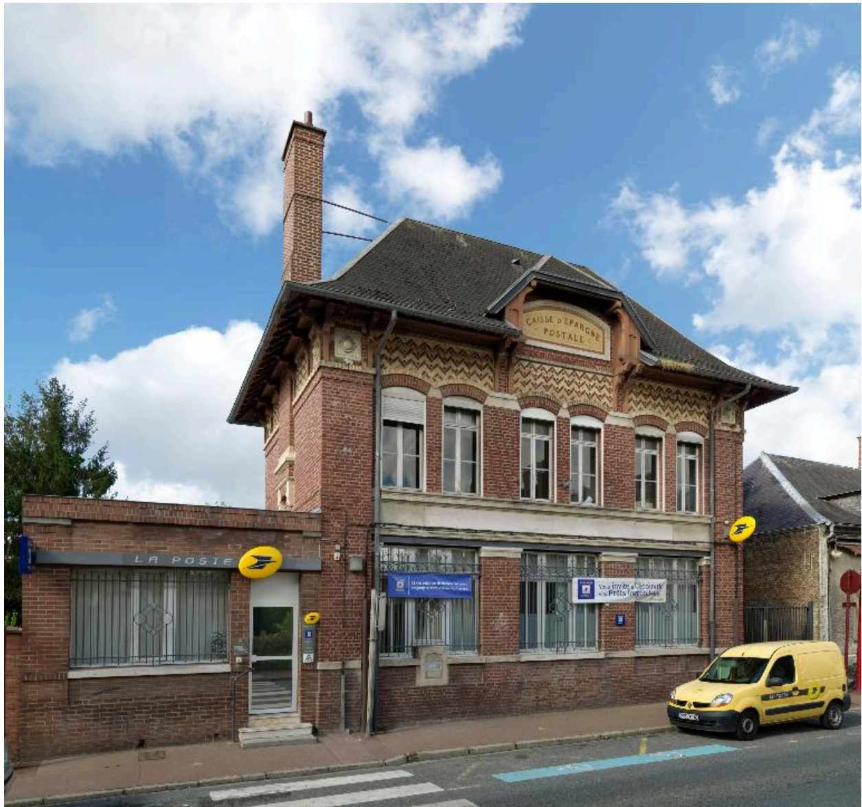
Flixecourt, poste, 1913.