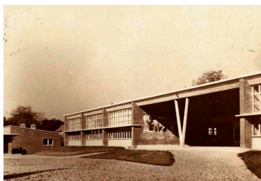
L'Étoile, ancien groupe scolaire Jules-Ferry, 1952 (carte postale, 1953, coll. part.). IVR22_20128005094NUCA