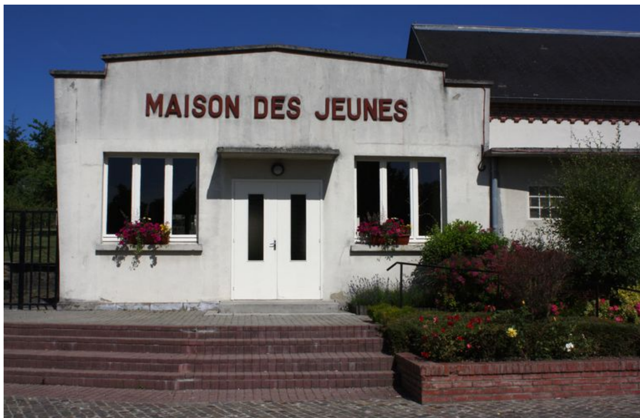
Ville-le-Marclet, maison des jeunes, Maurice Cozette géomètre, 1969.