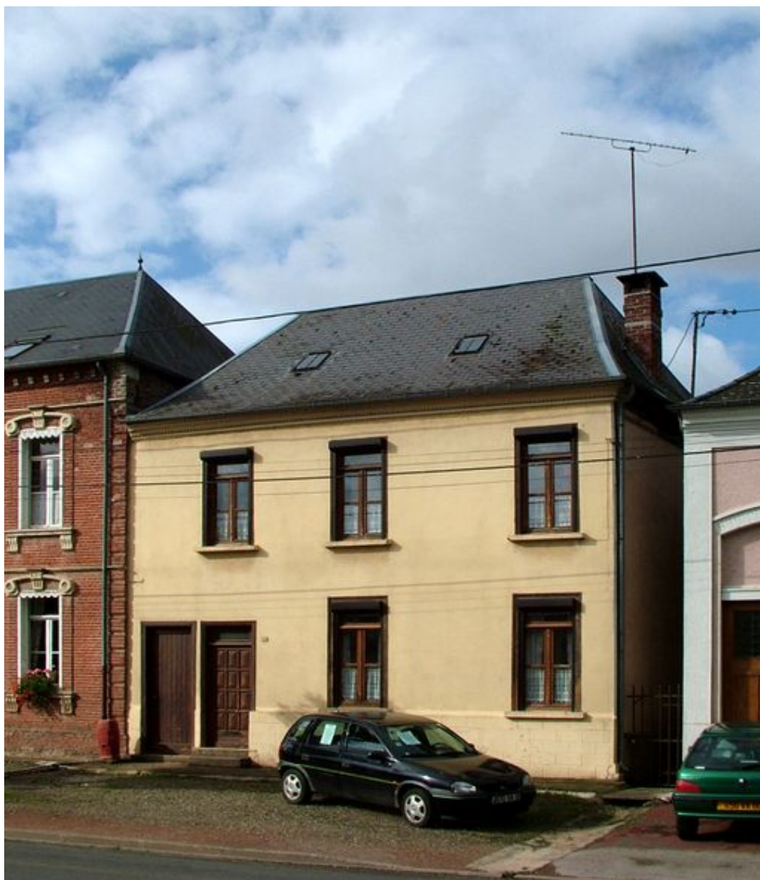
Canaples, ancienne poste, 1887.