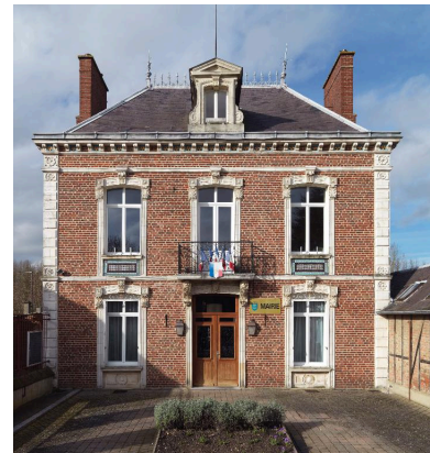
Berteaucourt-les-Dames, ancienne maison devenue mairie, 4 e quart du 19 e siècle. IVR22_20148000095NUC2A