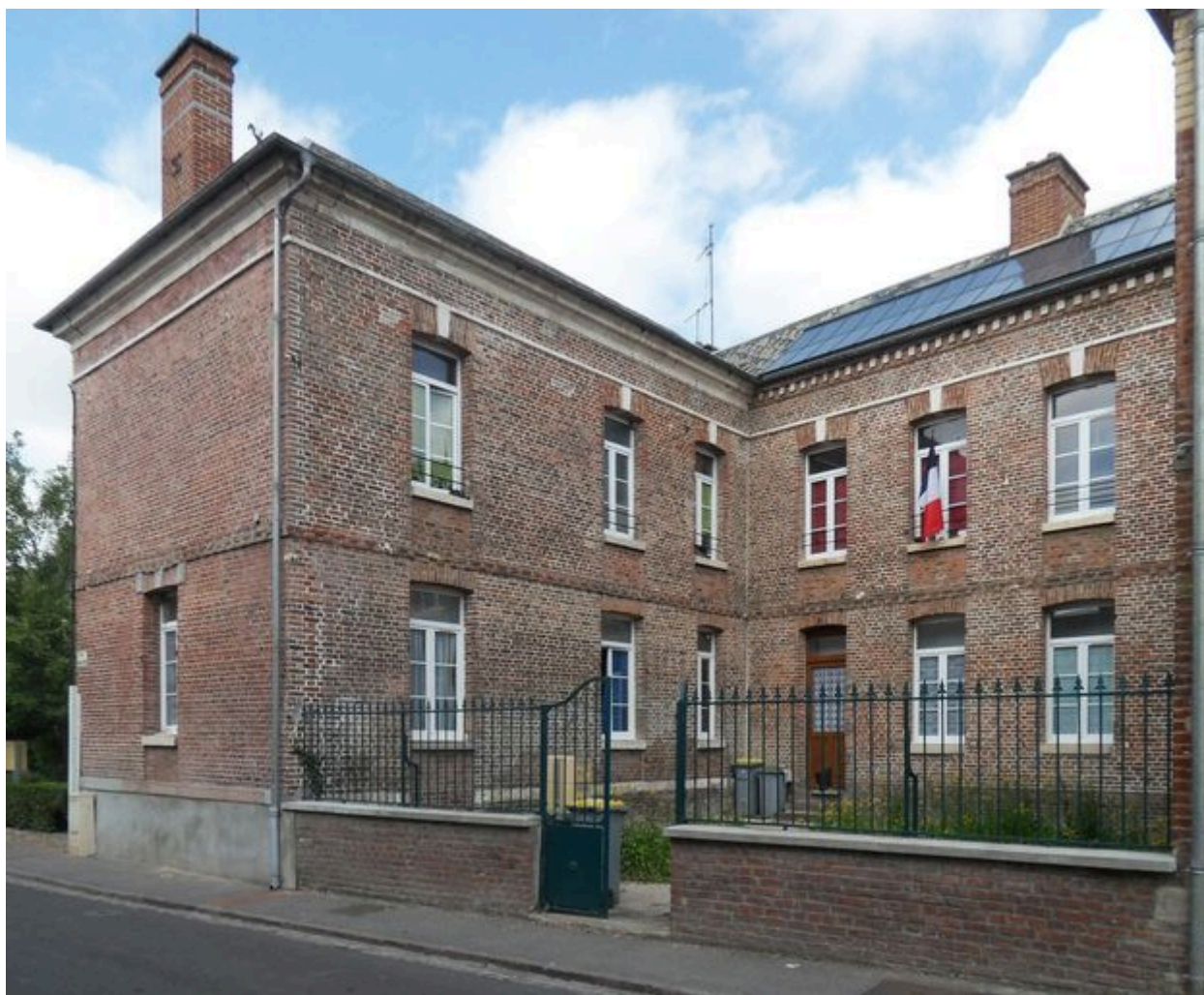
Saint-Ouen, ancienne école primaire de garçons et mairie, Charles Demoulins architecte, 1840, et Louis Henry Antoine architecte, 1869.