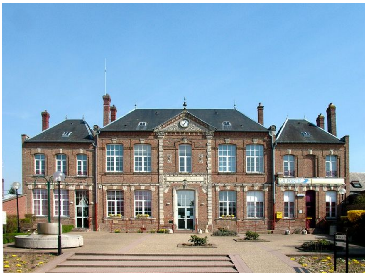
Saint-Ouen, ancienne école de garçons, actuellement mairie, Sanson architecte, 1886.