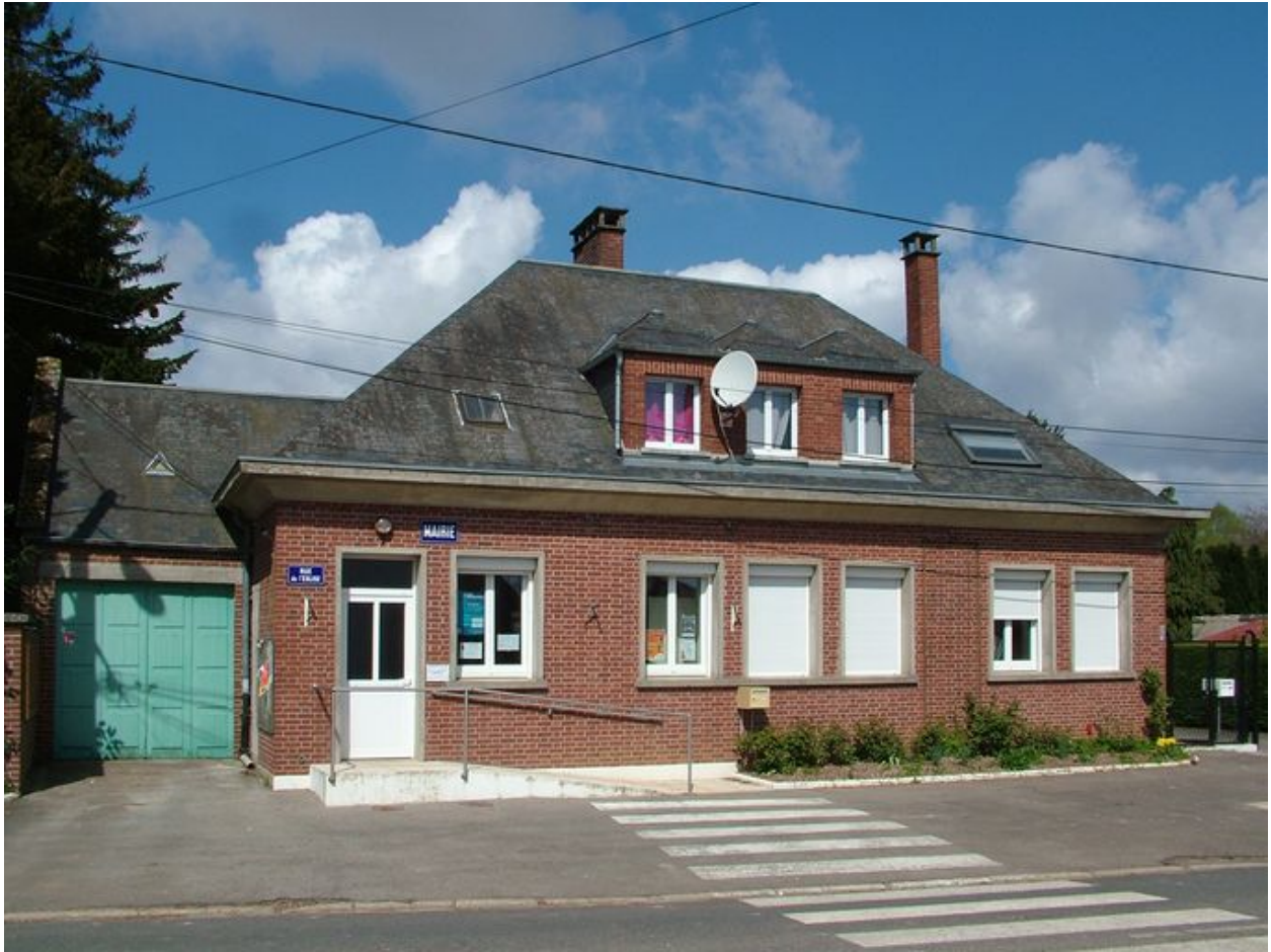
Ribeaucourt, mairie et ancien logement de l'instituteur, Jean Guidée architecte, 1955.