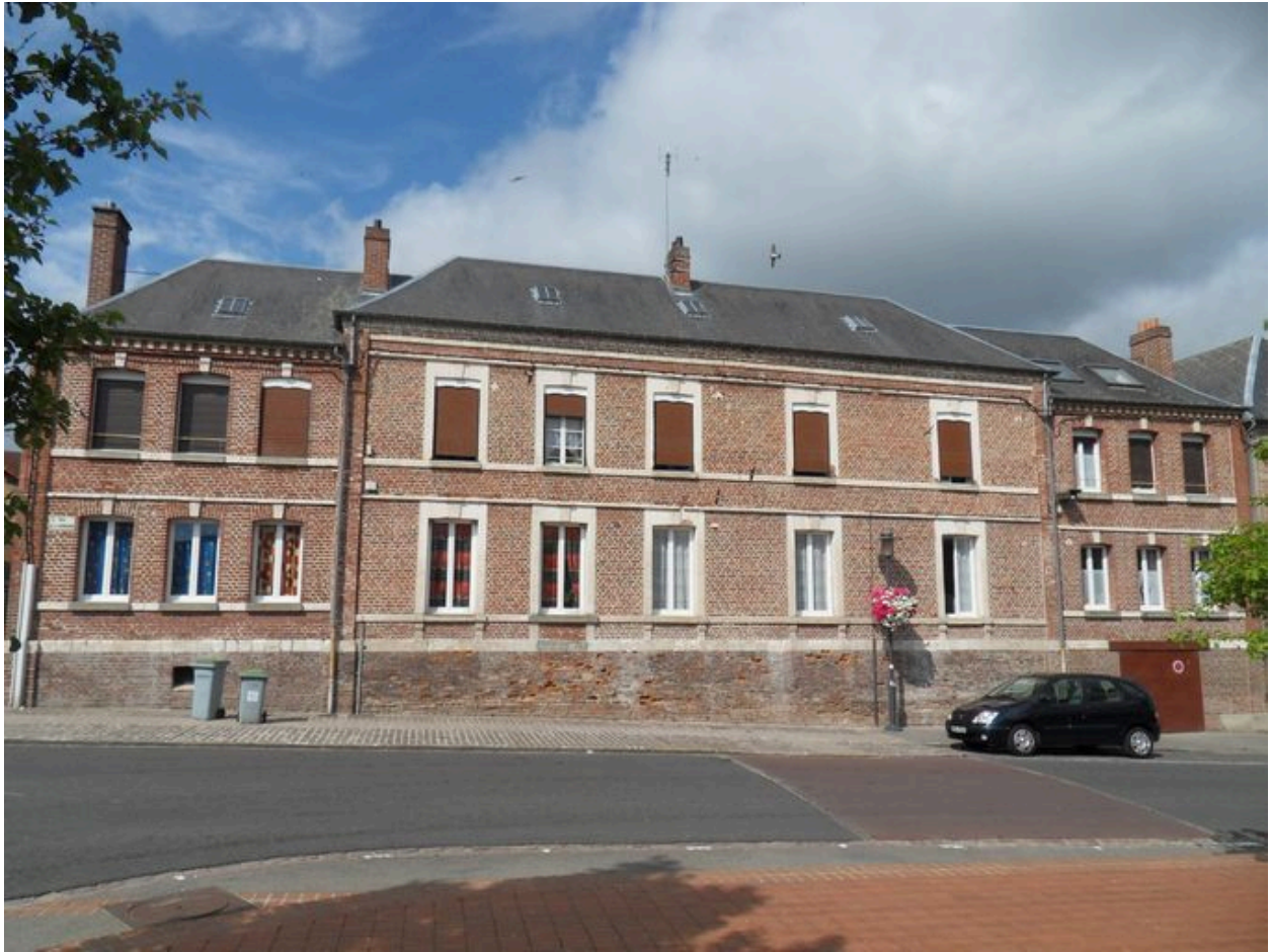
Saint-Ouen, ancienne école primaire de filles, Anatole Bienaimé architecte, 1906.