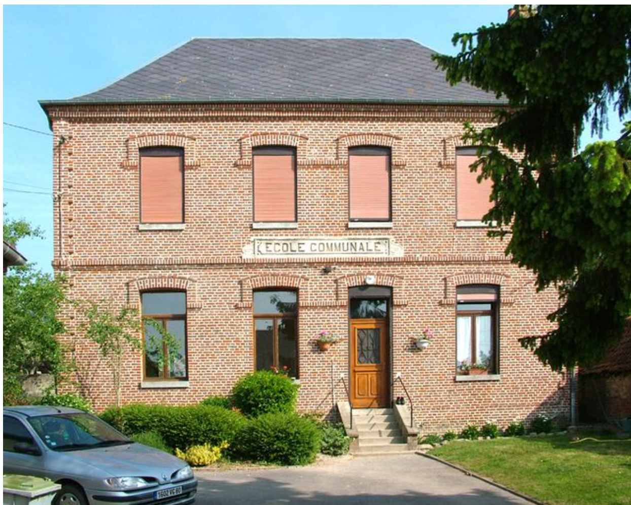
Surcamps, mairie, Machy architecte, 1882.