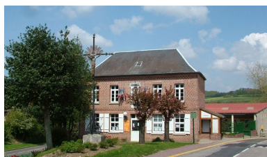
Havernas, mairie et école primaire, 1847.