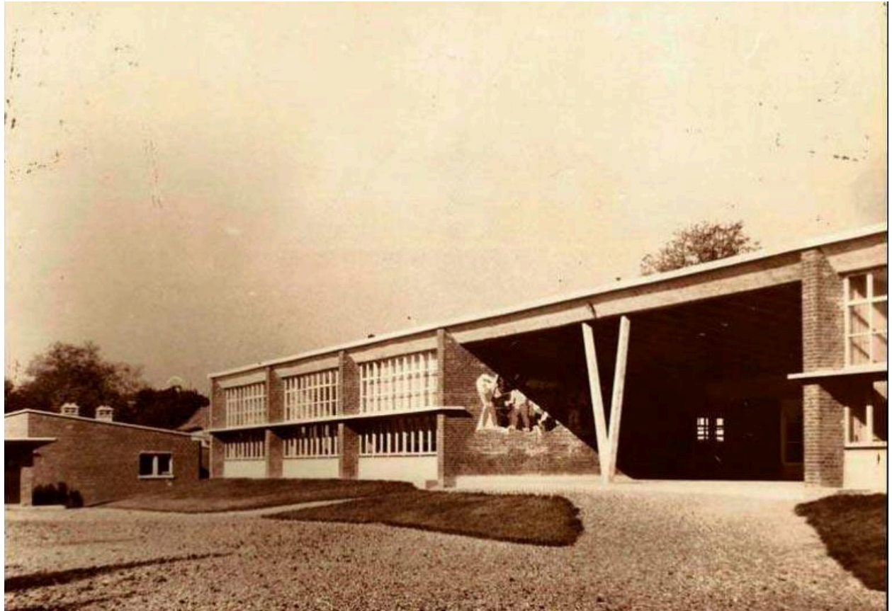
L'Étoile, ancien groupe scolaire Jules-Ferry, 1952 (carte postale, 1953).