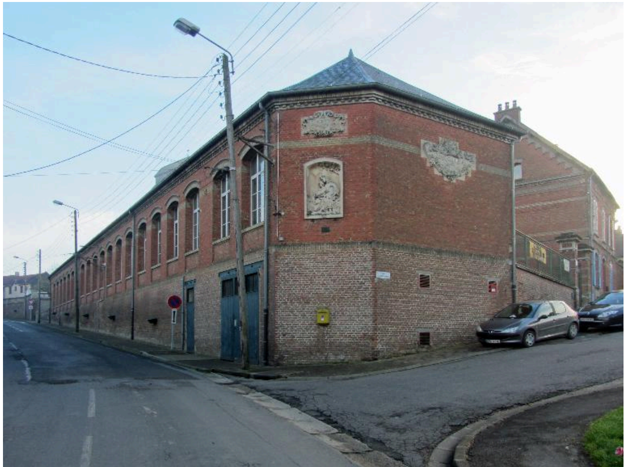
Flixecourt, école primaire de filles, Alfred Cuvillier architecte, 1907.