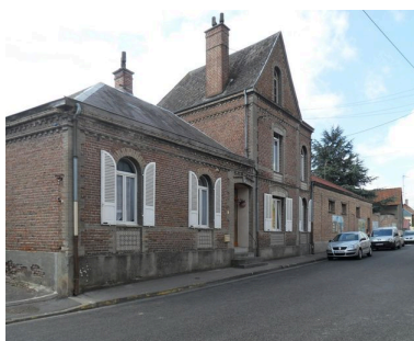
Saint-Ouen, école primaire Notre-Dame, avant 1914. IVR22_20108001501NUCA