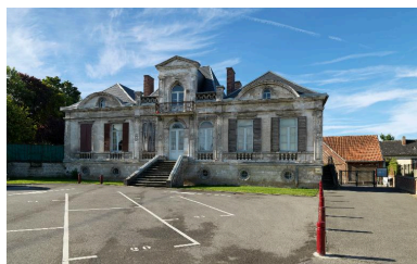
Flixecourt, ancienne maison, puis école primaire de garçons, 1895.