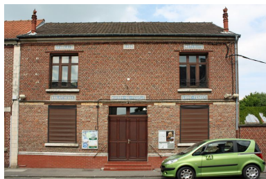
Saint-Ouen, ancienne maison du peuple, 1926. IVR22_20098005820NUCA