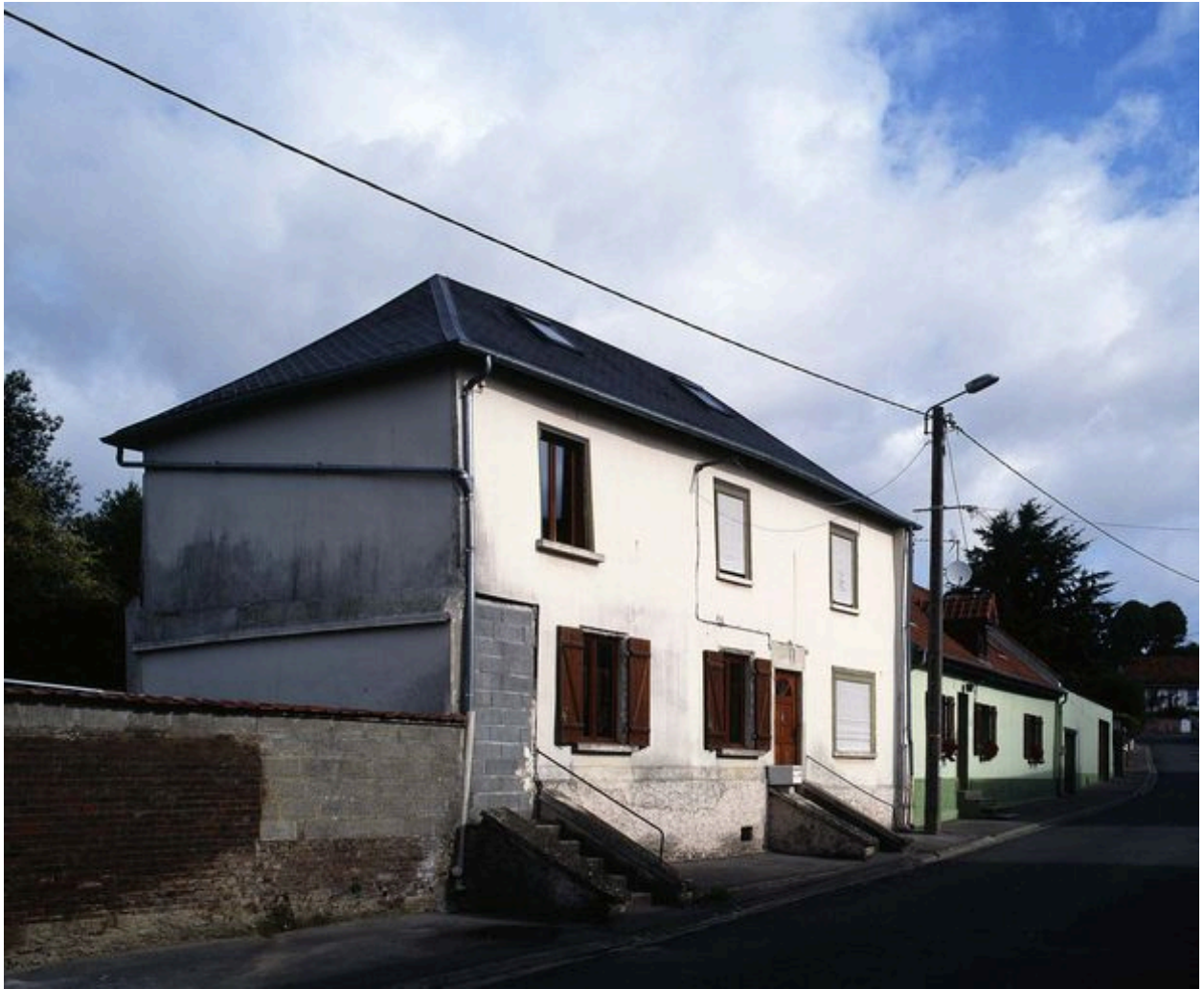
Pernois, ancienne école primaire de garçons et mairie, 1838.