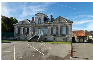
Flixecourt, ancienne maison, puis école primaire de garçons, 1895.