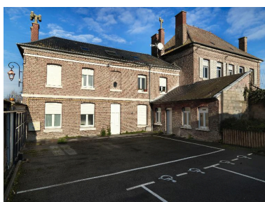
Flixecourt, ancienne école primaire de filles, 1848.