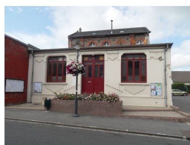
Saint-Ouen, salle des fêtes, vers 1920. IVR22_20108001508NUCA