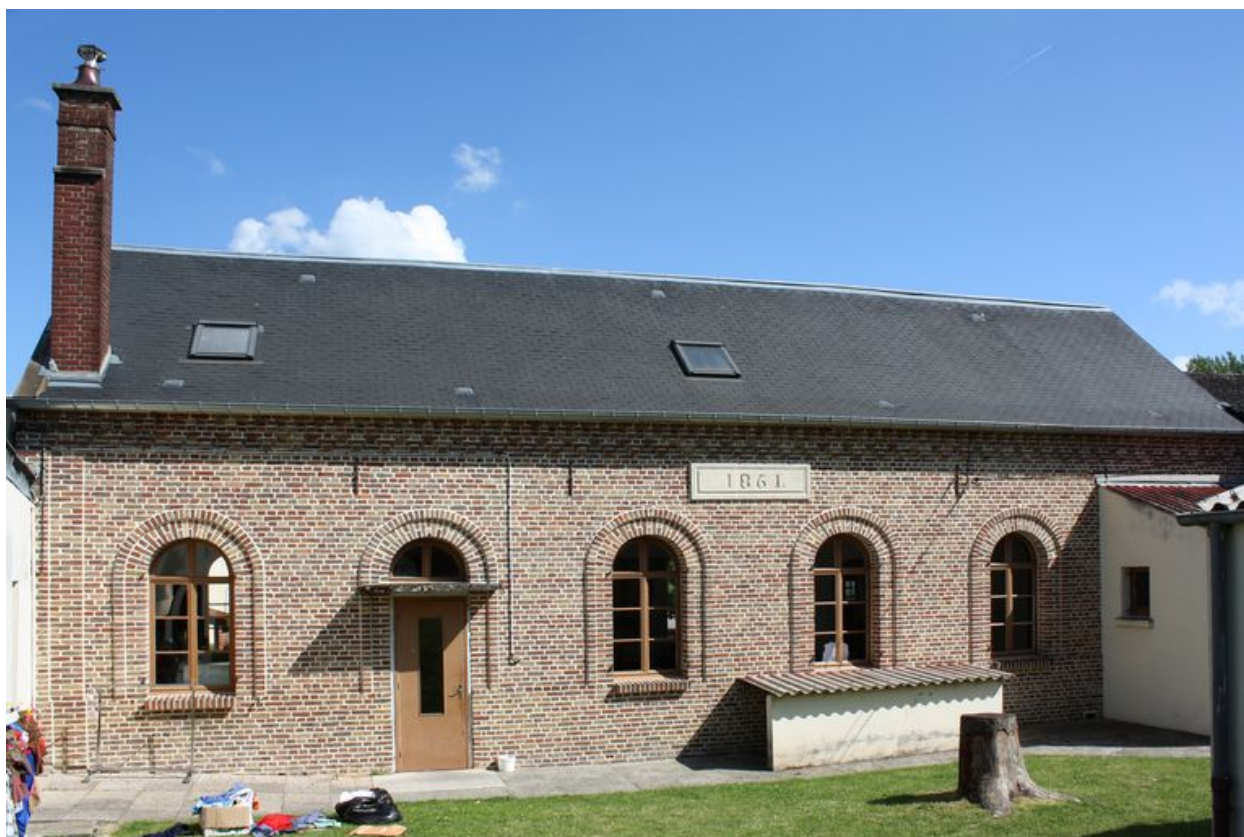
Ville-le-Marlet, ancienne école primaire de filles, Jean Herbault architecte, 1861.