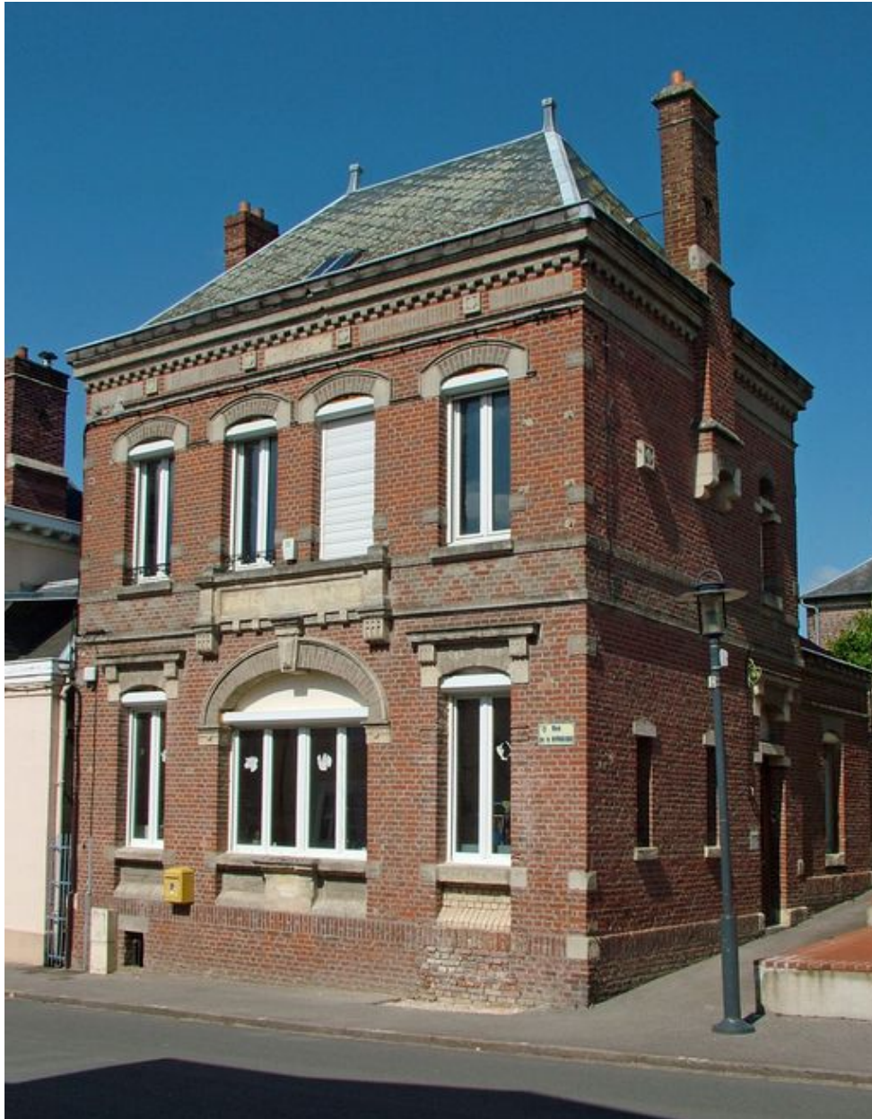
Saint-Ouen, ancienne poste, Anatole Bienaimé architecte, 1902.