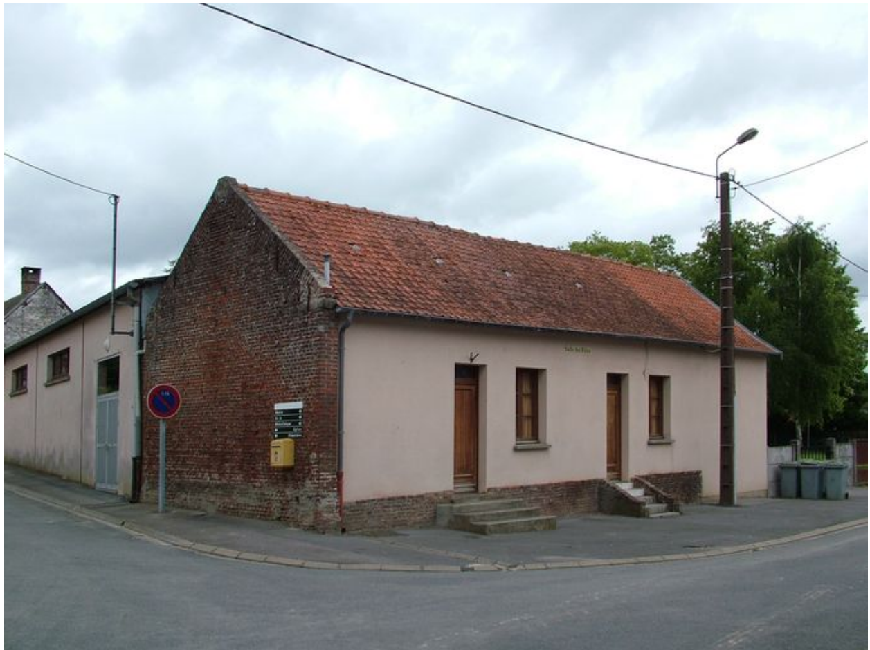
Pernois, ancienne école primaire de filles et mairie, 1re moitié du 19e siècle.