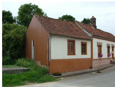
Bouchon, ancienne salle communale, 4 e quart du 18 e siècle. IVR22_20098005261NUCA