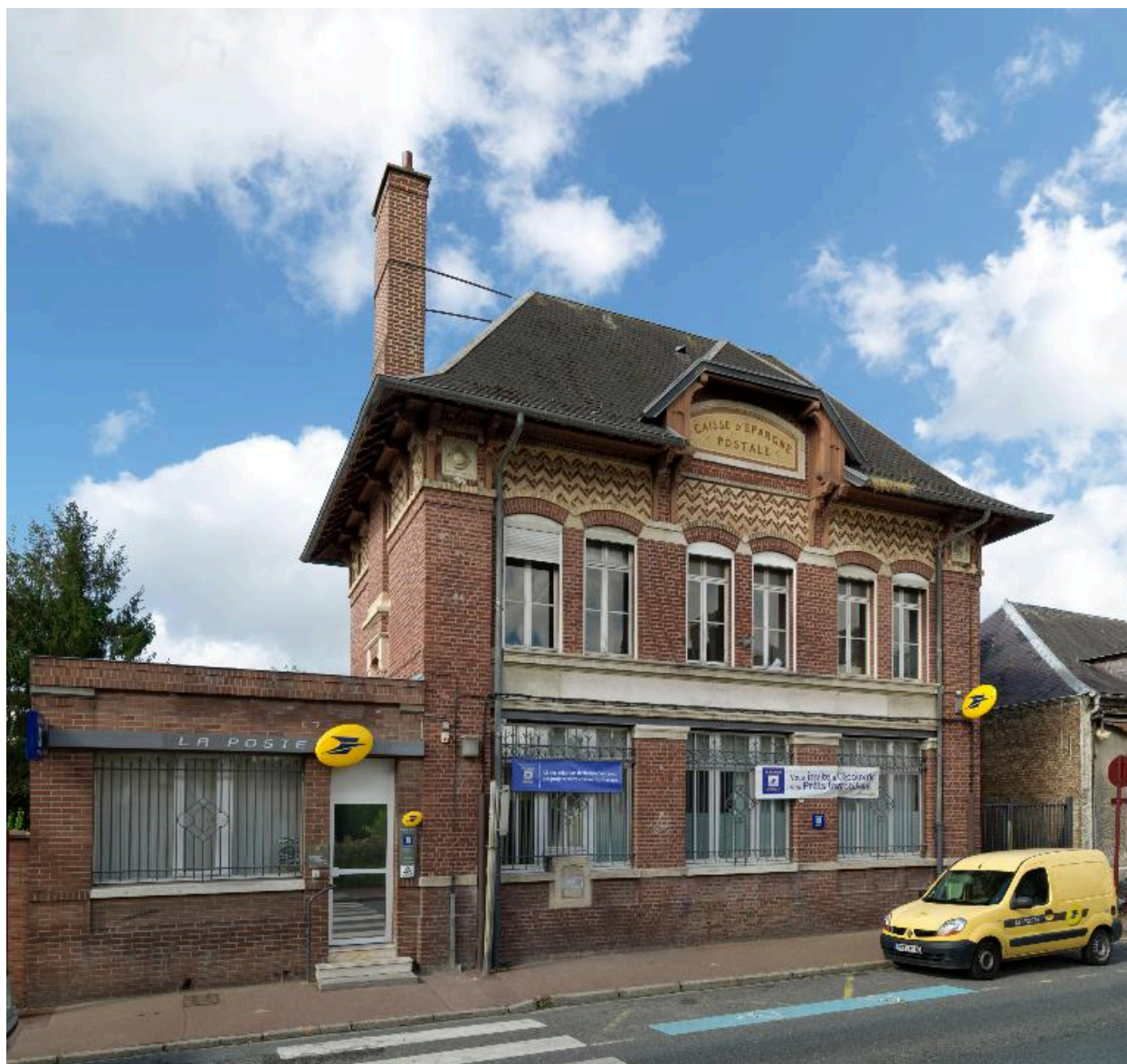
Flixecourt, poste, 1913.