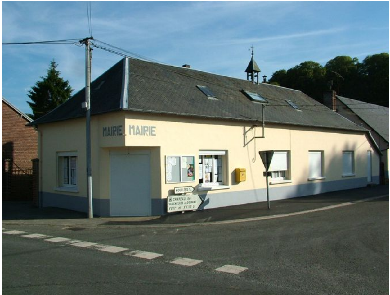
Vauchelles-lès-Domart, mairie, 1874 et 1976.