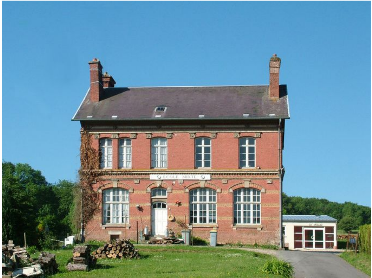
Franqueville, mairie, Emile Ricquier architecte, 1903.