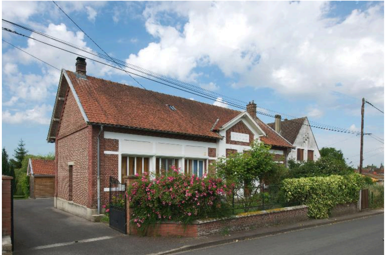
L'Étoile, ancienne école maternelle des Moulins-Bleus, 1934.