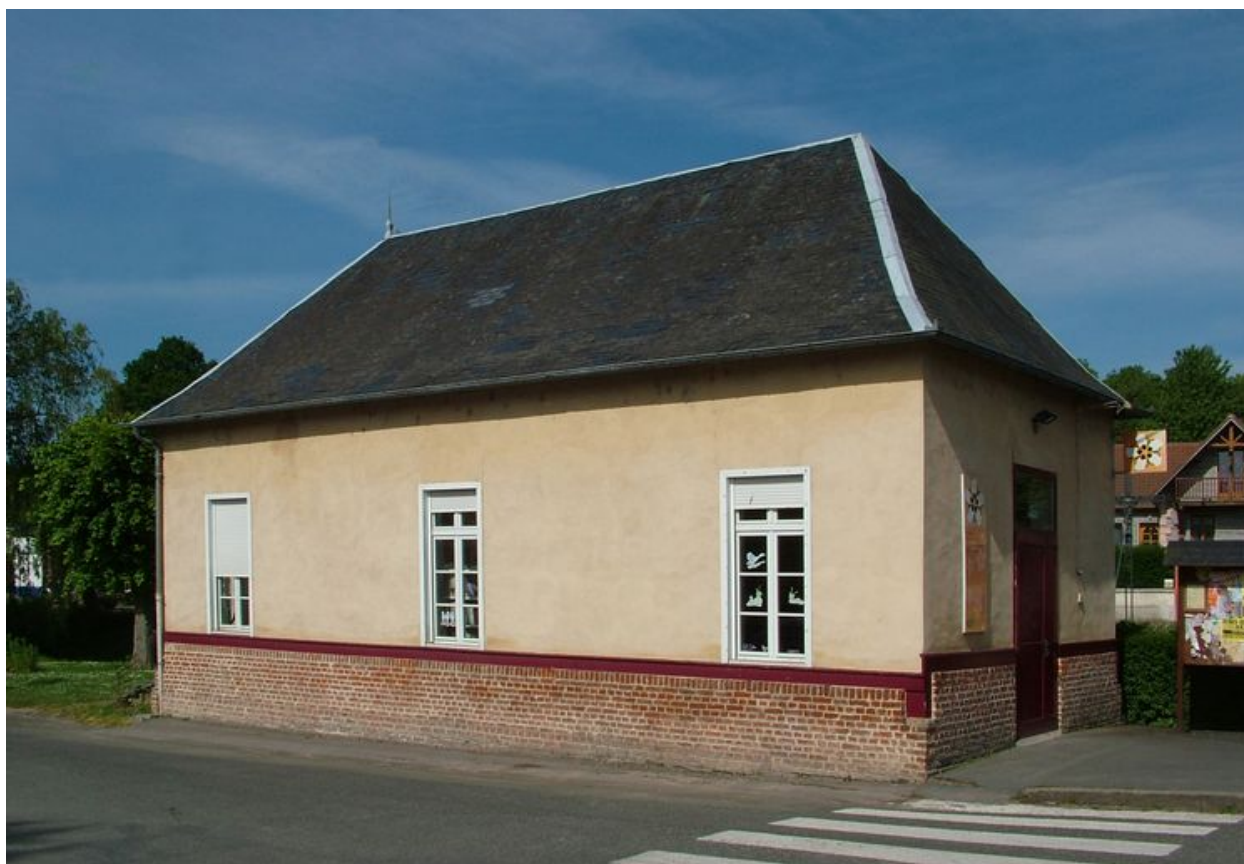
Canaples, ancienne école primaire de garçons puis mairie, 1856 puis 1876, Léon Lourmel charpentier.