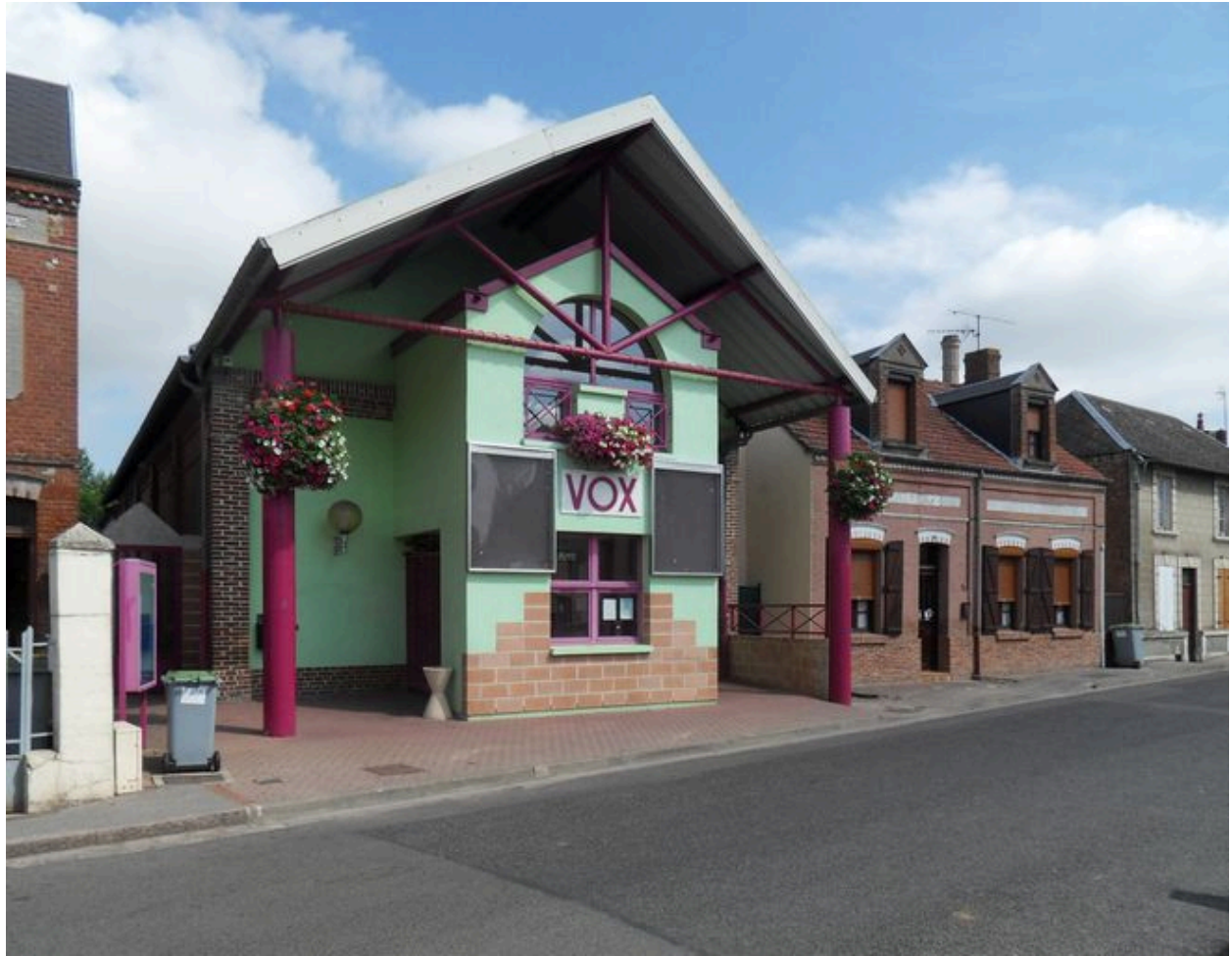
Saint-Ouen, ancienne salle paroissiale, vers 1930.