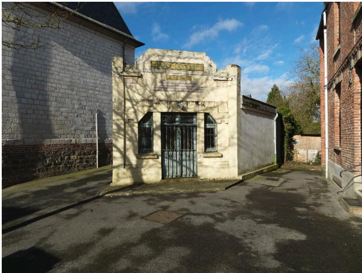
Saint-Ouen, bains-douches, 1934.