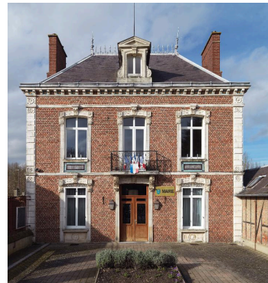
Berteaucourt-les-Dames, ancienne maison devenue mairie, 4 e quart du 19 e siècle. IVR22_20148000095NUC2A