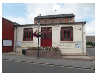
Saint-Ouen, salle des fêtes, vers 1920.