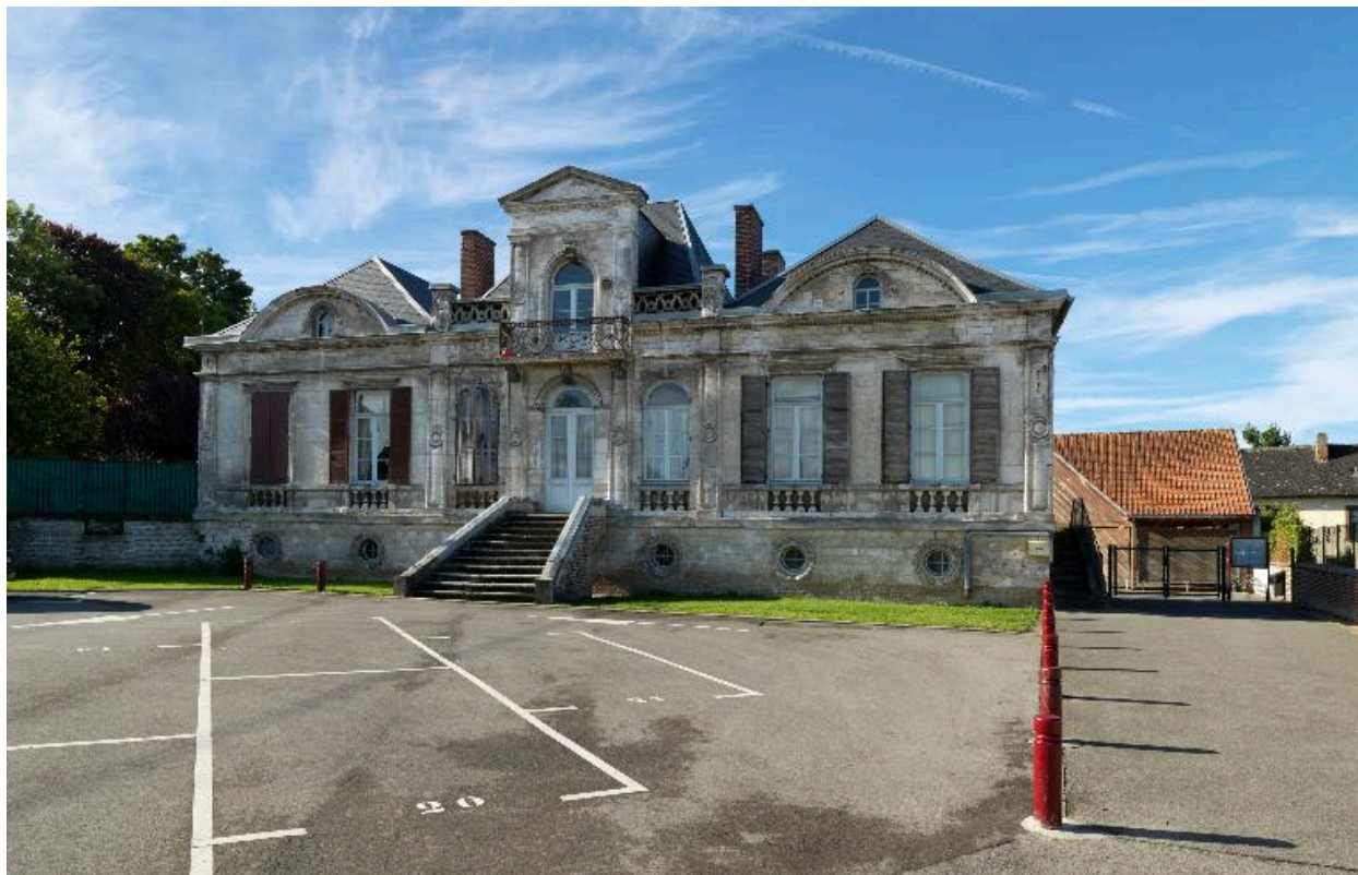
Flixecourt, ancienne maison, puis école primaire de garçons, 1895.