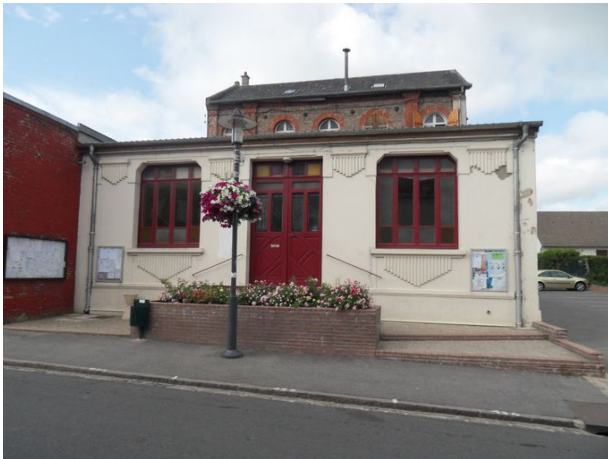
Saint-Ouen, salle des fêtes, vers 1920.