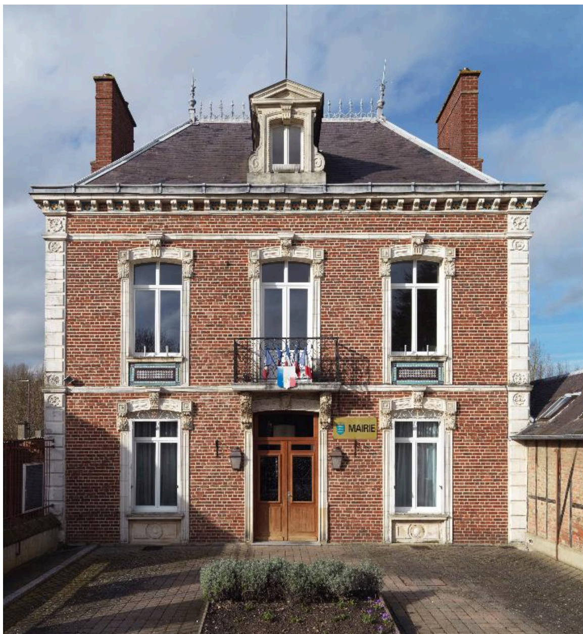
Berteaucourt-les-Dames, ancienne maison devenue mairie, 4e quart du 19e siècle.