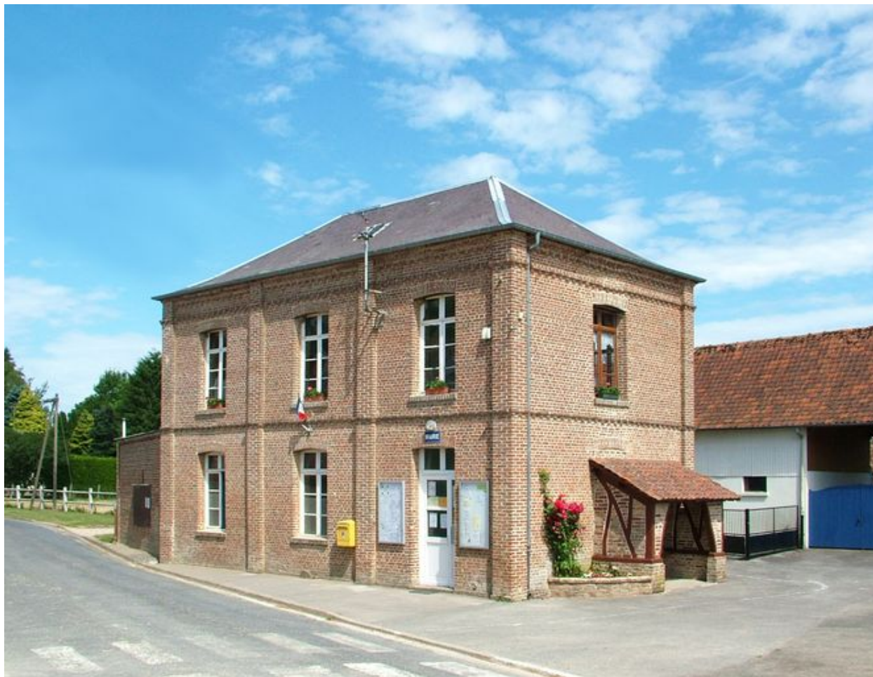
Fransu, mairie et école primaire, Jean-François Fauvel architecte, 1856.