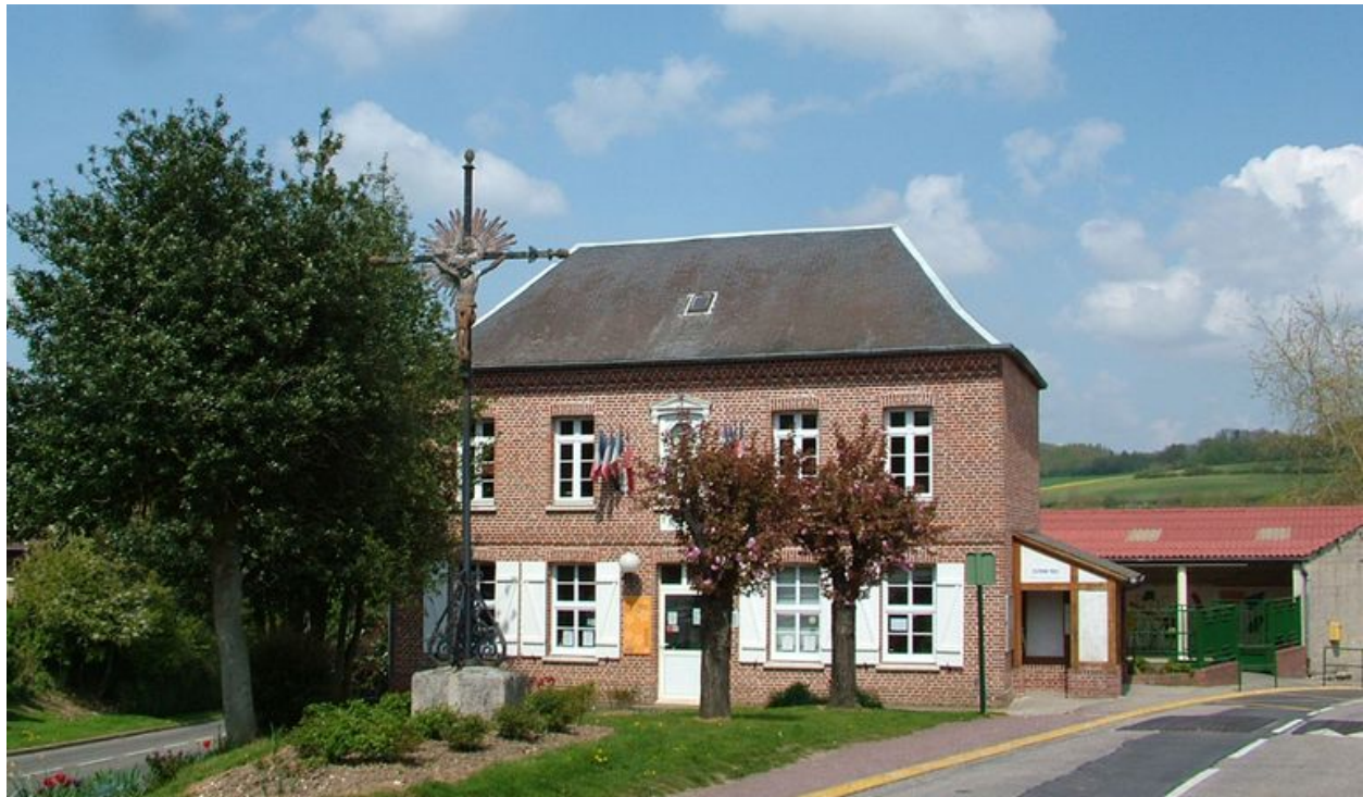
Havernas, mairie et école primaire, 1847.