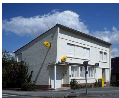
Canaples, poste, 1955 et vers 1970. IVR22_20098000223XA