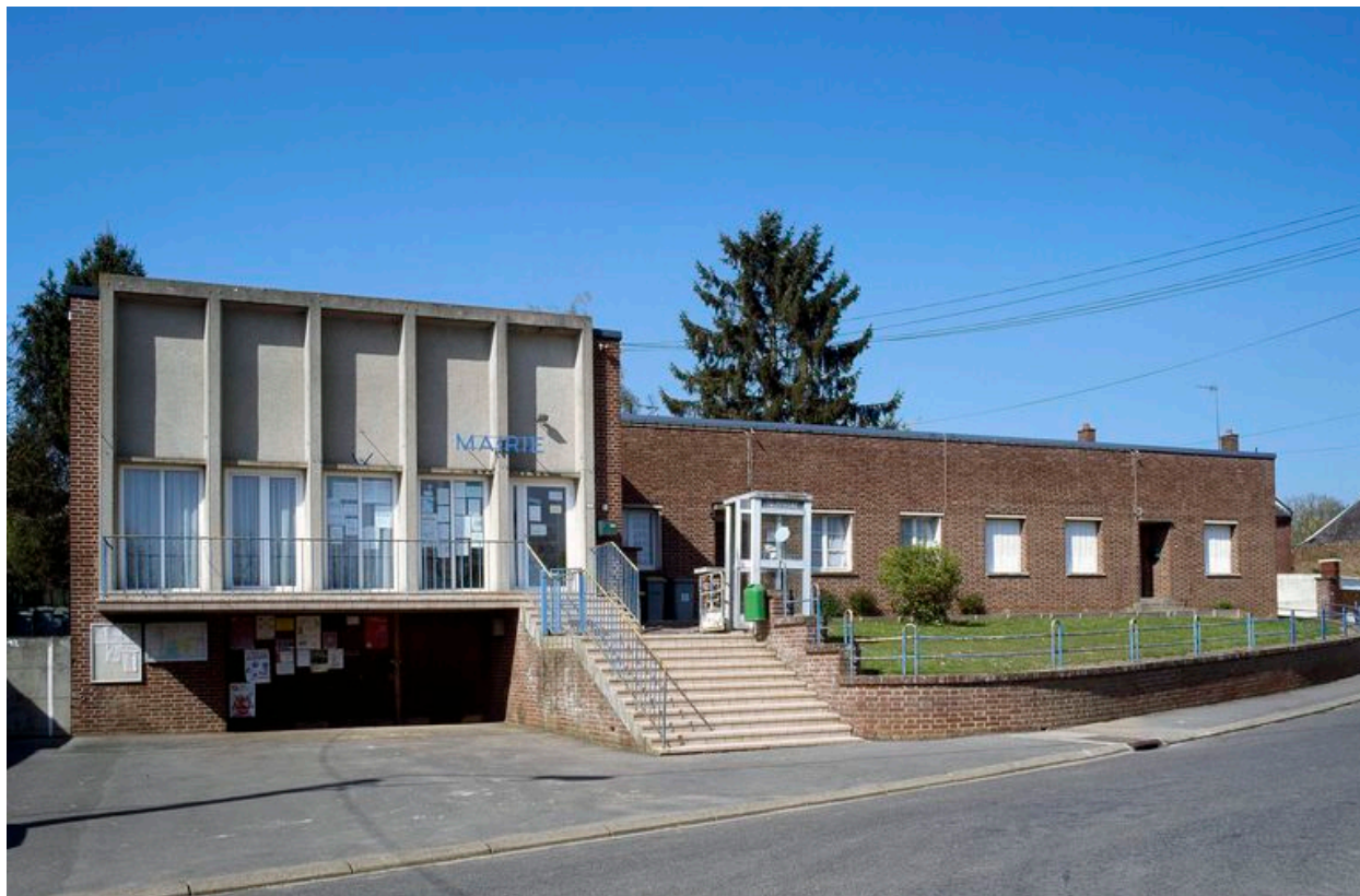
Pernois, mairie, Joseph Andrieu architecte, 1957.