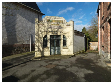
Saint-Ouen, bains-douches, 1934. IVR22_20148000046NUC2A