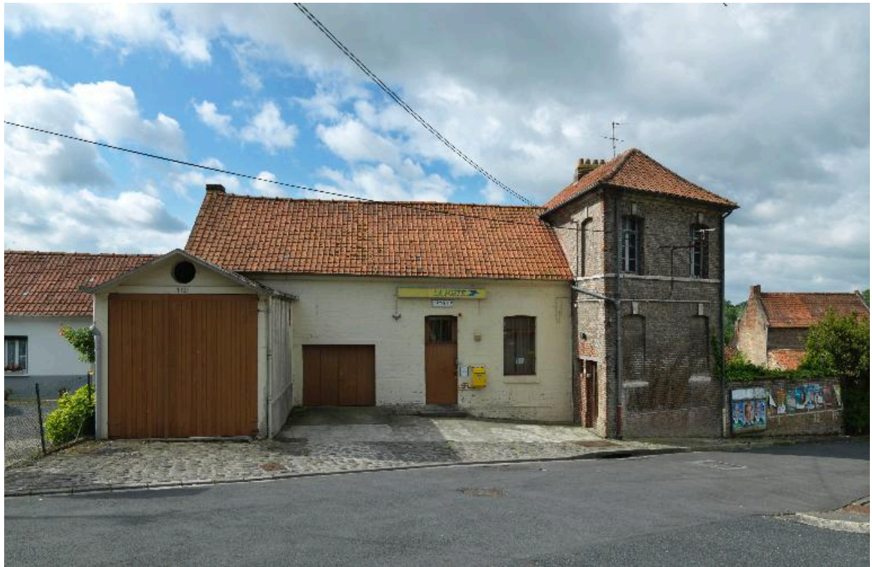
L'Étoile, ancienne école primaire de filles, Louis Henry Antoine architecte (agrandissement), 1870.