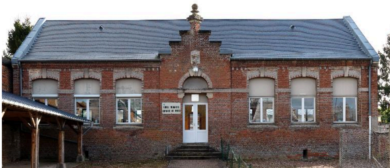
Berteaucourt-les-Dames, ancienne école de filles, Louis Henry Antoine architecte, 1876 et 1894.