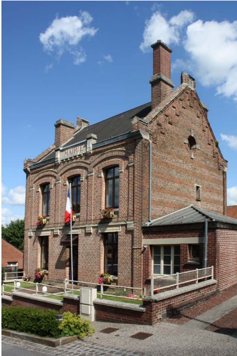
Ville-le-Marlet, mairie et écoles, Anatole Bienaimé architecte, 1883.