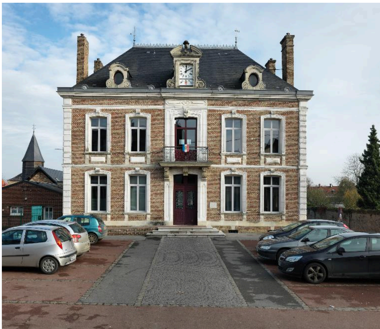
Flixecourt, ancienne maison de directeur, 1880, devenue mairie en 1947.