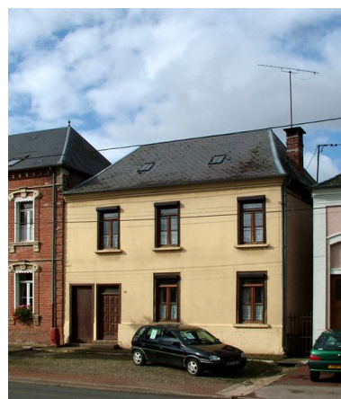
Canaples, ancienne poste, 1887.