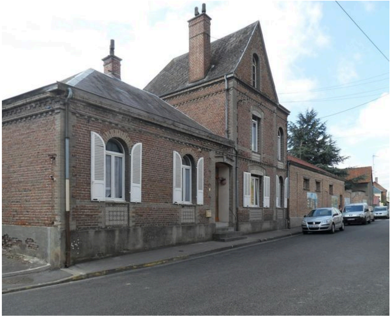
Saint-Ouen, école primaire Notre-Dame, avant 1914.