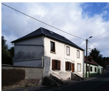
Pernois, ancienne école primaire de garçons et mairie, 1838.