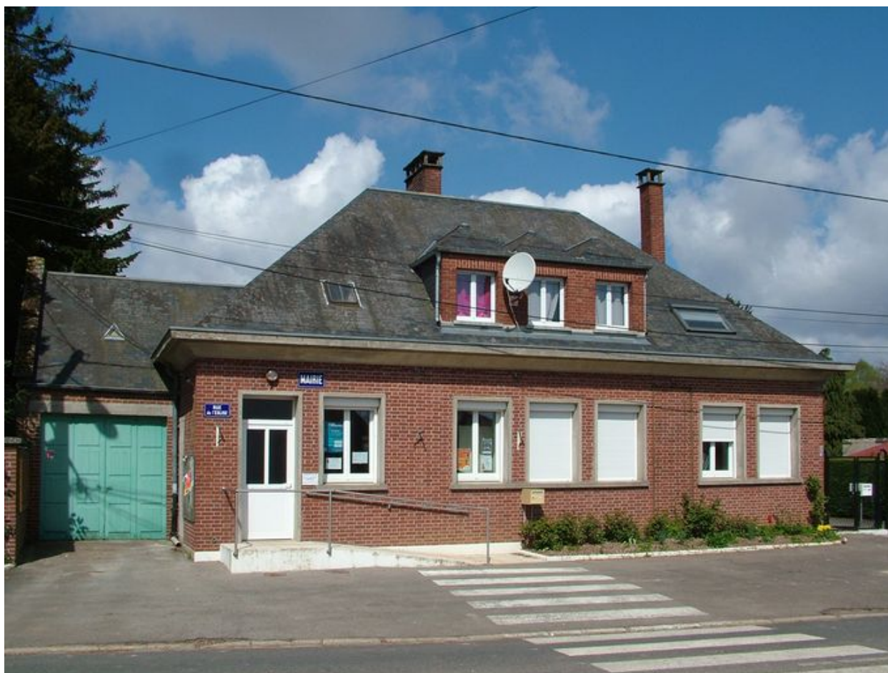
Ribeaucourt, mairie et ancien logement de l'instituteur, Jean Guidée architecte, 1955.