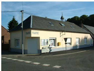
Vauchelles-lès-Domart, mairie, 1874 et 1976. IVR22_20108001695NUCA