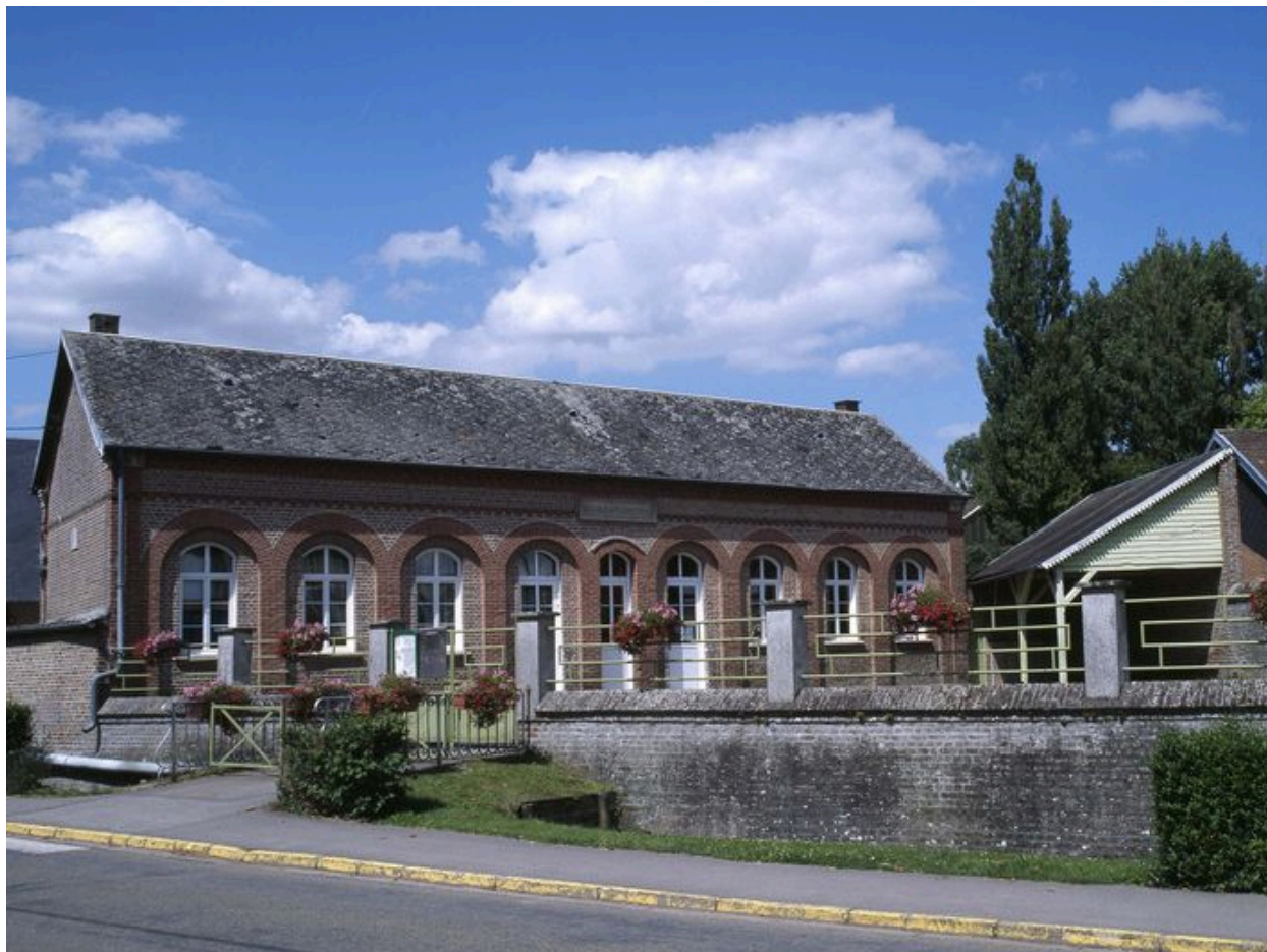
Canaples, école primaire, Louis Henry Antoine architecte, 1862, et Alfred Cuvillier architecte, 1907.