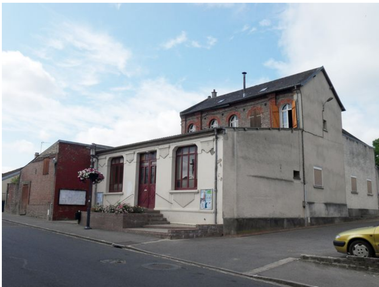
Saint-Ouen, ancienne école primaire de filles, Charles Pinsard architecte, 1862, et mairie, vers 1920.