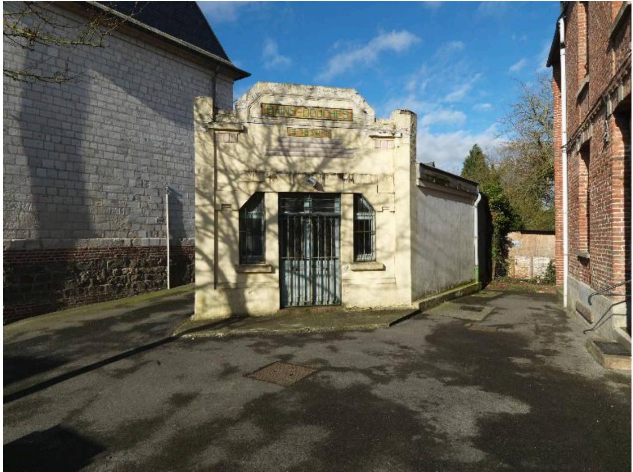
Saint-Ouen, bains-douches, 1934.