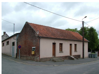
Pernois, ancienne école primaire de filles et mairie, 1re moitié du 19e siècle.