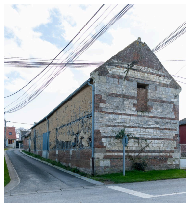
Bâtiments agricoles avec pignon en pierre et brique, n°39 Grande Rue, vue depuis le nord. IVR32_20226000059NUCA