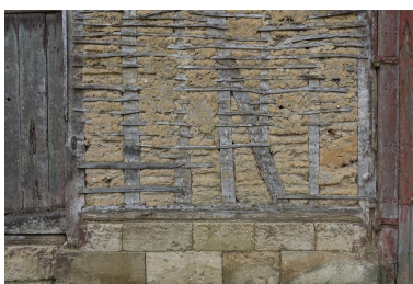
Détail de la mise en œuvre du solin et du torchis pan de bois, grange au n°41 Grande Rue. IVR32_20226005006NUCA