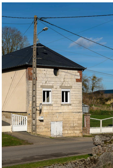
Vue depuis le sud du pignon en pierre du logis au n°42 Grande Rue.