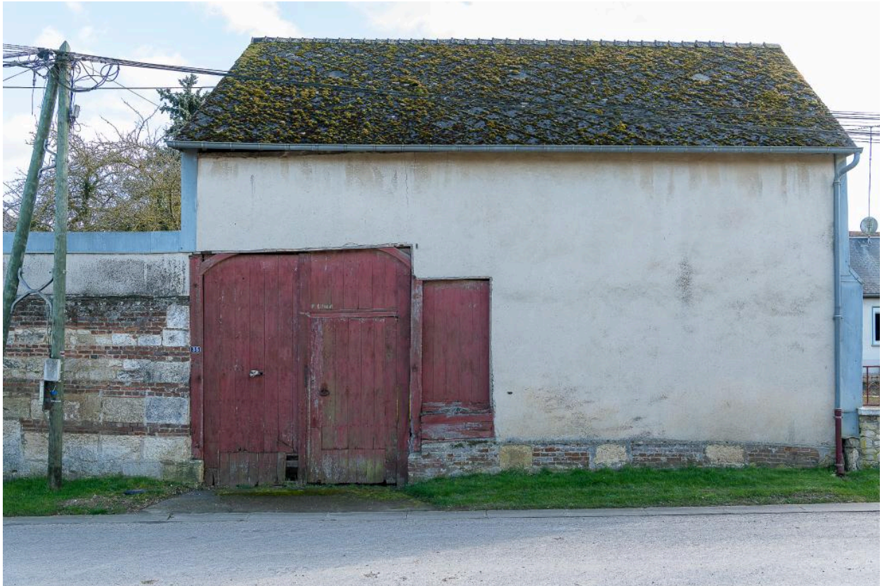
Grange sur rue avec entrée charretière, n°35 Grande Rue, vue depuis le nord.