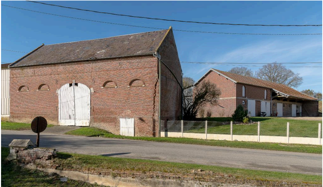
Grange et bâtiment d'étable en arrière-plan construits dans le 1er quart du 20e siècle (?), n°42 Grande Rue.