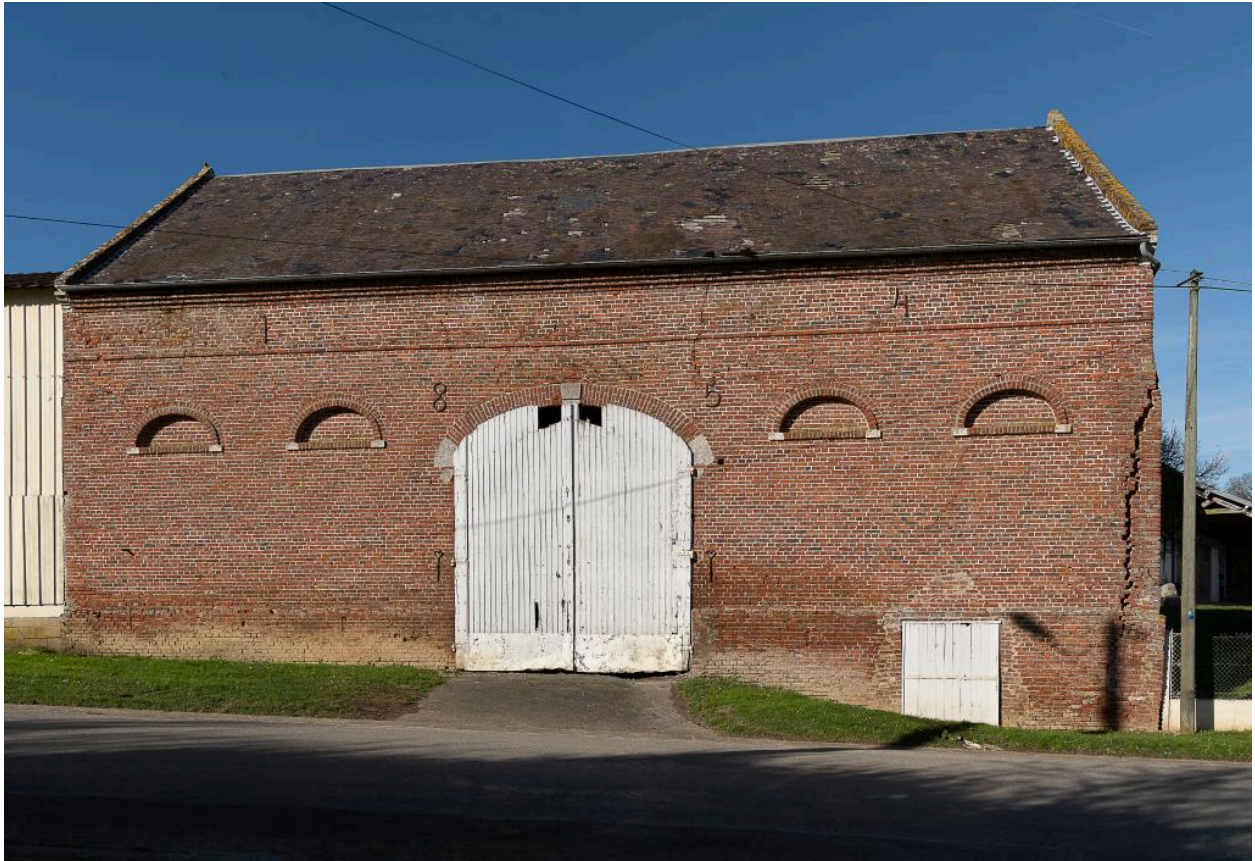
Grange au n°42 Grande rue, vue depuis le sud (date portée : "1854").