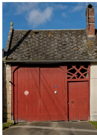
Porte charretière et entrée piétonne surmontée d'une imposte ajourée, n°18 Grande rue, vue depuis le sud.