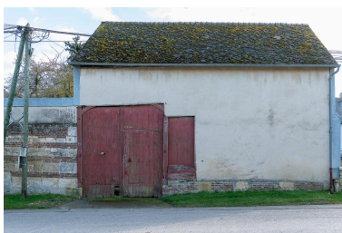
Grange sur rue avec entrée charretière, n°35 Grande Rue, vue depuis le nord. IVR32_20226000058NUCA