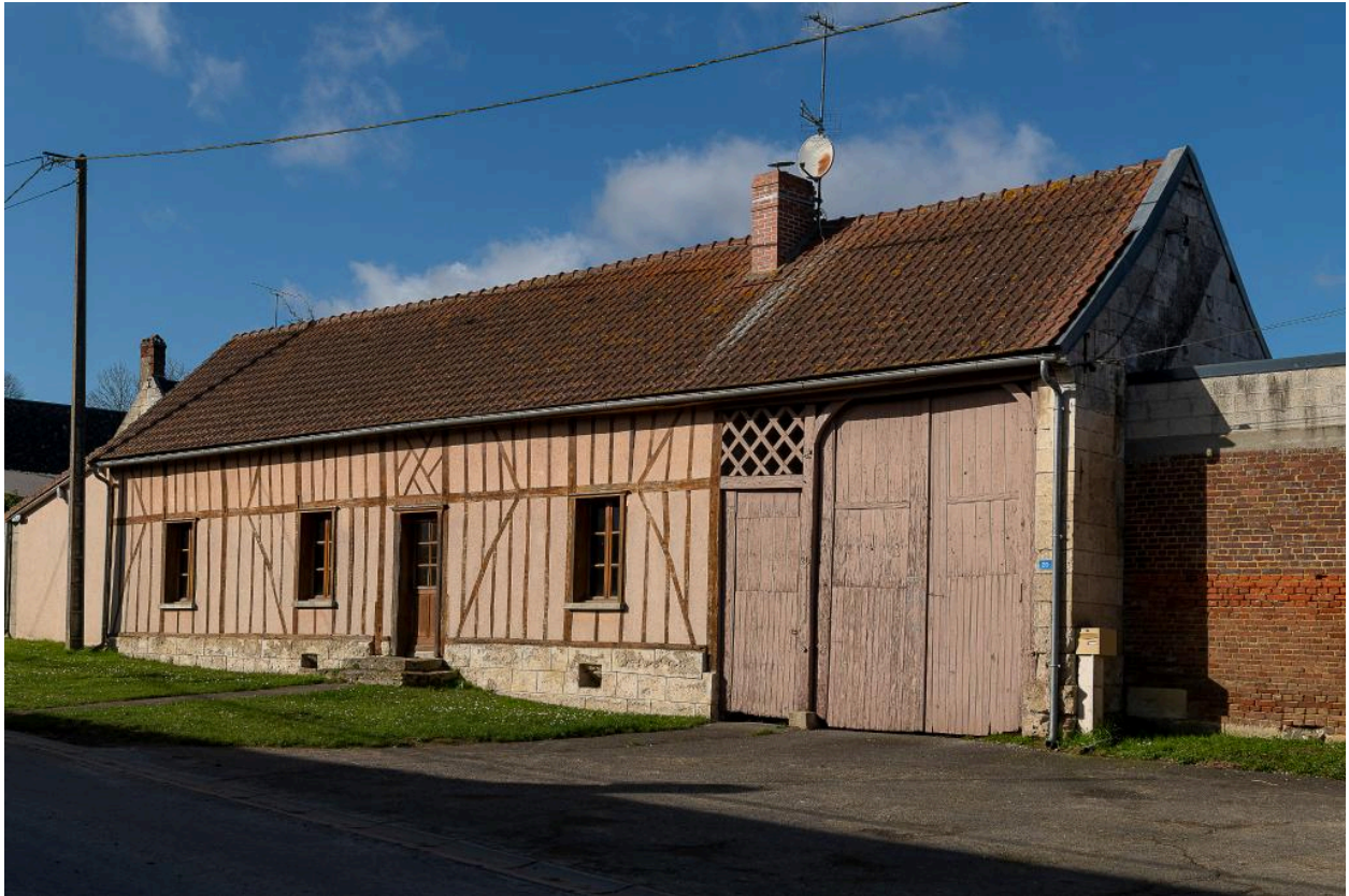
Logis prolongé d'une porte piétonne et d'une entrée charretière, n°20 Grande Rue, vue depuis le sud-est.