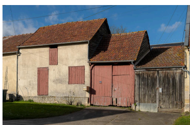
Bâtiment de grange et d'atelier de serger (?) prolongé d'une entrée charretière, n°26 Grande Rue, vue depuis le sud.