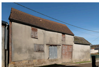
Ancien bâtiment de grange avec entrée charretière et atelier de serger (?), n°25 Grande Rue (côté rue du Colombier).