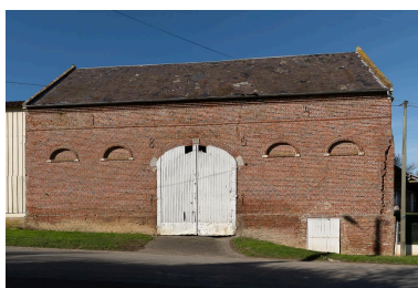
Grange au n°42 Grande rue, vue depuis le sud (date portée : "1854").