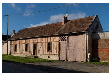
Logis prolongé d'une porte piétonne et d'une entrée charretière, n°20 Grande Rue, vue depuis le sud-est.