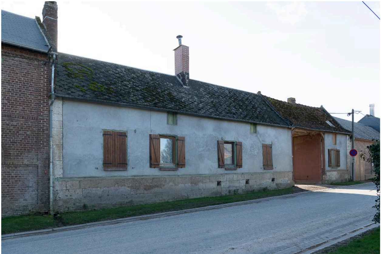
Logis de ferme sur rue prolongé d'une entrée charretière, n°19 Grande Rue, vu depuis le nord-est.