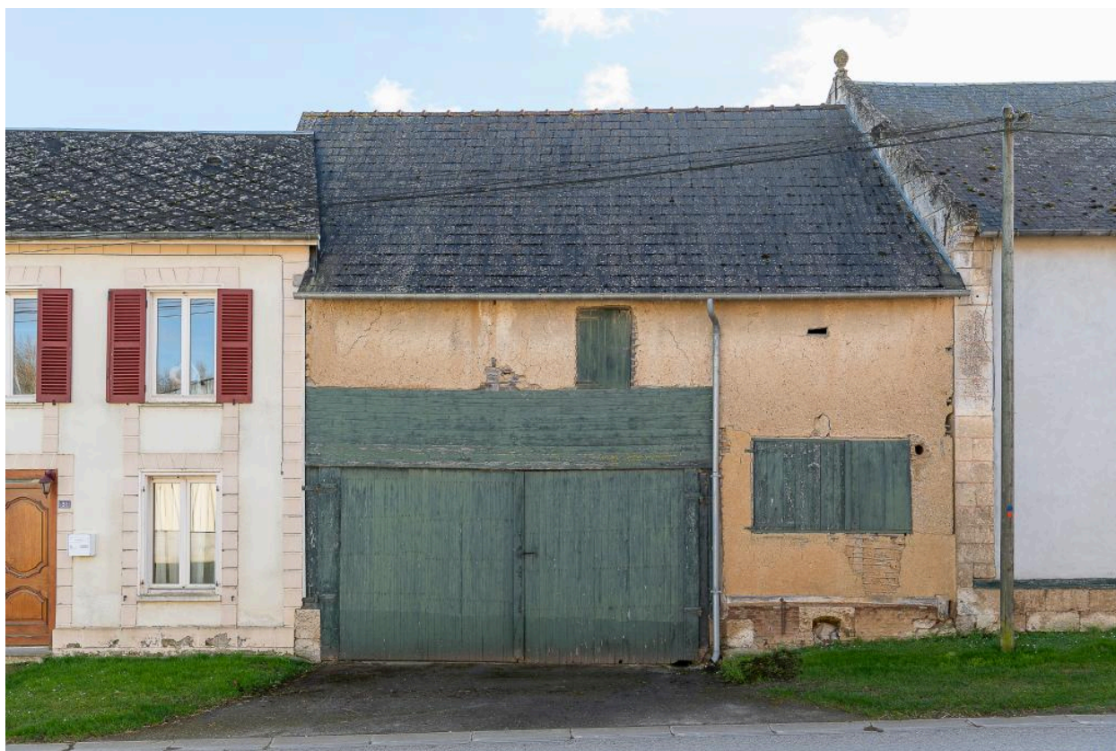
Ancien atelier de serger (?), n°31 Grande Rue, vue depuis le nord.