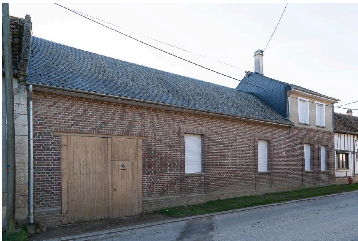
Logis sur rue reconstruit au milieu du 20e siècle, n°21 Grande Rue, vue depuis le nord-est.