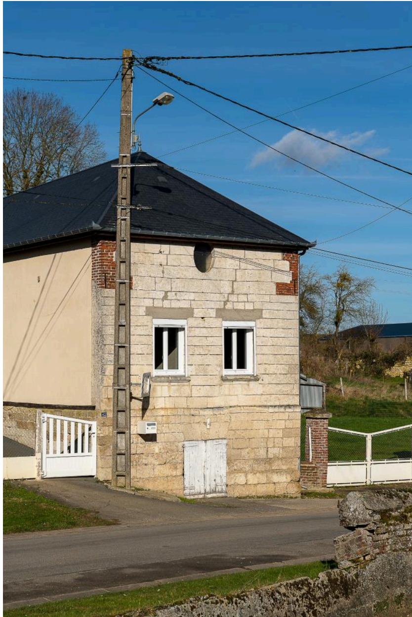
Vue depuis le sud du pignon en pierre du logis au n°42 Grande Rue.