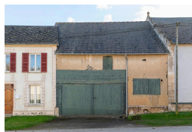
Ancien atelier de serger (?), n°31 Grande Rue, vue depuis le nord.