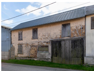
Ancienne maison de serger avec logis et atelier, n°4 rue du Calvaire, vue depuis l'ouest.