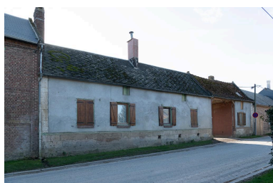
Logis de ferme sur rue prolongé d'une entrée charretière, n°19 Grande Rue, vu depuis le nord-est.