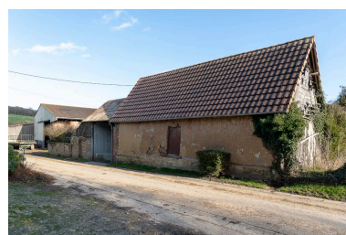
Grange sur rue d'une ancienne petite ferme, n°11 rue du Colombier, vue depuis le nord-ouest.