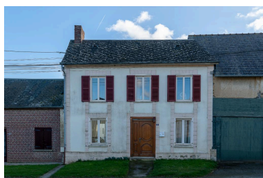
Ancien commerce (?), n°31 Grande Rue, vue depuis le nord. IVR32_20226000051NUCA