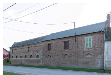
Bâtiments agricoles au n°19 Grande Rue, vue depuis le nord.