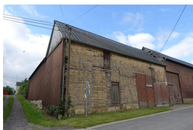
Grange de la ferme au n°41 Grande Rue, vue depuis le nord-est.