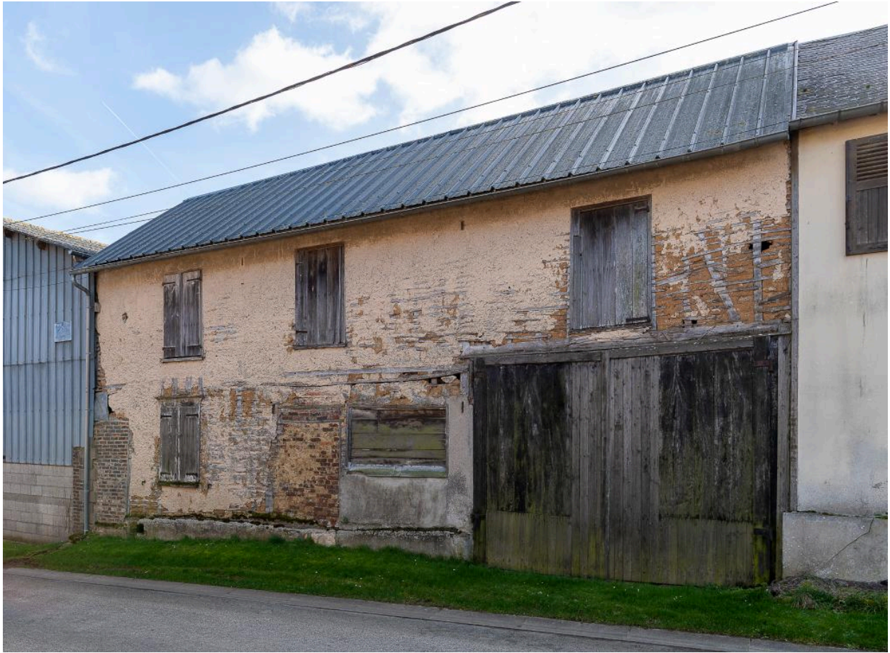
Ancienne maison de serger avec logis et atelier, n°4 rue du Calvaire, vue depuis l'ouest.