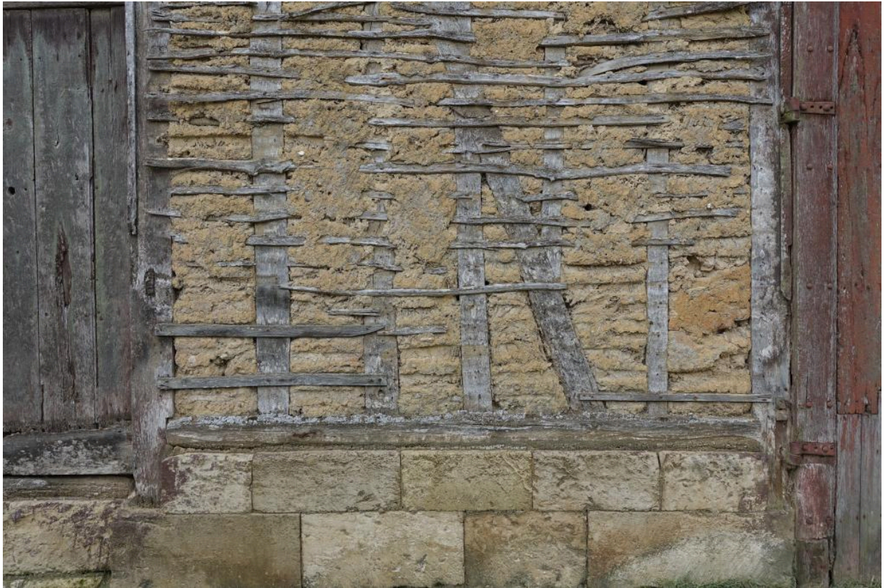
Détail de la mise en œuvre du solin et du torchis pan de bois, grange au n°41 Grande Rue.