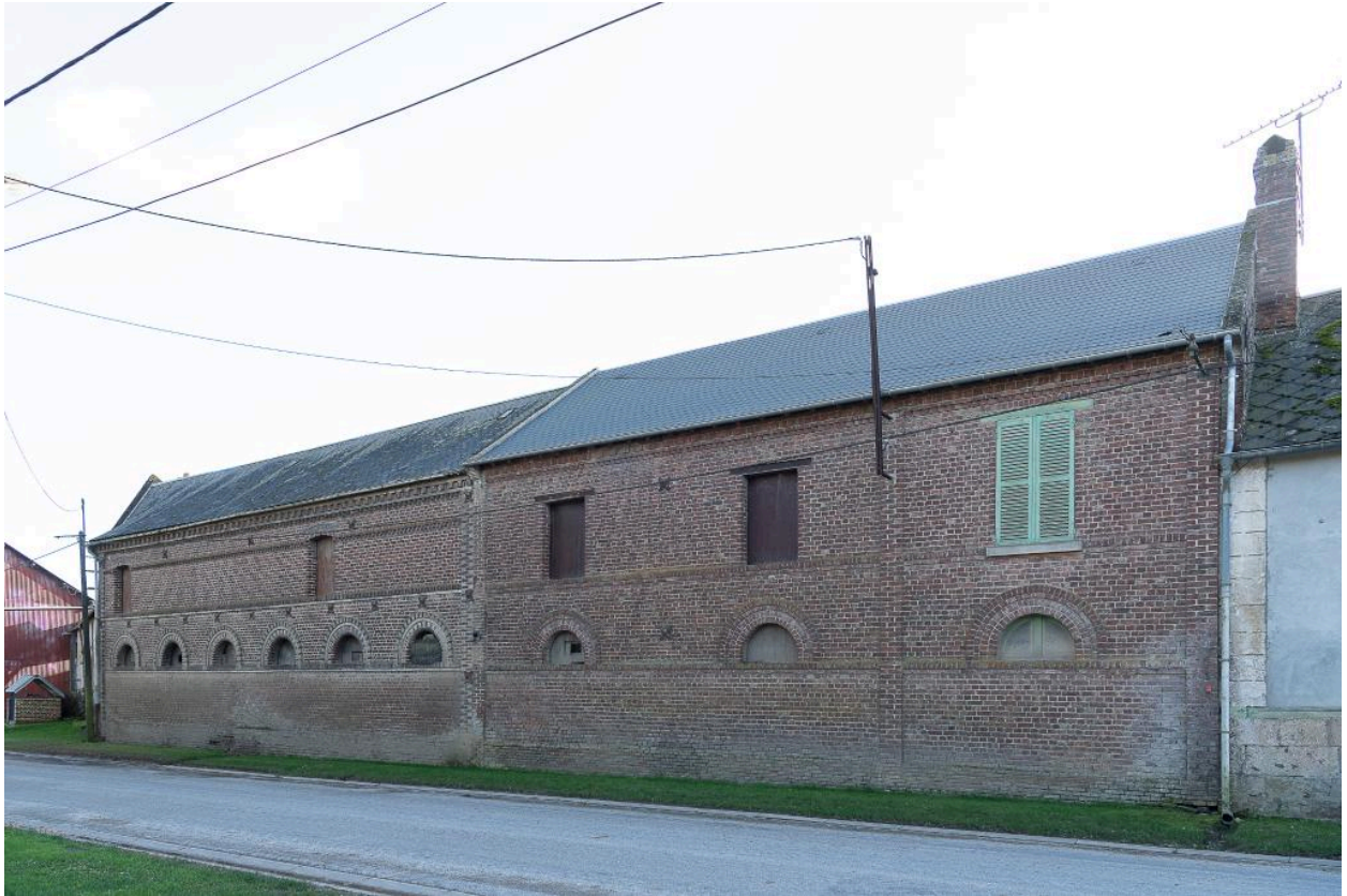
Bâtiments agricoles au n°19 Grande Rue, vue depuis le nord.