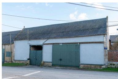
Grange sur rue avec entrée charretière, n°33 Grande Rue, vue depuis le nord. IVR32_20226000056NUCA