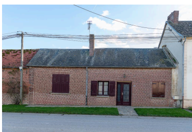
Ancien commerce, n°29 Grande Rue, vue depuis le nord. IVR32_20226000052NUCA