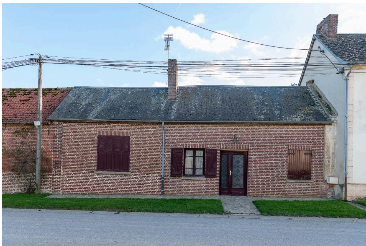
Ancien commerce, n°29 Grande Rue, vue depuis le nord.