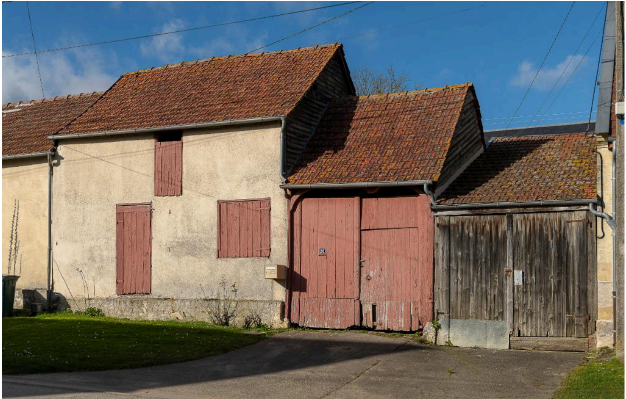
Bâtiment de grange et d'atelier de serger (?) prolongé d'une entrée charretière, n°26 Grande Rue, vue depuis le sud.