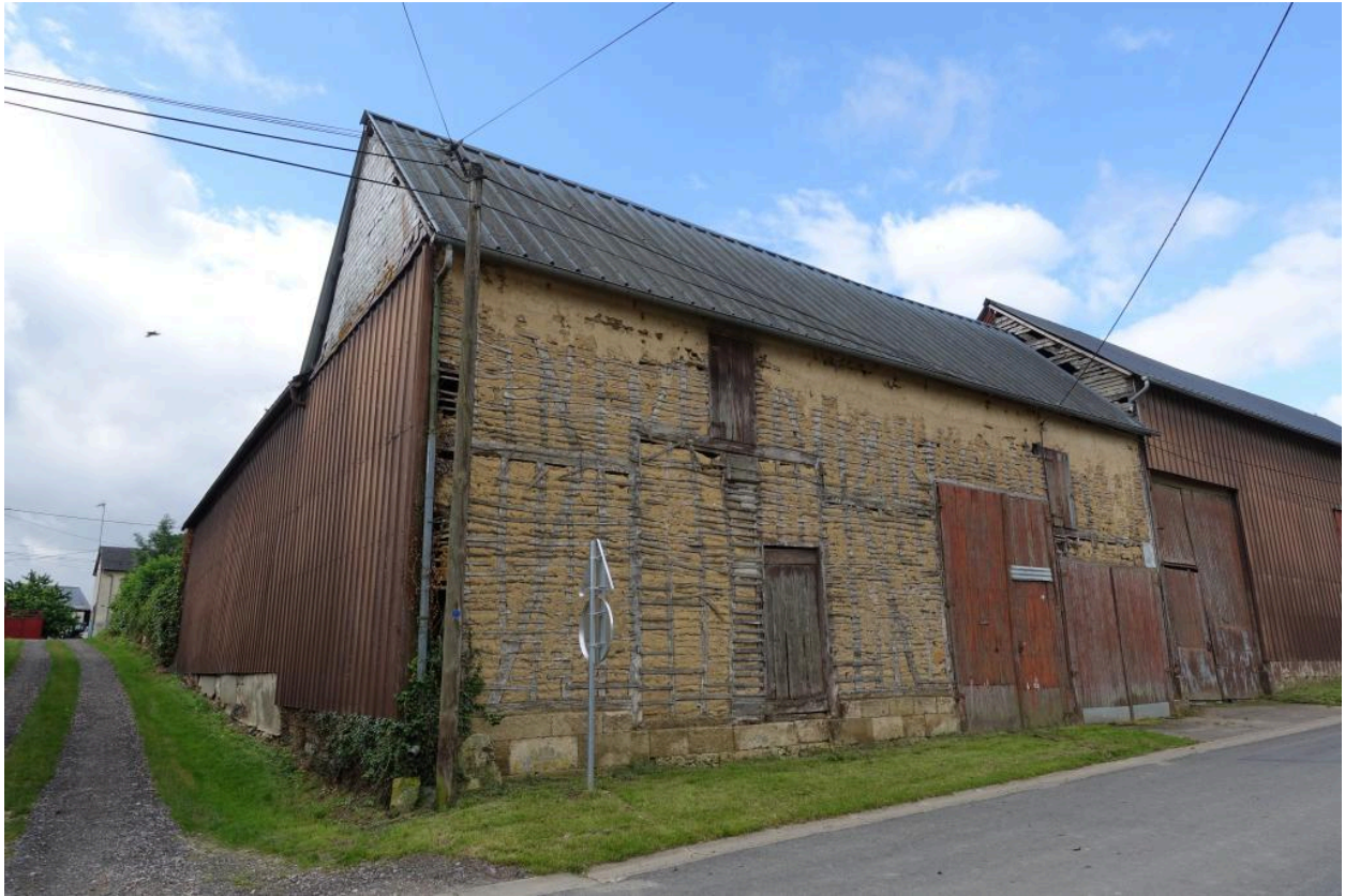
Grange de la ferme au n°41 Grande Rue, vue depuis le nord-est.