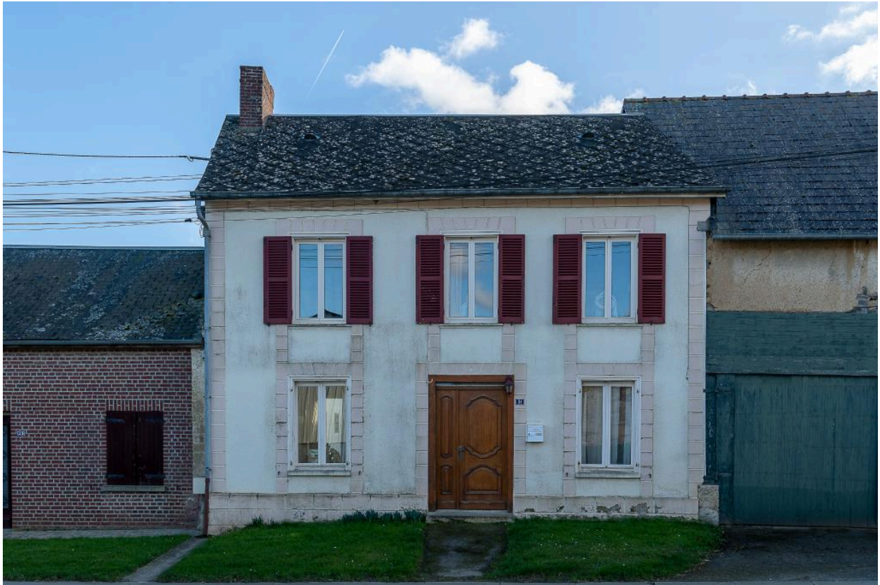
Ancien commerce (?), n°31 Grande Rue, vue depuis le nord.