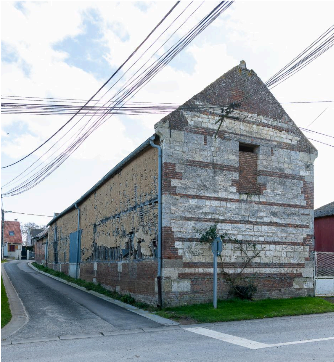
Bâtiments agricoles avec pignon en pierre et brique, n°39 Grande Rue, vue depuis le nord.