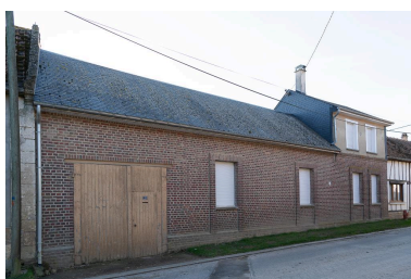
Logis sur rue reconstruit au milieu du 20e siècle, n°21 Grande Rue, vue depuis le nord-est.