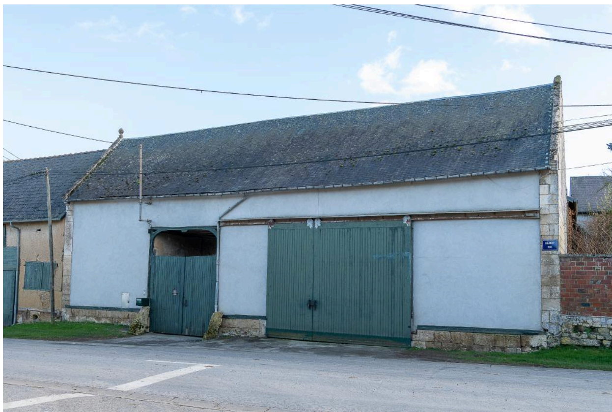
Grange sur rue avec entrée charretière, n°33 Grande Rue, vue depuis le nord.