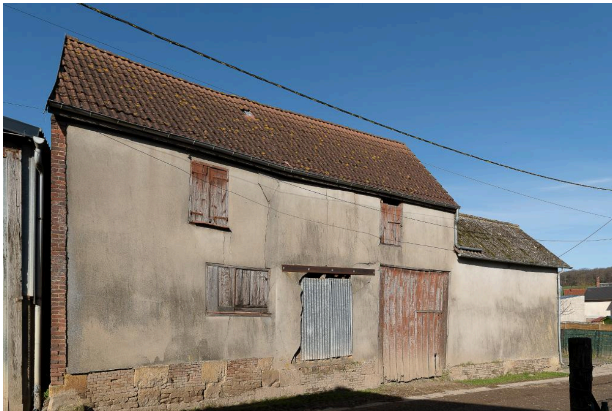
Ancien bâtiment de grange avec entrée charretière et atelier de serger (?), n°25 Grande Rue (côté rue du Colombier).