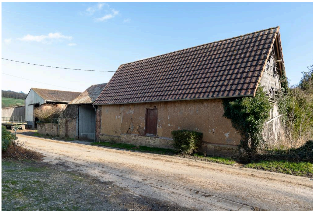
Grange sur rue d'une ancienne petite ferme, n°11 rue du Colombier, vue depuis le nord-ouest.