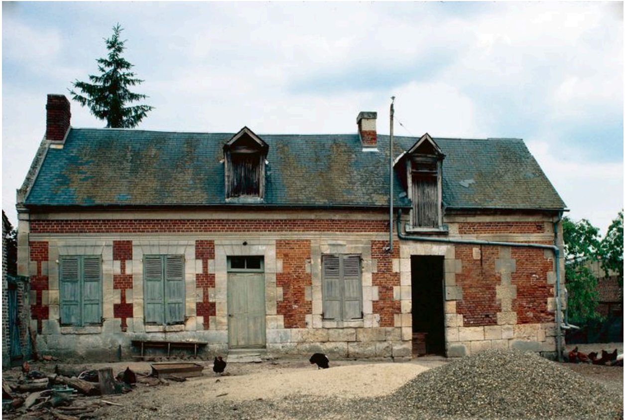
Logis. Elévation antérieure.