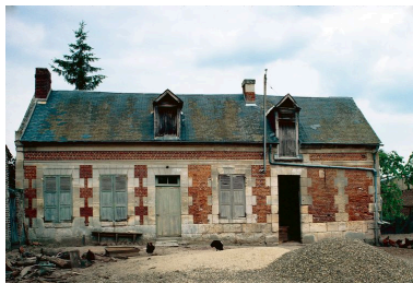
Logis. Elévation antérieure. IVR22_19856000936ZA

IVR22_20096000311NUCA