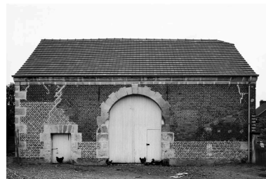
Grange. IVR22_19856000979V