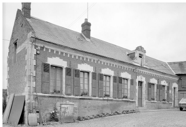
Logis. Elévation antérieure. IVR22_19856001004X