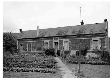
Logis. Elévation postérieure. IVR22_19856001003X