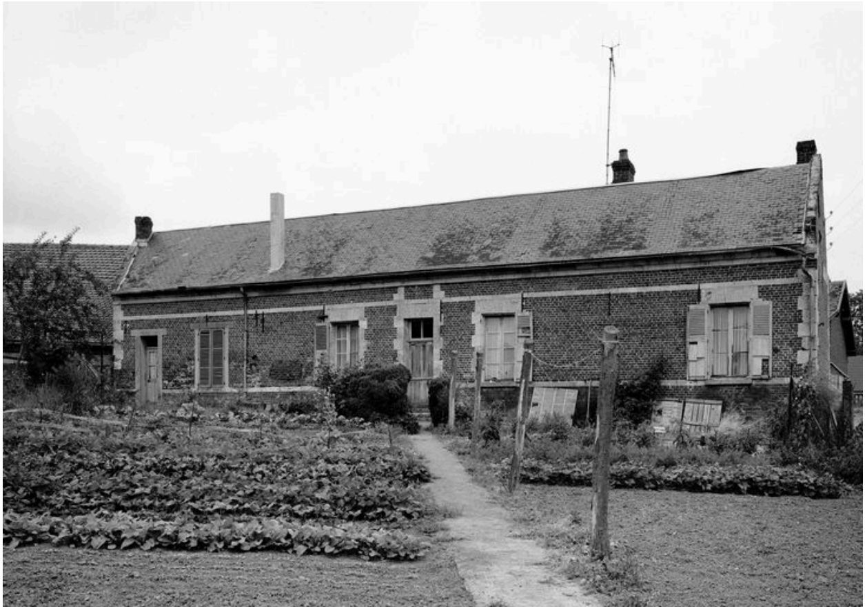
Logis. Elévation postérieure.