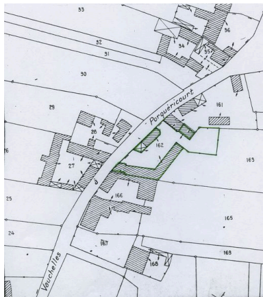
Plan de situation. Extrait du plan cadastral de 1982, section AB 162.