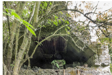
Combles, côté sud IVR31_20145904426NUCA