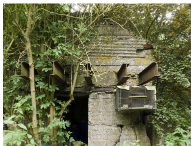
Elévation nord IVR31_20145904427NUCA