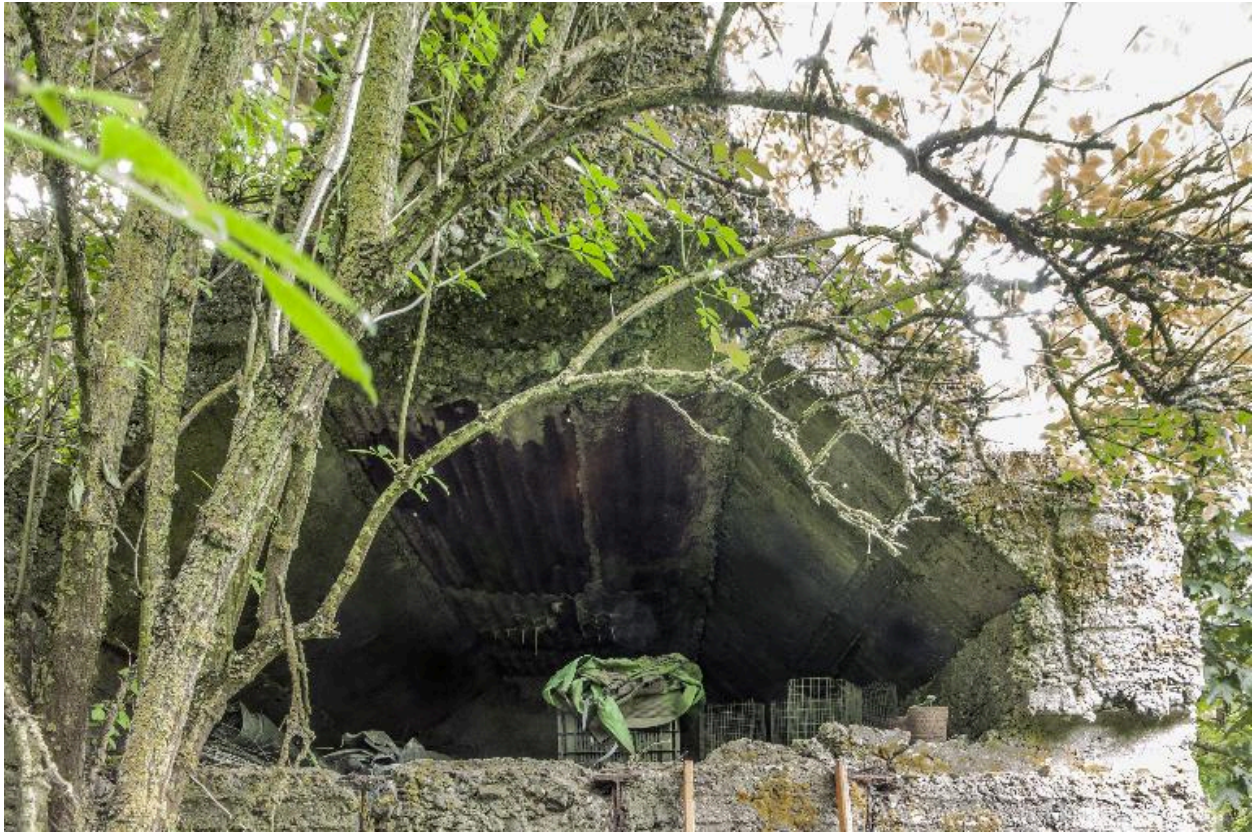
Combles, côté sud