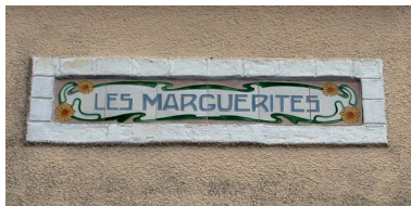
Détail de la frise de céramique portant appellation de la maison.