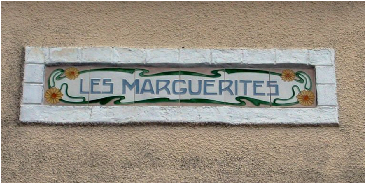
Détail de la frise de céramique portant appellation de la maison.