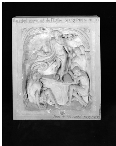
Panneau de retable en albâtre sculpté, 16e siècle, provenant de l'église Saint-Crépin. Collections de la S.H.A.C.T.