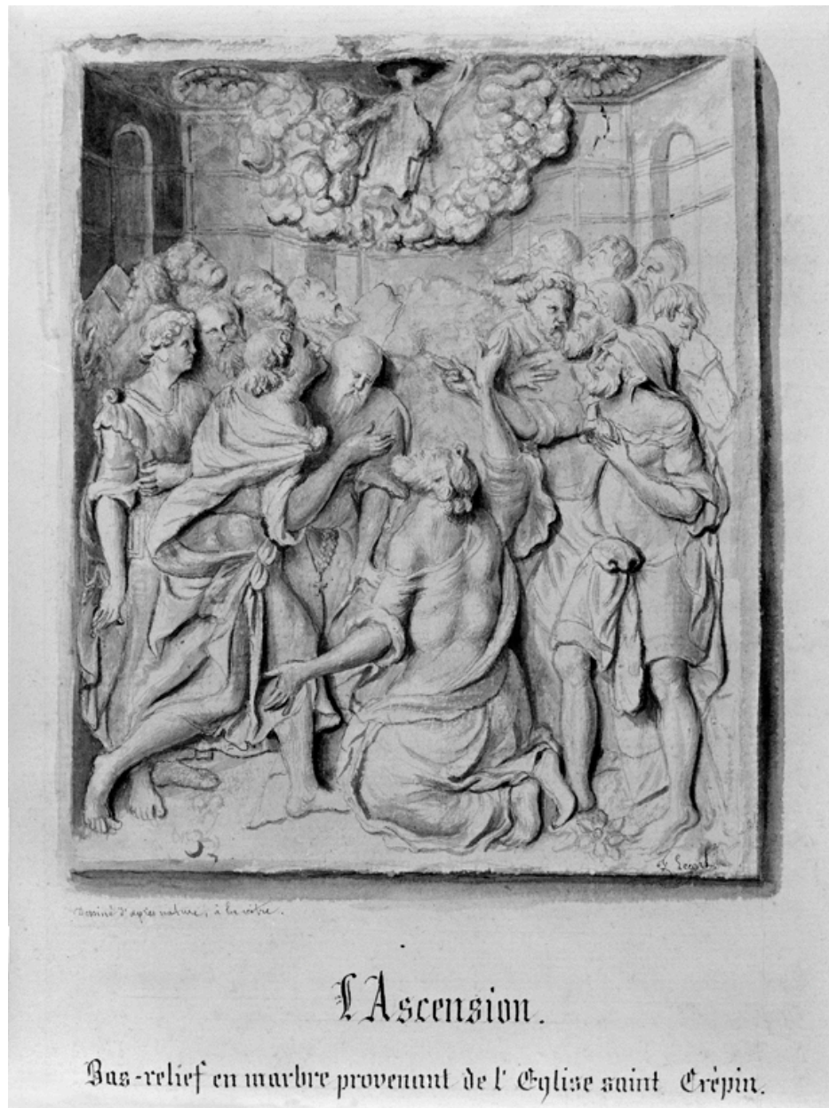
L'Ascension, fragment de retable en albâtre provenant du choeur de l'église Saint-Crépin ; dessin de Lecart, bibliothèque municipale.