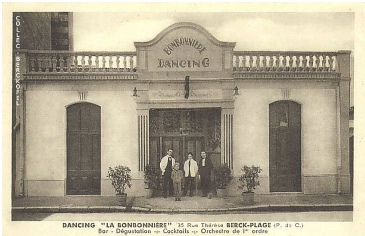
Dancing La Bonbonnière, carte postale, vers 1920 (coll. part.).