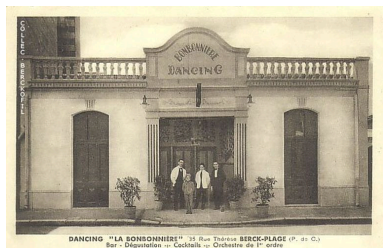
Dancing La Bonbonnière, carte postale, vers 1920 (coll. part.).