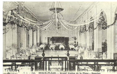
Dancing du Casino de la Plage, carte postale, début 20e siècle (coll. part.). IVR31_20116201565NUCAB