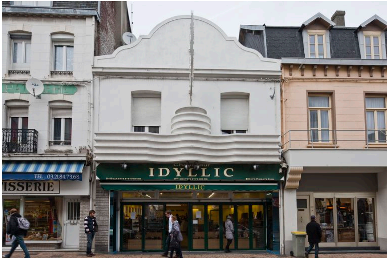
Ancien cinéma rue de l'Impératrice.