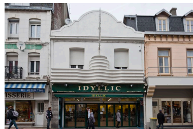
Ancien cinéma rue de l'Impératrice.