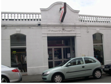
L'ancien dancing La Bonbonnière, 64, rue de la Plage.