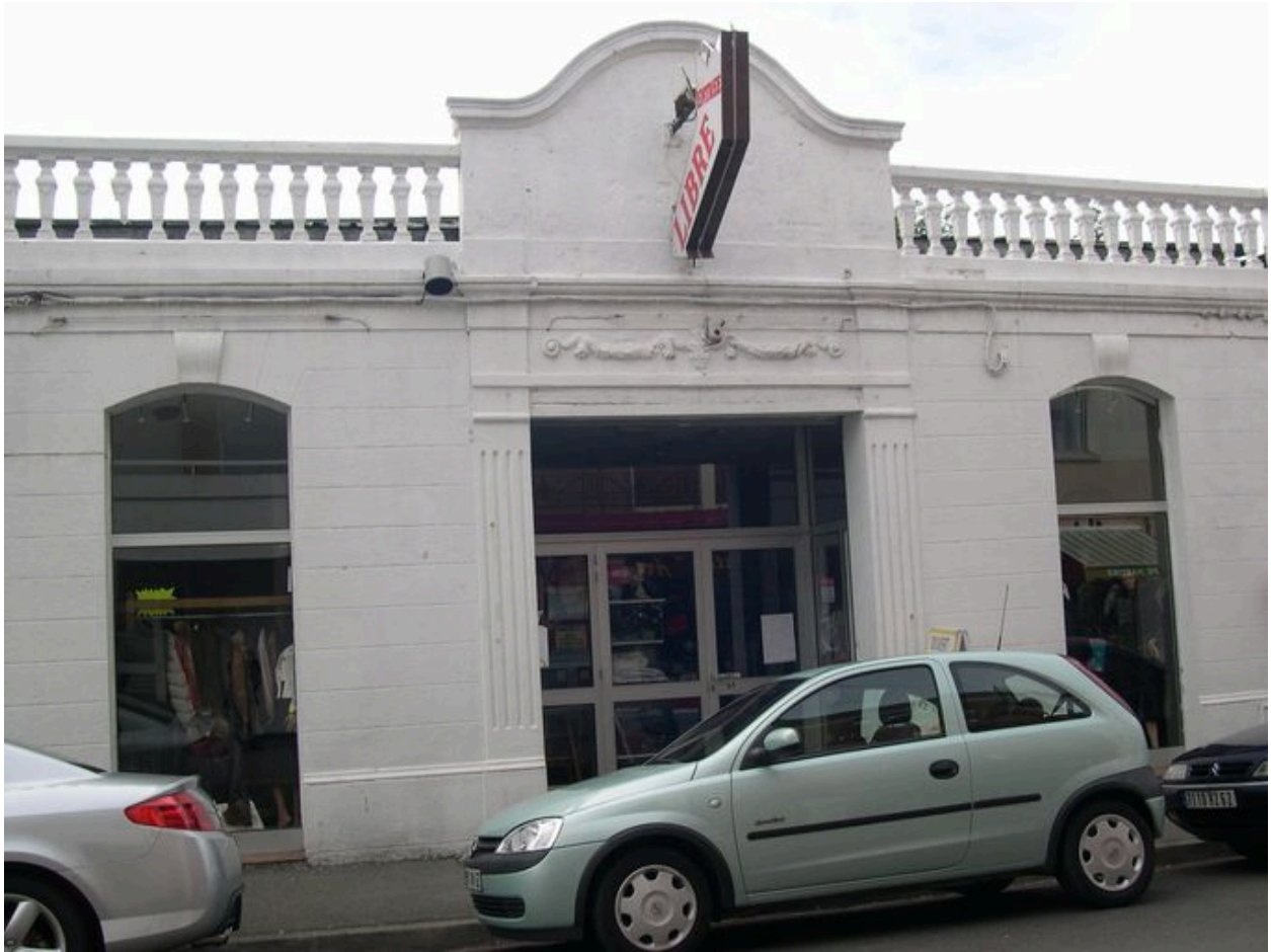
L'ancien dancing La Bonbonnière, 64, rue de la Plage.