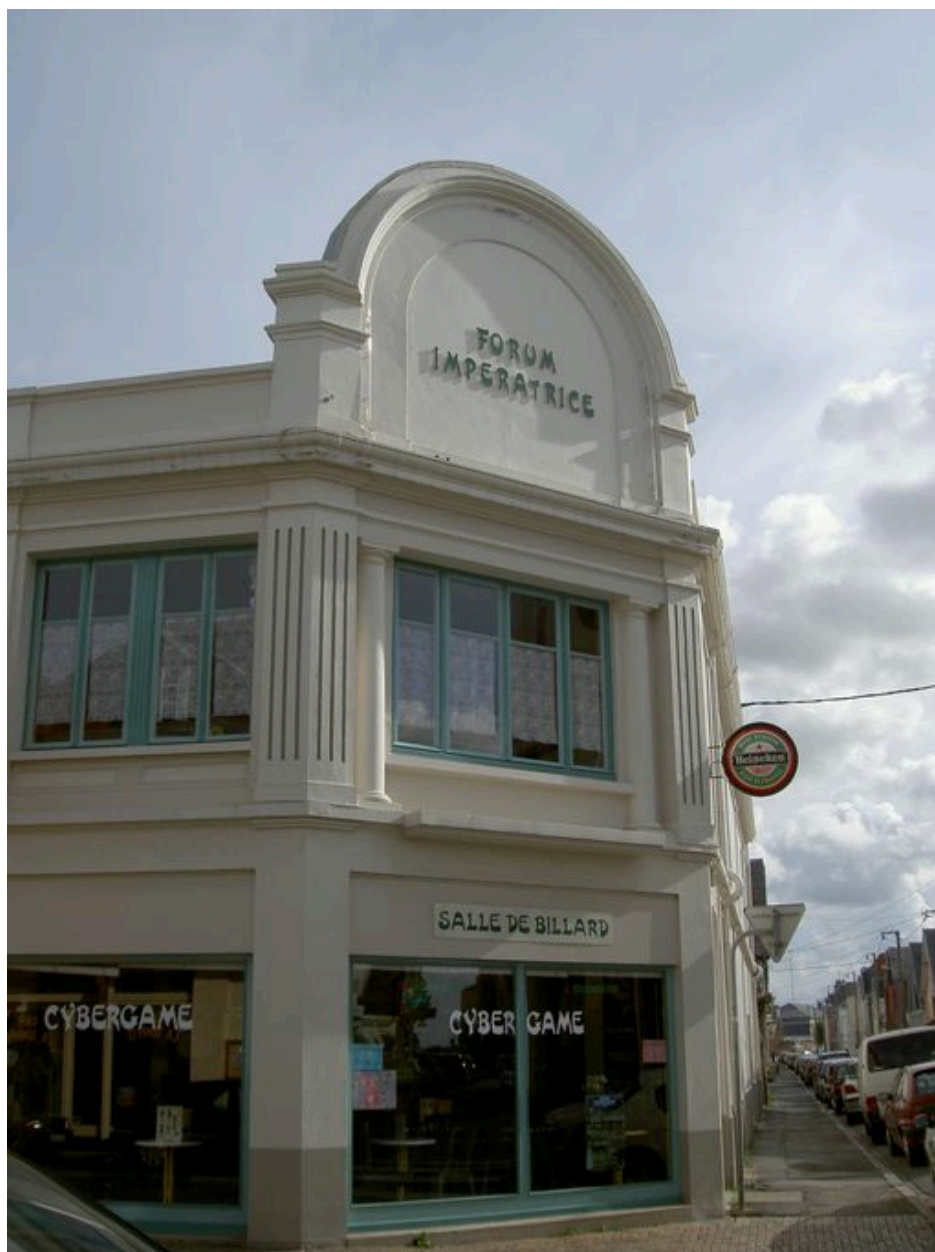
L'ancien cinéma L'impératrice Gaumont Palace, actuellement Forum l'Impératrice, rue de l'Impératrice.