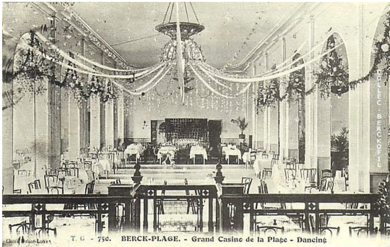
Dancing du Casino de la Plage, carte postale, début 20e siècle.