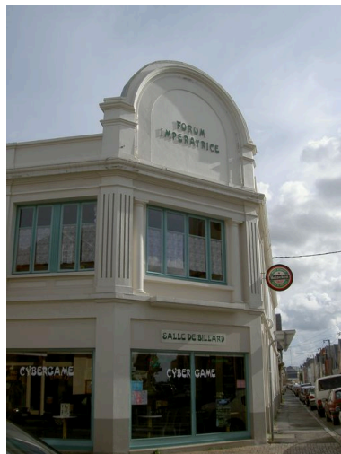
L'ancien cinéma L'impératrice Gaumont Palace, actuellement Forum l'Impératrice, rue de l'Impératrice.