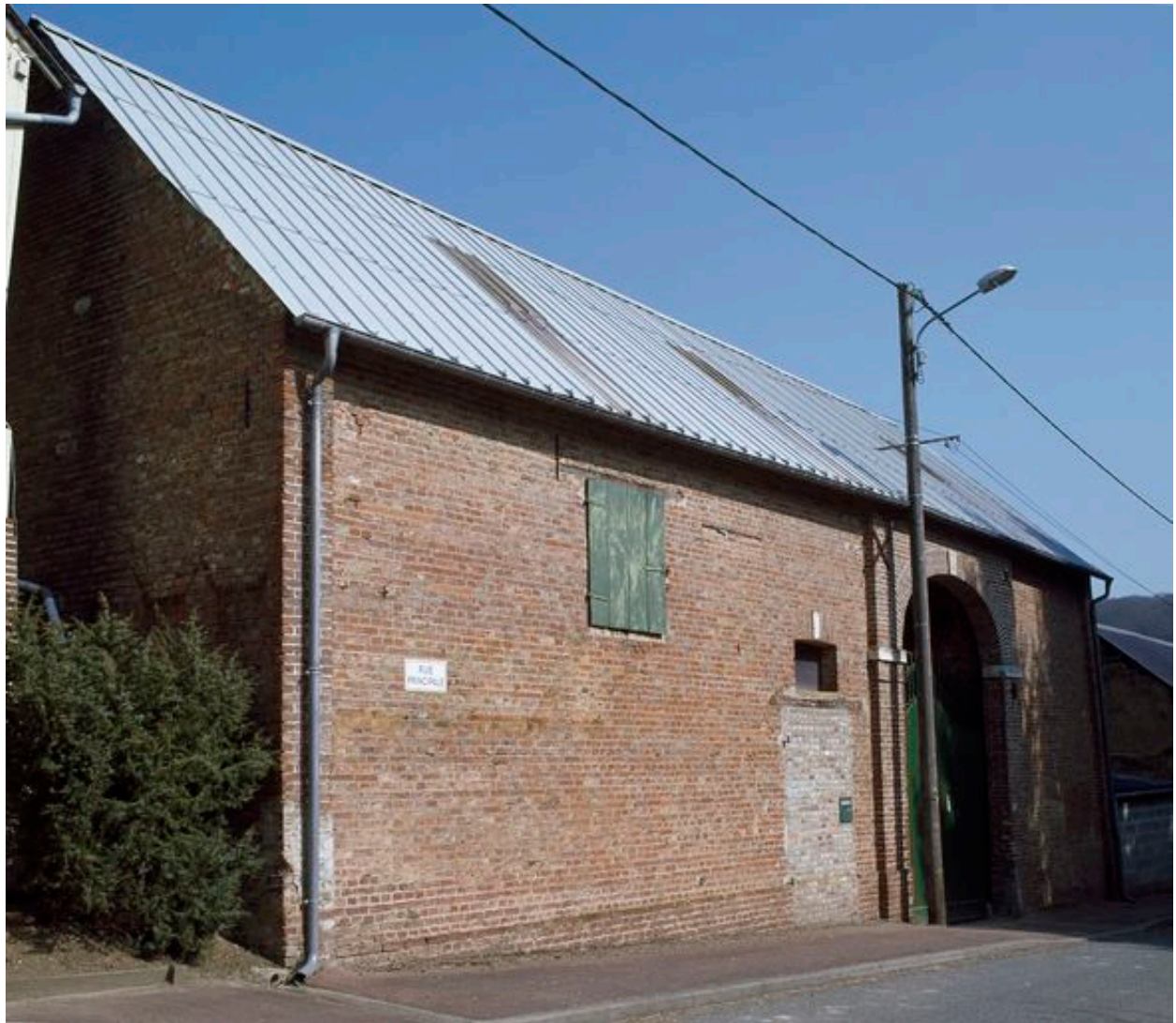
Vue de la grange depuis la rue.