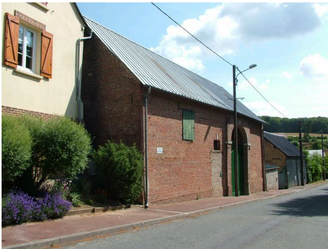
Vue générale depuis la rue, en amont.