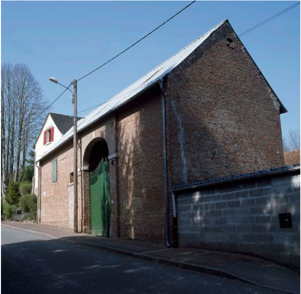
Vue de la grange depuis la rue.