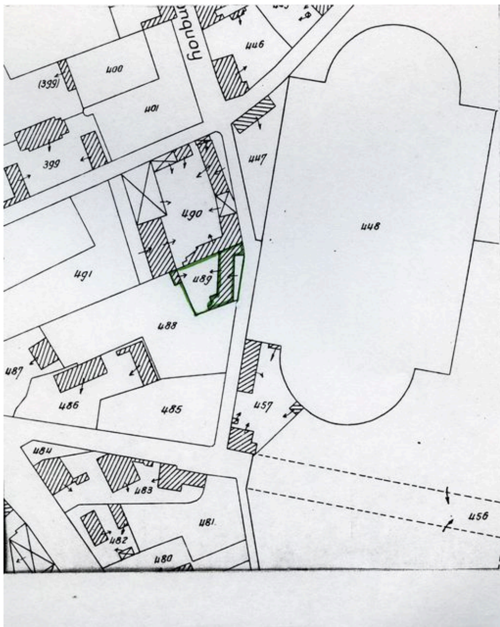
Plan de situation. Extrait du plan cadastral de 1962, section C2 489.