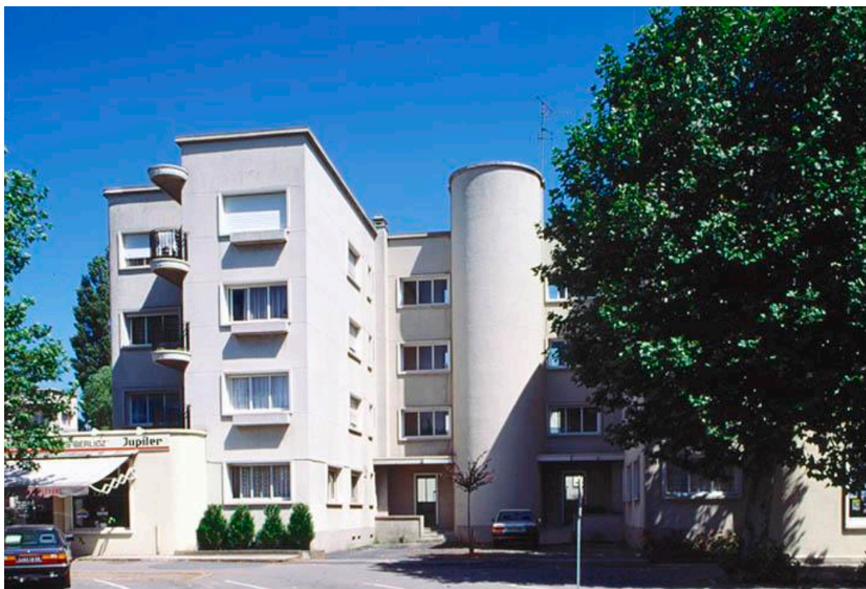
Élévation sud avenue de la gare, de l'immeuble en forme de H.