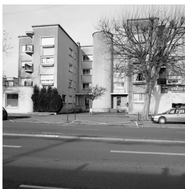
Vue générale de l'élévation sud d'un immeuble en H, avenue de la gare. IVR31_20025902912X