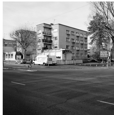
Vue générale de l'immeuble en forme de H situé à l'angle. IVR31_20025902911X