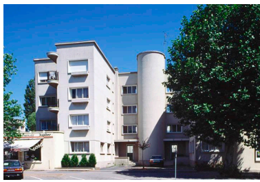
Élévation sud avenue de la gare, de l'immeuble en forme de H.