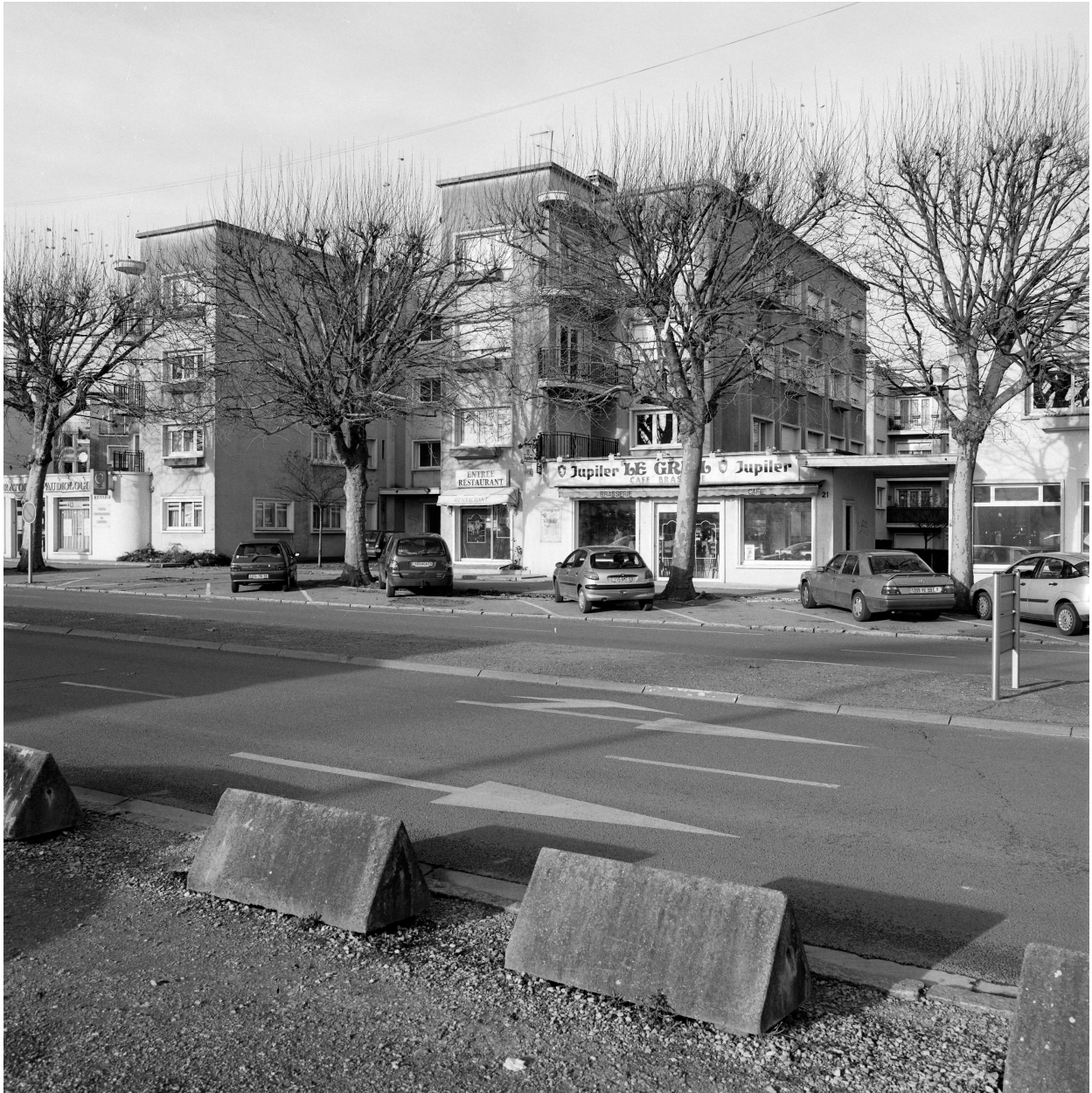
Vue générale du deuxième immeuble en forme de H.