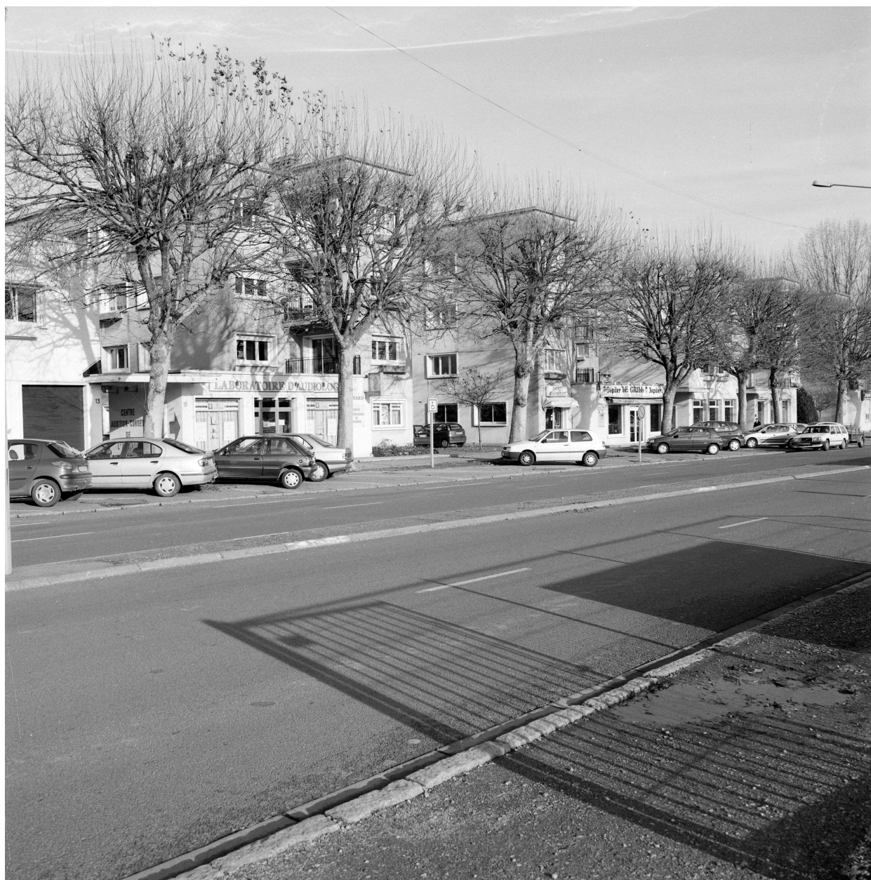
Vue générale en alignement des deux immeubles en forme de H depuis l'avenue de la gare.