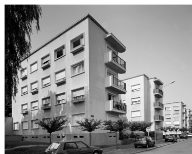
Vue générale de l'alignement des immeubles, élévations nord, rue des Arts. IVR31_19945901646V