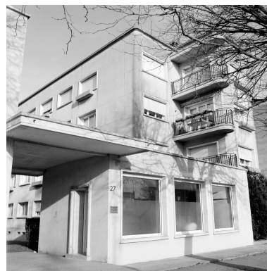
Vue rapprochée d'un volume de liaison : les décrochements, le jeu des volumes.