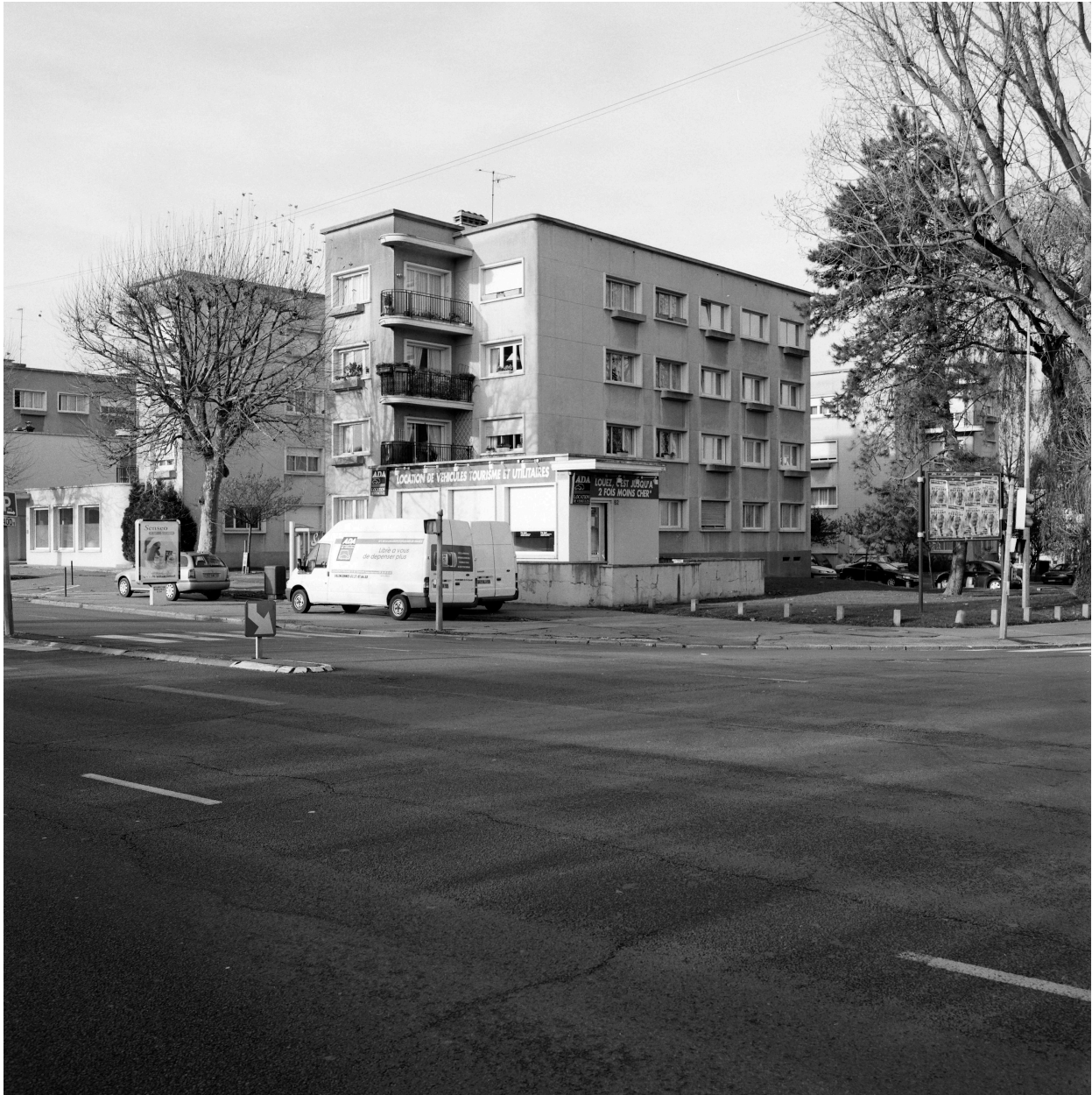
Vue générale de l'immeuble en forme de H situé à l'angle.