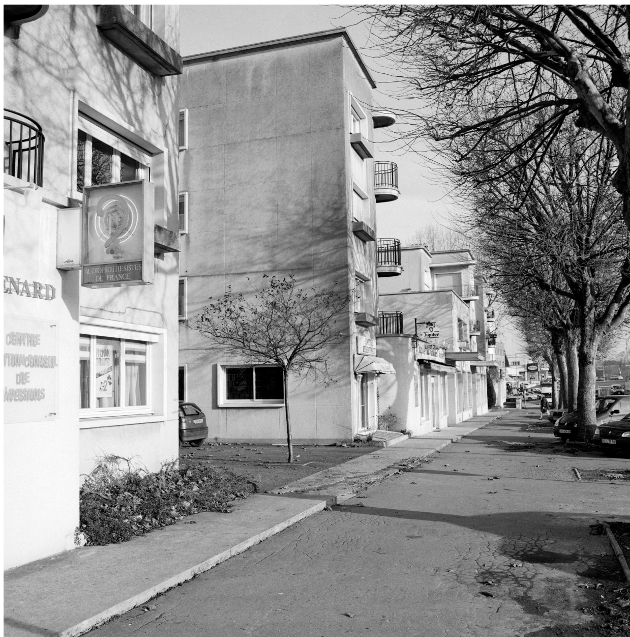
Vue générale rapprochée de l'alignement des deux immeubles en forme de H.