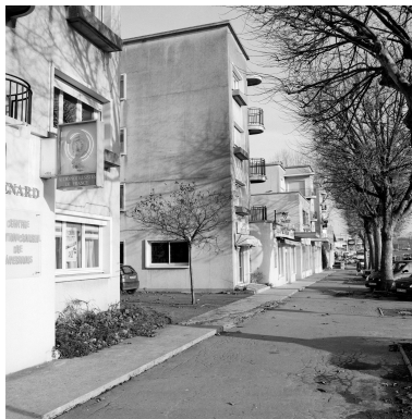
Vue générale rapprochée de l'alignement des deux immeubles en forme de H. IVR31_20025902917X