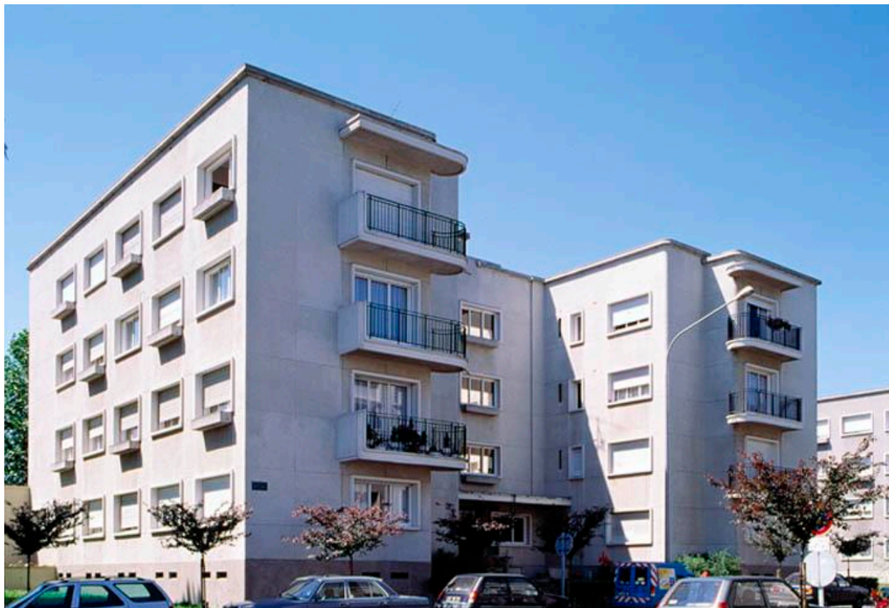
Vue générale d'un immeuble en forme de H, rue des Arts.