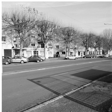
Vue générale en alignement des deux immeubles en forme de H depuis l'avenue de la gare. IVR31_20025902915X