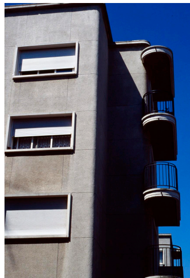
Vue des balcons des immeubles en forme de H.