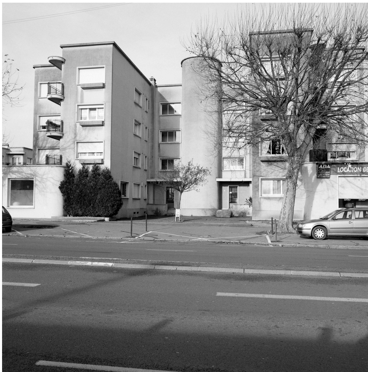
Vue générale de l'élévation sud d'un immeuble en H, avenue de la gare.