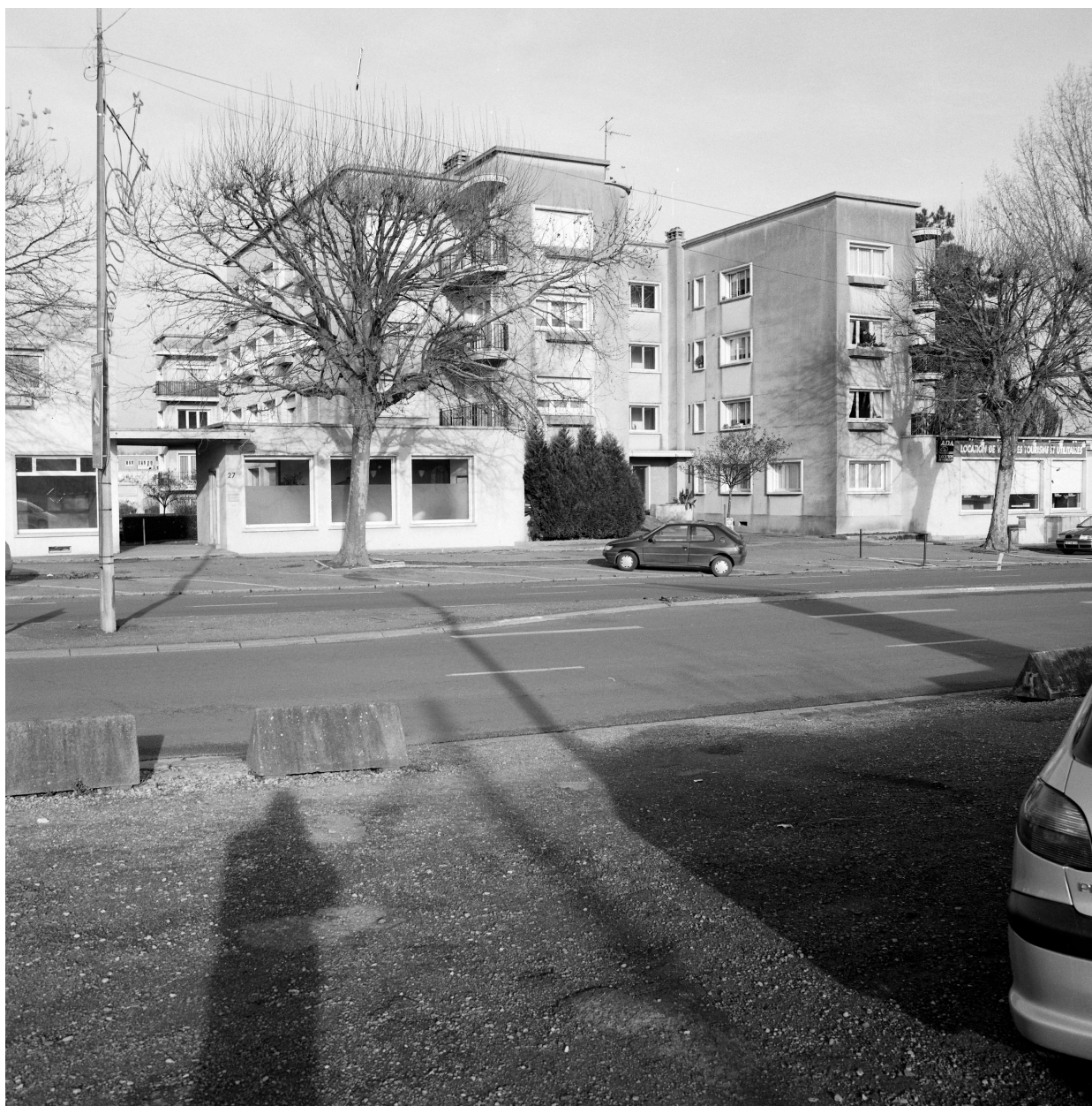
Vue générale du deuxième immeuble en forme de H.