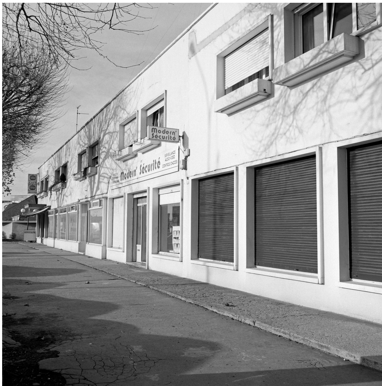
Vue générale de l'alignement de boutiques avenue de la gare.