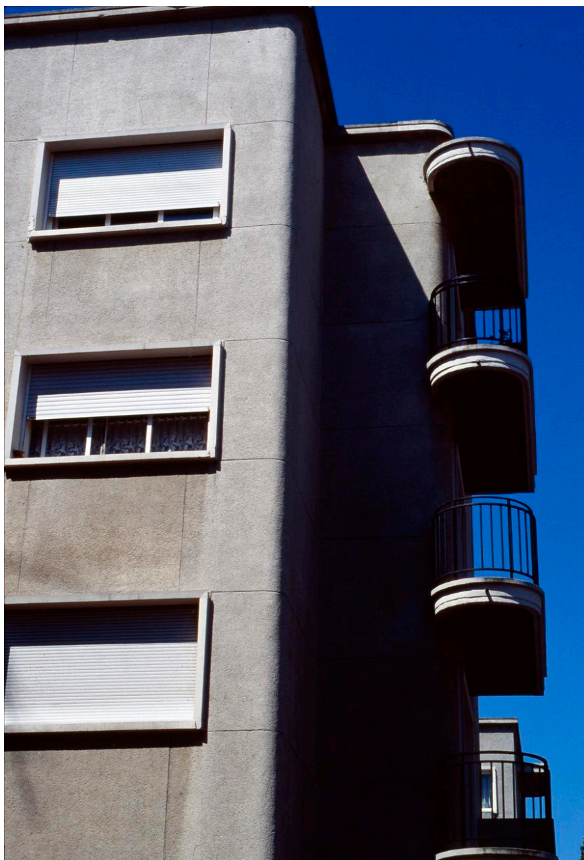
Vue des balcons des immeubles en forme de H.