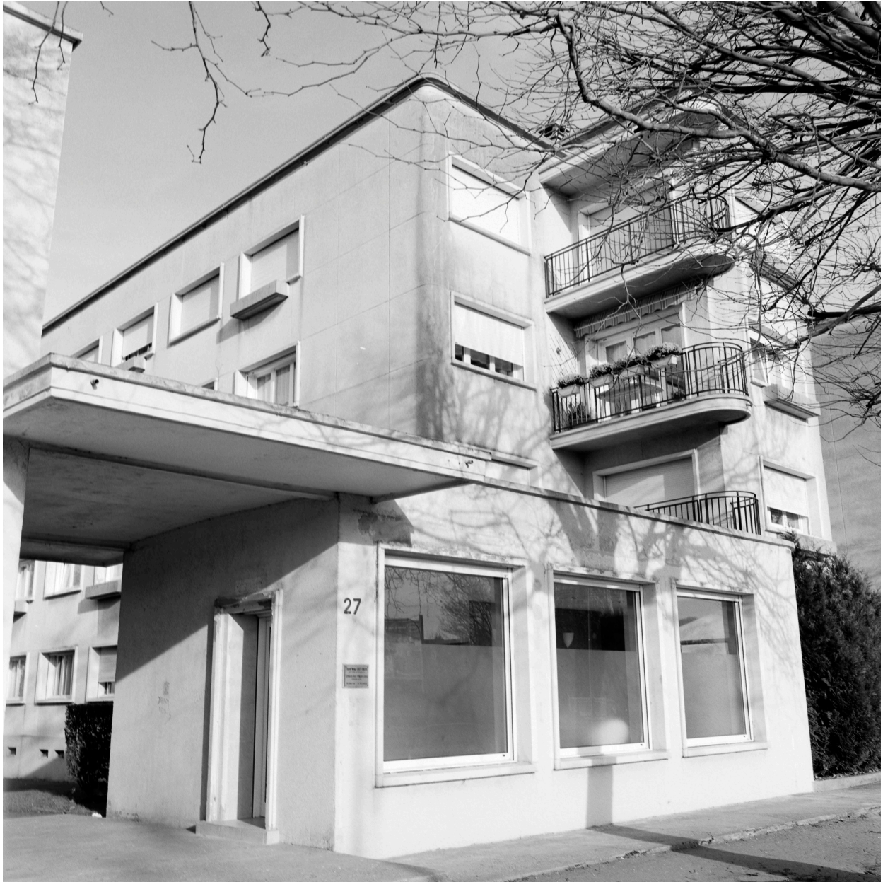
Vue rapprochée d'un volume de liaison : les décrochements, le jeu des volumes.