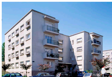
Vue générale d'un immeuble en forme de H, rue des Arts. IVR31_19945901159ZA