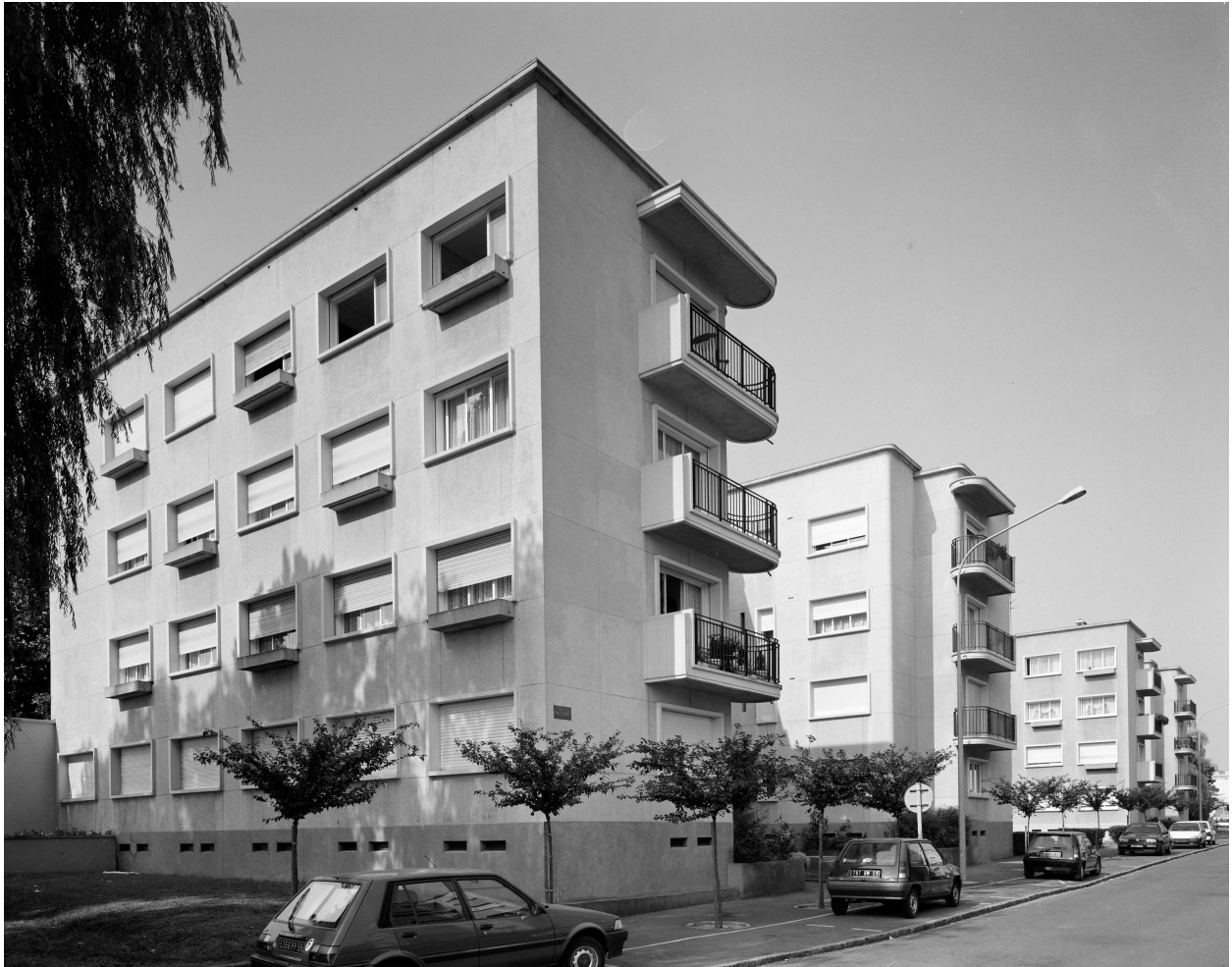
Vue générale de l'alignement des immeubles, élévations nord, rue des Arts.