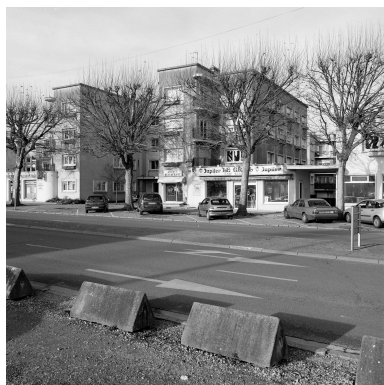
Vue générale du deuxième immeuble en forme de H.