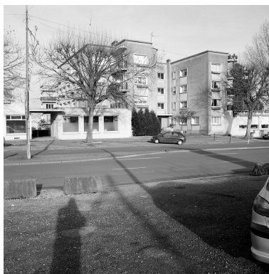
Vue générale du deuxième immeuble en forme de H. IVR31_20025902913X