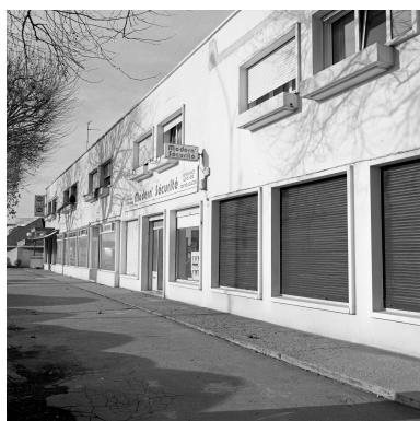
Vue générale de l'alignement de boutiques avenue de la gare. IVR31_20025902918X