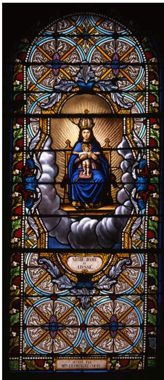
Verrière (baie 6), Notre-Dame de Liesse, Oliveir Durieux (maître-verrier), Aulnoye, 1885.