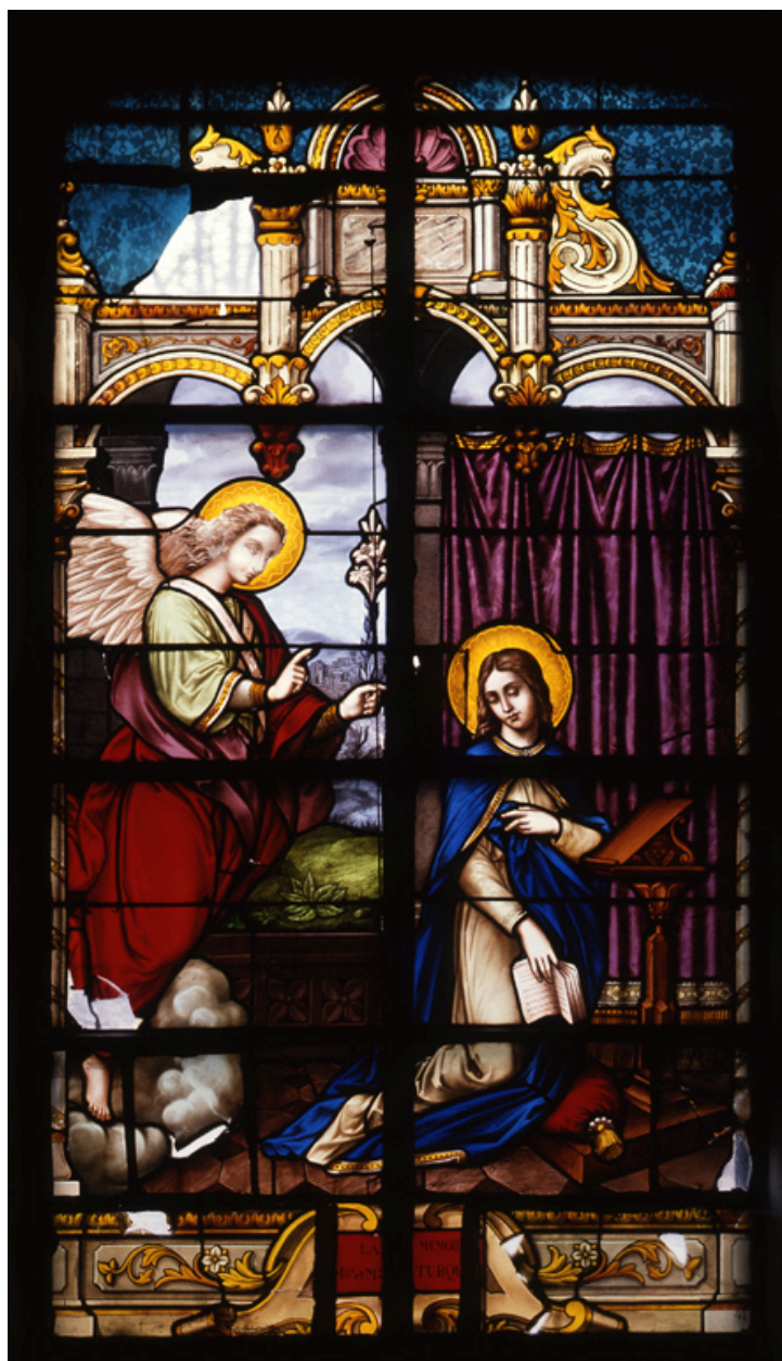
Verrière (baie 4) de l'Annonciation, H. Mathieu (maître-verrier), 4e quart 19e siècle.