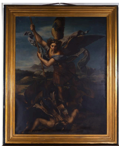
Tableau : Saint-Michel terrassant le dragon, copie d'une oeuvre de Raphaël ou Jules Romain, conservée au musée du Louvre. IVR22_19930202039XA