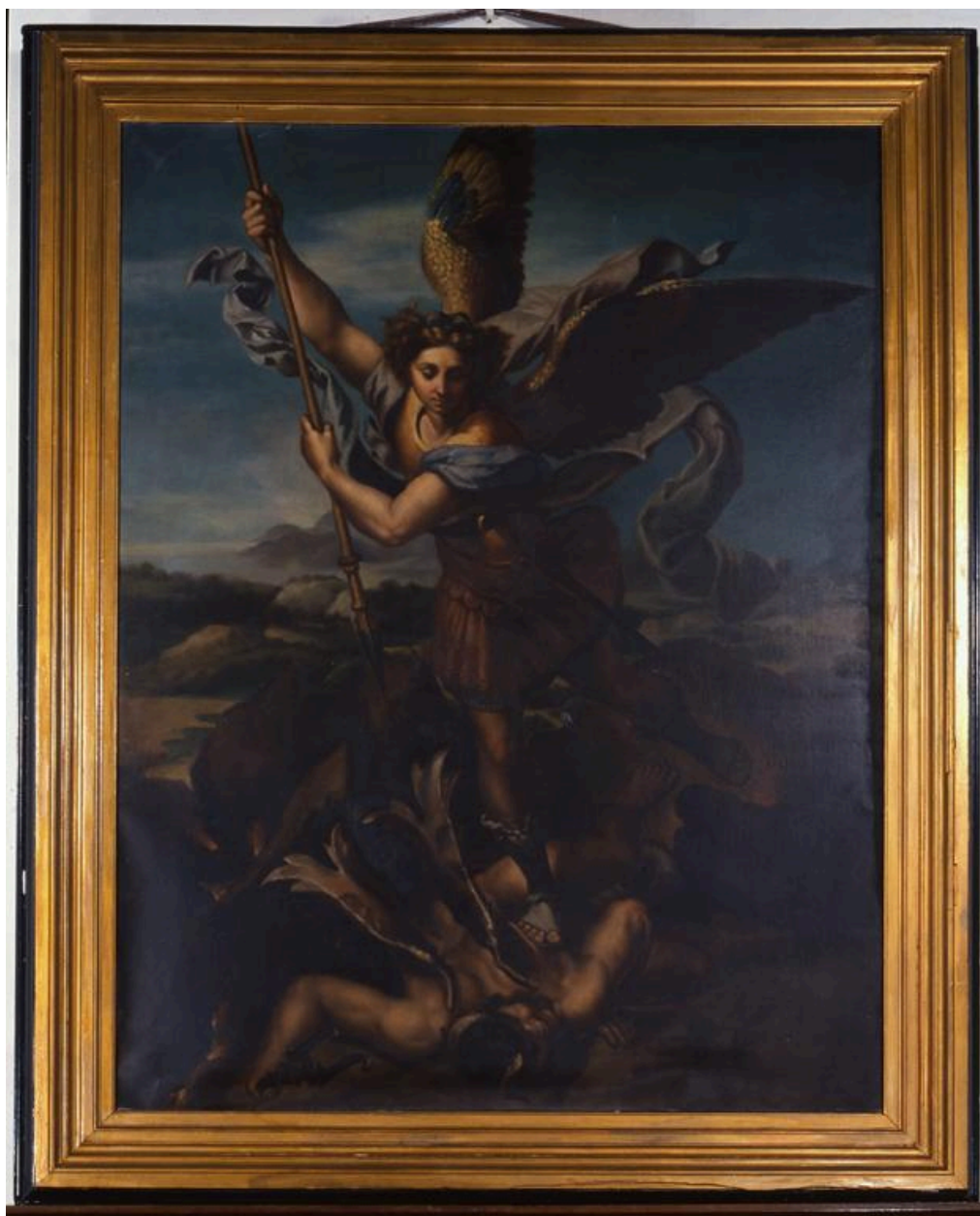
Tableau : Saint-Michel terrassant le dragon, copie d'une oeuvre de Raphaël ou Jules Romain, conservée au musée du Louvre.