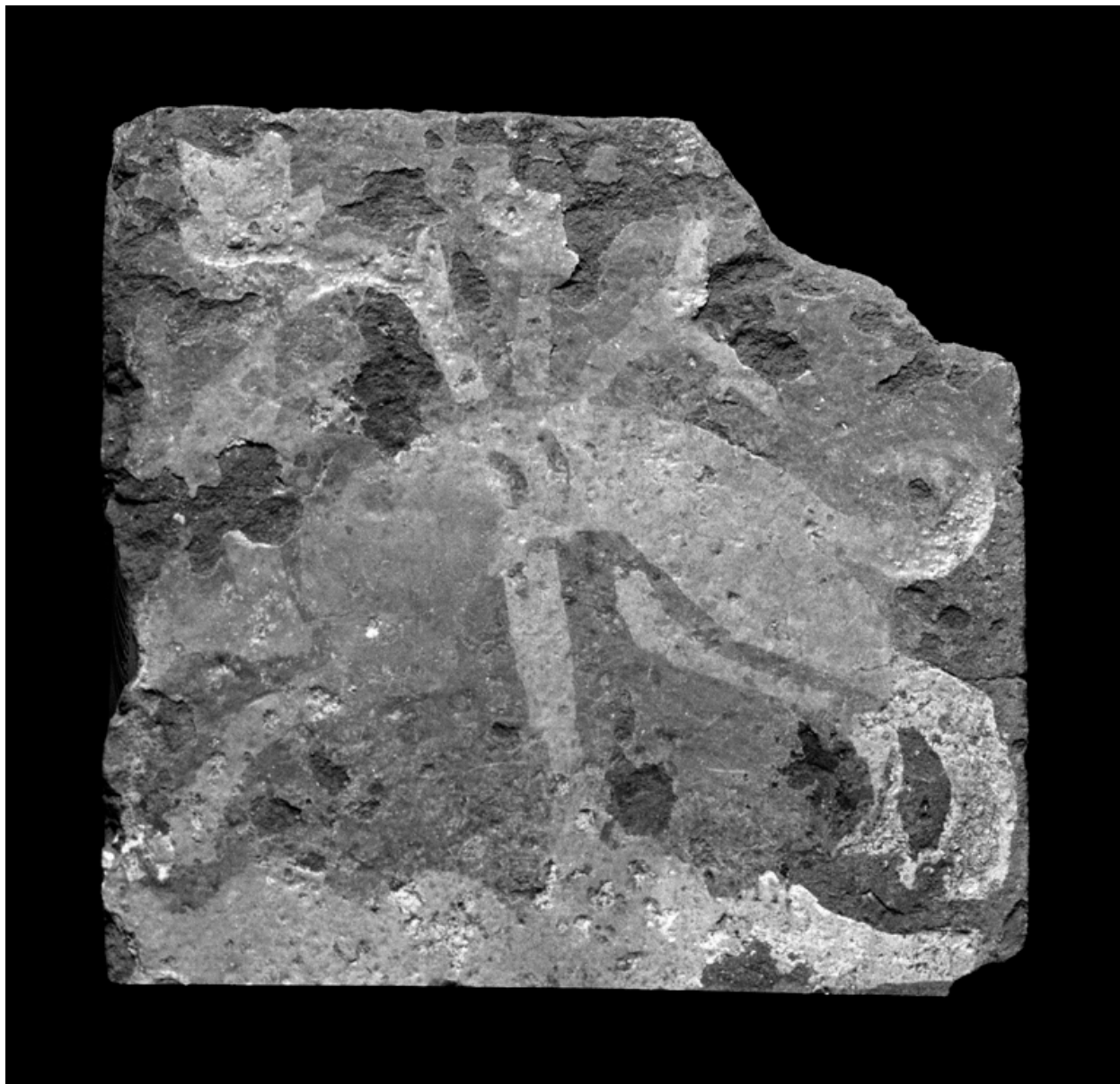
Décor au lévrier : 15e siècle. Collections de la S.H.A.C.T.