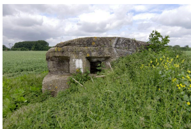
Vue vers le nord-ouest