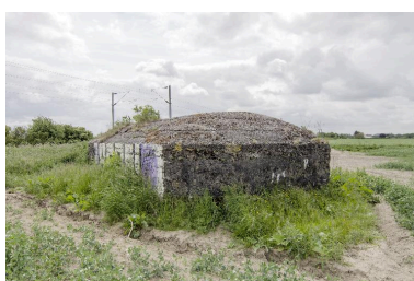
Vue de trois-quarts vers le sud-est IVR32_20165901178NUCA