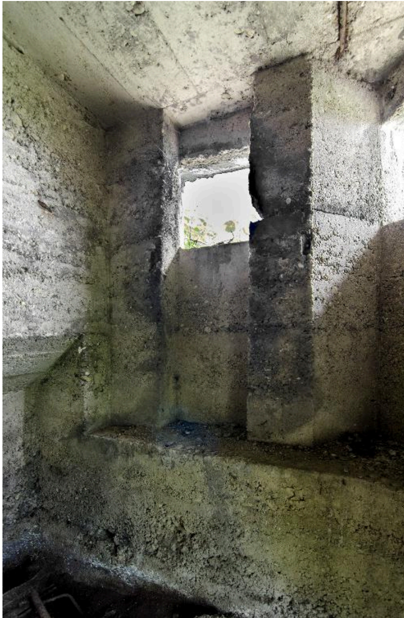
Vue intérieur du poste d'observation