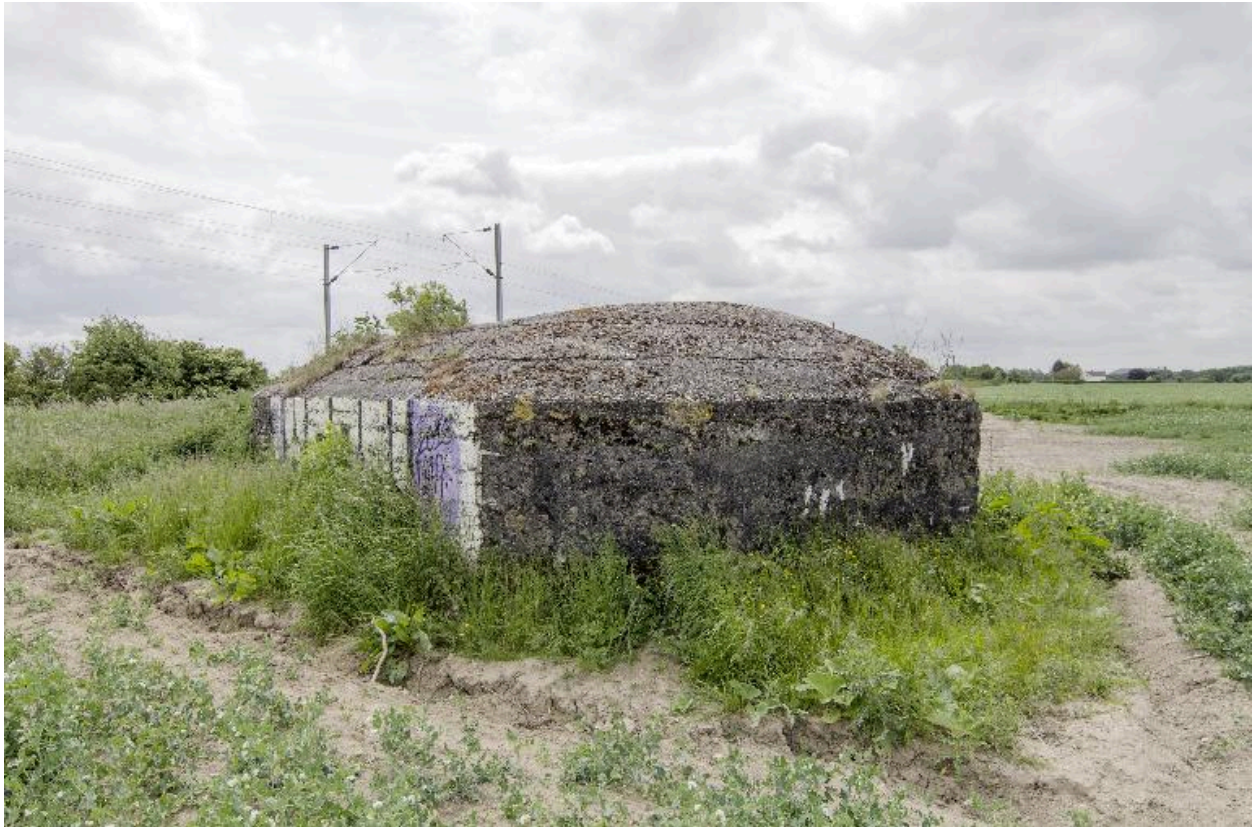
Vue de trois-quarts vers le sud-est