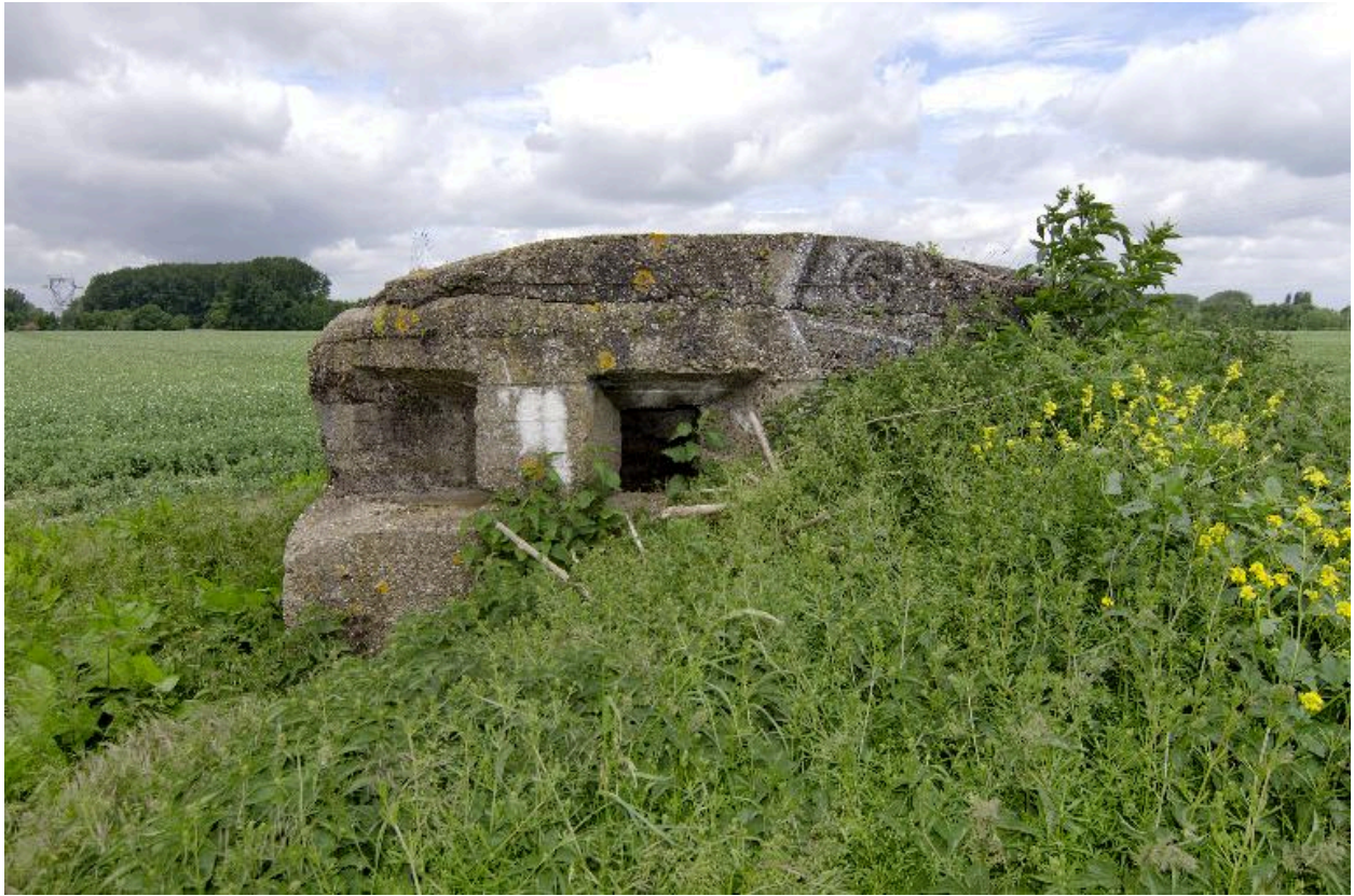
Vue vers le nord-ouest