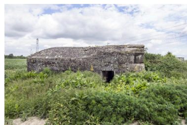
Vue latérale, vers nord-est IVR32_20165901171NUCA