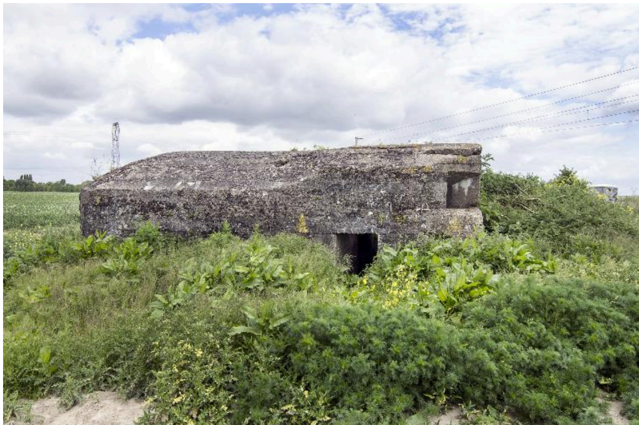
Vue latérale, vers nord-est