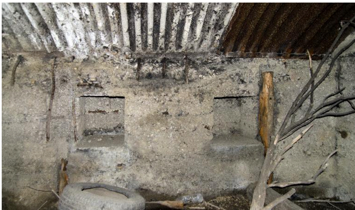
Salle principale (au grand angulaire)