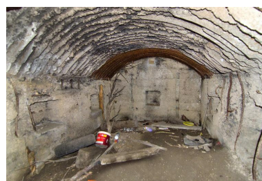
Salle principale (au grand angulaire)