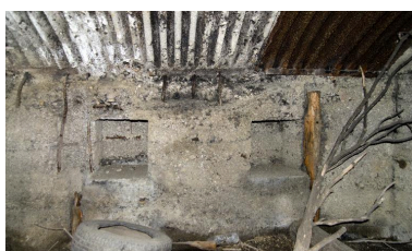
Salle principale (au grand angulaire) IVR32_20165901176NUCA