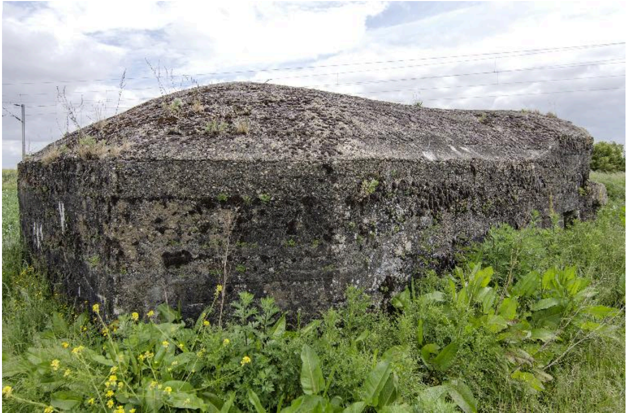
Vue vers de trois-quarts arrière, vers l'est