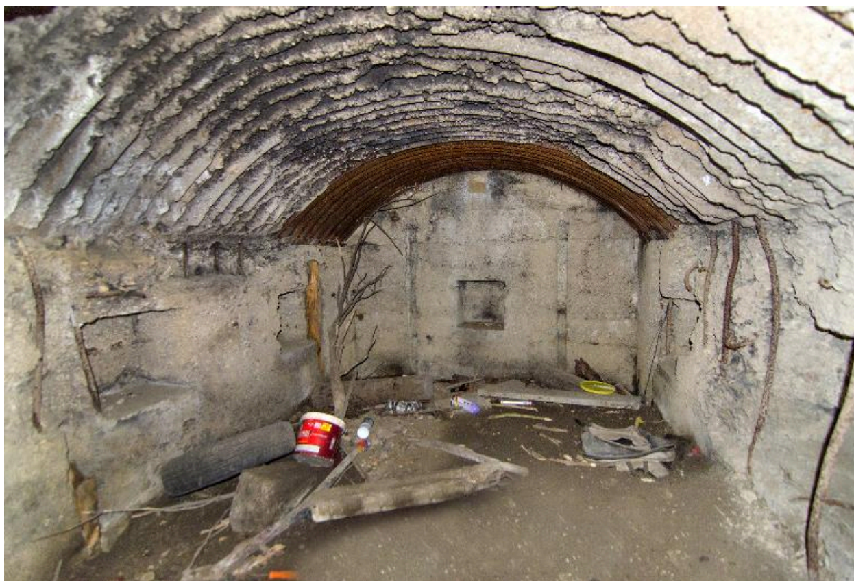
Salle principale (au grand angulaire)