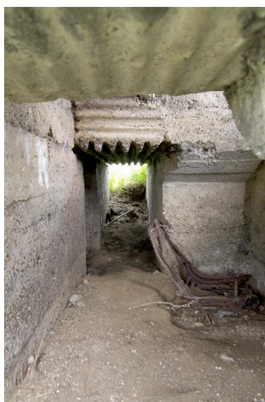
Couloir de distribution en enfilade vers le nord-est