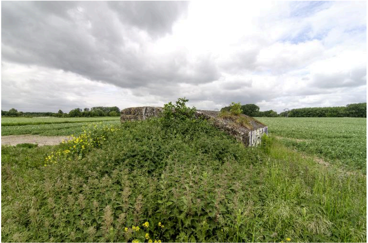
Vue générale vers le nord-est