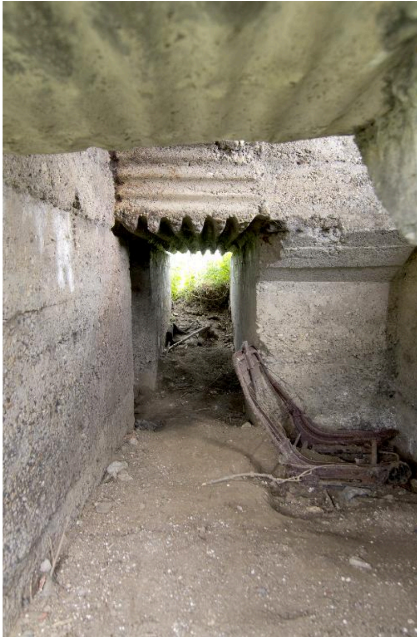
Couloir de distribution en enfilade vers le nord-est