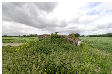
Vue générale vers le nord-est IVR32_20165901179NUCA