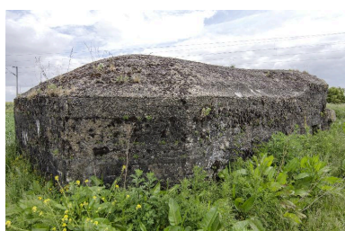
Vue vers de trois-quarts arrière, vers l'est