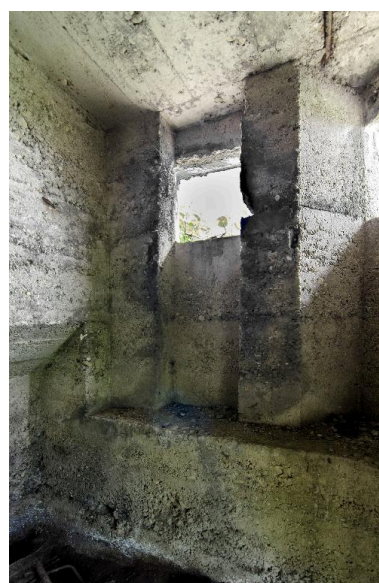
Vue intérieur du poste d'observation