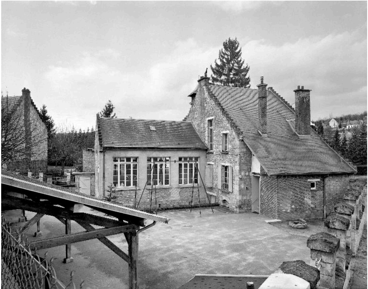
Vue générale des élévations sur cour.