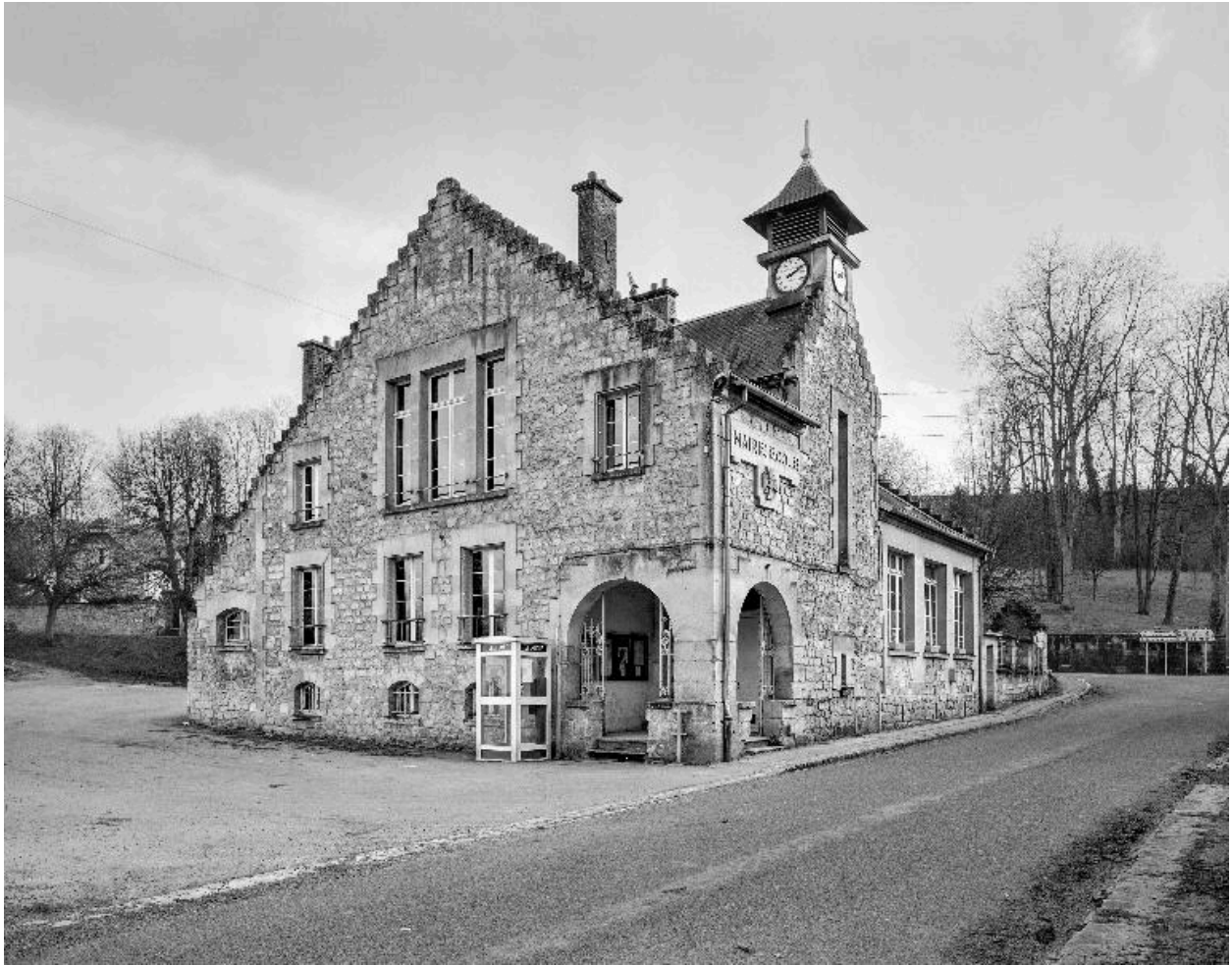
Vue générale de l'édifice depuis le nord.