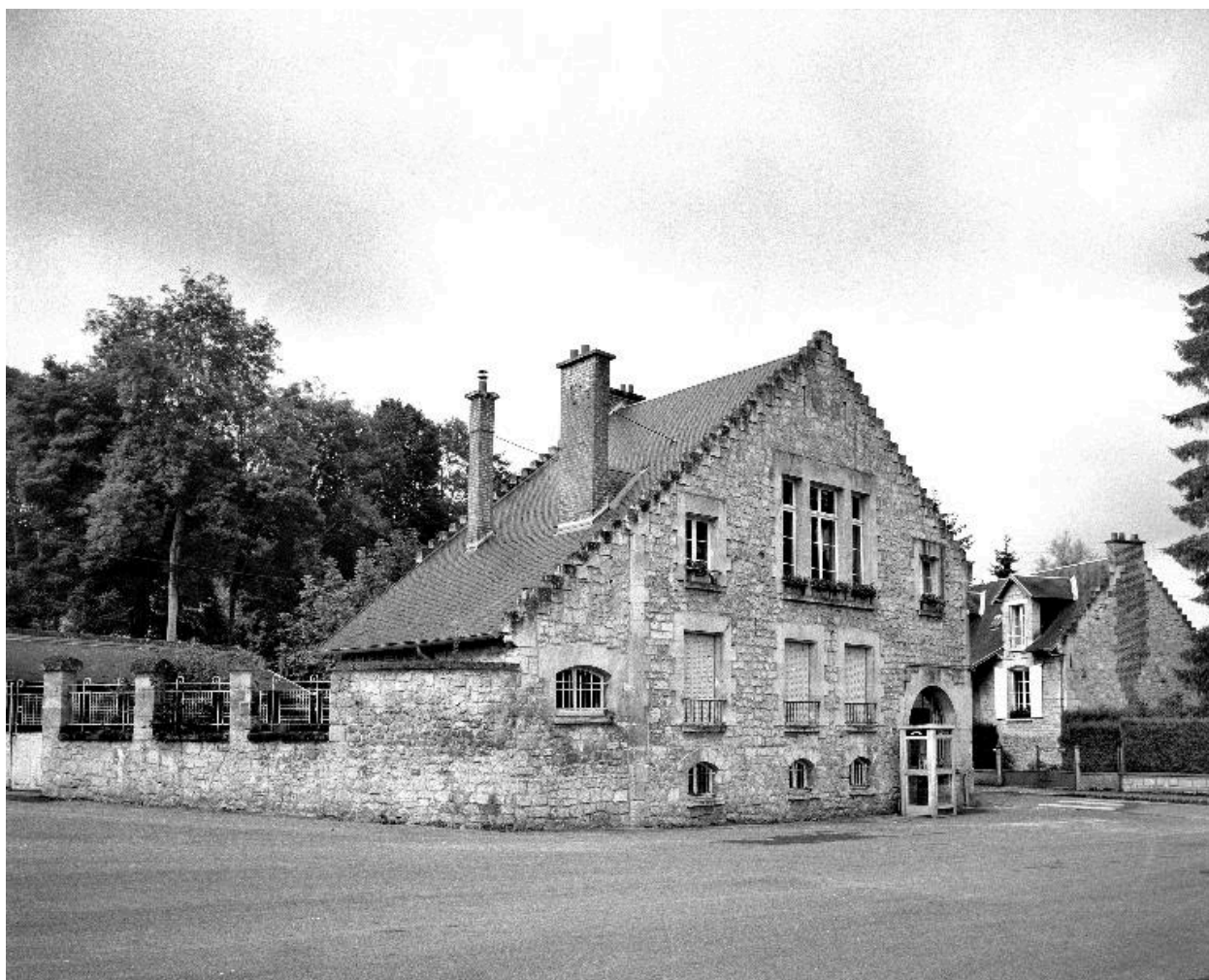
Vue de l'élévation principale nord.