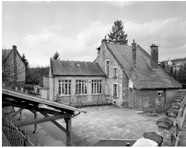
Vue générale des élévations sur cour.