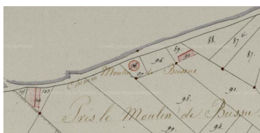
Extrait du cadastre napoléonien de 1811 (AD Somme). IVR22_20158005073NUCA