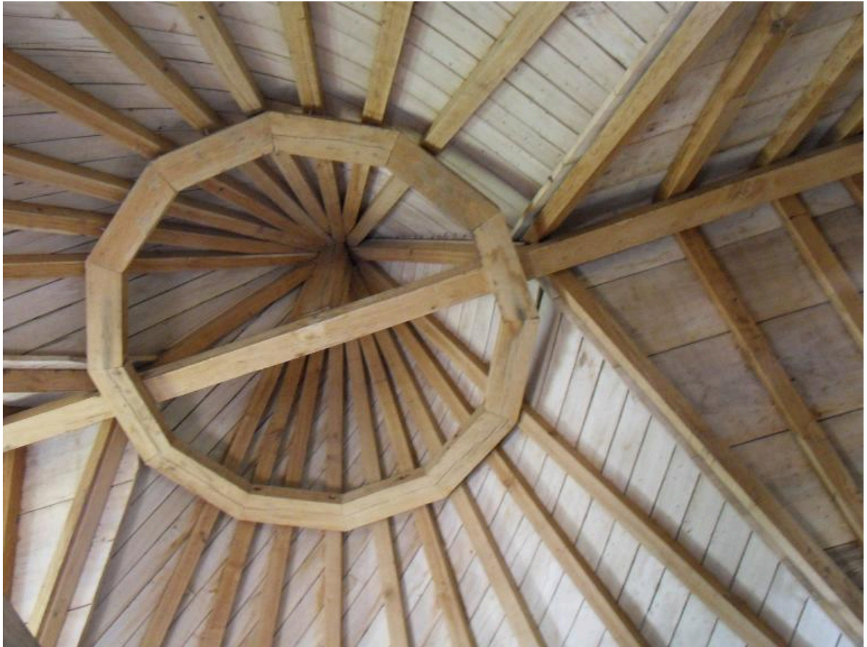
Vue de la charpente.