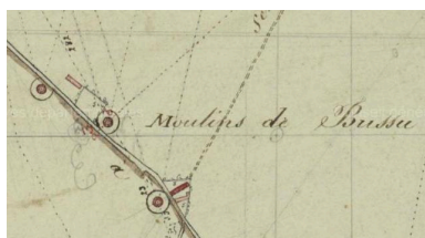
Extrait du plan par masse de culture de 1808 (AD Somme).