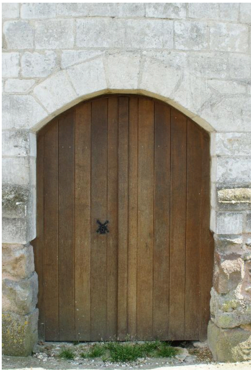
Vue de détail sur la porte du moulin.