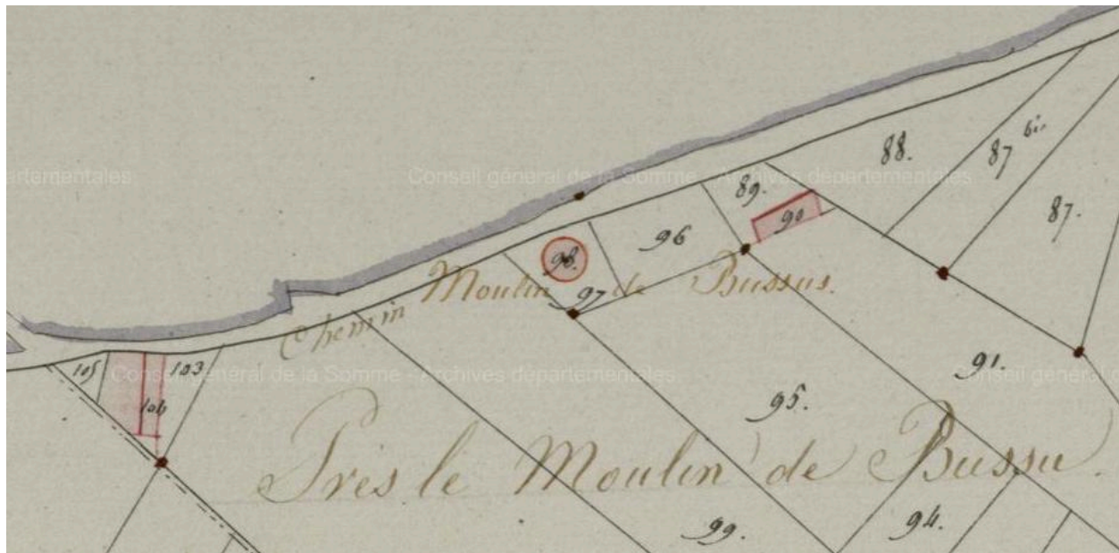
Extrait du cadastre napoléonien de 1811 (AD Somme).