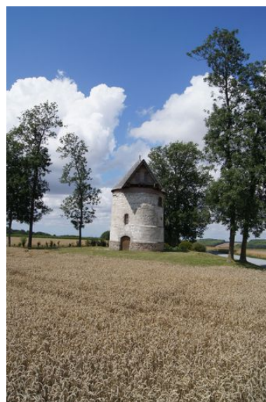
Vue générale. IVR22_20118000416NUCA