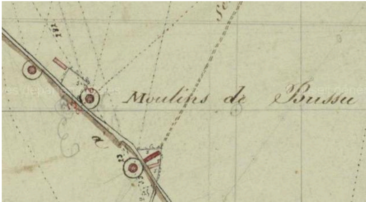
Extrait du plan par masse de culture de 1808 (AD Somme).