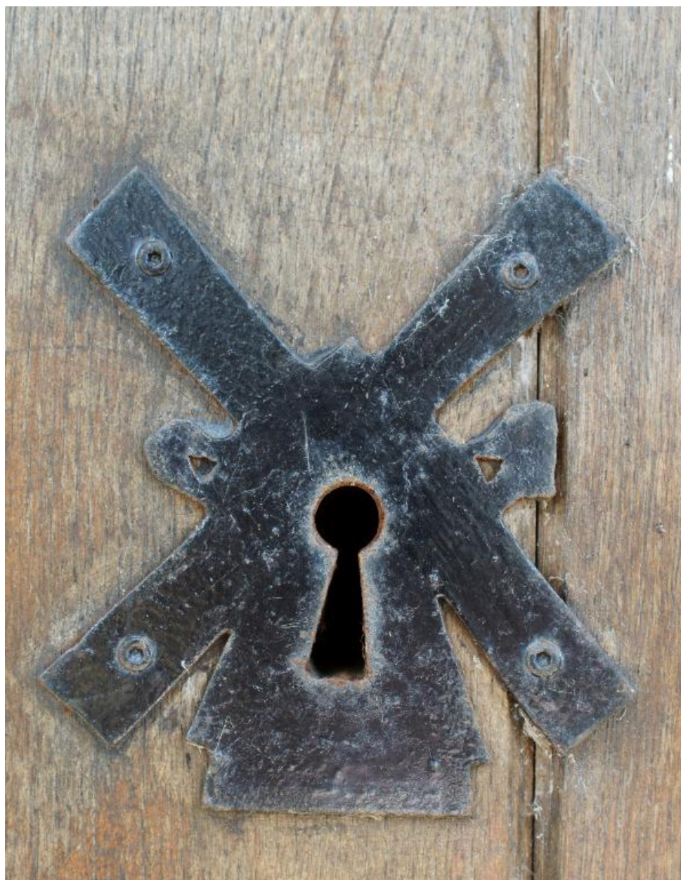
Vue de détail sur l'entrée de serrure de la porte du moulin.