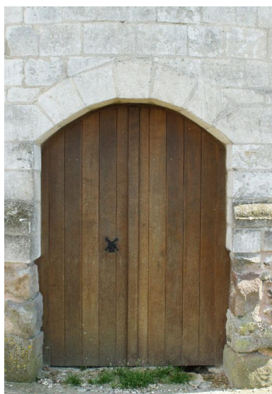
Vue de détail sur la porte du moulin.