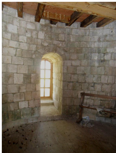
Vue intérieure.