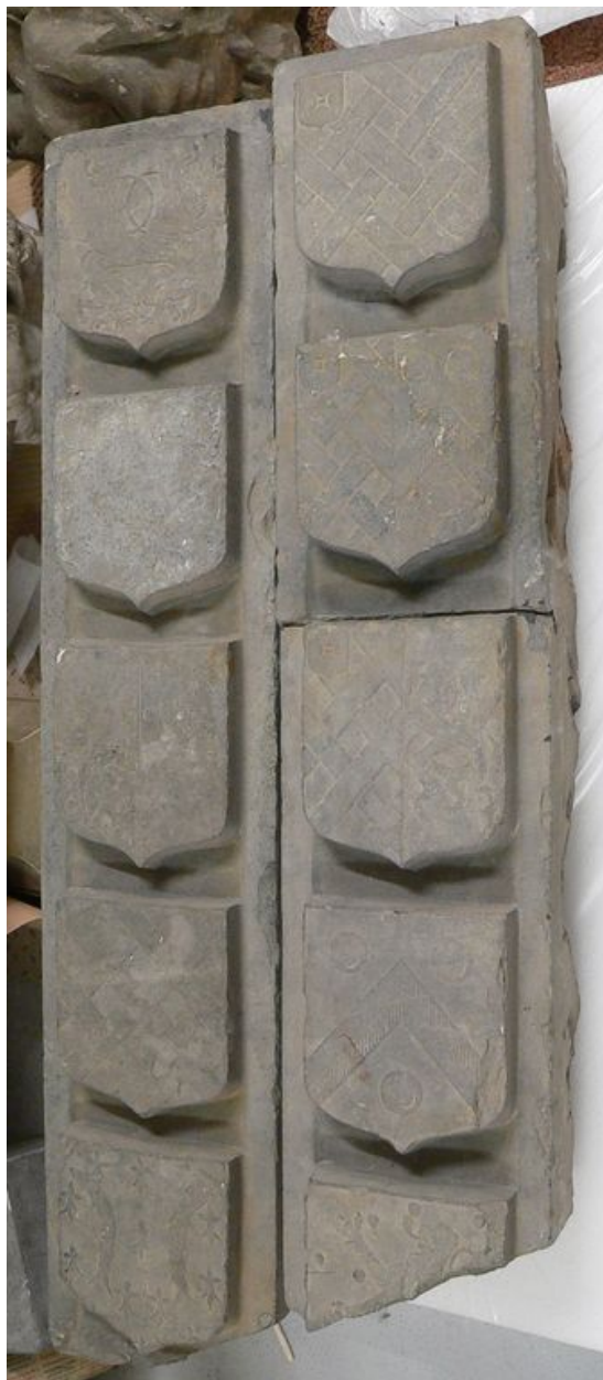
Vue des deux pilastres du monument de François de Sons (père). Dans : "Maison de Moÿ. Etude sur des pilastres armoriés conservés dans l'église de Saint-Quentin.