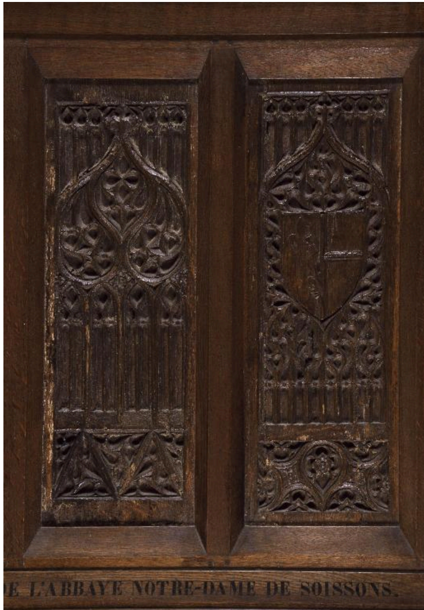
Vue de la partie droite.