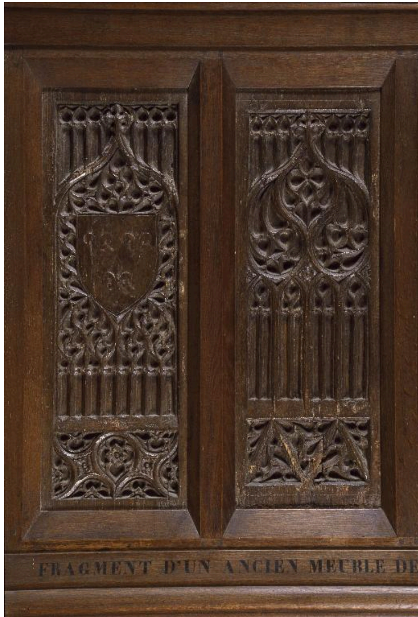
Vue de la partie gauche.