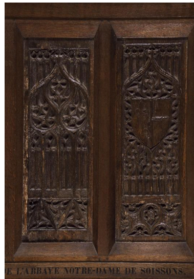
Vue de la partie droite.