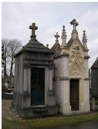
Vue de situation, tombeau à droite de l'image. IVR22_20058010065NUCA