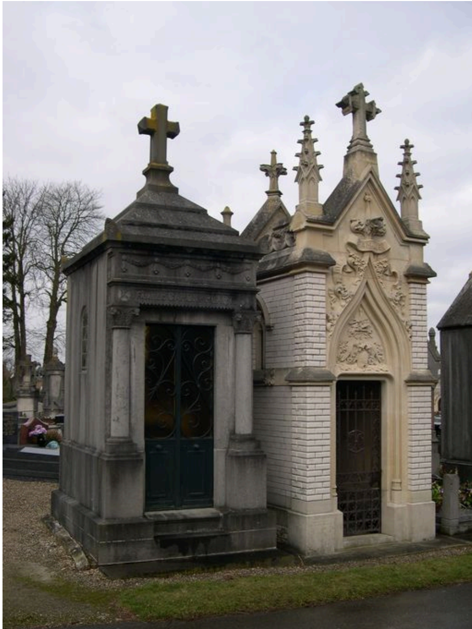
Vue de situation, tombeau à droite de l'image.