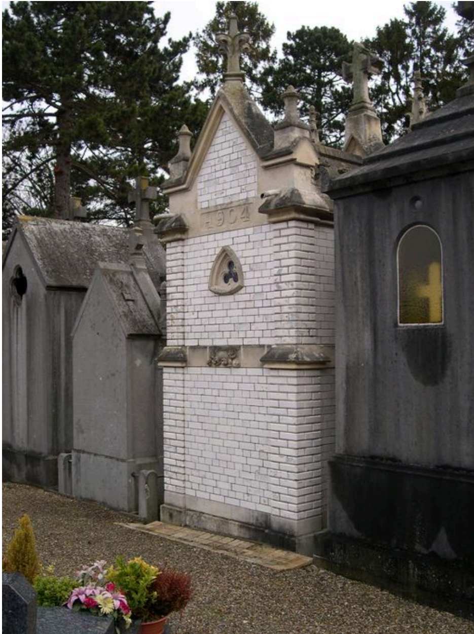
Vue de la date portée sur la façade postérieure.