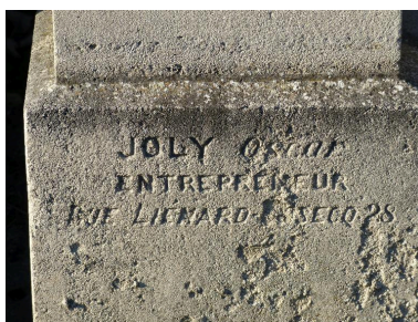
Vue de détail sur la signature de l'entrepreneur.