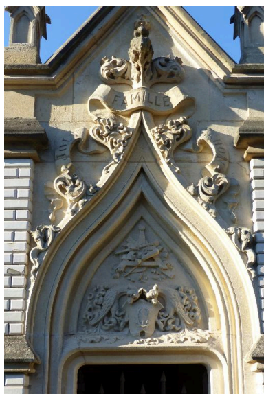
Vue du décor sculpté du tympan.