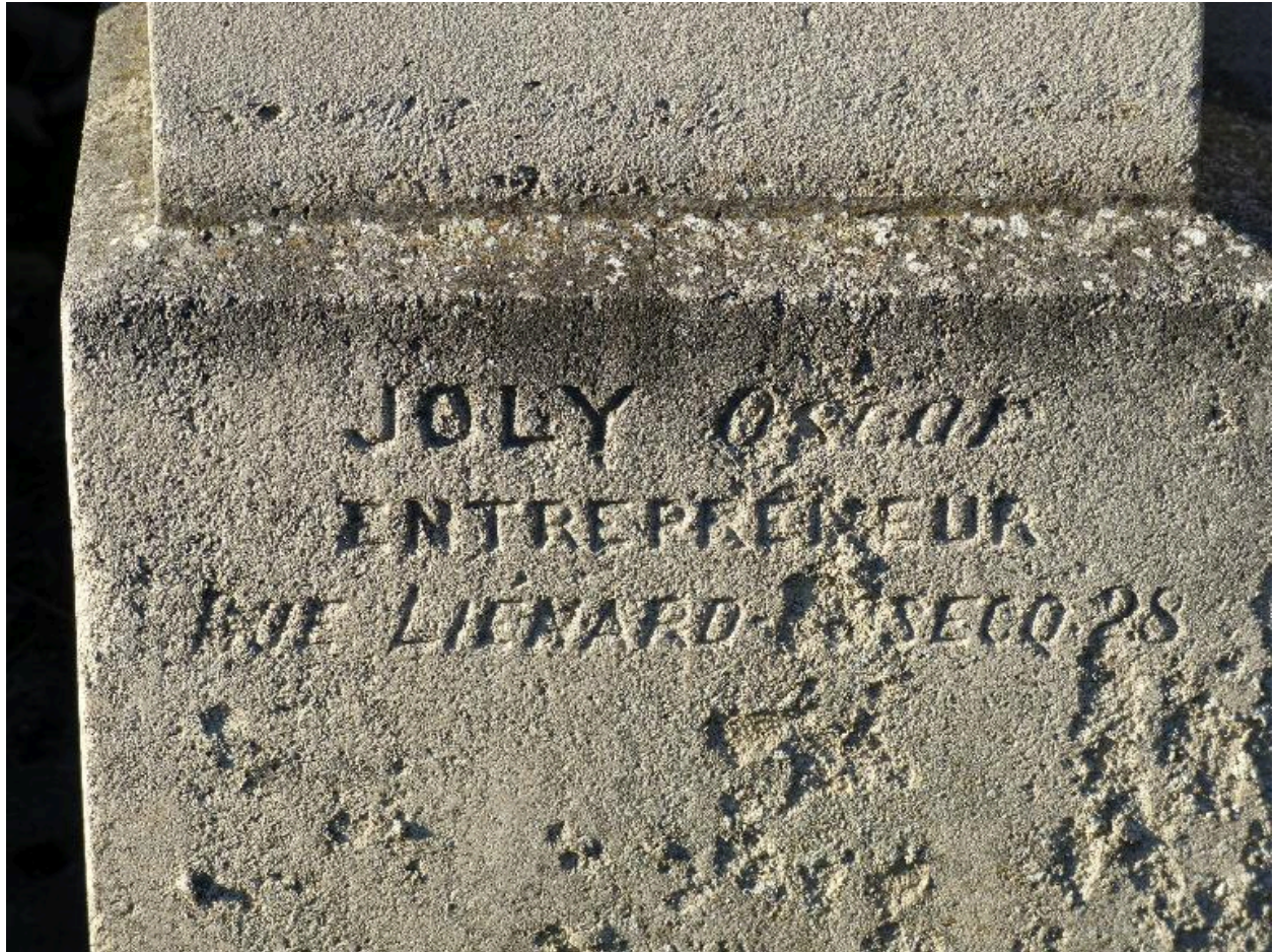
Vue de détail sur la signature de l'entrepreneur.