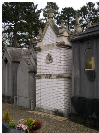
Vue de la date portée sur la façade postérieure. IVR22_20058010066NUCA