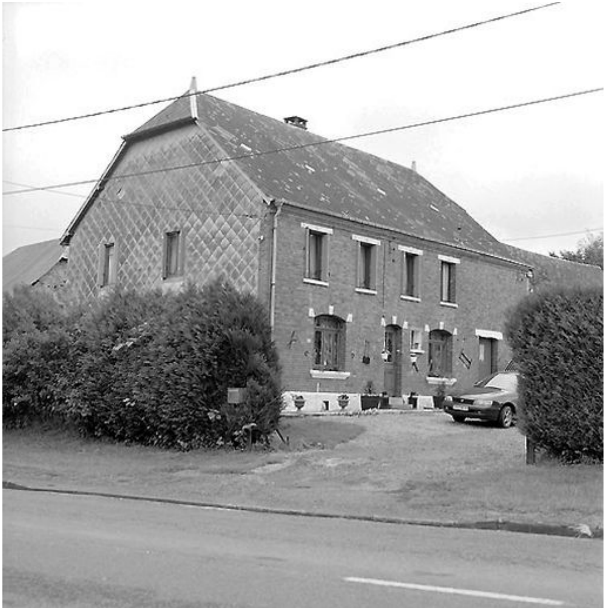
Vue générale du logis.