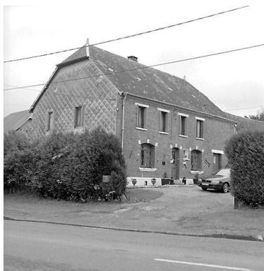
Vue générale du logis.