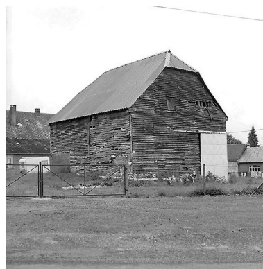
La grange.