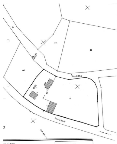
Plan de situation. Extrait du plan cadastral de 1984, section ZA. IVR22_20080290144NUCA