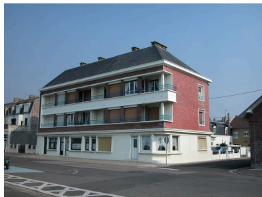
Vue d'ensemble. IVR22_20058003152NUCA