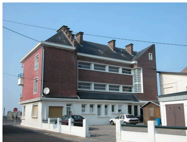
Élévation postérieure. IVR22_20058003153NUCA