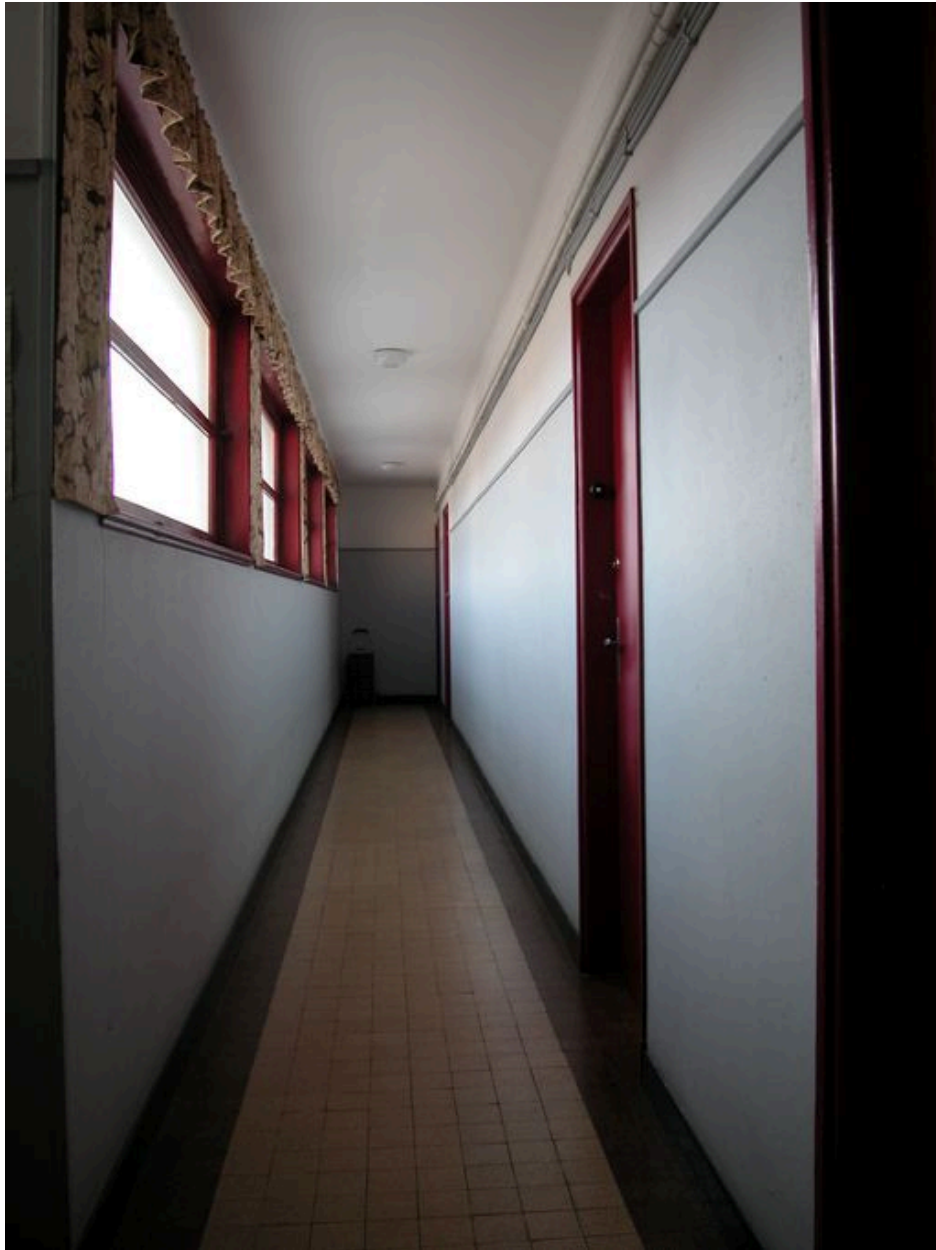
Vue d'un couloir longitudinal, en façade postérieure.