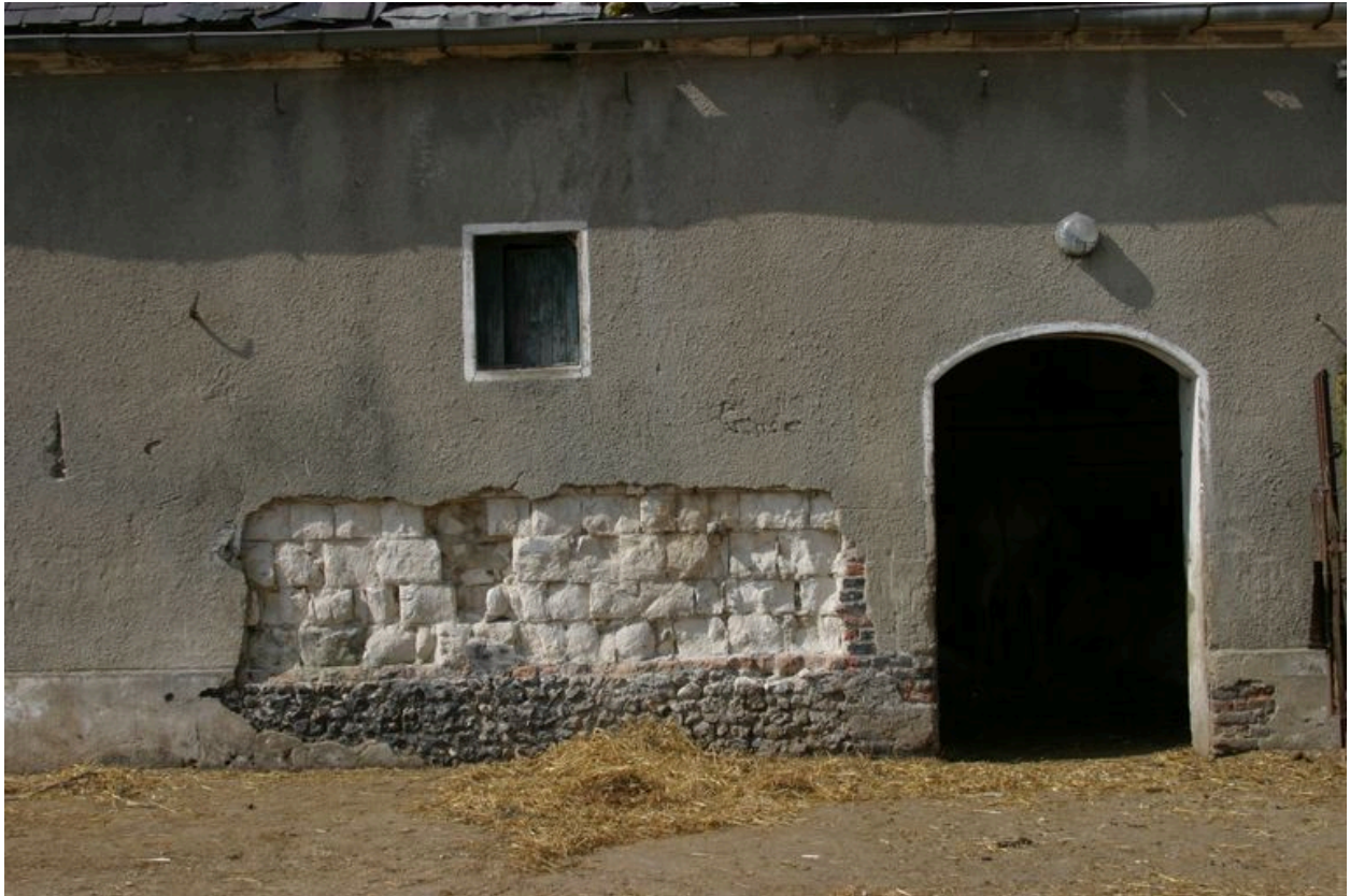
Détail de la maçonnerie de ce bâtiment.