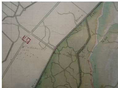
Extrait d'une carte du 18e siècle présentant la ferme et ses terres.