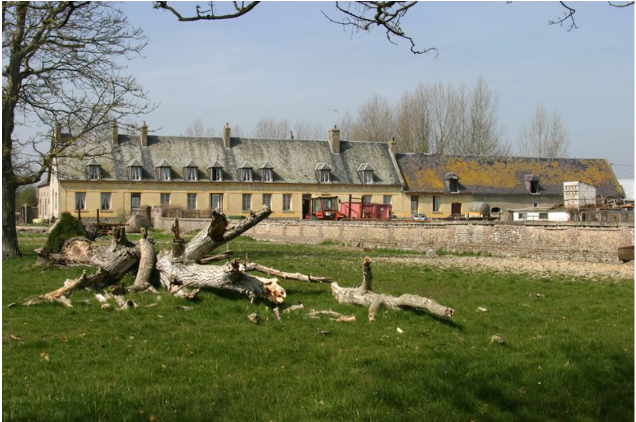
Vue du logis.