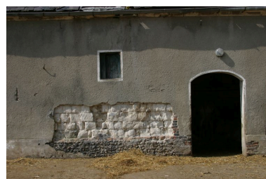
Détail de la maçonnerie de ce bâtiment.