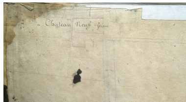
Extrait du cadastre napoléonien présentant le plan de la ferme en 1828.