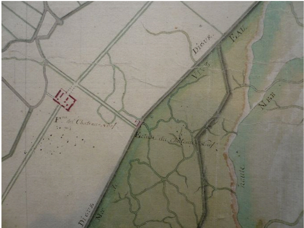
Extrait d'une carte du 18e siècle présentant la ferme et ses terres.