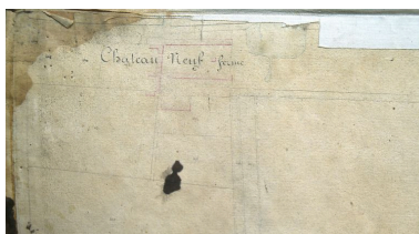
Extrait du cadastre napoléonien présentant le plan de la ferme en 1828.