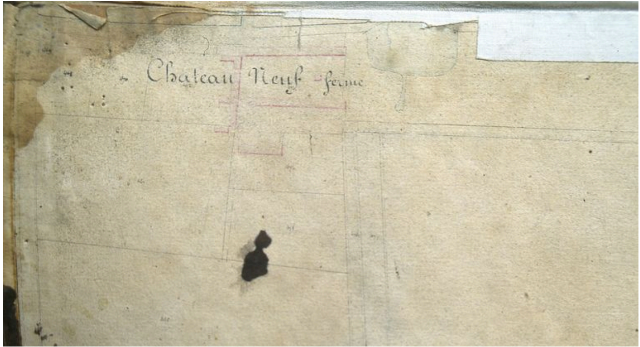
Extrait du cadastre napoléonien présentant le plan de la ferme en 1828.