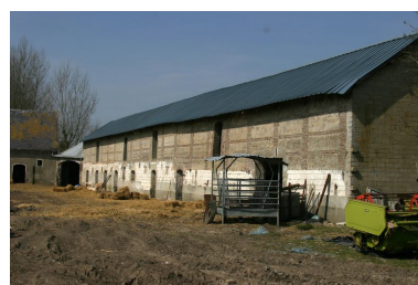
Vue sur l'étable nord depuis l'entrée principale à l'est.