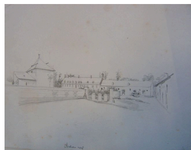
Vue de la ferme au milieu du 19e siècle, par Louis Gillard.