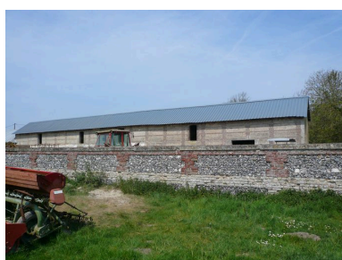
Vue sur le mur intérieur de la cour.