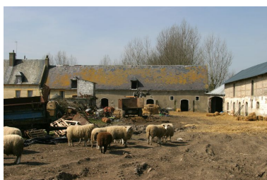
Vue sur l'angle nord-ouest de l'ensemble depuis l'intérieur de la cour.