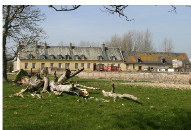
Vue du logis.