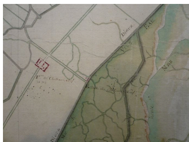
Extrait d'une carte du 18e siècle présentant la ferme et ses terres.