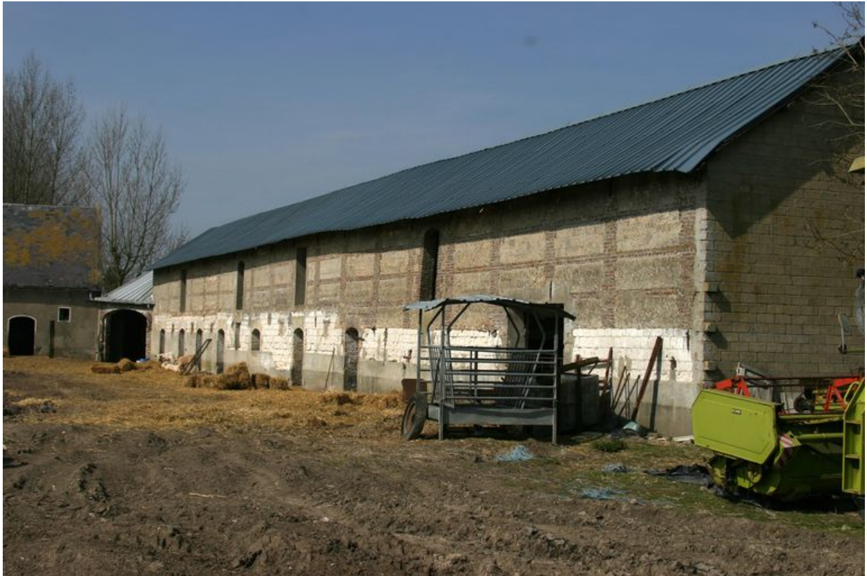
Vue sur l'étable nord depuis l'entrée principale à l'est.