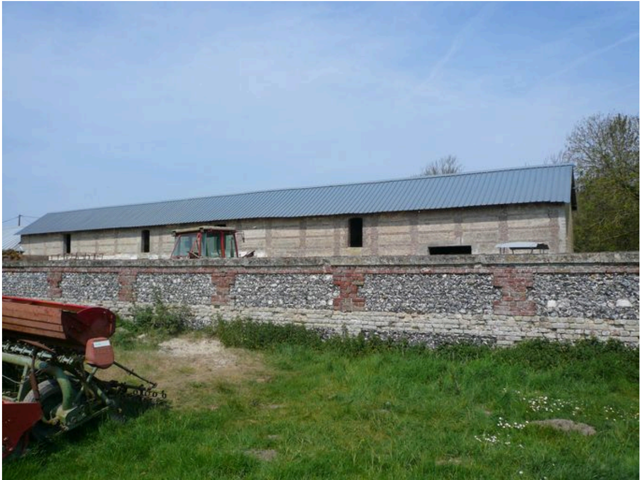
Vue sur le mur intérieur de la cour.