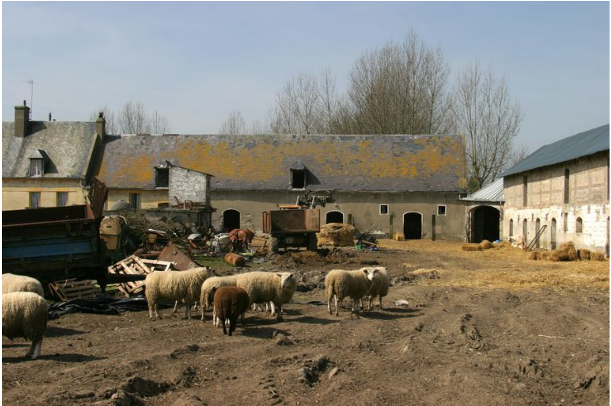
Vue sur l'angle nord-ouest de l'ensemble depuis l'intérieur de la cour.