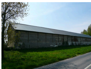
Vue sur la face nord de l'étable nord.