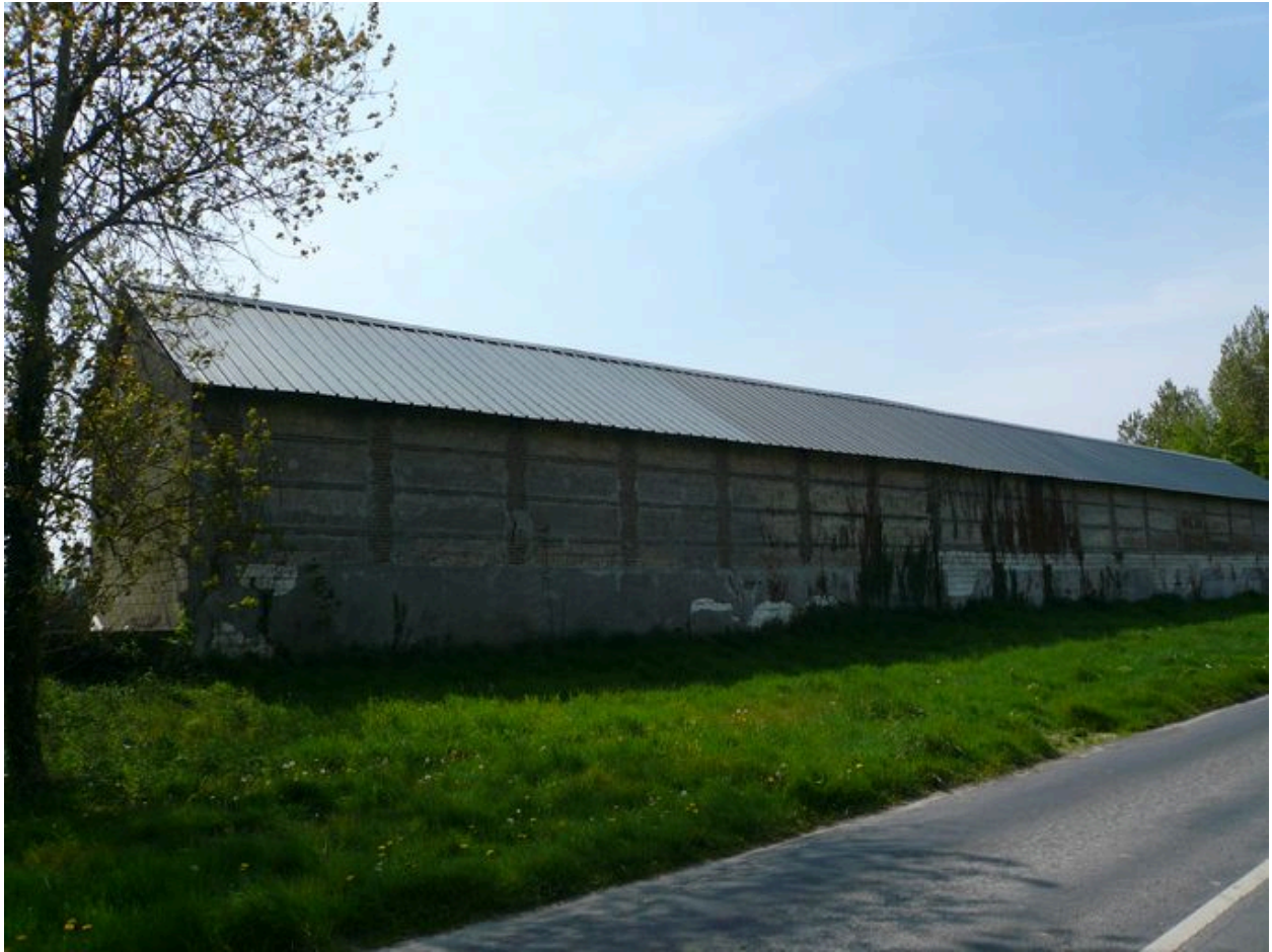
Vue sur la face nord de l'étable nord.