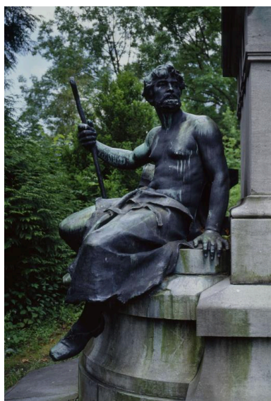
Vue de la figure représentant le Travail, placée sur le côté gauche du monument.

IVR22_19940200552XA