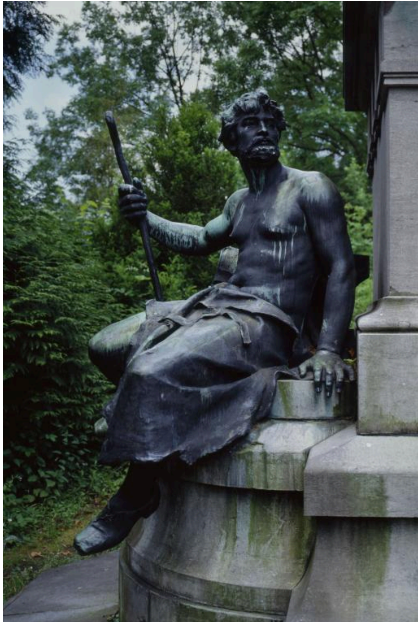
Vue de la figure représentant le Travail, placée sur le côté gauche du monument.