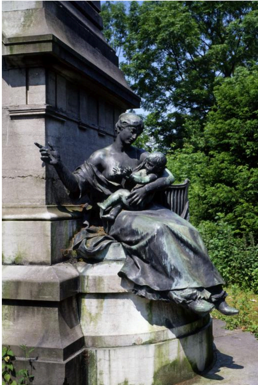
Vue de la figure représentant la Famille, placée sur le côté droit du monument.