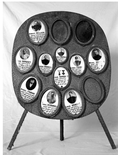
Tableau commémoratif des morts de la première guerre mondiale : plaque en fonte avec médaillons émaillés portant le nom et la photographie des soldats défunts.