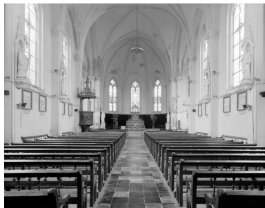
Vue intérieure, vers le chœur. IVR22_19988001768V