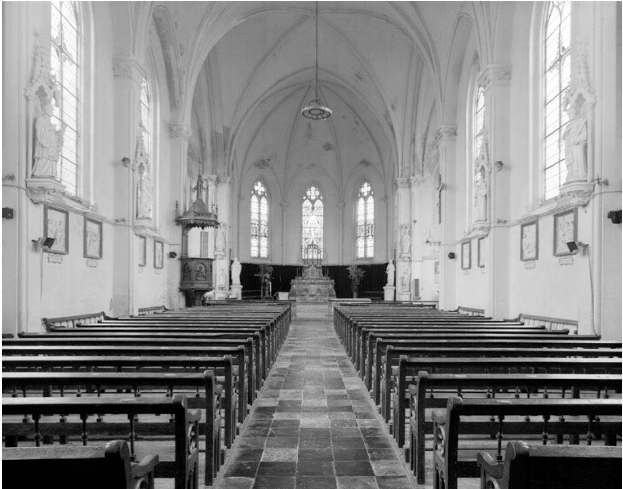
Vue intérieure, vers le chœur.