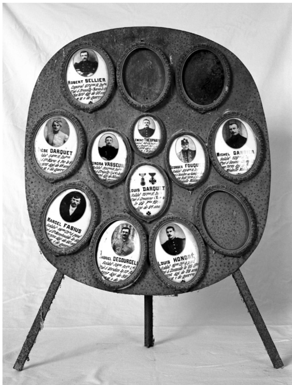
Tableau commémoratif des morts de la première guerre mondiale : plaque en fonte avec médaillons émaillés portant le nom et la photographie des soldats défunts.