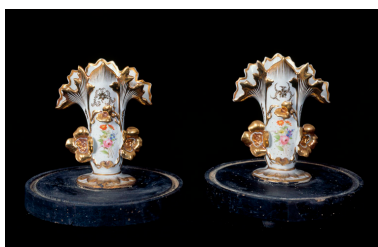
Paire de vases d'autel.