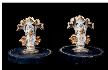
Paire de vases d'autel.