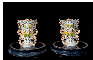
Paire de vases d'autel.