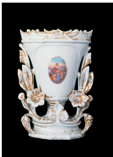
Vase avec médaillon ovale : Sainte Famille, d'après "La Belle Jardinière" de Raphaël (Louvre).