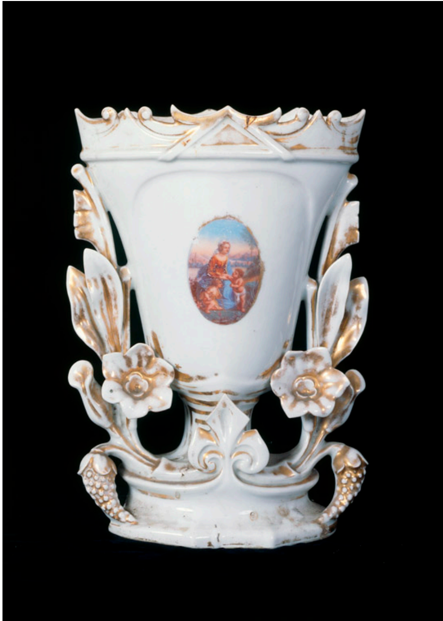
Vase avec médaillon ovale : Sainte Famille, d'après "La Belle Jardinière" de Raphaël (Louvre).