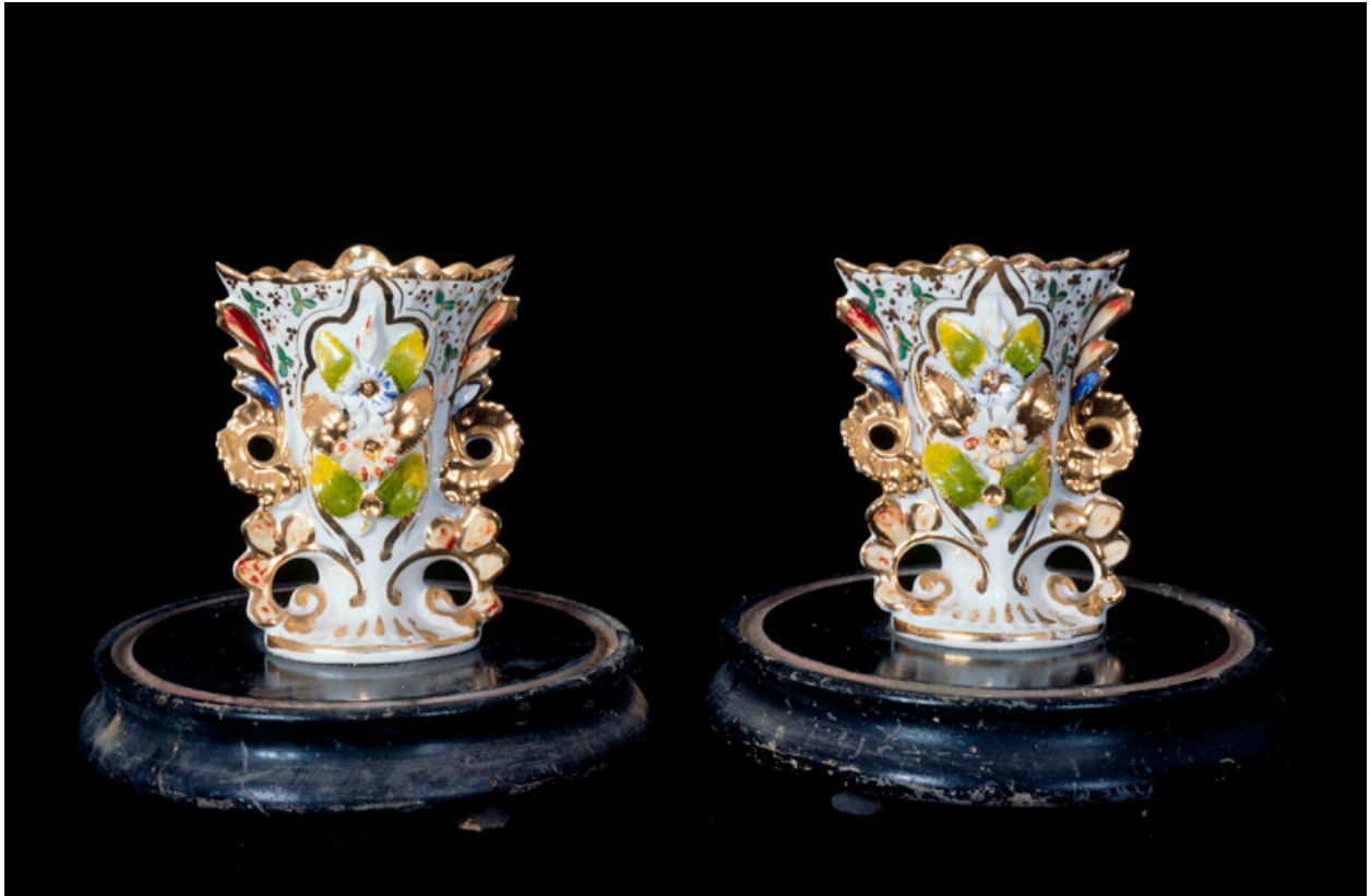
Paire de vases d'autel.