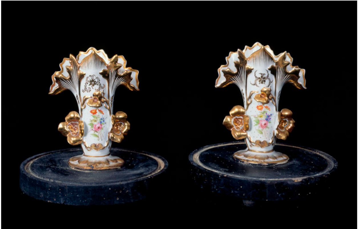
Paire de vases d'autel.