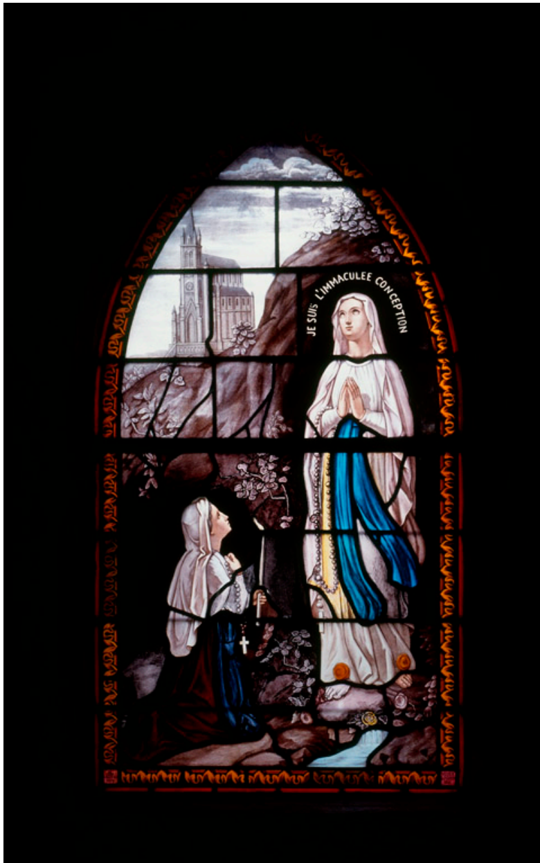
Verrière : Apparition de la Vierge de Lourdes, atelier Bazin, 1878.