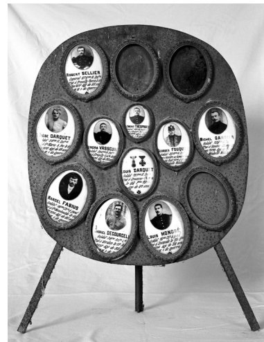
Tableau commémoratif des morts de la première guerre mondiale : plaque en fonte avec médaillons émaillés portant le nom et la photographie des soldats défunts. IVR22_19988001714X