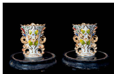
Paire de vases d'autel. IVR22_19998000071XA