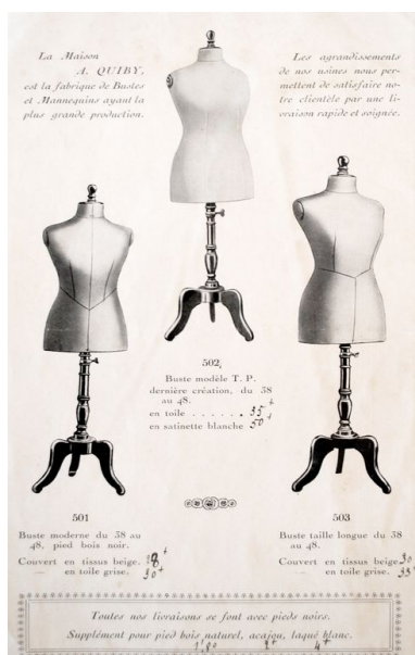
Extrait du catalogue de l'entreprise Quiby : bustes de femmes, sans date (collection particulière).