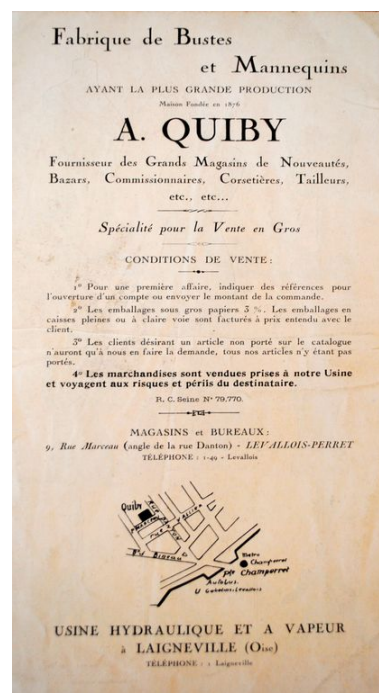
Page du catalogue de l'entreprise Quiby, sans date (collection particulière). IVR22_20106003120NUCAB