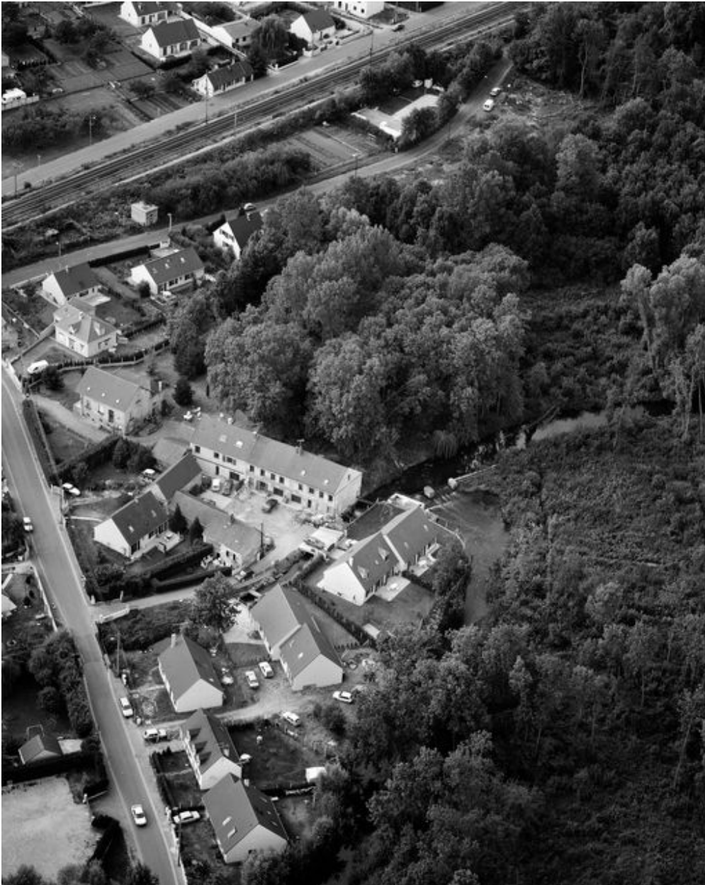
Vue aérienne du site de l'ancien moulin de la Commanderie, vers le nord-ouest, 1993.