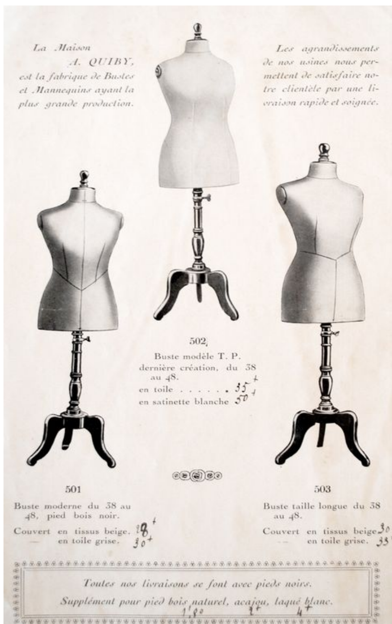
Extrait du catalogue de l'entreprise Quiby : bustes de femmes, sans date (collection particulière).