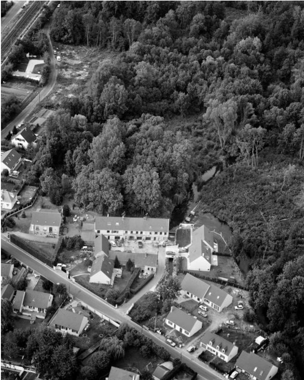
Vue aérienne du site de l'ancien moulin de la Commanderie prise vers le nord, 1993.