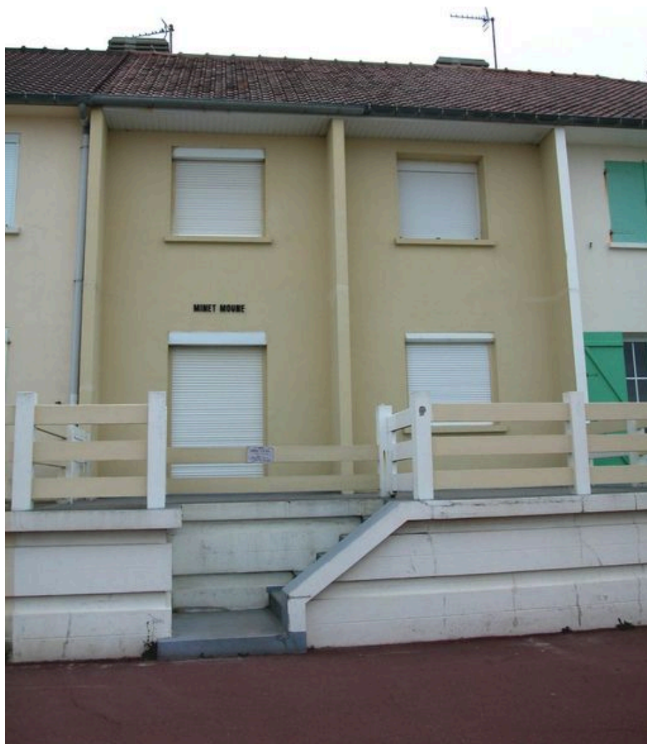
Détail d'une unité, façade antérieure.