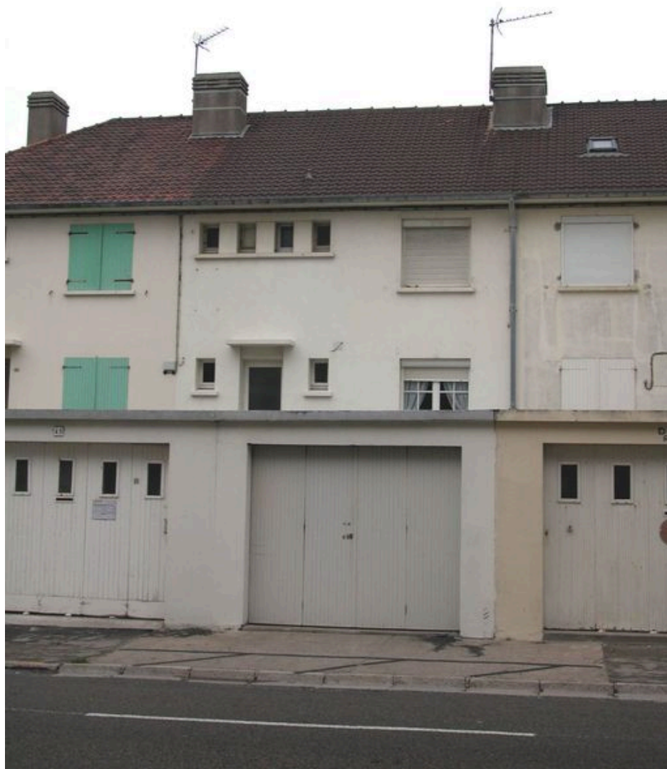
Détail d'une unité, façade postérieure.