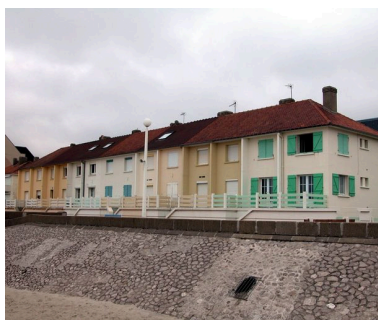
Vue d'ensemble des façades côté mer.