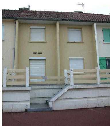
Détail d'une unité, façade antérieure.