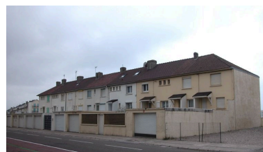
Vue d'ensemble des façades postérieures. IVR22_20058003266NUCA