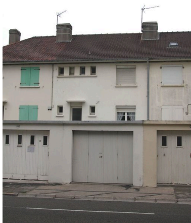
Détail d'une unité, façade postérieure. IVR22_20058003267NUCA