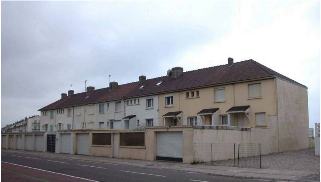
Vue d'ensemble des façades postérieures.