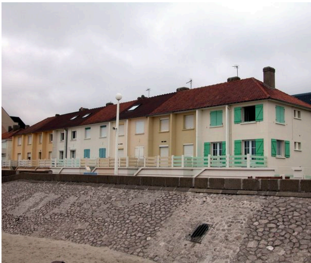
Vue d'ensemble des façades côté mer.