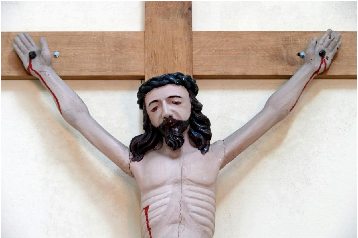
Vue du Christ, à mi-corps.