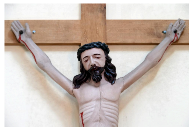
Vue du Christ, à mi-corps. IVR32_20215900329NUCA