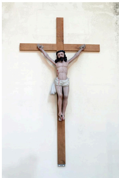
Vue générale de l'œuvre. IVR32_20215900327NUCA