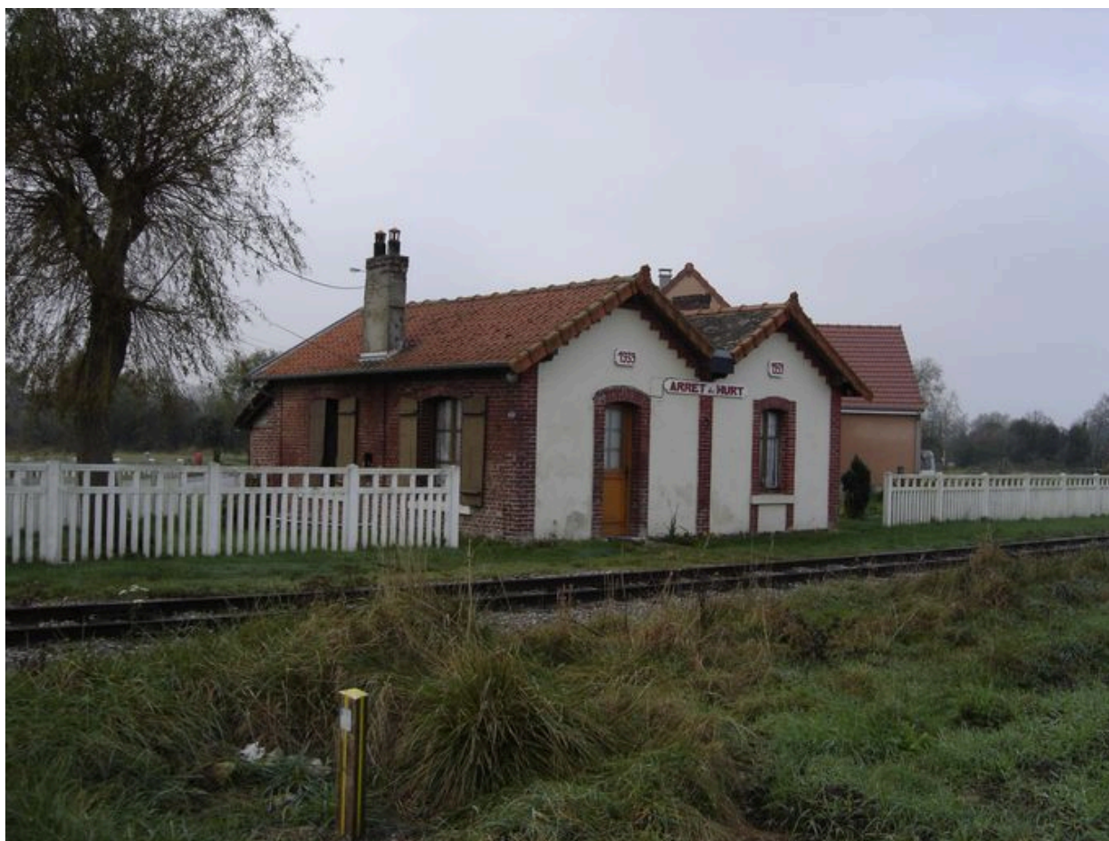
Halte de Hurt.