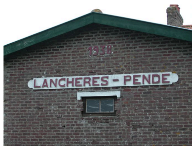
Détail porté sur le bâtiment principal de la gare de Lanchères.