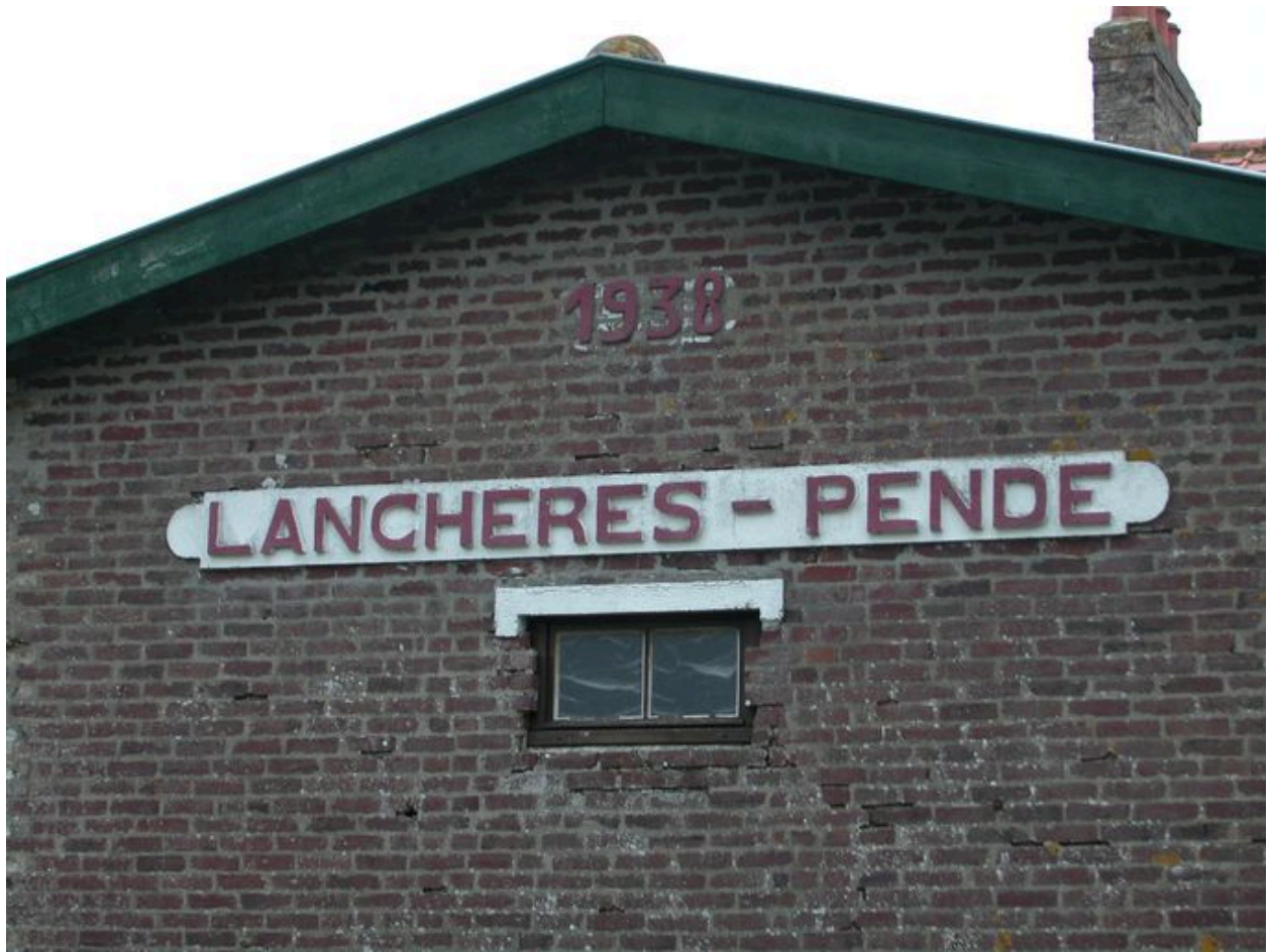
Détail porté sur le bâtiment principal de la gare de Lanchères.