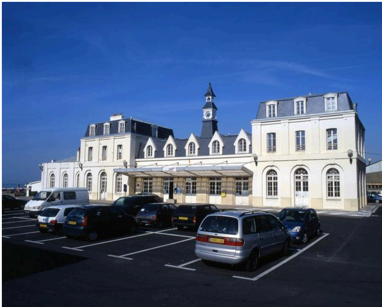
La gare de Le Tréport Mers, vue du côté de l'arrivée.