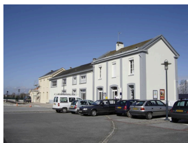
La gare de Noyelles-sur-Mer.