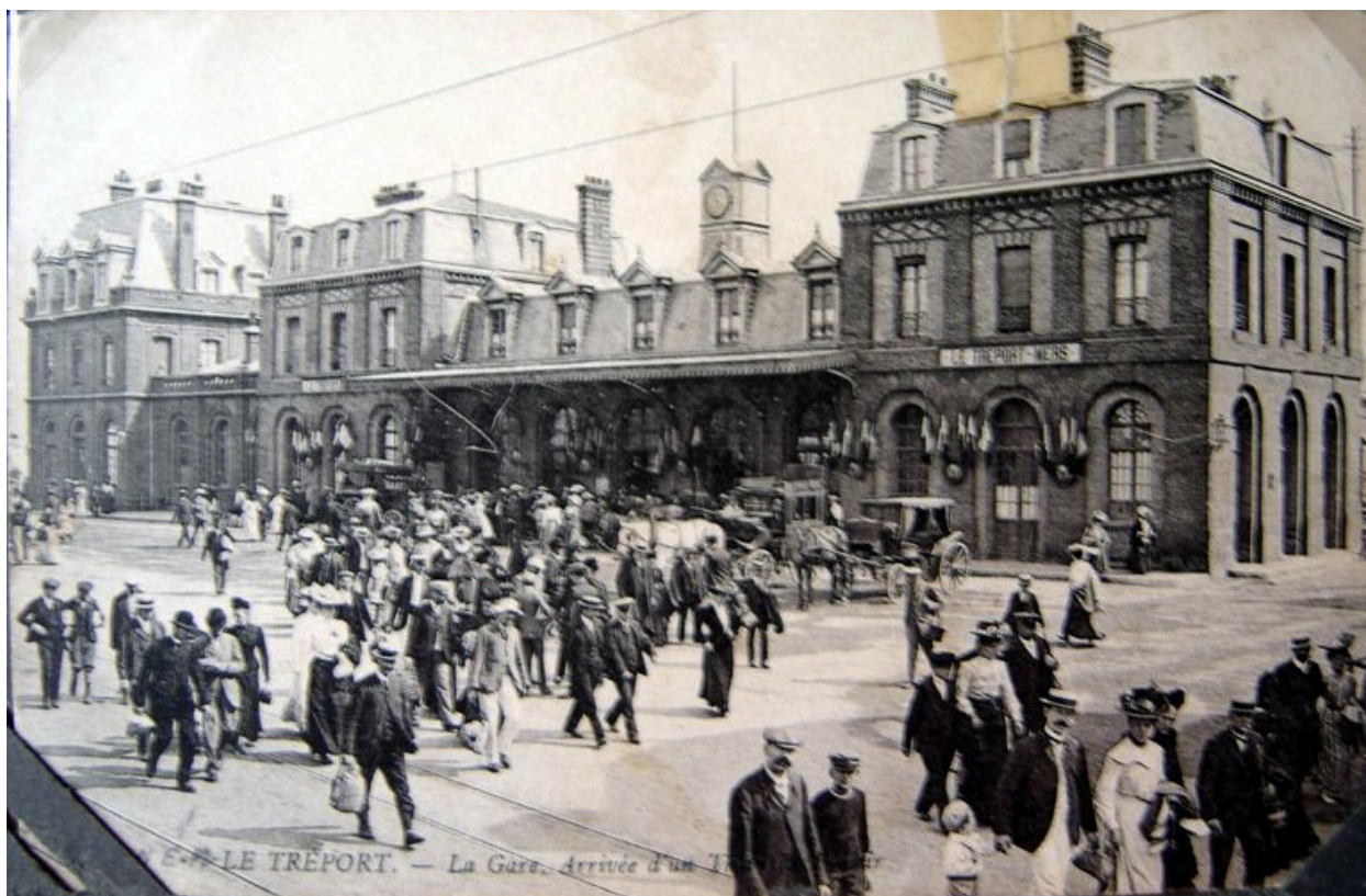
La gare Le Tréport Mers, carte postale, 1er quart 20e siècle (coll. part.).