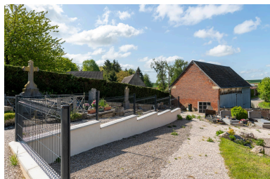
Vue générale du côté est du cimetière depuis l'entrée nord. IVR32_20236000607NUCA