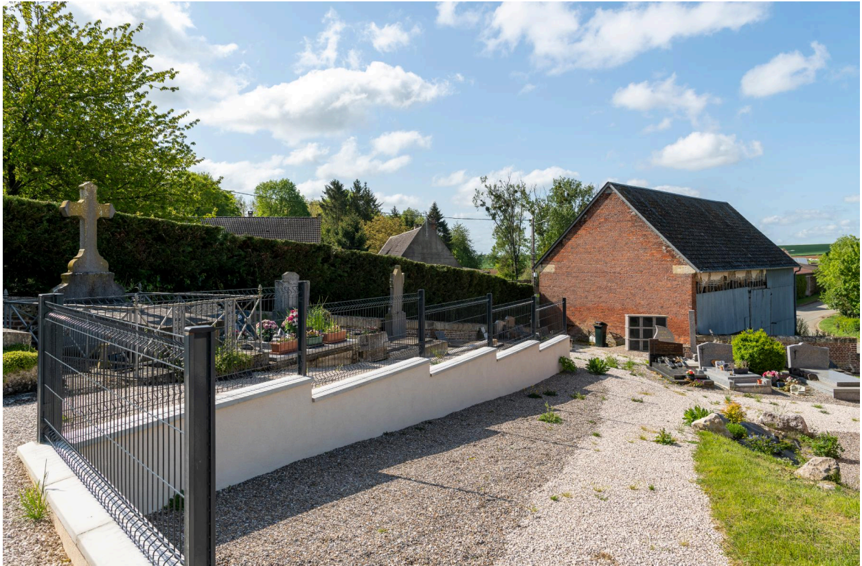
Vue générale du côté est du cimetière depuis l'entrée nord.