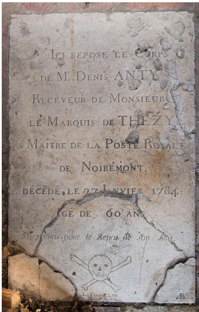
Plaque funéraire de Denis Anty, receveur des postes, par L. Tourillon, chapelle Sainte-Reine.