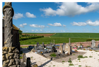
Vue générale depuis l'entrée nord du cimetière.