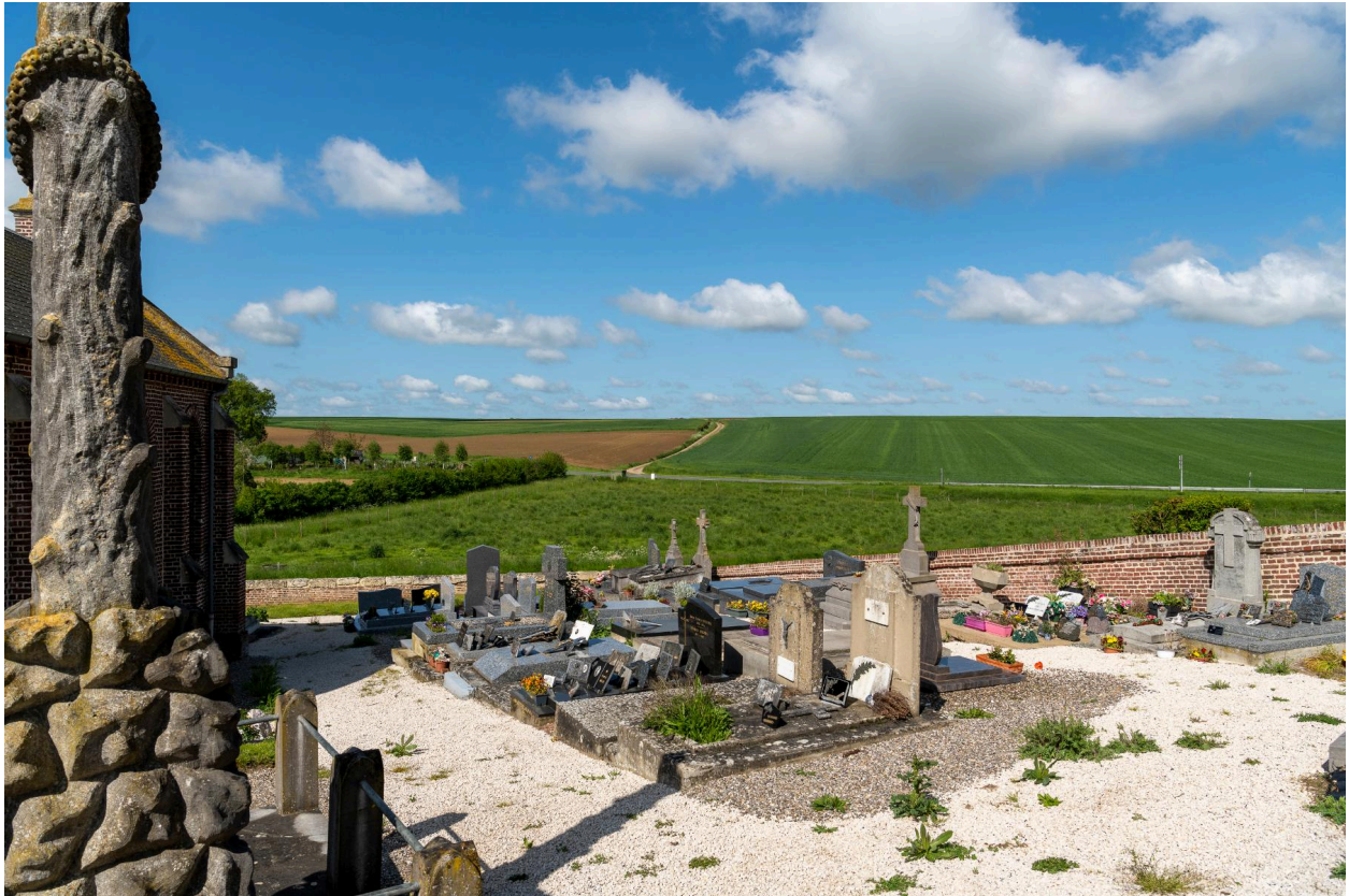
Vue générale depuis l'entrée nord du cimetière.