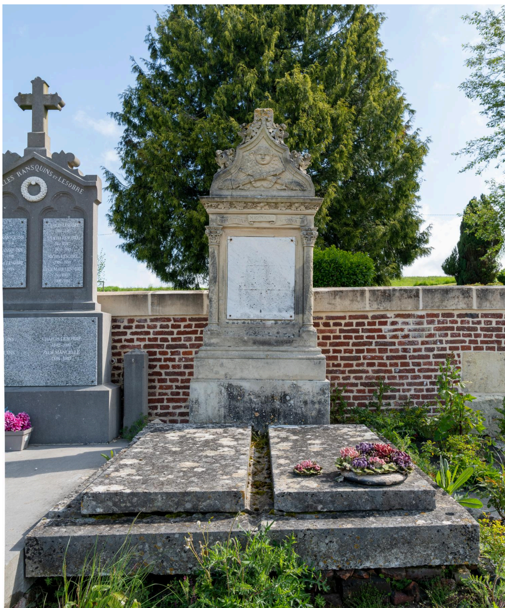
Tombeau de la famille Mesnard, signé Rousselle à Maulers.