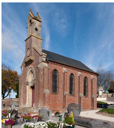
Vue générale de la chapelle Sainte-Reine depuis le sud-ouest. IVR32_20226001183NUCA