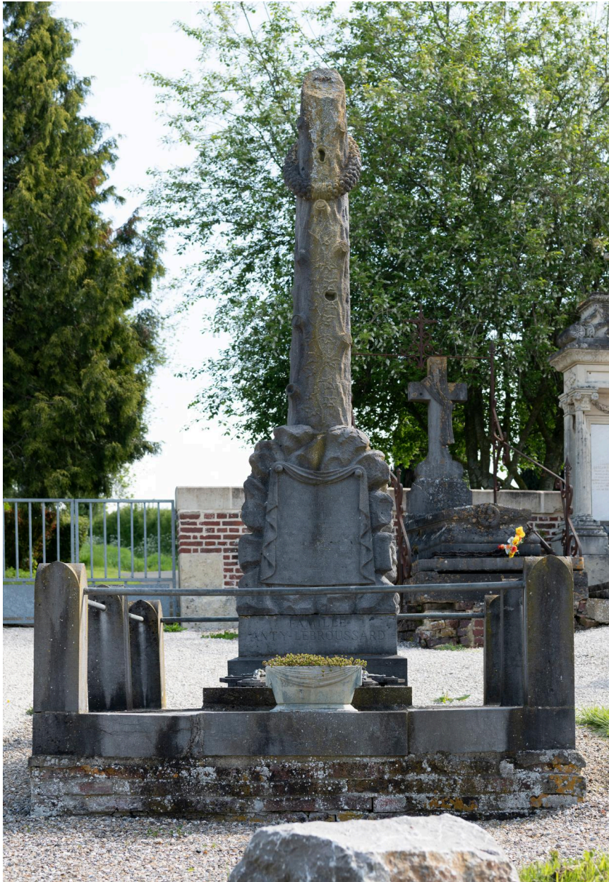
Tombeau de la famille Anty-Lebroussard.