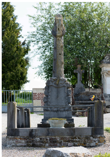
Tombeau de la famille Anty-Lebroussard.