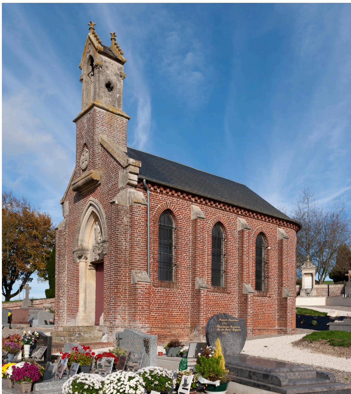
Vue générale de la chapelle Sainte-Reine depuis le sud-ouest.