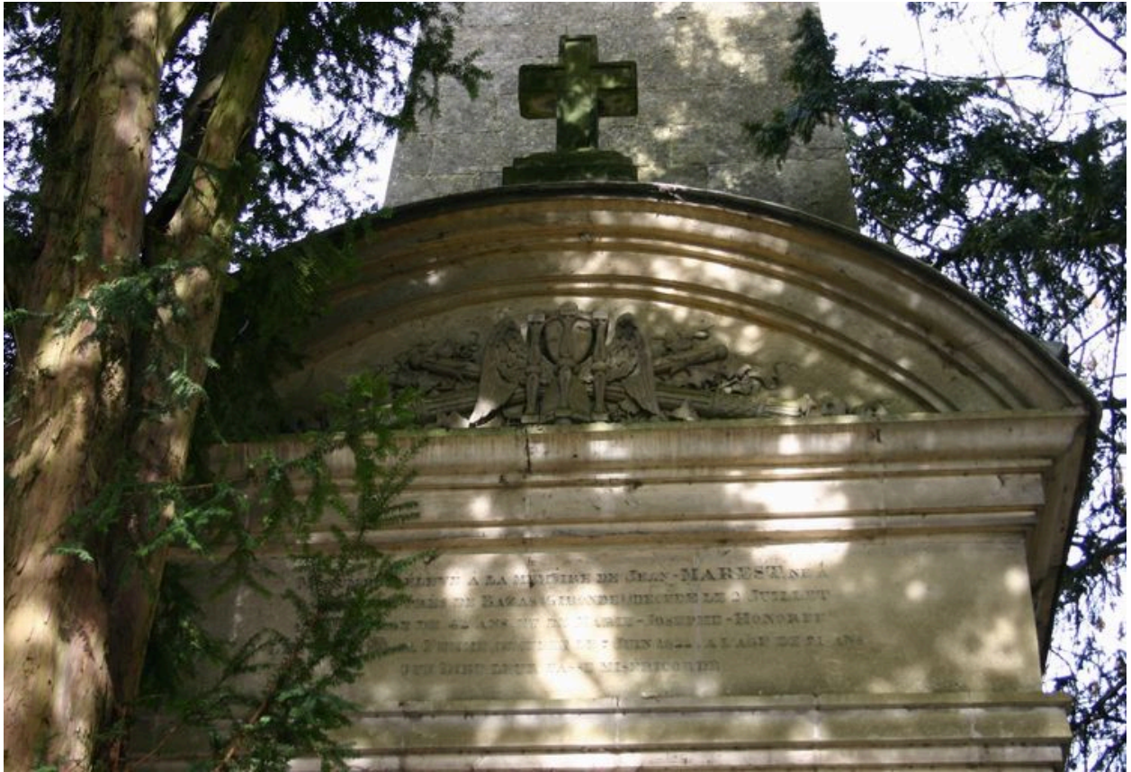
Façade antérieure : détail du fronton sculpté en demi-cintre.