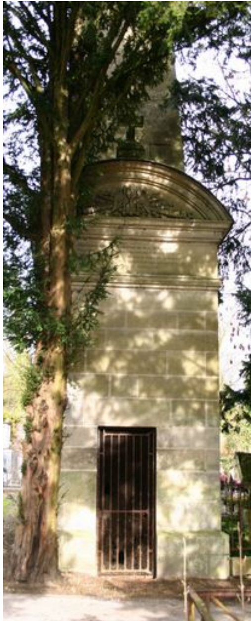
Vue de la façade antérieure.