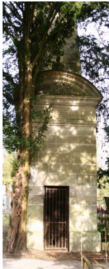
Vue de la façade antérieure.

Phot. Caroline Vincent IVR22_20078000614NUCA