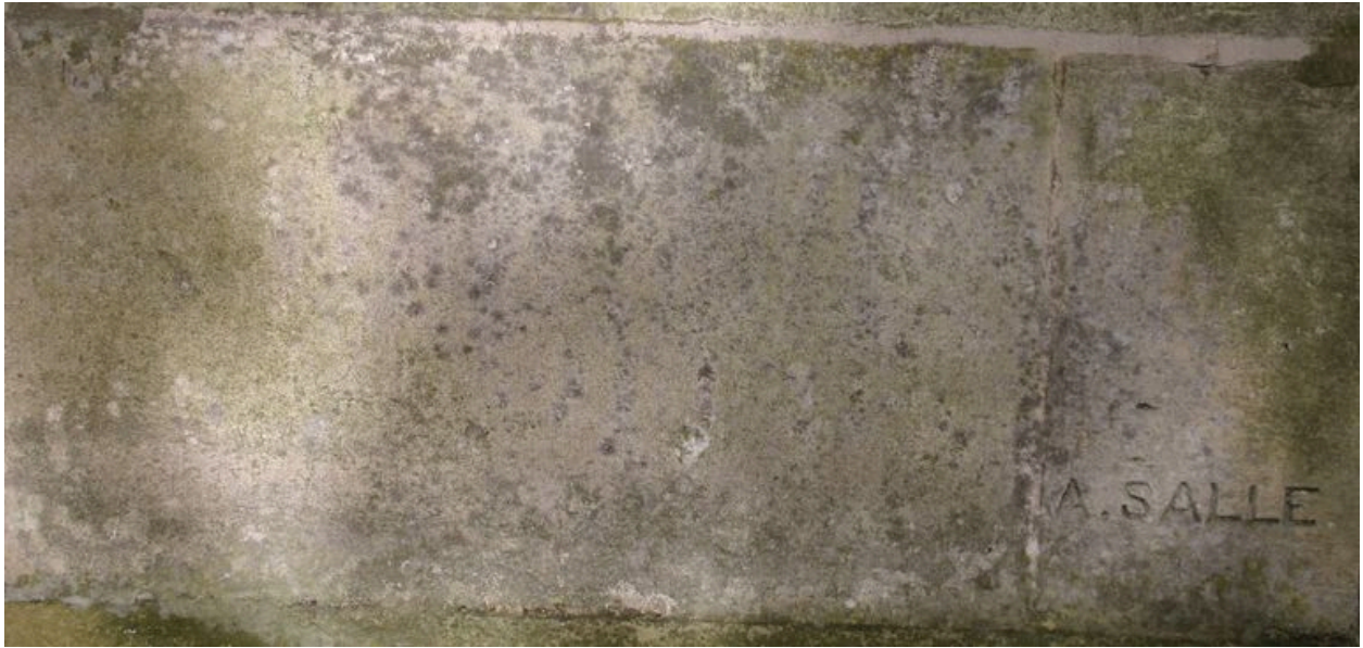
Façade antérieure : détail de la signature de l'entrepreneur A. Sallé.