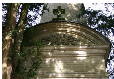
Façade antérieure : détail du fronton sculpté en demi-cintre.

IVR22_20078000616NUCA