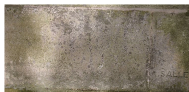
Façade antérieure : détail de la signature de l'entrepreneur A. Sallé.

IVR22_20078000618NUCA