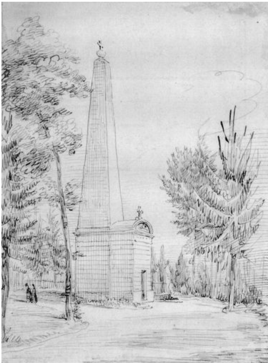
L'obélisque funéraire de M. Marest, architecte, au cimetière de la Madeleine, dessin des Duthoit, vers 1850 (Musée de Picardie, Amiens ; MP Duthoit VI-88).