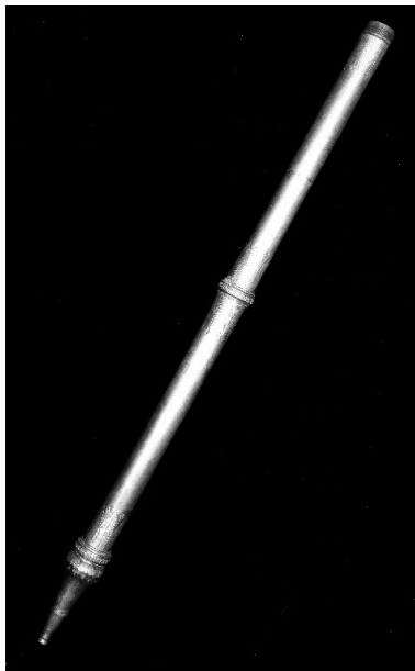
Vue d'ensemble, debout.