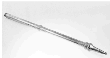
Vue d'ensemble, allongé.