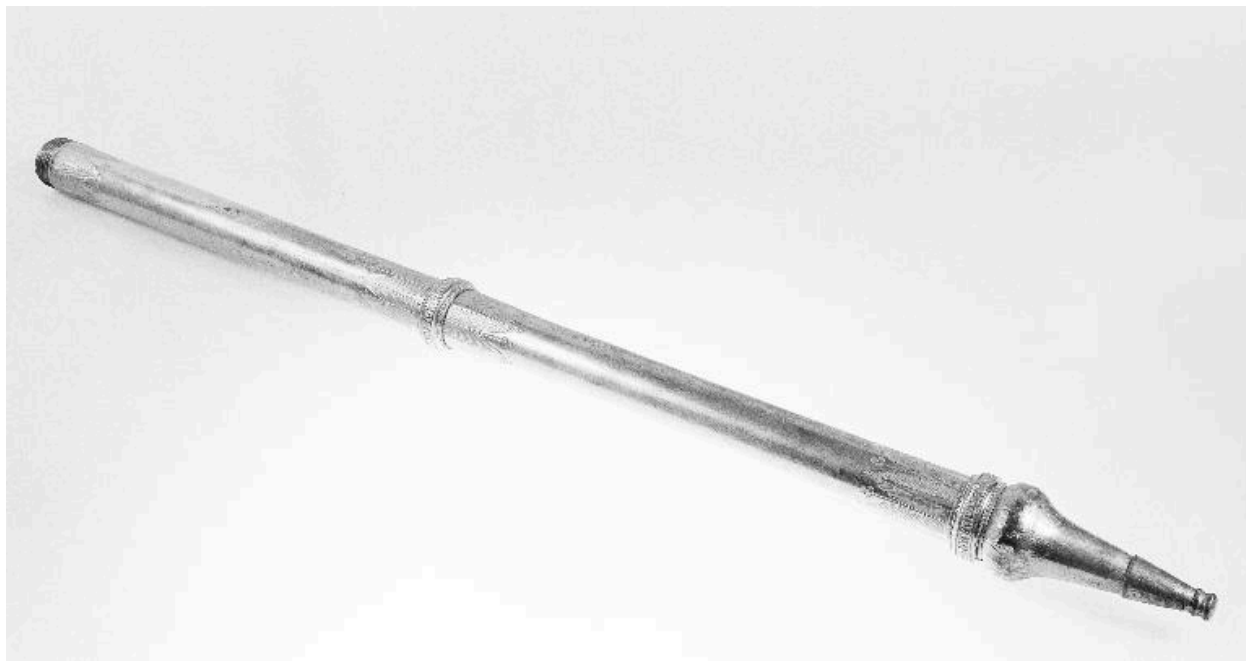
Vue d'ensemble, allongé.